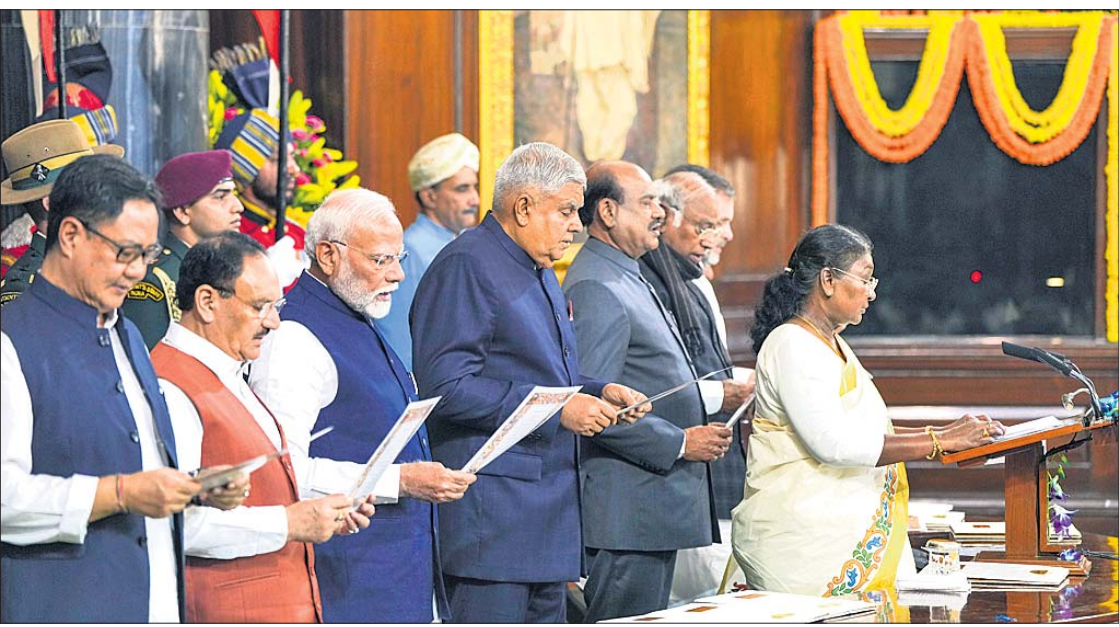
ପାର୍ଲମେଣ୍ଟର ସେଣ୍ଟ୍ରାଲ ହଲରେ ମଙ୍ଗଳବାର ସମିଧାନ ବିବେଚନା ପାଇଁ ଅବସରରେ ରାଷ୍ଟ୍ରପତି ଦ୍ରୌପଦୀ ମୁର୍ମୁ, ଉପରାଷ୍ଟ୍ରପତି ଜଗଦୀପ୍ କୁମାର, ପ୍ରଧାନମନ୍ତ୍ରୀ ନରେନ୍ଦ୍ର ମୋଦି, ଲୋକ ସଭା ବାଚସ୍ପତି ଓମ୍ ବିଲା, ରାଜ୍ୟ ସଭାରେ ବିରୋଧୀ ଦଳ ନେତା ମଲ୍ଲିକାର୍ଜୁନ ଖାରଣ୍ଡେ ଓ ଲୋକ ସଭାରେ ବିରୋଧୀ ଦଳ ନେତା ରାହୁଲ ଘାଠ୍ଟା, କେନ୍ଦ୍ର ମନ୍ତ୍ରୀ ଡି.ପି. ନନ୍ଦା ଏବଂ କିରେନ୍ ରିଜ୍ଜୁ ସମିଧାନର ମୁଖ୍ୟବନ୍ଧ ପାଠ କରୁଛନ୍ତି

ଅଭିନେତା କାର୍ତ୍ତିକ ଆର୍ଯ୍ୟଙ୍କ 'ଭୁଲ୍ ଭୁଲେୟା ଣ' ଚଳଚ୍ଚିତ୍ର ବିଶ୍ୱବ୍ୟାପୀ ୪୦୮.୫୨ କୋଟି ବକ୍ସର ରୋଜଗାର କରିସାରିଛି