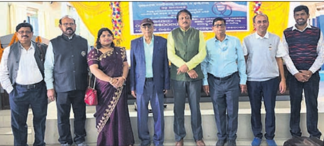
ଶିବିରରେ... ଶିବିରରେ... ଶିବିରରେ...