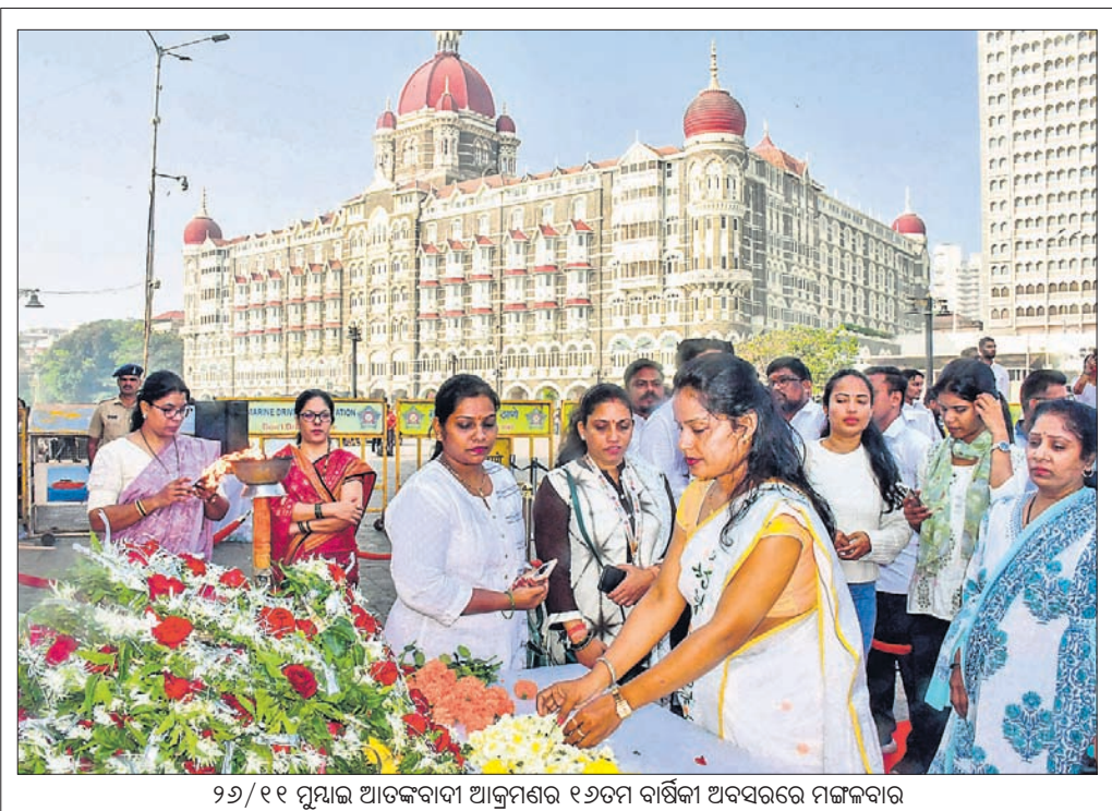
୨୭/୧୧ ମୁସଲ ଆତକବାଦୀ ଆକ୍ରମଣର ୧୭ତମ ବାର୍ଷିକୀ ଅବସରରେ ମଙ୍ଗଳବାର ଚାକମହଲ ପ୍ୟାଲେସ୍‌ରେ ହୋତେଲ ସମ୍ମୁଖରେ ଜନସାଧାରଣ ଶହାଦାନକୁ ଶ୍ରଦ୍ଧାଞ୍ଜଳି ଅର୍ପଣ କରୁଛନ୍ତି।