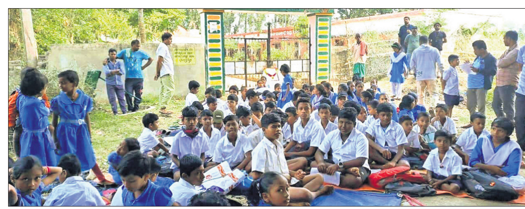
ଅଭାବ ଛାତ୍ରାଛାତ୍ର... ଅଭାବ ଛାତ୍ରାଛାତ୍ର... ଅଭାବ ଛାତ୍ରାଛାତ୍ର...