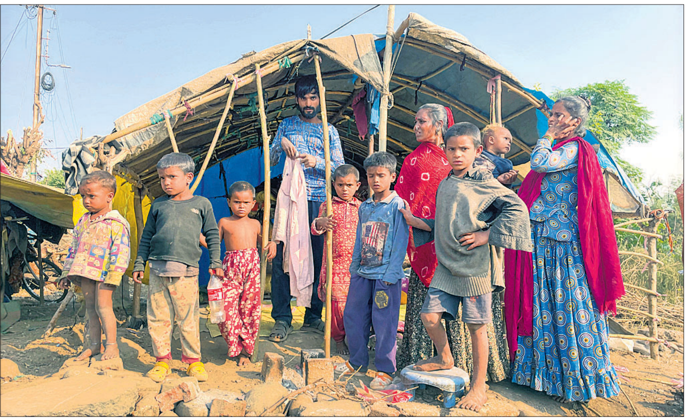
ଜମ୍ମୁରୁ ଏକ ବସତିରେ ରୋହିଣ୍ୟା ଶରଣାର୍ଥୀ।