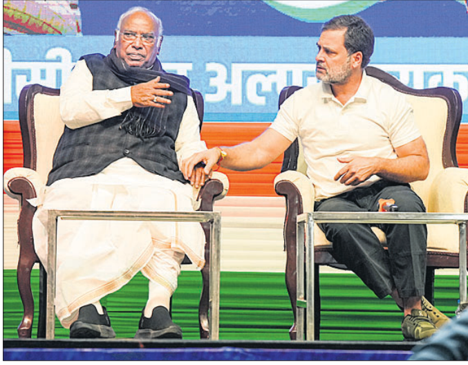
ସମ୍ପିଧାନ ରକ୍ଷକ ଅଭିଯାନର ଶୁଭାରମ୍ଭ ବେଳେ ମଲିକାର୍ଜୁନ ଖାର୍ଗେ ସହ ରାଜ୍ୟ ସଭା ସଭାପତି ବି.ଆର୍. କାଢ଼ିବା ଏବଂ ପ୍ରଧାନମନ୍ତ୍ରୀ ନରେନ୍ଦ୍ର ମୋଦିଙ୍କ ମଧ୍ୟରେ ଆଲୋଚନା ହେଉଛି।