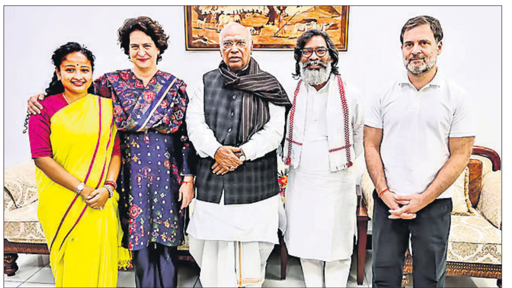
ଝାଡ଼ଖଣ୍ଡ ମୁଖ୍ୟମନ୍ତ୍ରୀ ଭାବେ ସୁରୁତାର ଶପଥ ନେବାକୁ ଯାଉଥିବା ହେମନ୍ତ ସୋରେନ୍ ଏବଂ ସ୍ତ୍ରୀ ତଥା ଜେଏମ୍‌ଏମ୍ ନେତ୍ରୀ କଳ୍ପନା ସୋରେନ୍ ମଙ୍ଗଳବାର ନୂଆଦିଲ୍ଲୀରେ ଲୋକ ସଭାର ବିରୋଧୀ ଦଳ ନେତା ରାହୁଲ ଗାନ୍ଧୀ, କଂଗ୍ରେସ ଅଧ୍ୟକ୍ଷ ମଲ୍ଲିକାର୍ଜୁନ ଖର୍ଚେ ଏବଂ ପ୍ରିୟଙ୍କା ଗାନ୍ଧୀଙ୍କୁ ଭେଟୁଛନ୍ତି।