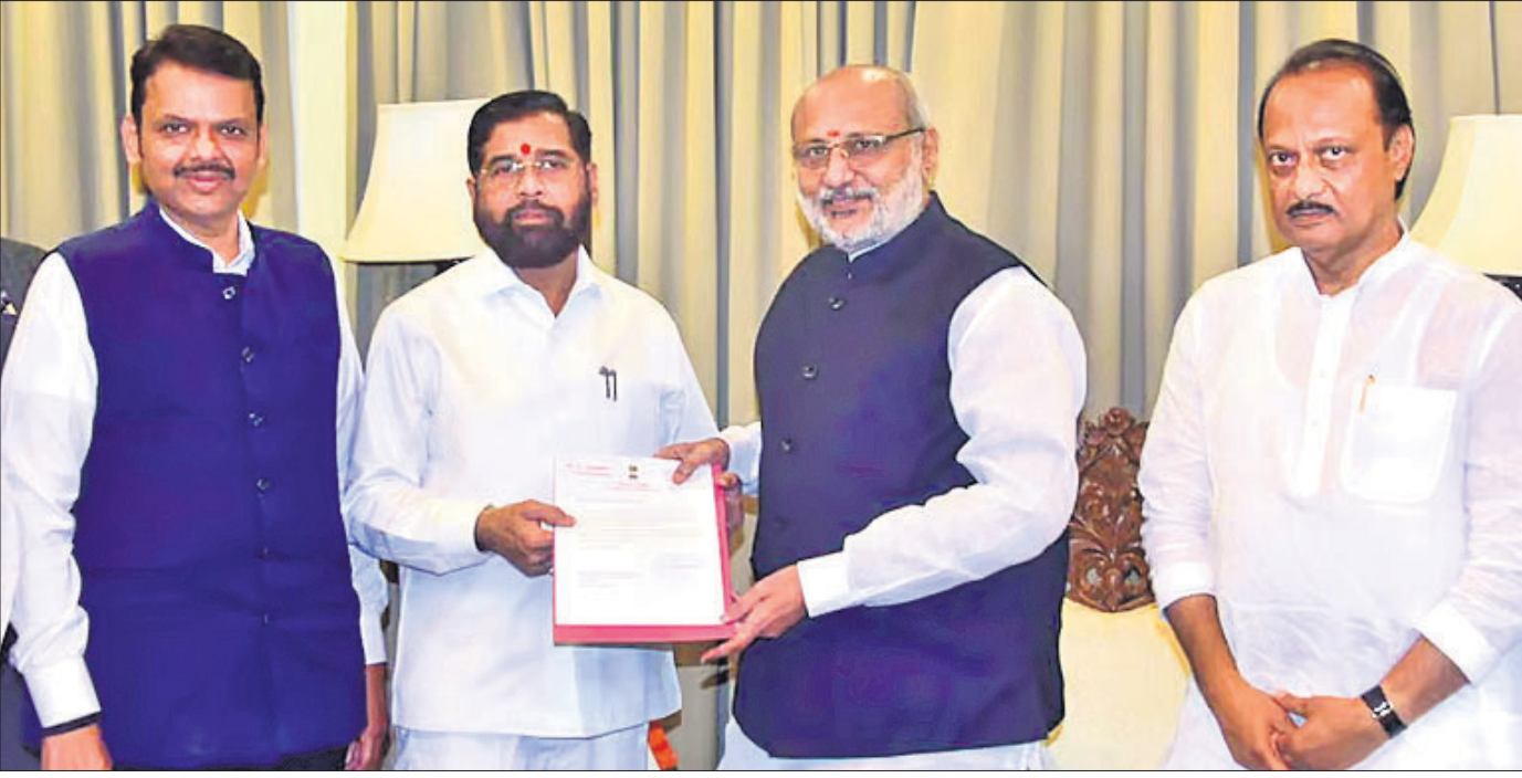
ରାଜ୍ୟପାଳ ସି.ପି. ରାଧାକ୍ରିଷ୍ଣନ ମହାରାଷ୍ଟ୍ର ମୁଖ୍ୟମନ୍ତ୍ରୀ ଏକନାଥ ଶିନ୍ଦେଙ୍କଠାରୁ ଇସ୍ତଫାପତ୍ର ଗ୍ରହଣ କରୁଛନ୍ତି। ନିକଟରେ ଭାଜପା ନେତା ଦେବେନ୍ଦ୍ର ଫଡ଼ନବିସ୍ ଏବଂ ଏନ୍‌ସିପି ନେତା ଅଜିତ ପାଞ୍ଜାର ଉପସ୍ଥିତ ଅଛନ୍ତି।