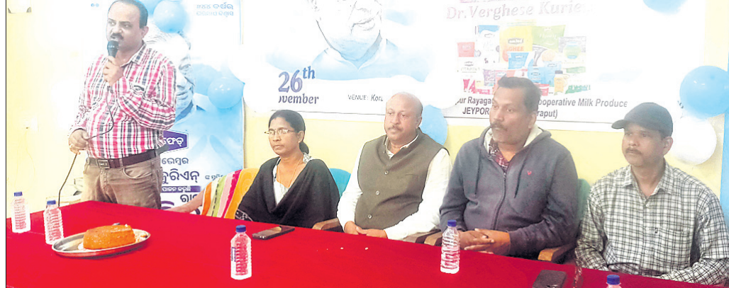
କାର୍ଯ୍ୟକ୍ରମରେ ଉପସ୍ଥିତ ଦୁଗ୍ଧ ଉତ୍ପାଦକ ସଂଘର ସଭ୍ୟ ଓ ଅନ୍ୟମାନେ।