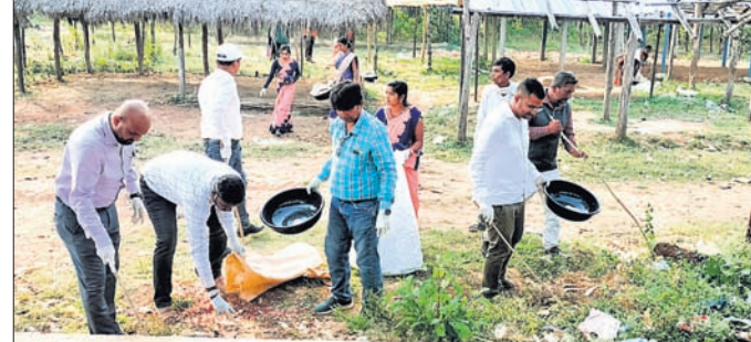
ଅଧିକାରୀମାନେ ଆବର୍ଜନା ସଫା କରୁଛନ୍ତି।