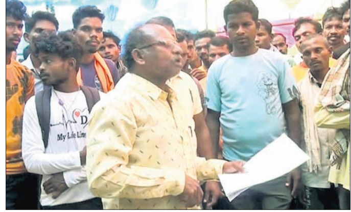
ରାଜସ୍ୱ ନିରୀକ୍ଷକଙ୍କ ନାଁରେ ଲୋକେ ଜିଲ୍ଲାପାଳଙ୍କୁ ଦାବିପତ୍ର ଦେଉଛନ୍ତି।