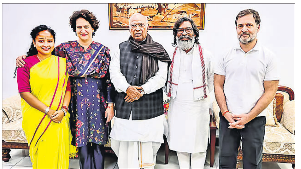
ଝାଡ଼ଖଣ୍ଡ ମୁଖ୍ୟମନ୍ତ୍ରୀ ଭାବେ ସୁକୁମାର ଶପଥ ନେବାକୁ ଯାଉଥିବା ହେମନ୍ତ ସୋରେନ୍ ଏବଂ ସ୍ତ୍ରୀ ତଥା ଜ୍ୟେମ୍‌ଏମ୍ ନେତ୍ରୀ କଳ୍ପନା ସୋରେନ୍ ମଙ୍ଗଳବାର ନୂଆଦିଲ୍ଲୀରେ ଲୋକ ସଭାର ବିରୋଧୀ ଦଳ ନେତା ରାହୁଲ ଗାନ୍ଧୀ, କଂଗ୍ରେସ ଅଧ୍ୟକ୍ଷ ମଲ୍ଲିକାର୍ଜୁନ ଖର୍ଚେ ଏବଂ ପ୍ରିୟଙ୍କା ଗାନ୍ଧୀଙ୍କୁ ଭେଟୁଛନ୍ତି।