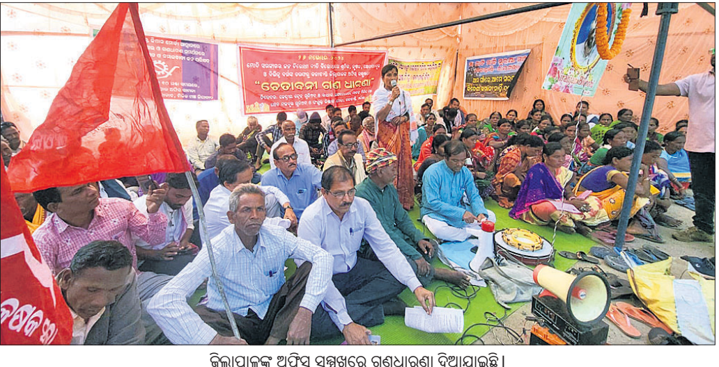
ଜିଲାପାଳଙ୍କ ଅଧିବେଶନରେ ଗଣଧାରଣା ବିଆଯାଇଛି।

କେନ୍ଦ୍ର ସରକାରଙ୍କ ଜନବିରୋଧୀ ନୀତି ବିରୋଧରେ ମଙ୍ଗଳବାର ଭବାନୀପାଟଣା ଜିଲାପାଳଙ୍କ ଅଧିବେଶନରେ ବିଭିନ୍ନ ସଙ୍ଗଠନ ପକ୍ଷରୁ ଗଣଧାରଣା ବିଆଯାଇଛି। କଳାହାଣ୍ଡି ଜିଲା କେନ୍ଦ୍ରୀୟ ଚେତ୍ର ଯୁକ୍ତିଅନ, ସ୍ୱାଧୀନ ଫେଡେରେଶନର ମିଳିତ ମଞ୍ଚ ଓ ସଂଯୁକ୍ତ କିଷାନ ମୋର୍ଚ୍ଚା, ମା' ମାଟି ମାଲି ପୁରୁଷା ମଞ୍ଚ ପକ୍ଷରୁ ୨୬ ଦିନୀ ଦାବିପତ୍ର ରାଷ୍ଟ୍ରପତିଙ୍କ ଉଦ୍ଦେଶ୍ୟରେ ଜିଲାପାଳଙ୍କୁ ପ୍ରଦାନ କରାଯାଇଛି। ଦରବୁକ୍ତି ରୋକିବା, କୃଷିଜାତୀୟ ବ୍ୟବସାୟ ଉପରେ ବିପର୍ଯ୍ୟୟ ପ୍ରତ୍ୟାହାର, ମାଗଣା ଶିକ୍ଷା, ସମସ୍ତ ଆଦିବାସୀ ଓ ଜଙ୍ଗଲ ଅଧିବାସୀଙ୍କୁ ଜଙ୍ଗଲ ଜମିର ଅଧିକାର ପ୍ରଦାନ, ଲଘୁ ବନଜାତ ବ୍ୟବସାୟ ଠିକ୍ ମୂଲ୍ୟ ପ୍ରଦାନ କରିବା ଆଦି ଦାବି କରାଯାଇଛି। ସେହିପରି କଳାହାଣ୍ଡି