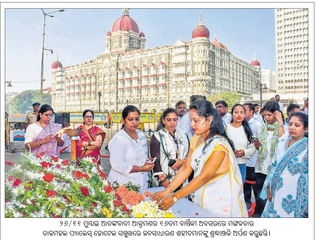
୨୬/୧୧ ମୁଖ୍ୟ ଅତିଥିଙ୍କୁ ଆକ୍ରମଣର ୧୬ତମ ବାର୍ଷିକୀ ଅବସରରେ ମଙ୍ଗଳବାର ଚାକମହଲ ପ୍ୟାଲେସ୍‌ରେ ହୋଟେଲ ସମ୍ମୁଖରେ ଜନସାଧାରଣ ଶହାଦାନଙ୍କୁ ଶ୍ରଦ୍ଧାଞ୍ଜଳି ଅର୍ପଣ କରୁଛନ୍ତି।

ନୂଆଦିଲ୍ଲୀ, ୨୬/୧୧ ବାଂଲାଦେଶରେ ହିନ୍ଦୁ ସହ ଚିନ୍ତୟ କୃଷ୍ଣ ଦାସଙ୍କ ଗିରଫଦାରୀକୁ ନେଇ ବହିର୍ଦ୍ୱାରାଧାର ମନ୍ତ୍ରାଳୟ ପକ୍ଷରୁ ମଙ୍ଗଳବାର ଏକ ବୟାନ ଜାରି କରାଯାଇଛି। ଚିନ୍ତୟ ଦାସଙ୍କୁ ଜାମିନ ନ ମିଳିବାକୁ ନେଇ ବହିର୍ଦ୍ୱାରାଧାର ମନ୍ତ୍ରାଳୟ ପକ୍ଷରୁ ଗଭୀର ତିକ୍ତା ପ୍ରକଟ କରାଯାଇଛି। ହିନ୍ଦୁ ସମେତ ୩ ଜଣ ବ୍ୟକ୍ତିଙ୍କୁ ସମସ୍ତ ବ୍ୟକ୍ତିଙ୍କୁ ଲୋକଙ୍କ ସୁରକ୍ଷାକୁ ସୁନିଶ୍ଚିତ କରିବାକୁ ବାଂଲାଦେଶର ଅନ୍ତରାଳ ସରକାରଙ୍କୁ ଭାରତ ଆଗ୍ରହ କରିଛି। ଏହି ବୟାନରେ କୁହାଯାଇଛି, ହିନ୍ଦୁ ସହ ଚିନ୍ତୟ କୃଷ୍ଣ ଦାସଙ୍କୁ ଗିରଫ କରାଯିବ ଓ ତାଙ୍କୁ ଜାମିନ ନ ମିଳିବା ନିଶ୍ଚିତ ଭାବେ ଦୁର୍ଭାଗ୍ୟଜନକ।