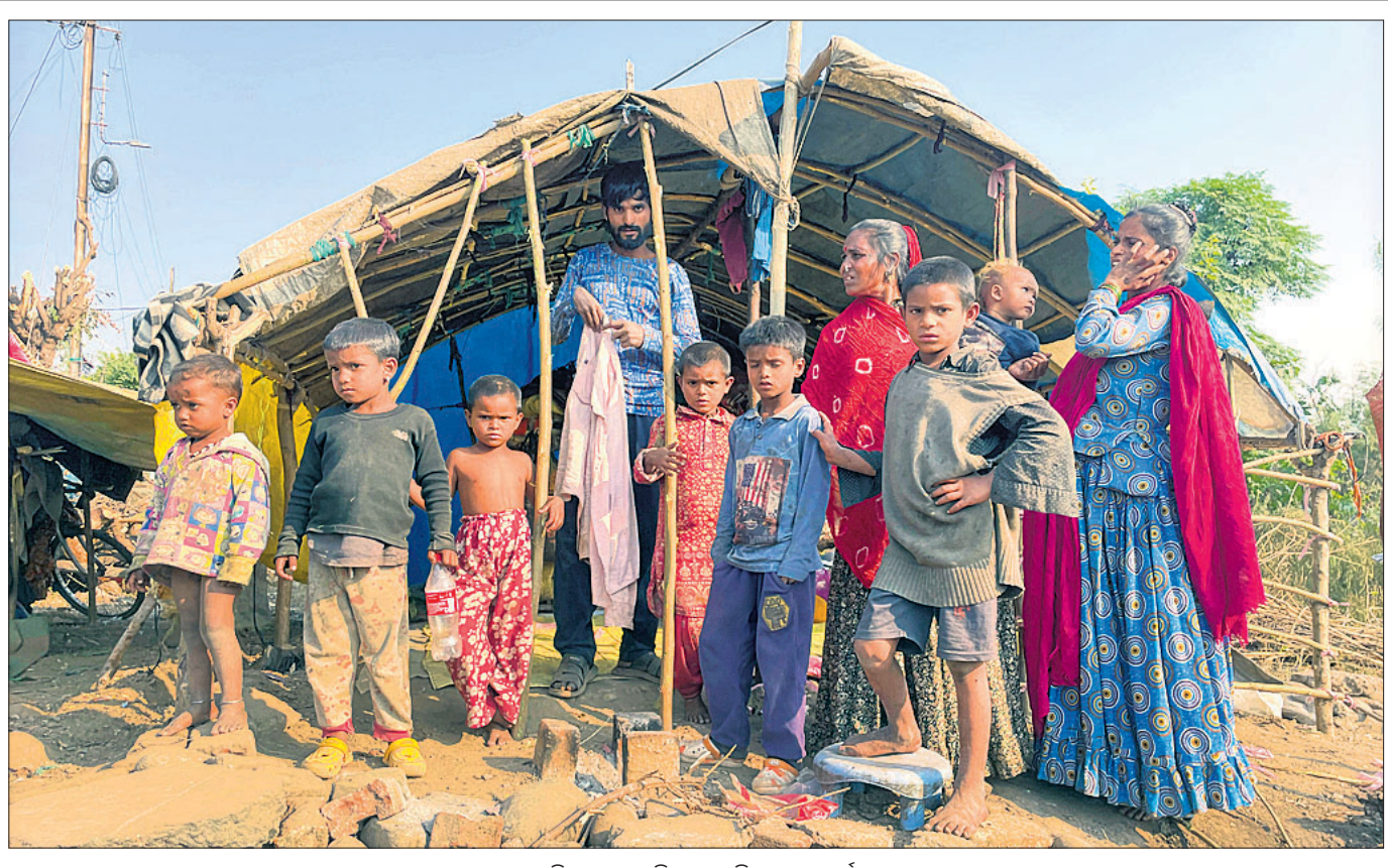
ଜମ୍ମୁରୁଟି ଏକ ବସତିରେ ରୋହିଙ୍ଗା ଶରଣାର୍ଥୀ।