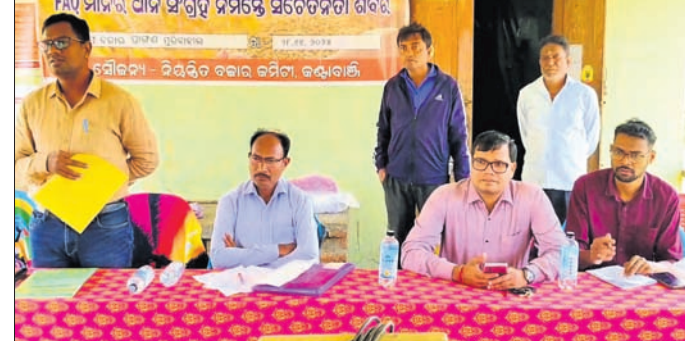
ସଚେତନତା ଶିବିରରେ ଅଭିଧାନ, ଅଧିକାରୀମାନେ।

ପୁରୀବାହାଲ, ୨୮।୧୧ (ଶ୍ରୀବତ୍ସ ବେହେରା) ନଭେମ୍ବର ଆରମ୍ଭରୁ ଅଧିକାଂଶ ଗଣଧାନ ଅପକ୍ତ କରିଦିଆଯିବାବେଳେ ବହୁ ବିଳମ୍ବରେ ପ୍ରଶାସନ ପକ୍ଷରୁ ଧାନ ଜଣାଯିବା ପାଇଁ ପ୍ରସ୍ତୁତି ବ୍ୟବସ୍ଥା କରାଯାଉଥିବା ନେଇ ଶିବିରରେ ପକ୍ଷରୁ ଗୁରୁବାର ଏପୂର୍ବରୁ ମାନବ ଧାନ ସଂଗ୍ରହ ପାଇଁ ସଚେତନତା ଶିବିର ଅନୁଷ୍ଠିତ ହୋଇଯାଇଛି। ଏହାସହ ଧାନକିଣା ସମୟରେ ମଣ୍ଡିରେ ହେଉଥିବା ବିଭିନ୍ନ ଅସୁବିଧା ଏବଂ ମିଳିତାଧିକାର ମନମାନା ବାବଦରେ କେତେକ ଗଣଧାନ ଉପସ୍ଥିତ ଅଧିକାରୀଙ୍କୁ ଅବଗତ କରିଥିଲେ। ମଣ୍ଡି ଧାନ ବିକ୍ରୟ ଆସୁଥିବା ଗଣଧାନୀରେ କିଣାଯିବ ସେନେଇ ସଚେତନ ହୋଇ କୌଣସି ଅସୁବିଧାର ସମ୍ମୁଖୀନ ନହୋଇ ସୁରୁଖୁରୁରେ ବିକ୍ରୟ କରିପାରିବେ ସେନେଇ କଣ୍ଠାବାଣି ଆରମ୍ଭ ସେକ୍ଟରର ନାମାଧାର ଆବାର୍ଯ୍ୟ ଗଣଧାନ ସହ ଆଲୋଚନା କରିଥିଲେ। ଶିବିରରେ ପୁରୀବାହାଲ ବାବଦରେ ଗଣଧାନ ଠିକ୍ ଭାବେ ସୂଚନା ପ୍ରଦାନ କରାଯାଇ ନ ଥିବା କାରଣରୁ କେବଳ କେତେଜଣ ହାତଗଣତ ଗଣଧାନ ଉପସ୍ଥିତ ଥିବା ଦେଖାଯାଇଥିଲା।