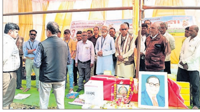
ବିଡିଓ, ତହସିଲଦାର ଆୟୋଜନକାରୀଙ୍କ ସହିତ ଆଲୋଚନା କରୁଛନ୍ତି।