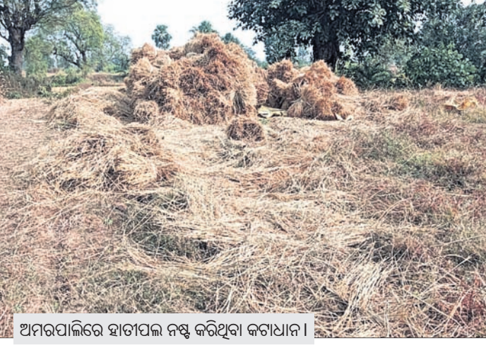
ଅମରପାଳରେ ହାତୀପଲ ନଷ୍ଟ କରିଥିବା କଟାଧାନ।

ଅମରପାଳ, ୨୮.୧୧ (ପାଗାଧର ସାହୁ) ସୁବର୍ଣ୍ଣପୁର ଜିଲ୍ଲା ବାରମହାରାଜପୁର ଛୋଟ ଅଞ୍ଚଳର ଅମରପାଳ ଅଞ୍ଚଳରେ ହାତୀପଲ ବ୍ୟାପକ ଧାନ ଫସଲ ନଷ୍ଟ କରିଥିବା ଅଭିଯୋଗ ହୋଇଛି।