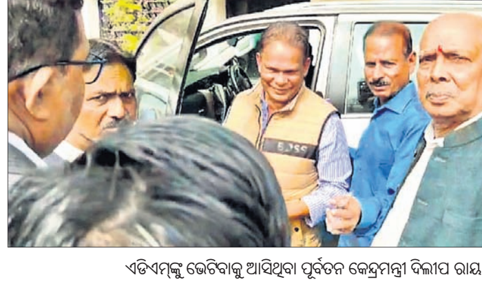
ଏଡିଏଫ୍ କୋର୍ଟରେ ବିଚାରଣ ପୂର୍ବତନ କେନ୍ଦ୍ରମନ୍ତ୍ରୀ ଦିଲ୍ଲୀପ ରାୟ ।