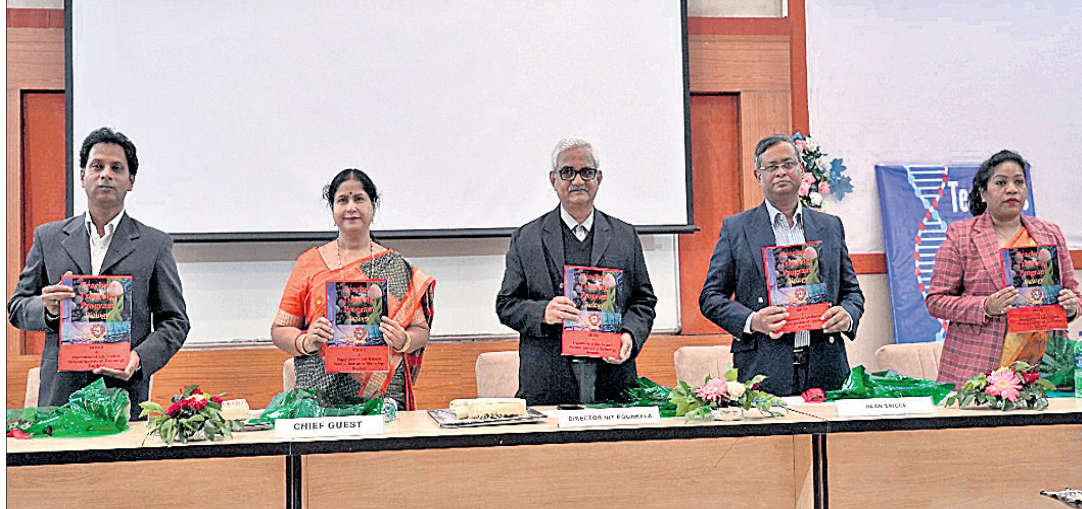
ଏନ୍ଆଇଟିରେ ପ୍ରଶିକ୍ଷଣ କାର୍ଯ୍ୟକ୍ରମରେ ମଞ୍ଚାସନା ଅତିଥିଙ୍କୁ ।

ରାଉରକେଲା, ୨୮।୧୧ (ସଙ୍ଗୀତ ଜେନା) ରାଉରକେଲା ଜାତୀୟ ପ୍ରଯୁକ୍ତି ପ୍ରତିଷ୍ଠାନ (ଏନ୍ଆଇଟି) ପକ୍ଷରୁ ଓଡ଼ିଶା ଉଚ୍ଚ ମାଧ୍ୟମିକ ଶିକ୍ଷା ପରିଷଦ (ସିଏଭିଏଲ୍) ଆୟୋଜିତ ଶିକ୍ଷକ ପ୍ରଶିକ୍ଷଣ କାର୍ଯ୍ୟକ୍ରମ ଆରମ୍ଭ ହୋଇଛି । ଏଥିରେ ୧୫୦ ଜଣ ଶିକ୍ଷକ ଯୋଗ ଦେଇଥିବାବେଳେ ଯୋଗଦେଇଥିବା ଅଧ୍ୟକ୍ଷ ହେଉଛି ନରୋଧର ୨୭୭୭ ୩୦ ଚାରିକ ପର୍ଯ୍ୟନ୍ତ ଜାବଦେଲାନ, ଡିପେଟରି ୨୭୮ ୨୧୩ ଯାଏ ଉପାଧି ବିଜ୍ଞାନ, ଡିପେଟରି ୧୯୭ ୧୩ ଚାରିକ ଯାଏ ପଦାର୍ଥ ବିଜ୍ଞାନ ଉପରେ ପ୍ରଶିକ୍ଷଣ ଦିଆଯିବ । ଗୁରୁବାର ପ୍ରଥମ ପର୍ଯ୍ୟାୟର ୩ୟ ଦିନରେ ଗବେଷଣା, ଶିଳ୍ପ ପରାମର୍ଶ ଓ ନିରୀକ୍ଷଣ ଶିକ୍ଷା (ଏସ୍ଆର୍ ଆଇସିସିଏଲ୍) ପକ୍ଷରୁ ପ୍ରଶିକ୍ଷଣ କାର୍ଯ୍ୟକ୍ରମ ଆରମ୍ଭ ହୋଇଥିଲା । ଏସ୍ଆର୍ ଆଇସିସିଏଲ୍ ଆୟୋଜିତ ଶିକ୍ଷକ ପ୍ରଶିକ୍ଷଣ କାର୍ଯ୍ୟକ୍ରମରେ ଏହି ପ୍ରଶିକ୍ଷଣ