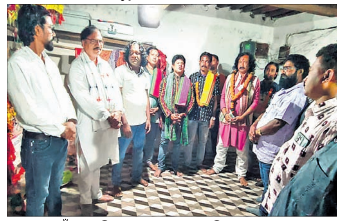
ଧନୁଯାତ୍ରା ପାଇଁ କଂସ ଅଭିନେତାଙ୍କୁ ବରଣ କରାଯାଇଛି।

ଦେଓଗାଁ ବନ୍ଦ ପଡ଼ିଥିବା ବିଜୟାନନ୍ଦ ସମବାୟ ଚିନିକଳ... ଯଜ୍ଞେଶ୍ୱର ଓ ସମବାୟ ବ୍ୟାଙ୍କର ଦୁଇ ଜଣ କର୍ମଚାରୀଙ୍କ ନାଁରେ ଚାର୍ଜପ୍ରେମ ଦାଖଲ କରାଯାଇଛି।