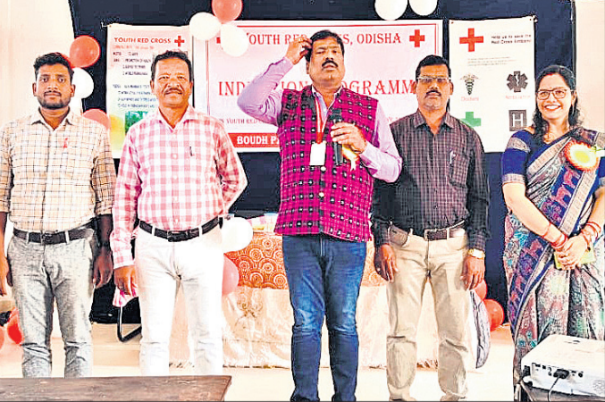
ସୁବ ରେଡ୍‌କ୍ରସ୍ ପକ୍ଷରୁ ଡାଲିମ କାର୍ଯ୍ୟକ୍ରମରେ ଉପସ୍ଥିତ ଅତିଥି।

ବୌଦ୍ଧ, ୨୮.୧୧ (ଅକିତ କୁମାର ବାରିକ) ବୌଦ୍ଧ ପଞ୍ଚାୟତ ମହାବିଦ୍ୟାଳୟରେ ସୁବ ରେଡ୍‌କ୍ରସ୍ ପକ୍ଷରୁ ଚଳାଏକ ଡାଲିମ କାର୍ଯ୍ୟକ୍ରମ ଆରମ୍ଭ ହୋଇଯାଇଛି।