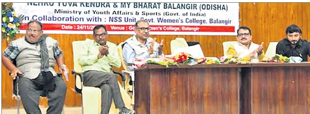
ବଲାଙ୍ଗୀର ମହିଳା ମହାବିଦ୍ୟାଳୟରେ ଆୟୋଜିତ ଜିଲ୍ଲାସ୍ତରୀୟ ଯୁବା ଉତ୍ସବରେ ମଞ୍ଚାସୀନ ଅଭିଧାନୀ

ବଲାଙ୍ଗୀର, ୨୮।୧୧ (ବାରେନ୍ଦ୍ର କୁମାର ଝାଙ୍କର) ବଲାଙ୍ଗୀର ସରକାରୀ ମହିଳା ମହାବିଦ୍ୟାଳୟ ସମ୍ମିଳନୀ କକ୍ଷରେ କରୁଛନ୍ତି ସରକାରୀ ଚାକିରୀ। ବଲାଙ୍ଗୀର ଜିଲ୍ଲାରେ ନକଲି ସାଫ୍ଟିଫିକେଟ୍ ଆରାଙ୍କ ଉପରେ ତଡ଼ାଉ ହେବା ସହ କେତେଜଣ ସରକାରୀ କର୍ମଚାରୀ କେଲ ମଧ୍ୟ ଯାଇଛନ୍ତି। ଉଚ୍ଚ ସମୟରେ ନକଲି ସାଫ୍ଟିଫିକେଟ୍ ଦେଇ ଚାକିରୀ ହାତେଇଥିବା କର୍ମଚାରୀ ମହଲରେ କୋଣ୍ଡୁଆ ଭୟ ସୃଷ୍ଟି ହୋଇଥିବାବେଳେ କିଛି କର୍ମଚାରୀ ଚାକିରି ଛାଡ଼ି ପଳାୟନ କରିଥିବା ନିଜର ମଧ୍ୟ ରହିଛି। ପ୍ରଶାସନ ଲୋକ ଦେଖାଣିଆଁ କିଛି କର୍ମଚାରୀଙ୍କ ବିରୋଧରେ ତଦନ୍ତ କରିବା ସହ ସେମାନଙ୍କୁ କେଲ ପଠାଇଥିବାବେଳେ ବର୍ତ୍ତମାନ ମଧ୍ୟ ବହୁ ନକଲି ସାଫ୍ଟିଫିକେଟ୍ ଆରା ପ୍ରଶାସନିକ ଅଧିକାରୀ ଓ କର୍ମଚାରୀମାନଙ୍କୁ ହାତବନ୍ଧି କରି ଚାକିରୀ କରୁଛନ୍ତି। ସର୍ବତଳା କୁଳରେ ଦୀର୍ଘ ଦିନ ହେବ ନକଲି ସାଫ୍ଟିଫିକେଟ୍ ଦେଇ ବହୁ କର୍ମଚାରୀ ସରକାରୀ ଚାକିରୀ ହାତେଇଥିବା ଦିଆଯାଇଛି। ଗତ ବର୍ଷକ ତଳେ ସର୍ବତଳାଠାରେ ଅବସ୍ଥାପିତ ଶିକ୍ଷା ଅଧିକାରୀଙ୍କ କାର୍ଯ୍ୟାଳୟରେ ନକଲି ସାଫ୍ଟିଫିକେଟ୍ ପାଇଁ ଯାଜ୍ଞ ପ୍ରକ୍ରିୟା ଜୋରଦାର ଚାଲିଥିଲା। କିନ୍ତୁ ଯାଜ୍ଞ ସେଇ ମଧ୍ୟ ଶିକ୍ଷା ବିଭାଗ ତରଫରୁ ପରେ କୌଣସି ଆଖିବୁଜିଆ ପଦକ୍ଷେପ ଗ୍ରହଣ କରାଗଲା ନାହିଁ। ସୂଚନା ଅଧିକାର ଆଇନ ବଳରେ ଫିଲିଥିବା ତଥ୍ୟ ଅନୁସାରେ ବ୍ଲକ୍ ଶିକ୍ଷା ବିଭାଗରେ ନକଲି ସାଫ୍ଟିଫିକେଟ୍ ଆରାମାନେ ଅଧିକାଂସ୍ତ ଚାକିରୀ କରି ଛାଡ଼ିଛନ୍ତି। ଭବିଷ୍ୟତ ସହ ଖେଳ ଖେଳୁଛନ୍ତି।