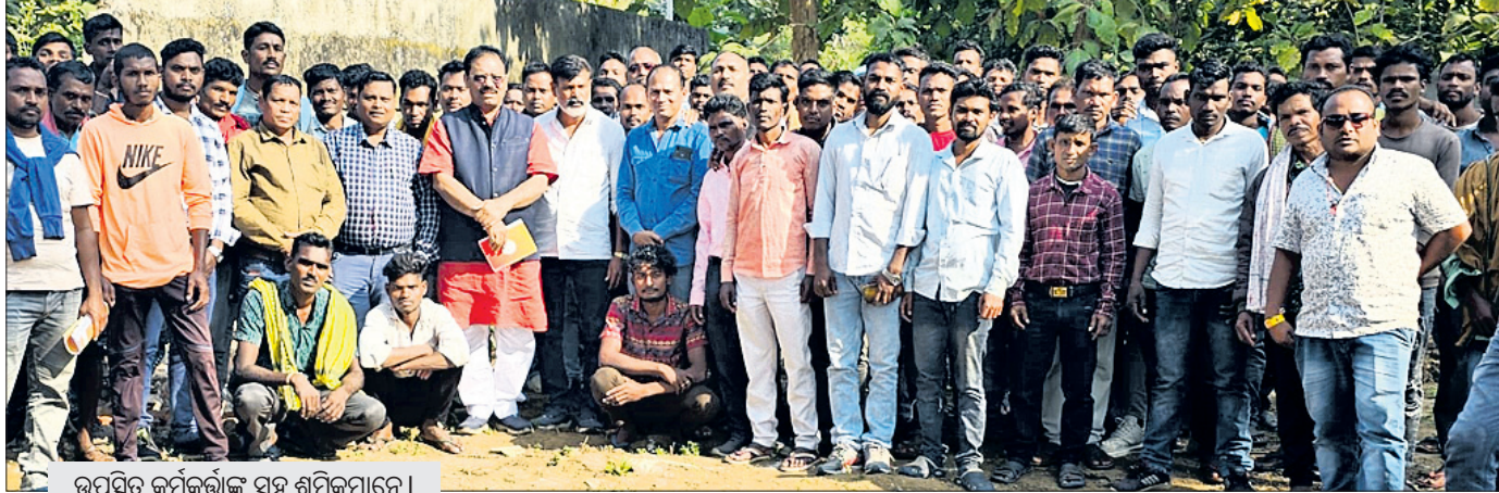
ଉପସ୍ଥିତ କର୍ମଚାରୀଙ୍କ ସହ ଶ୍ରମିକମାନେ।