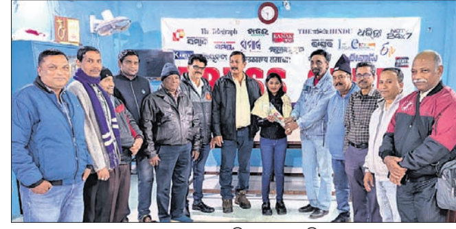
ଆରାଧ୍ୟାଙ୍କୁ କୋରାପୁଟ ପ୍ରେସ୍ କ୍ଲବ୍‌ରେ ସମ୍ମାନିତ କରାଯାଇଛି।