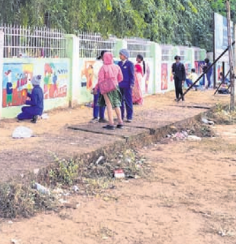
ଜିଲ୍ଲାପାଳଙ୍କ କାର୍ଯ୍ୟାଳୟ ପରିସରରେ କଳାକାରମାନେ ଖାଲ୍ ଯେଷ୍ଟି ଆସୁଛନ୍ତି ।

ନବରଙ୍ଗପୁର ଜିଲ୍ଲାପାଳଙ୍କ କାର୍ଯ୍ୟାଳୟ ପରିସରରେ ମଣ୍ଡେଇ ମହୋତ୍ସବ -୨୦୨୪ ପାଳନ ଉପଲକ୍ଷେ ଜିଲ୍ଲାପ୍ରାୟ ଖାଲ୍ ଯେଷ୍ଟି ପ୍ରତିଯୋଗିତା ଅନୁଷ୍ଠିତ ହୋଇଯାଇଛି ।