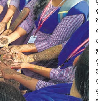
ପ୍ରତିଯୋଗିତାରେ ଭାଗନେଇଥିବା ମହିଳାମାନଙ୍କର ମେହେନ୍ଦି ପ୍ରତିଯୋଗିତାରେ ଭାଗନେଇଥିଲେ ।

ସ୍ଥାନୀୟ ମହିଳା ମହାବିଦ୍ୟାଳୟ ପରିସରରେ ମେହେନ୍ଦି ମହୋତ୍ସବ -୨୦୨୪ ପାଳନ ଉପଲକ୍ଷେ ଜିଲ୍ଲାପ୍ରାୟ ମେହେନ୍ଦି ପ୍ରତିଯୋଗିତା ଅନୁଷ୍ଠିତ ହୋଇଯାଇଛି ।