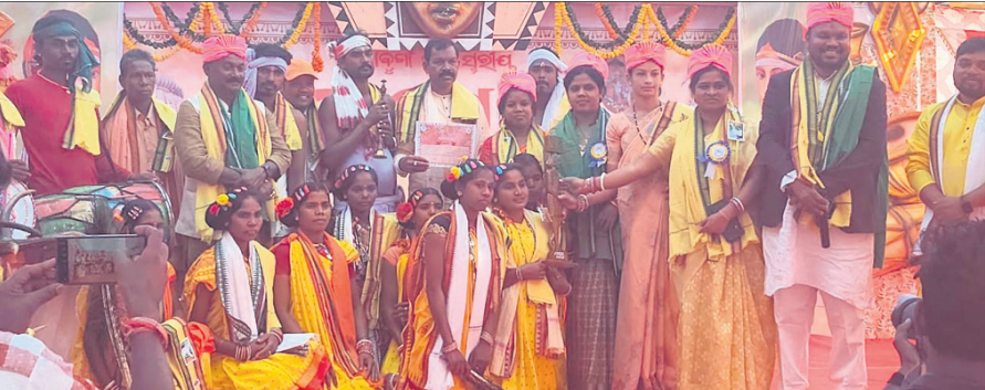
ଅତିଥିମାନେ ଦକ୍ଷତା ନୃତ୍ୟ କଳାକାରଙ୍କୁ ପୁରସ୍କୃତ କରୁଛନ୍ତି ।