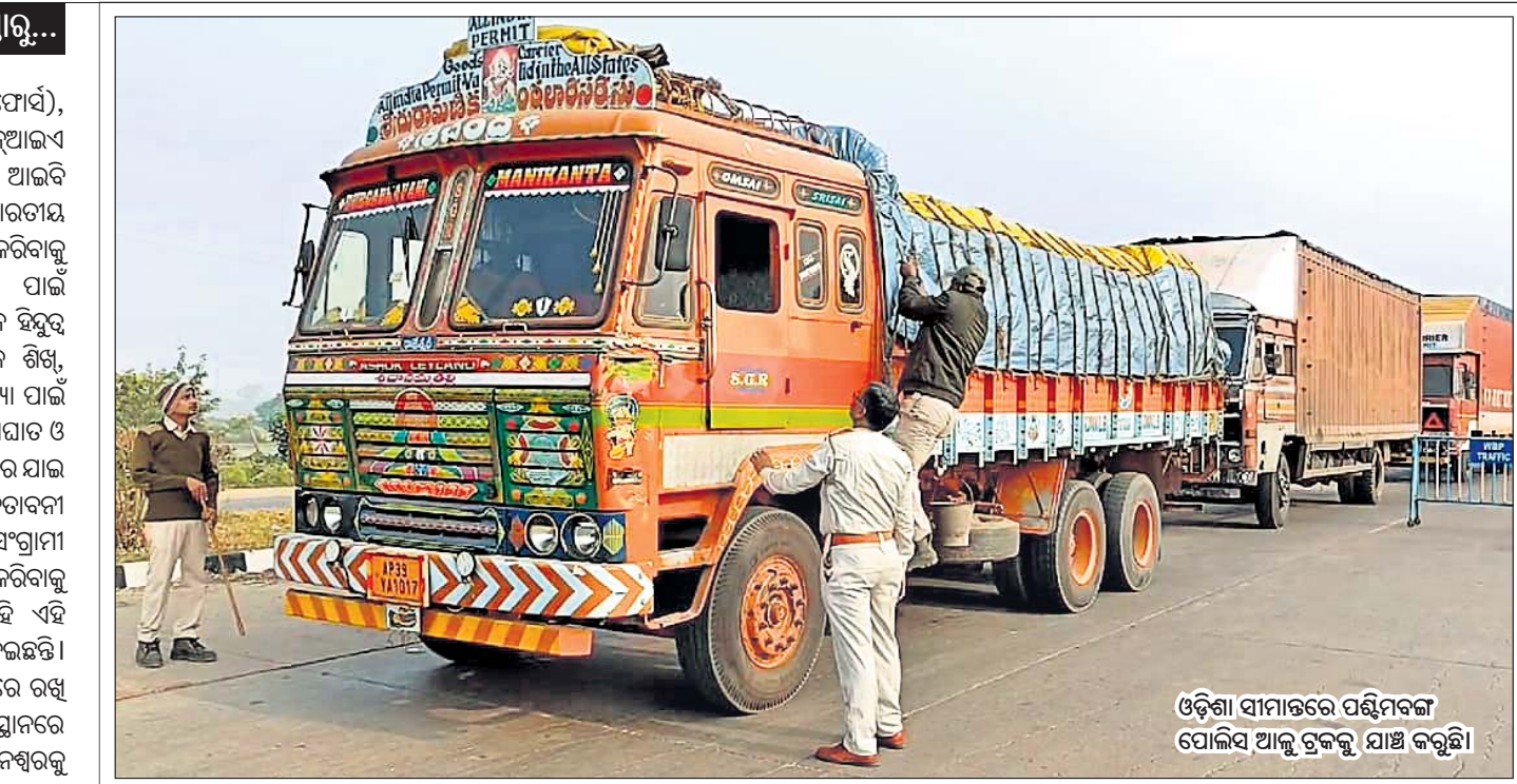
ଓଡ଼ିଶା ସାମାଜରେ ପଶ୍ଚିମବଙ୍ଗ ପୋଲିସ୍ ଆକ୍ରମଣକୁ ଯାଞ୍ଚ କରୁଛି।

ସିଆରିପିଏମ୍(ସେଣ୍ଟ୍ରାଲ୍ ରିଜର୍ଭ ପୋଲିସ ଫୋର୍ସ), ଏନ୍‌ଏସ୍‌ଇ(ନ୍ୟାଶନାଲ୍ ସିକ୍ୟୁରିଟି ଗାର୍ଡ), ଏନ୍‌ଆଇଏ (ନ୍ୟାଶନାଲ୍ ଇନ୍‌ଭେଷ୍ଟିଗେଶନ୍ ଏଜେନ୍ସି), ଆଇସି (ଇଣ୍ଟେଲିଜେନ୍ସ୍ ବ୍ୟୁରୋ)ର ୨୦୦ ଜଣ ଭାରତୀୟ ଅଧିକାରୀ ଶାହାଙ୍କ ନେତୃତ୍ୱରେ ବୈଠକ କରିବାକୁ ଯାଉଛନ୍ତି। ଯିଏ ଶହାଦ ନିଜ୍ଜାରକୁ ହତ୍ୟା ପାଇଁ ସମମ୍ଭବ ସହ ନିର୍ଦ୍ଦେଶ ଦେଇଥିଲେ, ସେମାନେ ହିନ୍ଦୁ ବିଚାରଧାରା ପ୍ରଭାବରେ ଖଲିସ୍ତାନୀ ସମର୍ଥକ ଶିଖ୍, କମ୍ପ୍ୟୁର ସଂଗ୍ରାମୀ, ନକ୍ସଲ ଓ ମାଓବାଦୀଙ୍କ ହତ୍ୟା ପାଇଁ ଯୋଜନା କରୁଛନ୍ତି। ଏହି ଡିଜିପି ସମ୍ମିଳନୀକୁ ବ୍ୟାଘାତ ଓ ବନ୍ଦ କରିବାକୁ ପକ୍ଷୀ ଆଘାତ ଦେଇଛନ୍ତି। ରାମମନ୍ଦିର ଯାଇ ଶିଖ୍‌ମାନଙ୍କୁ ସାମ୍ନା କରିବାକୁ ମୋଦିଙ୍କୁ ପକ୍ଷୀ ଚେତାବନୀ ଦେଇଛନ୍ତି। ନକ୍ସଲ, ମାଓବାଦୀ ଓ କମ୍ପ୍ୟୁର ସଂଗ୍ରାମୀ ସେମାନଙ୍କ ସମସ୍ୟାକୁ ଅନ୍ତର୍ଜାତୀୟକରଣ କରିବାକୁ ମନ୍ଦିର ଓ ହୋଟେଲରେ ଛତୁବେଶରେ ରହି ଏହି ସମ୍ମିଳନୀକୁ ଉତ୍ତର କରିବାକୁ ପକ୍ଷୀ ଆଘାତ ଦେଇଛନ୍ତି।