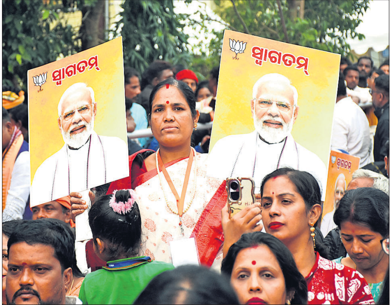
ପ୍ରଧାନମନ୍ତ୍ରୀଙ୍କୁ ସ୍ୱାଗତ ଜଣାଇବା ପାଇଁ ପାରମ୍ପରିକ ନୃତ୍ୟ, ଘୋଡ଼ାନାଚ ସହ ଜନସମାଗମରେ ଜଣେ ମହିଳା ସ୍ୱାଗତମ୍ ପ୍ୟୁକାର୍ଟ ପ୍ରଦର୍ଶନ କରୁଛନ୍ତି।