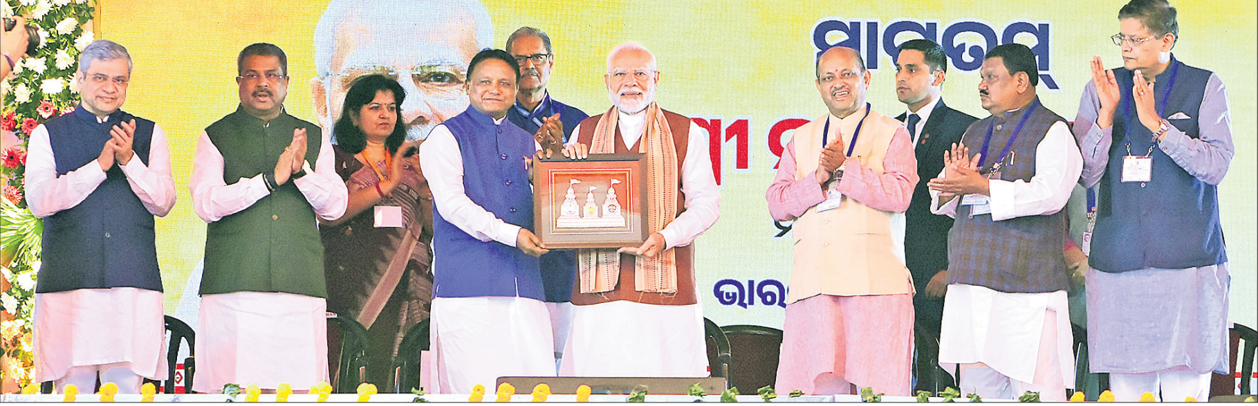
ଭୁବନେଶ୍ୱର ବିମାନ ବନ୍ଦର ପରିସରରେ ଶୁକ୍ରବାର ଅନୁଷ୍ଠିତ ଜନସଭାରେ ପ୍ରଧାନମନ୍ତ୍ରୀ ନରେନ୍ଦ୍ର ମୋଦିଙ୍କୁ ପୁଖ୍ୟମନ୍ତ୍ରୀ ମୋହନ ଚରଣ ମାଝୀ ମହାପ୍ରଭୁଙ୍କ ଏକ କଳାକୃତି ପ୍ରଦାନ କରୁଛନ୍ତି। ନିକଟରେ ଉପସ୍ଥିତ (ବାମରୁ) କେନ୍ଦ୍ରମନ୍ତ୍ରୀ ଅଶ୍ୱିନୀ ବୈଷ୍ଣବ, ଧର୍ମେନ୍ଦ୍ର ପ୍ରଧାନ, ଭୁବନେଶ୍ୱର ଏମ୍ପି ଅପରାଜିତା ଷଡ଼ଙ୍ଗା, ଉପପୁଖ୍ୟମନ୍ତ୍ରୀ କନକବର୍ଦ୍ଧନ ସିଂଦେଓ, ରାଜ୍ୟ ଭାଜପା ସଭାପତି ମନମୋହନ ସାମଲ, କେନ୍ଦ୍ରମନ୍ତ୍ରୀ ଲୁଚ୍ଛା ଓରାମ, କେନ୍ଦ୍ରାପଡ଼ା ଏମ୍ପି ଦେବିକାନ୍ତ ପଣ୍ଡା।

ଭୁବନେଶ୍ୱର, ୨୯ ନଭେମ୍ବର (ପି.ଟି.) ଭାରତର ଆର୍ଥିକ ଅଭିବୃଦ୍ଧି ଲୁଲୁଚ୍ଛା-ସେପ୍ଟେମ୍ବରରେ ପାଖାପାଖି ୨ ବର୍ଷ ଚଳୁଥିବା ୫.୪ ପ୍ରତିଶତ ହୋଇଛି। ଉତ୍ପାଦନ ଏବଂ ଖଣି ସେକ୍ଟରରେ ଖରାପ ପ୍ରଦର୍ଶନ ଯୋଗୁ ଚଳିତ ଆର୍ଥିକ ବର୍ଷର ବିତ୍ତୀୟ ଡିଜିଟାଲିଜେସନ୍ ଜିଡିପି (ମୋଟ ଘରୋଇ ଉତ୍ପାଦ) ଅଭିବୃଦ୍ଧି ହ୍ରାସ ପାଇଛି। ଆଗାମୀ ୩ ବର୍ଷରେ ଭାରତର ଜିଡିପି ୫ ପ୍ରତିଶତ ତଳର ଲୁଲୁଚ୍ଛା ସହ ତୃତୀୟ ବୃହତ୍ ଅର୍ଥନୀତିରେ ପରିଣତ ହେବା ସହ ୨୦୩୦ ବେଳକୁ ୬ ପ୍ରତିଶତ ତଳର ଅର୍ଥନୀତିରେ ପହଞ୍ଚିବା ପାଇଁ ଲକ୍ଷ୍ୟ ଆର୍ଯ୍ୟ କରାଯାଇଥିବାବେଳେ ଅଭିବୃଦ୍ଧି ହାର ୫.୪ ପ୍ରତିଶତକୁ ହ୍ରାସ ପାଇବା ଚିନ୍ତାଜନକ ହୋଇଛି। ତଥାପି ଭାରତ ସରକାରଙ୍କୁ ଅଭିବୃଦ୍ଧିଶୀଳ ଅର୍ଥନୀତି ରହିଥିବା ଶୁକ୍ରବାର ପ୍ରକାଶିତ ଜାତୀୟ ପରିବର୍ତ୍ତନୀୟ କାର୍ଯ୍ୟକ୍ରମ ତଥ୍ୟରୁ ଜଣାପଡ଼ିଛି। କାରଣ ଏହି ସମୟରେ ଗଜନୀର ଜିଡିପି ଅଭିବୃଦ୍ଧି ୪.୬% ରହିଛି। ୨୦୨୩-୨୪ ଆର୍ଥିକ ବର୍ଷର ଲୁଲୁଚ୍ଛା-ସେପ୍ଟେମ୍ବର ଡିଜିଟାଲିଜେସନ୍ ଭାରତର ଜିଡିପି ଅଭିବୃଦ୍ଧି ୮.୧ ପ୍ରତିଶତ ଥିଲା। ଏହା ପୂର୍ବରୁ ୨୦୨୨-୨୩ ଆର୍ଥିକ ବର୍ଷର ଅଭିବୃଦ୍ଧି-ଡିଜିଟାଲିଜେସନ୍ ଡିଜିଟାଲିଜେସନ୍ ଅଭିବୃଦ୍ଧି ୪.୩ ପ୍ରତିଶତ ରହିଥିଲା। ଜାତୀୟ