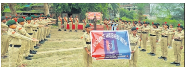
ଏନ୍ସିସି କ୍ୟାଡେଟମାନେ ଶପଥପାଠ କରୁଛନ୍ତି।

ଏନ୍ସିସି କ୍ୟାଡେଟମାନଙ୍କୁ ଏକ ଦୁର୍ନୀତିମୁକ୍ତ, ଶେଷଶ ଓ ଭ୍ରଷ୍ଟାଚାର ବିହୀନ ସତ୍ୟନିଷ୍ଠ ସମାଜ ଗଠନ ସହ ରାଷ୍ଟ୍ରର ସମୃଦ୍ଧି ପ୍ରତି ଯତ୍ନବାନ ହେବା ପାଇଁ ଶପଥପାଠ କରାଇଥିଲେ।