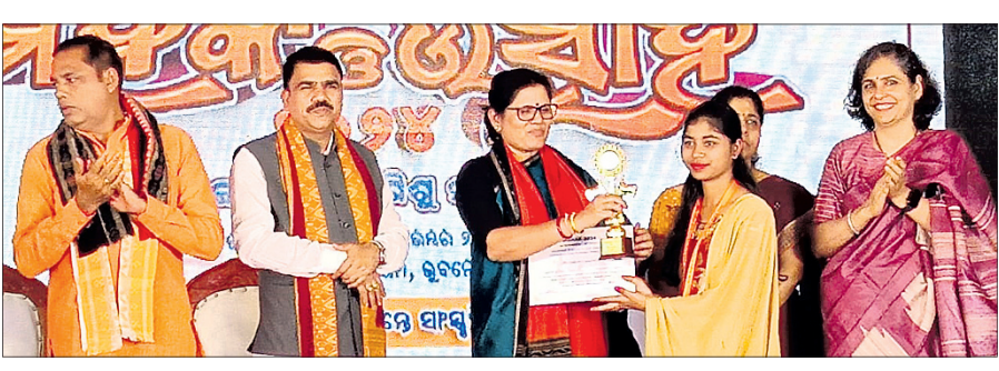
ଉପମୁଖ୍ୟମନ୍ତ୍ରୀ ପ୍ରଭାତୀ ପରିଡ଼ାଙ୍କଠାରୁ ସନ୍ଧ୍ୟାରାଣୀ ପୁରସ୍କାର ଗ୍ରହଣ କରୁଛନ୍ତି।

ନୟାଗଡ଼, ୨୯.୧୧.୨୪ (ଲୋକନାଥ ମିଶ୍ର) ଭୁବନେଶ୍ୱରରେ ଶୁଭକାରୀ ଅନୁଷ୍ଠିତ ରାଜ୍ୟସ୍ତରୀୟ ମହତ୍ୱ କାର୍ଯ୍ୟକ୍ରମର ବନ୍ଧୁତା ପ୍ରତିଯୋଗିତାରେ ନୟାଗଡ଼ ଜିଲ୍ଲାପୁରୁ ପ୍ରଥମ ହୋଇଥିବା ଗଣିଆଁ ଉତ୍ତମ ପରିଷଦ ପରିଚାଳିତ ତପସ୍ୟା