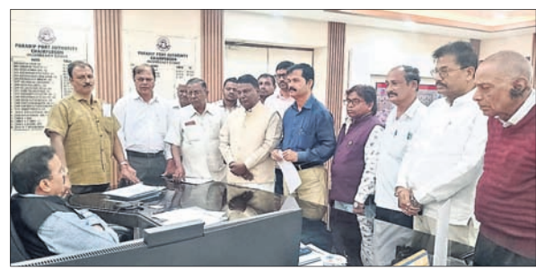
ପାରାଦୀପ ବନ୍ଦର ଅଧିକାରୀଙ୍କ ଦାବିପତ୍ର ଦିଆଯାଇଛି।