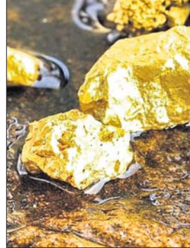
କରିଛନ୍ତି କେବଳ ଏଥିରେ ୩୦୦.୨ ମେଟ୍ରିକ୍ ଟନ୍ ସୁନା ରହିଥିବା ନେଇ ଭୂବିଜ୍ଞାନୀମାନେ ଅନୁମାନ କରିଛନ୍ତି।

ବେଙ୍ଗ, ୨୯/୧୧ ମଧ୍ୟ ଚାଉନାର ହୁନାନ୍ ରାଜ୍ୟରେ ଏକ ବୃହତ୍ ସୁନାଖଣିର ଆବିଷ୍କାର କରାଯାଇଛି। ଚାଉନାର ସରକାରୀ ଏଜେନ୍ସି ଜିନ୍ଦୁଆ ଅନୁଯାୟୀ, ୮୨.୮ ବିଲିୟନ ଡଲାର (ପ୍ରାୟ ୭ ଲକ୍ଷ କୋଟି ଟଙ୍କା) ମୂଲ୍ୟର ଏହି ସୁନା ଖଣି ବିଶ୍ୱର ସର୍ବବୃହତ୍ ସୁନା ଖଣି ହୋଇପାରିଛି। ହୁନାନ୍ ରାଜ୍ୟର ଉତ୍ତର-ପୂର୍ବଭାଗ ପିଲିଆଙ୍ଗ କାରଖାନା ୨ ହଜାର ମିଟରରୁ ଅଧିକ ଗଭୀରତାରେ 'ହୁନାନ୍ ଏକେଡେମୀ ଅଫ୍ ଜିଓଲୋଜି'ର ଭୂବିଜ୍ଞାନୀମାନେ ୪୦ରୁ ଅଧିକ ସୁନା ଶିରାକୁ ଚିହ୍ନଟ