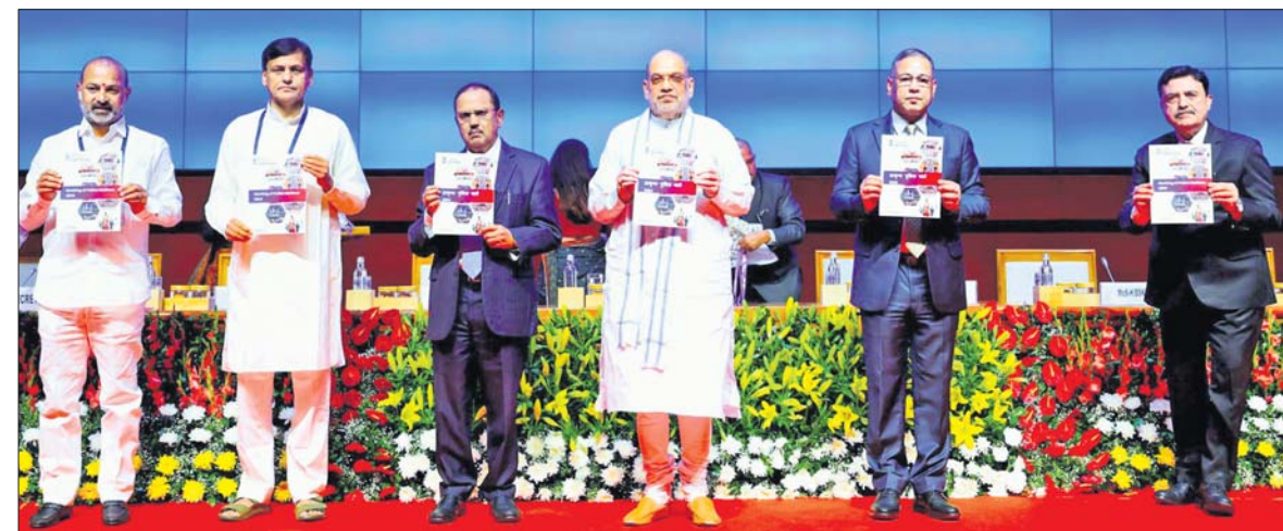
ଭୁବନେଶ୍ୱର ଲୋକସେବା ଭବନ କନ୍ଠଭେଦନ ସେଣ୍ଟରରେ ସର୍ବଭାରତୀୟ ଡିଜିଟାଲ ସମ୍ମିଳନୀକୁ ସ୍ୱରାଷ୍ଟ୍ର ମନ୍ତ୍ରୀ ଅମିତ ଶାହା ଉଦ୍ଘାଟନ କରିଛନ୍ତି।