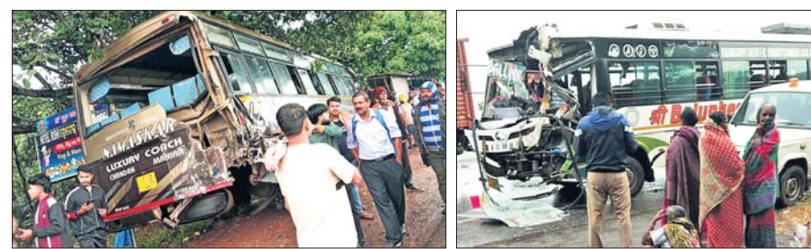
ଗାଙ୍ଗା, ୨୯.୧୧ (ରଘୁନାଥ ସାହୁ)

ଖୋର୍ଦ୍ଧା ଜିଲ୍ଲା ଗାଙ୍ଗା ଥାନା ଅଧୀନ ୧୬ ନମ୍ବର କାତାୟ ରାଜପଥର କୋଟିଲା ଛକରେ ଶୁକ୍ରବାର ମର୍ମରୁଦ୍ଧ