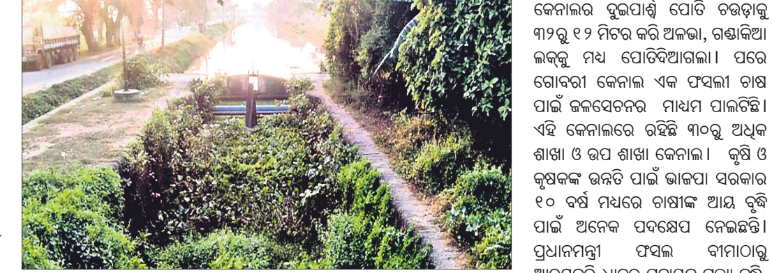
ପଞ୍ଚାମୁଖାଲ ଅଳଭା-ଗଣ୍ଡାକିଆ ଲକ୍ ସେରୁ ।

ନଅକ ଦୁର୍ଭିକ୍ଷ ପରେ କେନ୍ଦ୍ରାପଡ଼ା ଜିଲ୍ଲା ପଞ୍ଚାମୁଖାଲ ବ୍ଲକ୍ ଲୋକଙ୍କୁ ଅନାହାରରୁ ରକ୍ଷାକରିବାକୁ ତ୍ରିଟିଶ ସରକାର ପଞ୍ଚାମୁଖାଲ କେନାଲ ସହ ଗୋବରା କେନାଲ ଖନନ କରିଥିଲେ । କେନ୍ଦ୍ରାପଡ଼ା ଜିଲ୍ଲାର ଭାତହାଣ୍ଡି ଉଡିକଣ ଅଞ୍ଚଳର ଚାଷଜମିକୁ ଜଳସେଚନରେ ବ୍ୟବସ୍ଥା କରାଯାଇଥିଲା । ଏହି କେନାଲ ଘାଣ୍ଟିବା ଆରମ୍ଭ ହେବା ପାଇଁ ୧୫୦୦ ବର୍ଷ ଧରି ଜାବନରେଖା ପାଇଥିଲା । ୧୯୯୦ ବର୍ଷକ ପର୍ଯ୍ୟନ୍ତ ଏହି କେନାଲର ଅଳଭା-ଗଣ୍ଡାକିଆ ଲକ୍ ଦେଇ କେନାଲ ଖନନ କରାଯାଇଥିଲା । ପ୍ରାୟ ୩୦ ମିଟର ଚଉଡ଼ା ଶହେ ଫୁଟ ଧରି ଖନନ କରାଯାଇଥିଲା । ଏହା ପୂର୍ବରୁ ଅଳଭା-ଗଣ୍ଡାକିଆ ଲକ୍ ଦେଇ ପାଣି ଗୋବରା କେନାଲକୁ ବ୍ରାହ୍ମଣୀରେ ମିଶିଲେ ଉଡିକଣ ଅଞ୍ଚଳର ଅନେକ ଲକ୍ଷ ଚାଷୀଙ୍କ ମୁହଁରେ ହସ ଫୁଟାଇପାରନ୍ତା ନଦୀ ସହ ସଂଯୋଗ କରିଥିବାବେଳେ ଗଣ୍ଡାକିଆରେ ଗୋବରା ସହ ମିଶିଥିଲା । କେବଳ ଏହା ଜଳସେଚନର ମୂଳ ଧାରା ନ ଥିଲା ଏହି କେନାଲ ଲୋକଙ୍କ ଜୀବନରେଖା ପାଇଥିଲା । ଉକ୍ତ କେନାଲରେ ପାରାଦୀପ, ମହାକାଳପଡ଼ାର ଜୟ, ବେଶାକ୍ଷା,