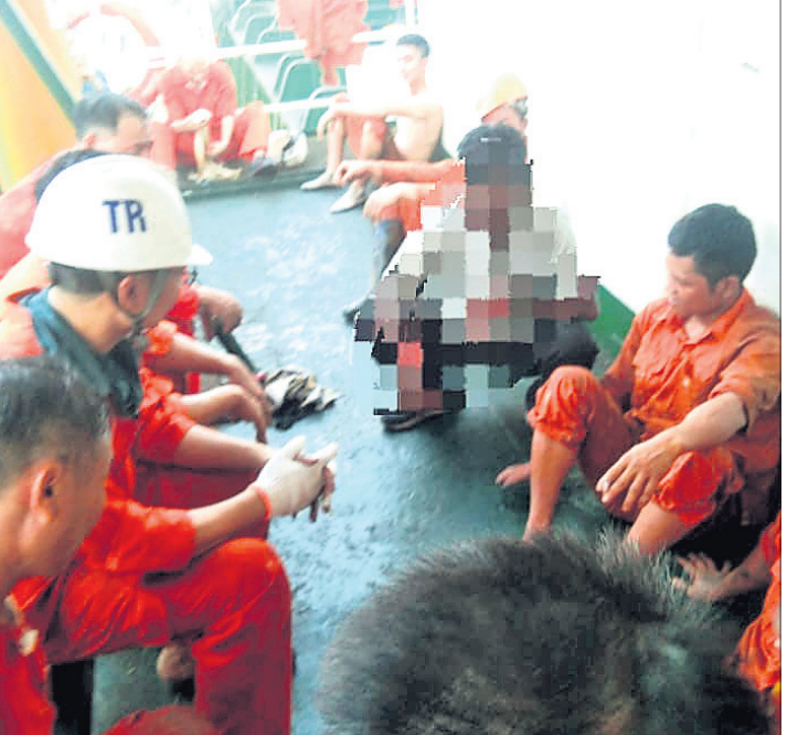
ଧାରଣାରେ ବସିଥିବା ନାବିକମାନେ ।

୨୦୨୩ ନଭେମ୍ବର ୩୦ରେ ପଶ୍ୟାସହା ଜାହାଜ ଏମ୍ବି ଦେବୀ ପିଆଇସିଟି ବର୍ଷରେ ଥିବାବେଳେ ସେଥିରୁ ୨୨୦ କୋଟି ଟଙ୍କାର କୋକେନ୍ ଜବତ ହୋଇଥିଲା । ଉକ୍ତ ଘଟଣା ବର୍ଷେ ପୂରିବାକୁ ବସିଥିବା ବେଳେ କୋକେନ୍ କିପରି ଜାହାଜ ଭିତରକୁ ଆସିଥିଲା ତା'ର ରହସ୍ୟ ଚପଟକାରୀ ସଂସ୍ଥା କଷ୍ଟରୁ ବିଭାଗ ସ୍ୱଳ୍ପ କରିନାହାନ୍ତି । ଅପରପକ୍ଷେ ଉକ୍ତ ଜାହାଜ ଗତ ୨୬ ତାରିଖରୁ ବନ୍ଦ ବର୍ଷ ପାଖକୁ ଆସି ଆଉ ଯାଇ ପାରୁନାହିଁ । କାରଣ ସେଥିରେ ଥିବା ୨୧ ଜଣ ଭିଏଟନାମ ନାବିକ କାମ ବନ୍ଦ କରି ଧାରଣା ଦେଇଛନ୍ତି । ଉକ୍ତ ଜାହାଜ ୨୬ ତାରିଖରୁ ଏମ୍ବି ଦେବୀ (ବହୁମୁଖୀ ବର୍ଷ)ରେ ଲାଗିଥିଲା । ଶୁକ୍ରବାର ଉକ୍ତ ଏମ୍ବି ନଅ ଅଧିକ କେନ୍ଦ୍ରକୁ ଘାଣ୍ଟିବାକୁ କୋକେନ୍ କୋକେନ୍ ନାବିକମାନଙ୍କ ଛିଡି ଅନୁଧ୍ୟାନ କରିବା ପାଇଁ ଭିଏଟନାମର ଜଣେ ପ୍ରତିନିଧି ପାରାଦୀପ ଆସିଥିଲେ । ତାଙ୍କୁ ଜାହାଜ ଭିତରକୁ ଯିବା