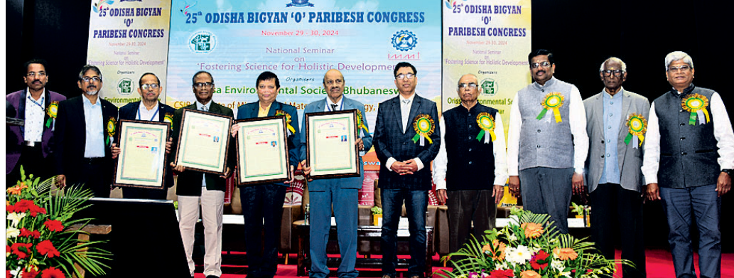
ଉଦ୍‌ଘାଟନା ଉତ୍ସବରେ ଅତିଥିକ ଗହଣରେ ପୁରସ୍କାର ପାଇଥିବା ବ୍ୟକ୍ତିଗଣମାନେ।

ଅଧ୍ୟକ୍ଷତାରେ ପୁସ୍ତକ 'ସାମଗ୍ରିକ ବିକାଶ ନିମନ୍ତେ ବିଜ୍ଞାନର ପ୍ରୟୋଗ'ର ବିଜ୍ଞାନ ବିଭାଗରେ ଆଲୋଚନା କରାଯାଇଛି। ମାତ୍ର ସାମ୍ପ୍ରତିକ ସମୟରେ ବିକାଶ ନିମନ୍ତେ ଗ୍ରହଣ କରାଯାଇଥିବା ବିଜ୍ଞାନ ଏବଂ ପ୍ରଯୁକ୍ତିବିଦ୍ୟାର ବିଭିନ୍ନ ଦିଗରେ ଉପସ୍ଥିତ ଅଗ୍ରଗତି ବହୁବିଧ ମାନବ ସମ୍ପଦର ସ୍ଥାୟୀ ସମାଧାନ