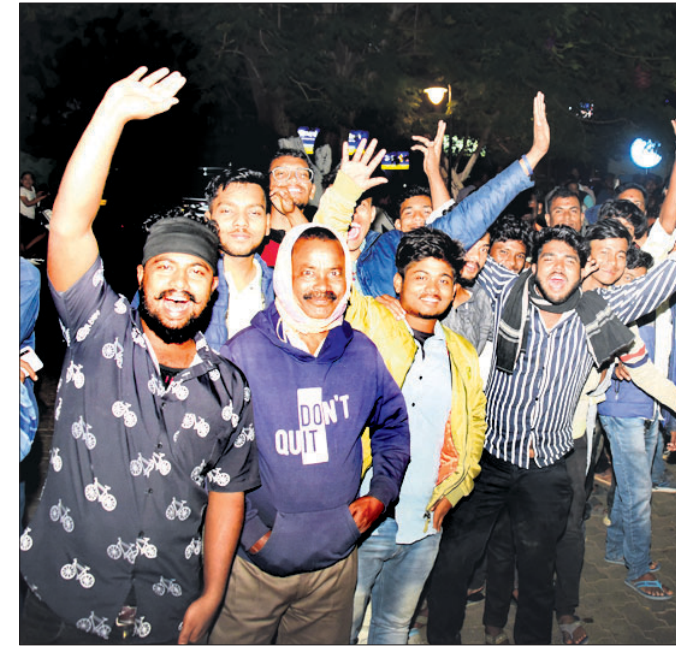
ଭୁବନେଶ୍ୱର ବିମାନବନ୍ଦର ପରିସରରେ ଅନୁଷ୍ଠିତ ଜନସଭାରେ ସମର୍ପଣକମାଣେ । ପ୍ରଧାନମନ୍ତ୍ରୀଙ୍କୁ ସ୍ୱାଗତ କରାଯାଇ ପାଇଁ ପାରମ୍ପରିକ ନୃତ୍ୟ ପ୍ରଦର୍ଶନ । ଭାଜପା ରାଜ୍ୟ କାର୍ଯ୍ୟକ୍ରମ ନିକଟରେ ପ୍ରଧାନମନ୍ତ୍ରୀଙ୍କୁ ଦେଖିବା ପାଇଁ ଅପେକ୍ଷାକୃତ ଜନତା ।