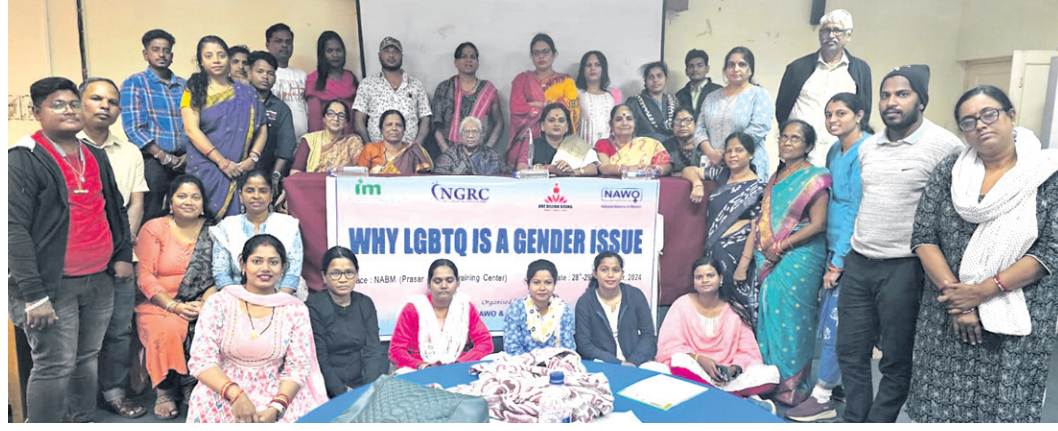
କର୍ମଶାଳାରେ ଅତିଥିକ ଗହଣରେ ଏଲଜିବିଟିଏମ୍‌ଙ୍କ ସହ ଅନ୍ୟମାନେ ।

ନ୍ୟାଶନାଲ ଆଲିଆନ୍ସ ଅଫ୍ ଗେନେଡ଼ିଭା ଶାଖା ଓ ସଖାର ମିଳିତ ସହଯୋଗରେ ଶତକୋଟି ଉତ୍ଥାନ ଅଭିଯାନ ଓ ମହିଳା ହିଂସା ବିରୋଧୀ ଉପରେ ୨ ଦିନିଆ କର୍ମଶାଳା ଭାରତ ତାଲିମ କେନ୍ଦ୍ରରେ ଅନୁଷ୍ଠିତ ହୋଇଯାଇଛି । ଏହିକାର୍ଯ୍ୟକ୍ରମରେ ନୂଆ ଚେତନାର ଉତ୍ସ ସାଜିବା, ହିଂସାମୁକ୍ତ ସମ୍ପର୍କ ଗଢ଼ିବା ଉପରେ ଆଲୋଚନା ହୋଇଥିଲା । ଏଥିରେ ଏଲଜିବିଟିଏମ୍‌ମାନେ ଯୋଗଦେଇ ନିଜ ଜ୍ଞାନକୁ ଗଭୀର କରିବା, ସମସ୍ୟାକୁ ବୁଝିବା ସହ ତା'ର ସମାଧାନ ନେଇ ଆଲୋଚନା କରିଥିଲେ । ନ୍ୟାଶନାଲ ଆଲିଆନ୍ସ ଅଫ୍ ଗେନେଡ଼ିଭା ଶାଖାର କର୍ତ୍ତବ୍ୟ ପ୍ରମାଣ ସାଜି ସାଗତ ଭାଷଣ ଦେଇଥିଲେ । ଯେଉଁମାନେ ମହିଳା ଓ ପୁରୁଷ ଲିଙ୍ଗରେ ଫିଟ୍ ନୁହଁନ୍ତି, ସେମାନଙ୍କୁ ସମାଜ ସବୁବେଳେ ସବୁକ୍ଷେତ୍ରରେ ବାଦ