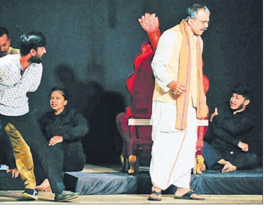
କଟକ ଅନୁପୂର୍ଣ୍ଣା ଥିଏଟରରେ ଭବାନୀପାଟଣା ସ୍ଥାନୀୟ ନାଟ୍ୟସମ୍ପାଦକ କଳାକାରଙ୍କ ଦ୍ୱାରା ମଞ୍ଚସ୍ଥ ନାଟକ 'ଇନ୍ଦ୍ର ଯାତ୍ରା'ର ଏକ ଦୃଶ୍ୟ।