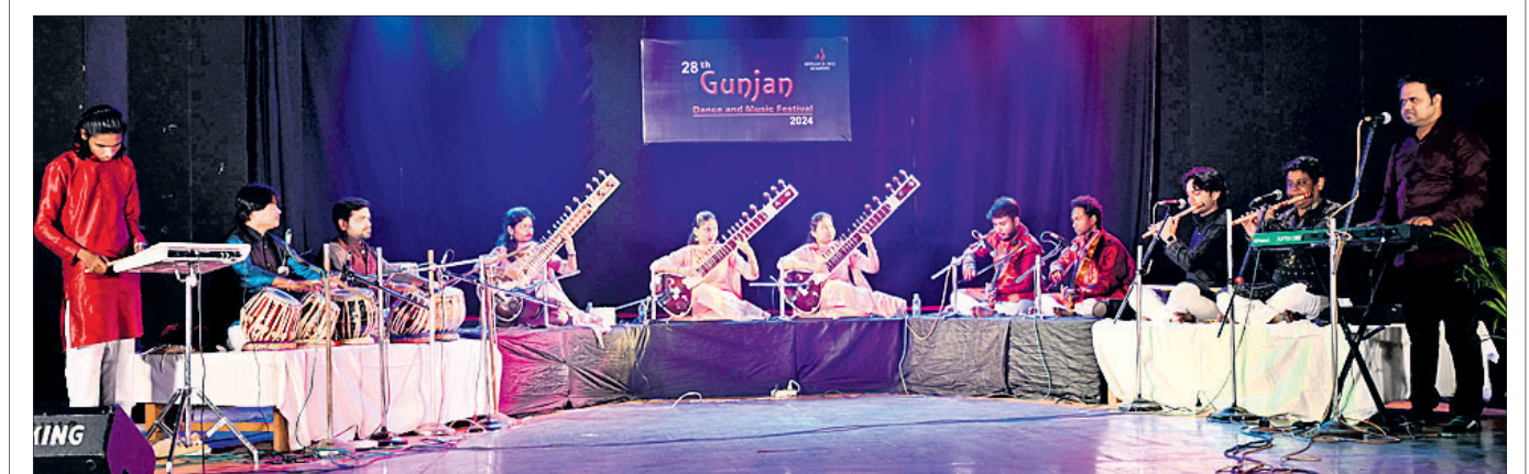
କଟକସ୍ଥିତ କଳାବିକାଶ କେନ୍ଦ୍ରରେ ଚାଲିଥିବା ଗୁଞ୍ଜନ ଡ୍ୟାନ୍ସ ଆଣ୍ଡ ମ୍ୟୁଜିକ୍ ଫେଷ୍ଟିଭାଲର ଶୁକ୍ରବାର ଦ୍ୱିତୀୟ ସନ୍ଧ୍ୟାରେ ଶିଳ୍ପୀମାନେ ବାଦ୍ୟ ସଙ୍ଗୀତ ପରିବେଷଣ କରୁଛନ୍ତି।

ଇନ୍‌ଫୋଭ୍ୟାଲି ଥାନା ଅଞ୍ଚଳର ଜଣେ ୬ ବର୍ଷୀୟା ଶିଶୁକନ୍ୟାଙ୍କୁ ବଳାହାର କରାଯାଇଥିବା ଅଭିଯୋଗ ହୋଇଛି। ଏହି ଘଟଣାରେ ପୋଲିସ ଜଣେ ବୃଦ୍ଧ ବୋକାଳୀଙ୍କୁ ଅଟକ ରଖି ପଚରାଉଚରା ଚଳାଇଛି। ଅଭିଯୋଗ ମୁତାବକ, ସୁରୁତାର ଶିଶୁକନ୍ୟା ଜଣଙ୍କ ମ୍ୟାଗି ପାଇଁ ଘରଠାରୁ ଶହେମିଟର ଦୂରରେ ଥିବା ଏକ ବୋକାଳୀଙ୍କୁ ଯାଇଥିଲେ। ବୃଦ୍ଧ ବୋକାଳୀ ଜଣଙ୍କ ଚକୋଲେଟ୍ ଦେଇ ପ୍ରକୋଭନ ଦେଖାଇ ତାଙ୍କୁ କୋଳରେ ବସାଇଥିଲେ। ସେଠାରେ ଥିବା ଅନ୍ୟ ଗ୍ରାହକମାନେ ପକାଇବା ପରେ ବୃଦ୍ଧ ଜଣଙ୍କ ଶିଶୁକନ୍ୟାଙ୍କୁ ବଳାହାର କରିଥିଲେ। ଏହା ପରେ ବୃଦ୍ଧ ଜଣଙ୍କ କିଛି ଚକୋଲେଟ୍, ମ୍ୟାଗି ସହ ଚକା ଦେଇ ଘରକୁ ଶିଶୁକନ୍ୟାଙ୍କୁ ଫେରାଇ ଦେଇଥିଲେ। ତେବେ ଝିଅର ଫେରିବାରେ ବିକଳ ହେବାକୁ ଚାଲି 'ମା' ବୋକାଳୀ ଅଭିଯୁକ୍ତ ଆସିଥିଲେ। ବାଟରେ ଝିଅକୁ ଆସୁଥିବା ଦେଖିବା ପରେ ସାଙ୍ଗହୋଇ ଘରକୁ ଫେରିଥିଲେ। ତେବେ ଶିଶୁକନ୍ୟା ଜଣଙ୍କ କାନ୍ଦିବାକୁ କ'ଣ ହୋଇଛି ବୋଲି ପଚାରିବାରୁ ଘଟଣା ସମ୍ପର୍କରେ ସେ କହିଥିଲା। ଏନେଇ ଶିଶୁକନ୍ୟାଙ୍କ 'ମା'ଙ୍କ ଅଭିଯୋଗକ୍ରମେ ପୋଲିସ ଘଟଣାସ୍ଥଳରେ ପହଞ୍ଚି ଉକ୍ତ ବୋକାଳୀଙ୍କୁ ସିଲ୍ କରିବା ସହ ବୃଦ୍ଧଙ୍କୁ ଅଟକ ରଖି ପଚରାଉଚରା ଚଳାଇଛି। ଅନ୍ୟପକ୍ଷରେ ଶନିବାର ଅଭିଯୁକ୍ତଙ୍କୁ କୋର୍ଟଚାଲାଣ କରାଯିବ ବୋଲି ଥାନା ଅଧିକାରୀ କୁପାସିଷ୍ଟ ବରାଡ଼ କହିଛନ୍ତି।