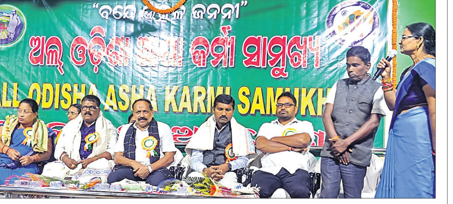
କଟକ ଜିଲ୍ଲାଖାଲିଠାରେ ଆଶାକର୍ମୀମାନଙ୍କ ଜିଲ୍ଲାସ୍ତରୀୟ ସମିଳନୀରେ ଯୋଗଦେଇଥିବା ଅତିଥିବୃନ୍ଦ।