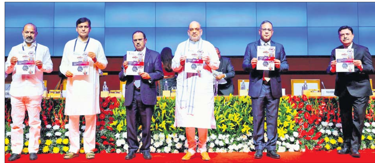
ଭୁବନେଶ୍ୱର ଲୋକସେବା ଭବନ କନ୍ଵେନ୍ସନ ସେଣ୍ଟରରେ ସର୍ବଭାରତୀୟ ଡିଜିଟାଲ ସମ୍ମିଳନୀକୁ ସ୍ୱରାଷ୍ଟ୍ର ମନ୍ତ୍ରୀ ଅମିତ୍ ଶାସ୍ତ୍ରୀ ଉଦ୍ଘାଟନ କରିଛନ୍ତି। ନିକଟରେ ଜାତୀୟ ସୁରକ୍ଷା ପରାମର୍ଶଦାତା (ଏନ୍‌ଏସ୍‌ଏ) ଅଜିତ ତୋଡାଲ୍ ଏବଂ ଅନ୍ୟମାନେ।

ପୋଲିସ ମହାନିର୍ଦ୍ଦେଶକ / ମହାନିରୀକ୍ଷକମାନଙ୍କ ସର୍ବଭାରତୀୟ ସମ୍ମିଳନୀ ଶୁକ୍ରବାର ଭୁବନେଶ୍ୱରସ୍ଥିତ ଲୋକସେବା ଭବନ କନ୍ଵେନ୍ସନ ସେଣ୍ଟରରେ ଆରମ୍ଭ ହୋଇଛି। ଏହି ସମ୍ମିଳନୀକୁ ସ୍ୱରାଷ୍ଟ୍ରମନ୍ତ୍ରୀ ଅମିତ୍ ଶାସ୍ତ୍ରୀ ଉଦ୍ଘାଟନ କରିଛନ୍ତି। ଏଥିରେ ପ୍ରଧାନମନ୍ତ୍ରୀଙ୍କ ପ୍ରମୁଖ ସଚିବ, ଜାତୀୟ ସୁରକ୍ଷା ପରାମର୍ଶଦାତା, ସ୍ୱରାଷ୍ଟ୍ର ରାଷ୍ଟ୍ରମନ୍ତ୍ରୀ, ରାଜ୍ୟ/କେନ୍ଦ୍ରଶାସିତ ଅଞ୍ଚଳର ଡିଜିଟାଲ ଏବଂ କେନ୍ଦ୍ରୀୟ ପୋଲିସ ସଙ୍ଗଠନର ମୁଖ୍ୟମାନେ ଯୋଗଦେଇଛନ୍ତି। ସମ୍ମିଳନୀରେ ଆଭ୍ୟନ୍ତରୀଣ ସୁରକ୍ଷା ସମ୍ପନ୍ନାୟ ବିଭିନ୍ନ ଗୁରୁତ୍ୱପୂର୍ଣ୍ଣ ପ୍ରସଙ୍ଗରେ ଆଲୋଚନା ହୋଇଛି। ଦେଶର ଶ୍ରେଷ୍ଠ ଥାନା ଓ ପୋଲିସ ଅଧିକାରୀମାନଙ୍କୁ ମଧ୍ୟ ସମ୍ମାନିତ କରାଯାଇଛି। ଶନିବାର ପ୍ରଧାନମନ୍ତ୍ରୀ ନରେନ୍ଦ୍ର ମୋଦି ଏହି ବୈଠକରେ ଯୋଗଦେବେ।