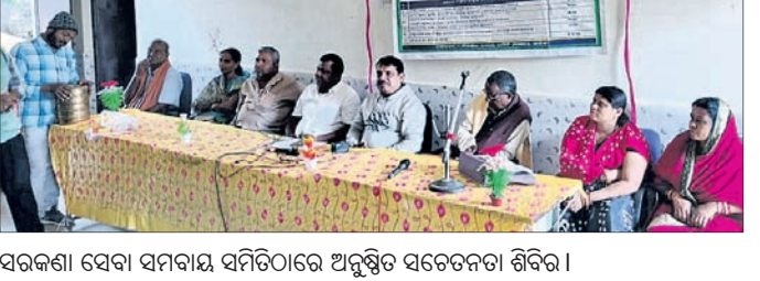
ସରକାରୀ ସେବା ସମବାୟ ସମିତିରେ ଚାଷୀ ସଚେତନତା ଶିବିର ।

କହି ୧୨ ଲକ୍ଷ ଟଙ୍କା ମାଗିଥିଲେ । ଯୁବକ ଜଣକ ଦାବି ପୂରାକରି ଟଙ୍କା ଓ କିଛି ସୁନା ଗହଣା ଦେଇଥିଲେ । କିନ୍ତୁ ପରବର୍ତ୍ତୀ ସମୟରେ ଯୁବତୀ କୌଣସି ଚାକିରି କରାଇ ଦେଇପାରି ନ ଥିଲେ କି ଟଙ୍କା ଫେରାଇ ନ ଥିଲେ । ଠକାମିର ଶିକାର ହୋଇଥିବା ଜଣେ ଯୁବକ ଜଣକ ଯୁବତୀ ଓ ଚାକିରି ଜଣେ ସହଯୋଗୀକ ବିରୋଧରେ ଥାନାରେ ଏତଲା ଦେଇଛନ୍ତି ।