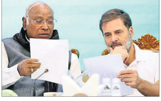
ସିଡ଼କୁସି ବୈଠକରେ କଂଗ୍ରେସ ନେତା ରାହୁଲ ଗାନ୍ଧୀଙ୍କ ସହ ଦଳ ଅଧ୍ୟକ୍ଷ ମଲିକାର୍ଜୁନ ଖାର୍ଗେ ।

ଦୁଆବିଲା, ୨୯/୧୧ (ପି.ଟି.) ନେବାକୁ ହେବ ଏବଂ ଉତ୍ତରଦାୟିତ୍ୱ ଧାର୍ଯ୍ୟ କରିବାକୁ ପଡ଼ିବ ବୋଲି କଂଗ୍ରେସ ଅଧ୍ୟକ୍ଷ ମଲିକାର୍ଜୁନ ଖାର୍ଗେ କହିଛନ୍ତି । ନିର୍ବାଚନ ଫଳାଫଳ ଆମକୁ ଶିକ୍ଷା ଗ୍ରହଣ କରିବାକୁ ହେବ ବୋଲି ବିଚାରବିମର୍ଶ କରିଛନ୍ତି । ଦଳକୁ ସୁଦୃଢ଼ କରିବାକୁ ହେଲେ କଠୋର ନିଷ୍ପତ୍ତି