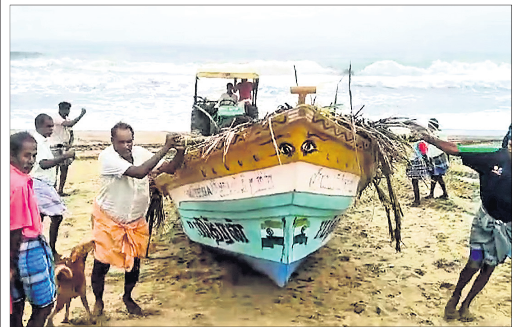
ବଙ୍ଗୋପସାଗରରେ ସୃଷ୍ଟି ତିପ୍ପିପ୍ରଶ୍ନ ସାମୁଦ୍ରିକ ବାତ୍ୟା 'ଫେଟାଲ'ରେ ପରିଣତ ହେବାକୁ ଯାଉଥିବାବେଳେ ପାଣିପାଗ ବିଭାଗର ପରାମର୍ଶକ୍ରମେ ଚାମିଲବାହୁର ତିବୁଟିରାପକ୍ଷରେ ମଧ୍ୟକାଳୀନାମେ ସେମାନଙ୍କ ବୋଟକୁ ସମୁଦ୍ରକୁ ଛାଡ଼ିଦେଇ ନେଇଆସୁଛନ୍ତି।