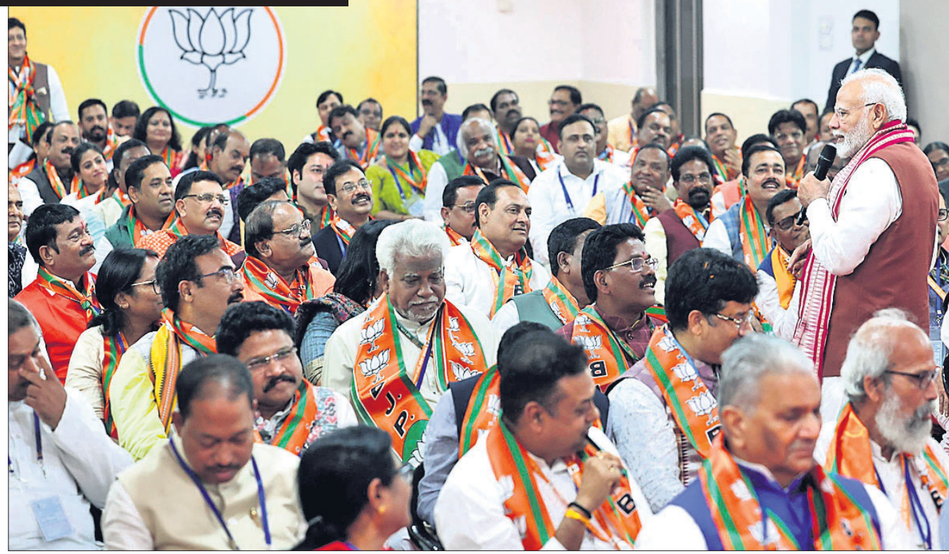
ସ୍ୱାସ୍ଥ୍ୟମନ୍ତ୍ରୀ ଅମିତ ଶାହାଙ୍କୁ ବିମାନବନ୍ଦରରେ ମୁଖ୍ୟମନ୍ତ୍ରୀ ମୋହନ ଚରଣ ମାଝୀ ସ୍ୱାଗତ କରୁଛନ୍ତି । ନିକଟରେ ଉପସ୍ଥିତ ଅଛନ୍ତି କେନ୍ଦ୍ରମନ୍ତ୍ରୀ ଧର୍ମେନ୍ଦ୍ର ପ୍ରଧାନ । ଭାଜପା ରାଜ୍ୟ କାର୍ଯ୍ୟକ୍ରମରେ ଶୁକ୍ରବାର ସନ୍ଧ୍ୟାରେ ପ୍ରଧାନମନ୍ତ୍ରୀ ନରେନ୍ଦ୍ର ମୋଦି ଦଳୀୟ ବିଧାୟକ, ମନ୍ତ୍ରୀ, ଏମ୍ପି ଏବଂ ପଦାଧିକାରୀଙ୍କ ସହ ବାର୍ତ୍ତାଳାପ କରୁଛନ୍ତି ।