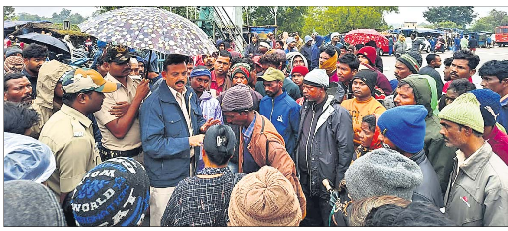
ଦୁର୍ଘଟଣାସ୍ଥଳରେ ପୋଲିସ୍ ଅଧିକାରୀମାନେ ବୁଝାଶୁଝା କରୁଛନ୍ତି।

ବାରପଦା(ନାଳାଦ୍ରି ବିହାରୀ ଦଣ୍ଡପାଟ)/ ରାଇରଙ୍ଗପୁର(ମାନ୍ୟ ମହାନ୍ତି), ୩୦.୧୧