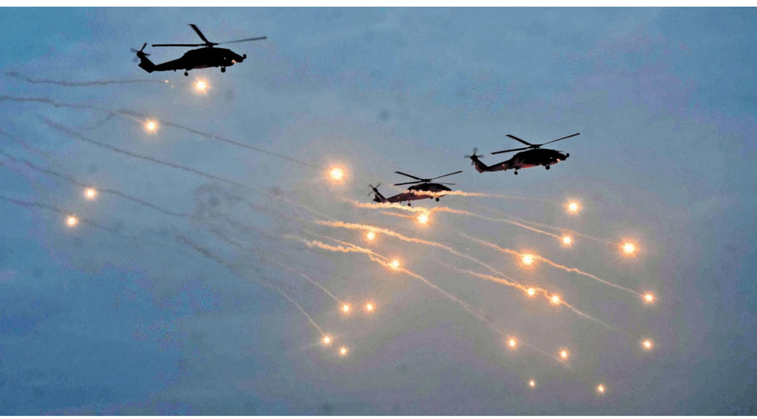
ନୌସେନା ଦିବସ ପାଳନର ଅବ୍ୟବହୃତ ପୂର୍ବରୁ ଶନିବାର ପୁରୀ ସମୁଦ୍ର ଆକାଶରେ ପ୍ରଦର୍ଶିତ ମୁକ୍ତ କୌଶଳ।

ଆଜିର ସମ୍ବାଦକୀର୍ତ୍ତୀ କେବଳ ଦେଖାଶାହାରି ଆଜିର ଗତବ୍ୟ ମହିଳାମାନେ ନିଜକୁ ଅଧିକ ସମର୍ଥ ଓ ସଶକ୍ତ କରିବା ପାଇଁ ଆଗକୁ ଆସି କେନ୍ଦ୍ରୀୟ ଯୋଜନାଗୁଡ଼ିକର ସୁବିଧା ହାସଲ କରିବା ରଚିତ। ନିର୍ମଳା ସାତାରାମନ୍, କେନ୍ଦ୍ର ଅର୍ଥମନ୍ତ୍ରୀ