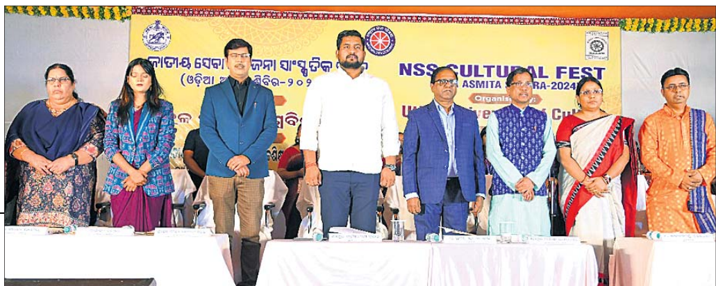
ଓଡ଼ିଆ ଅସ୍ଥିତା ଶିବିର ଉଦ୍ଘାଟନା ଉତ୍ସବରେ ଯୋଗଦେଇଥିବା ଅତିଥି ।