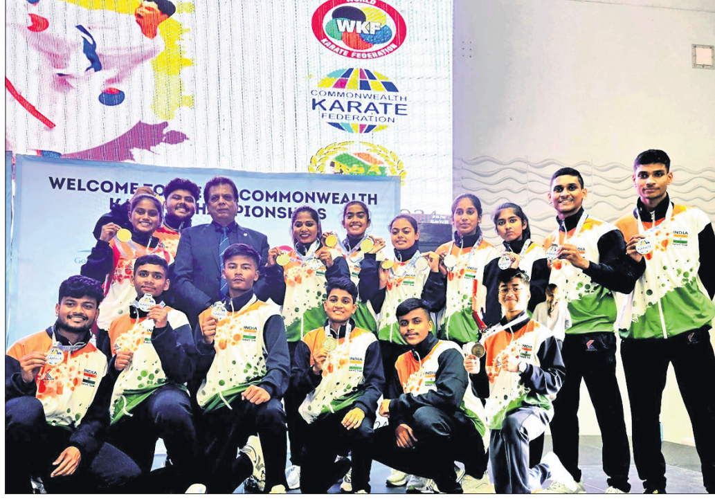
ରାଜ୍ୟଗୋଷ୍ଠୀ କରାବେଳେ ପଦକ ବିଜେତା ଓଡ଼ିଆ ଖେଳାଳି।