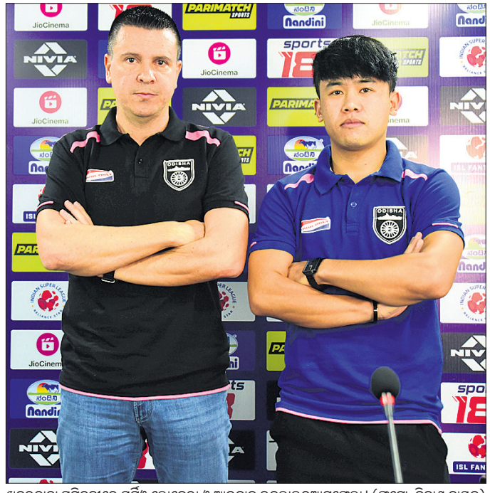
ଖବରଦାତା ସମ୍ମିଳନୀରେ ସର୍ବିଷ୍ଟ ଲୋକେ ଓ ଆଇକାଲ ଭନଲାଲ ରୁଆଚେଫା।

ଈନ୍ଡିଆନ୍ ସୁପରଲିଗ୍ (ଆଇଏସ୍‌ଏଲ୍)ରେ ରବିବାର ଓଡ଼ିଶା ଏଫସି(ଓଏଫସି) ଏହାର ପରବର୍ତ୍ତୀ ମ୍ୟାଚ୍ ବେଙ୍ଗାଲୁରୁ ଏଫସି ବିପକ୍ଷରେ ଖେଳିବ। ଚେନ୍ନାଇ ଚକ୍ରର ବେଙ୍ଗାଲୁରୁ ବିପକ୍ଷରେ ମ୍ୟାଚ୍ ସଂପର୍କପୂର୍ଣ୍ଣ ହେବା ନେଇ ଆଶା କରାଯାଇଛି। ଏହି ମ୍ୟାଚ୍‌ରୁ ଜିତିବା ଓଏଫସି ପ୍ରାୟତଃ କରିବ। ଓଡ଼ିଶା ଏଫସି ଏହାର ଅଧିକ ମ୍ୟାଚ୍‌ରେ ହାଲଦ୍ରାବାଦ ଏଫସିକୁ ୬-୦ରେ ପରାସ୍ତ କରିଥିଲା। ନକଲ ସମସ୍ତ ଫର୍ମାଟ୍‌ରେ ଖେଳାଳି ଚମତ୍କାର ପ୍ରଦର୍ଶନ କରିଥିଲେ। ଏପରିକି ଗୋଲକିପର ଅମିତଭର ସିଂ ମଧ୍ୟ ଚମତ୍କାର ପ୍ରଦର୍ଶନ କରିଥିଲେ। ଅନ୍ୟ ପକ୍ଷରେ ଚଳିତ ସିଜନରେ ଆରମ୍ଭରୁ ବେଙ୍ଗାଲୁରୁ ଏଫସି ଭଲ ପ୍ରଦର୍ଶନ କରିବା ସହ ପଏଣ୍ଟ ଟେବୁଲ୍ ଶୀର୍ଷରେ ରହିଛି। ଦଳ ଏଯାବତ୍ ମ୍ୟାଚ୍ ଖେଳି ୬ ବିଜୟ ସହ ୨୦ ପଏଣ୍ଟ ଅର୍ଜନ କରିଛି। ସମାନ ଭାବରେ ଓଏଫସି ୯ ମ୍ୟାଚ୍‌ରୁ ୩ଟି ଲେଖାଏଁ ବିଜୟ, ପରାଜୟ ଓ ଡ୍ର ସହିତ ୧୨ ପଏଣ୍ଟ ଅର୍ଜନ କରି ପଏଣ୍ଟ ଟେବୁଲ୍ ପଞ୍ଚମ ସ୍ଥାନରେ