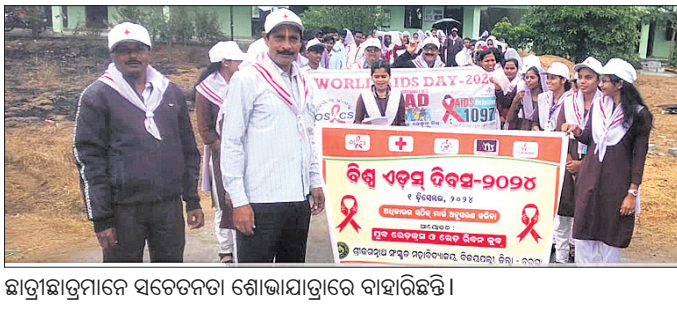
ଛାତ୍ରାଛାତ୍ରୀମାନେ ସଚେତନତା ଶୋଭାଯାତ୍ରାରେ ବାହାରିଛନ୍ତି।

ଅନ୍ତର୍ଯ୍ୟାମୀ ପଣ୍ଡା ପୁଷ୍ୟ ଅତିଥି, ଅଧ୍ୟାପକ ରୁପାଶ୍ରମ ଦାଶ ପୁଷ୍ୟବନ୍ଧୁ ଭାବେ ଯୋଗ ଦେଇଥିଲେ। ସୁବ ରେଡକ୍ରସ୍ ସଂସ୍ଥା ମହାବିଦ୍ୟାଳୟର ଯୁବ ଯୁବତୀମାନେ ଏଡ଼ସ୍ ରୁ ବର୍ତ୍ତମାନ ଏକମାତ୍ର ଉପାୟ ବୋଲି କହିଥିଲେ।