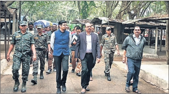
ଆରତିସି ଏବଂ ଜିଲାପାଳ ମଣ୍ଡଳ ପରିବର୍ତ୍ତନ କରୁଛନ୍ତି।

ବରଗଡ଼, ୧୧୨ (ପ୍ରମୋଦ ଖମାରି) ପ୍ରତିନିଧି ଉପସ୍ଥିତିରେ ଭୋଟର ଚାଲିକାର ସଂକ୍ଷିପ୍ତ ସଂଗୋଧନ କାର୍ଯ୍ୟକ୍ରମ-୨୦୨୪ ଉପଲକ୍ଷେ ଆୟୋଜିତ କାର୍ଯ୍ୟକ୍ରମର ସମାପ୍ତ ହୋଇଛି।