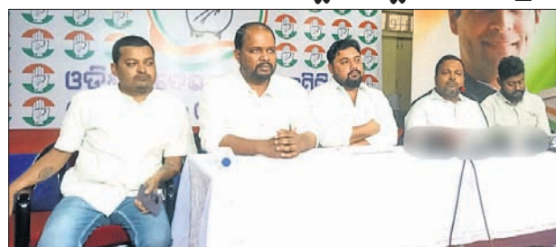
କଂଗ୍ରେସ ଭବନରେ ରବିବାର ଖବରଦାତା ସମ୍ମିଳନୀରେ କଂଗ୍ରେସ ନେତାମାନେ।