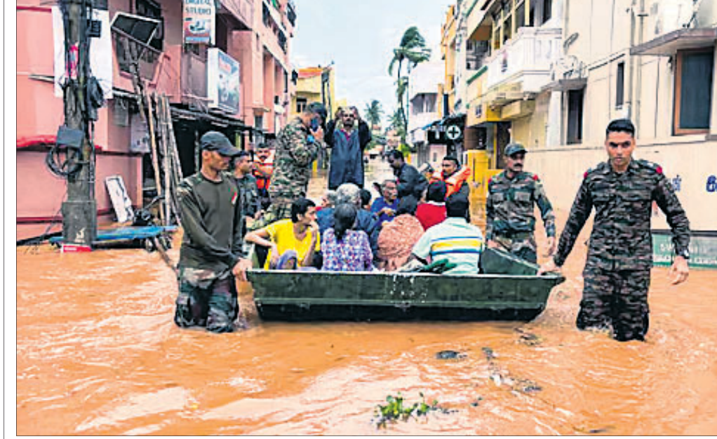
ପଶ୍ଚିମବଙ୍ଗରେ ପାଣିଭରିତ ରହିଥିବା ଲୋକମାନଙ୍କୁ ସେନା ଯବାନମାନେ ଉଦ୍ଧାର କରୁଛନ୍ତି।

କାଶ୍ ପଟେଲ ଏହାକୁ ଏକ ଆମେରିକୀୟ ଗୋପୀନାଥ ଗୋଷ୍ଠୀ କୃତମ ପ୍ରଶଂସା ଭାବେ କରାଯାଇଥିଲା।