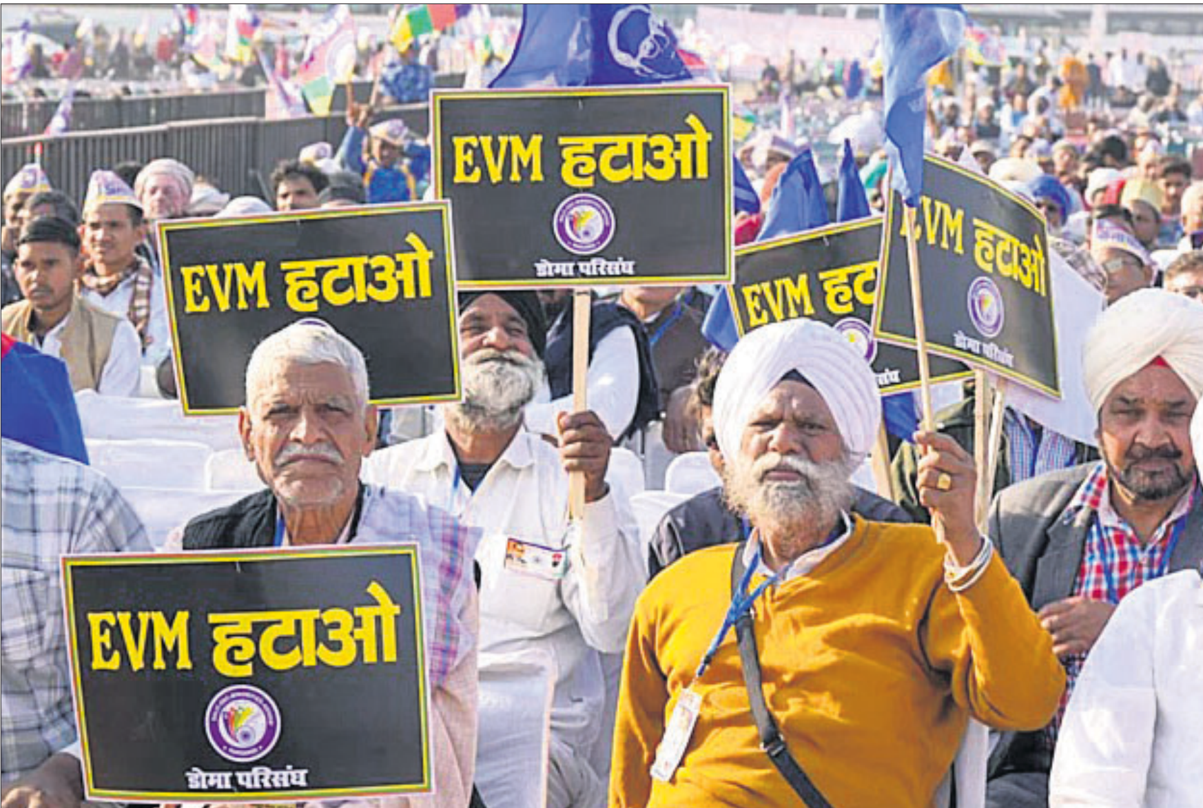
ନୂଆଦିଲ୍ଲୀର ରାମଲୀଳା ମେଦାନରେ ରବିବାର ଚାଲିଥିବା କଂଗ୍ରେସର ସମିଧାନ ସୁରକ୍ଷା ସଭାରେ ବକାୟ ସମର୍ଥକମାନେ ହାତରେ ଲାଗିଏବୁ ବିରୋଧୀ ପ୍ଲାକାର୍ଡ ଧରି ବିରୋଧ ପ୍ରଦର୍ଶନ କରୁଛନ୍ତି।