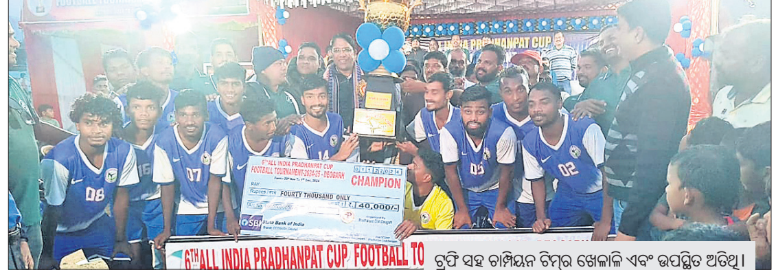
ଟ୍ରଫି ସହ ଚାମ୍ପିୟନ ଟିମର ଖେଳାଳି ଏବଂ ଉପସ୍ଥିତ ଅତିଥି ।

ଦେବଗଡ଼ସ୍ଥିତ ପ୍ରଧାନପାଟ ଛକ ଆନୁକୁଲ୍ୟରେ ସ୍ଥାନୀୟ ଭବିଷ୍ୟତ ଗାନ୍ଧୀ ଷ୍ଟାଡିୟମରେ ଗତ ୨୫ ତାରିଖଠାରୁ ଆରମ୍ଭ ହୋଇଥିବା ଷଷ୍ଠ ସର୍ବଭାରତୀୟ 'ପ୍ରଧାନପାଟ କପ' ପୁରସ୍କାର ଉତ୍ସବର ଉଦ୍‌ଘାଟିତ ହୋଇଯାଇଛି ।