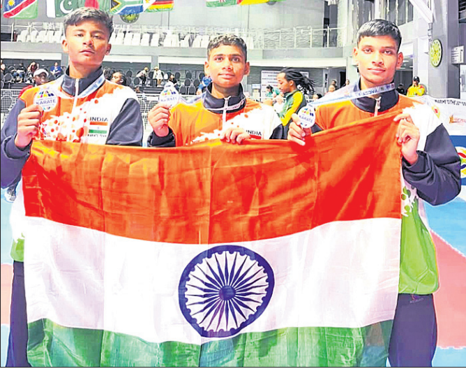
ଚାମ୍ପିୟନଶିପ୍ରେ ଭାଗ ନେଇଥିବା ରାଜରକେଲାର କରାଟେକାର।

ଦକ୍ଷିଣ ଆଫିକାର ତର୍ବାନଠାରେ ୧୧ତମ କନମେଣ୍ଟସ କରାଟେ ଚାମ୍ପିୟନଶିପ୍ ଉଦ୍‌ଘାଟିତ ହୋଇଯାଇଛି। ଏହି ଚାମ୍ପିୟନଶିପ୍ ପାଇଁ ଭାରତୀୟ ଦଳରେ ଓଡ଼ିଶାରୁ ୨୫ ଜଣ କରାଟେକାର ଅଂଶଗ୍ରହଣ କରିଥିଲେ।