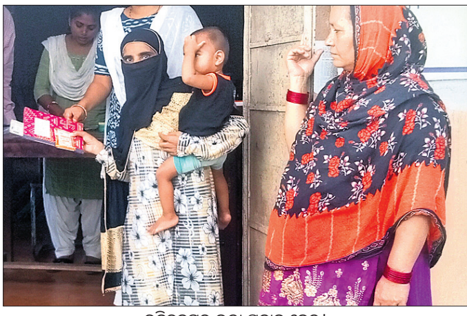
ଉଦ୍‌ବିଗ୍ନରେ ଭଉଁ ପ୍ରଦାନ କେନ୍ଦ୍ର।

କାତ୍ୟାଣୀ ସାମାଜିକ ନିରାପତ୍ତା କାର୍ଯ୍ୟକ୍ରମ ମାଧ୍ୟମରେ ବୁଢ଼ାବୁଢ଼, ଭିକ୍ଷୁମାନ, ଅନଗ୍ରସର ଓ ଅବହେଳିତ ବ୍ୟକ୍ତି ବଶେଷକୁ ସରକାର ପ୍ରତି ମାସରେ ଭତ୍ତା ପ୍ରଦାନ କରୁଛନ୍ତି। ତେବେ ଉକ୍ତ ହିତାଧିକାରୀ ମୃତ କିମ୍ବା ଅନ୍ୟତ୍ର ସ୍ଥାନାନ୍ତର ହେଉଥିଲେ ମଧ୍ୟ ସେମାନଙ୍କ ନାଁ ଚାଲିକାରୁ କଟୁନାହିଁ।