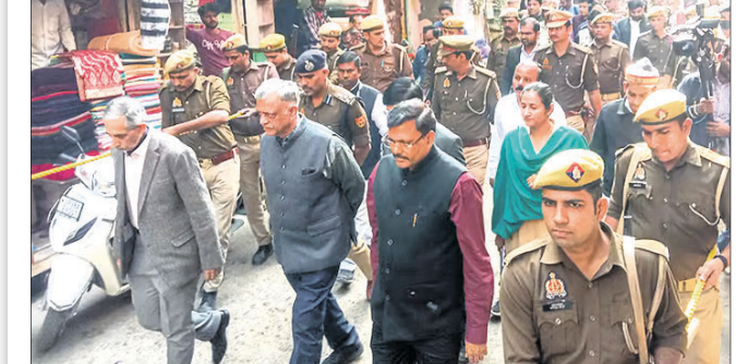
ସମ୍ବଲରେ ନ୍ୟାୟିକ କମିଶନ୍ ୩ ସଦସ୍ୟ ଗୁଡ଼ିକ ଅନୁଧ୍ୟାନ କରୁଛନ୍ତି।

ଉତ୍ତରପ୍ରଦେଶର ସମ୍ବଲରେ ଶାହି ଜାମା ମସଜିଦ୍ରେ ସର୍ବୋଚ୍ଚ ବେଳେ ନରେନ୍ଦ୍ର ମୋଦିଙ୍କୁ ନିମନ୍ତ୍ରଣ କରିବା ପାଇଁ ନ୍ୟାୟିକ କମିଶନର ସଦସ୍ୟମାନେ ହନୁମନ୍ତ ଯେଠାରେ ପହଞ୍ଚିଛନ୍ତି।