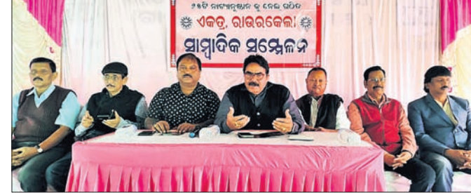
ଖବରଦାତା ସମ୍ମିଳନୀରେ ଉପସ୍ଥିତ ସଭ୍ୟମାନେ।

ରାଜରକେଲା, ୧୧୨ (ସଙ୍ଗୀତା ଜେନା) ରାଜରକେଲା ଇସ୍ମାତ ନାଟ୍ୟ ମହୋତ୍ସବର ଉଦ୍‌ଘାଟନା କାର୍ଯ୍ୟକ୍ରମରେ ସହରର ୨୫ଟି ନାଟ୍ୟମଣ୍ଡଳରୁ ଉଦ୍‌ଘାଟନା କାର୍ଯ୍ୟକ୍ରମରେ ଉପସ୍ଥିତ ସଭ୍ୟମାନେ।