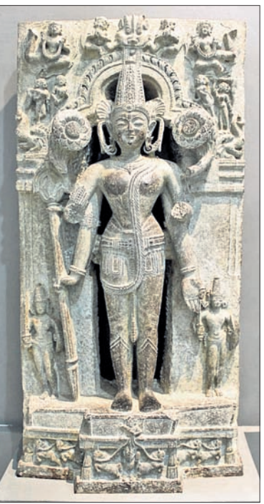
କୋଣାର୍କ ସଂଗ୍ରହାଳୟରେ ଥିବା ସୂର୍ଯ୍ୟ-ଶିବ ବିଗ୍ରହ।