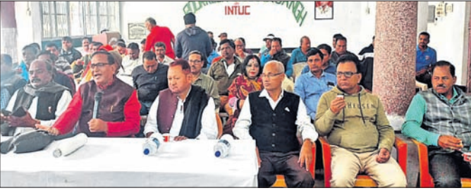
ଆରବ୍‌ଏସ୍‌ଏସ୍ କାର୍ଯ୍ୟକ୍ରମରେ ଆୟୋଜିତ ଖବରଦାତା ସମ୍ମିଳନୀରେ ଉପସ୍ଥିତ ସଭ୍ୟମାନେ।

ସୁନ୍ଦରଗଡ଼ ଜିଲାର ଏକ ପ୍ରମୁଖ ଲୋହପଥର ମାଲ୍‌ହୁ ଚାଲୁଥିବା ସେଲ୍ ପରିଚାଳିତ ରାଜରକେଲା ଇସ୍ମାତ ନାଟ୍ୟମଣ୍ଡଳ (ଆର୍ବସ୍‌ଏସ୍) ଆଦାନା ଭୁବ୍ ହାତରେ ଚଳେ ବୋଲି ଉକ୍ତ ମାଲ୍‌ହୁର ଉଦ୍‌ଘାଟନା କ୍ରମରେ ୨ ମିଲିୟନ ଟଙ୍କା ୭ ମିଲିୟନ ଟଙ୍କା ବୃଦ୍ଧି କରିବା ସହ ୨୫ ବର୍ଷ ପାଇଁ ଦୀର୍ଘମଧ୍ୟା ରୁକ୍ଷିତା କରାଯାଇଛି।