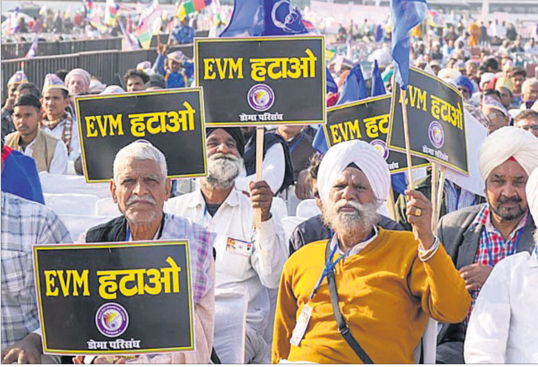
ନୂଆଦିଲ୍ଲୀର ରାମଲୀଳା ମେଦାନରେ ରବିବାର ଚାଲିଥିବା କଂଗ୍ରେସର ସମିଧାନ ସୁରକ୍ଷା ସଭାରେ ଦଳୀୟ ସମର୍ଥକମାନେ ହାତରେ ଲାଗିଏନୁ ବିରୋଧୀ ପ୍ଲାକାର୍ଡ ଧରି ବିରୋଧ ପ୍ରଦର୍ଶନ କରୁଛନ୍ତି।