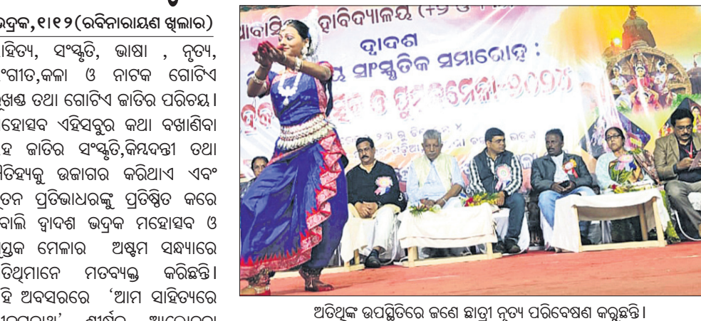
ଅତିଥିଙ୍କ ଉପସ୍ଥିତିରେ ଜଣେ ଛାତ୍ରୀ ନୃତ୍ୟ ପରିବେଷଣ କରୁଛନ୍ତି।