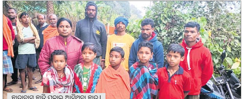
ଛାତ୍ରାବାସ ଛାଡ଼ି ପଳାଇ ଆସିଥିବା ଛାତ୍ର ।