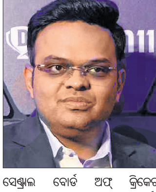
ସେଣ୍ଟ୍ରାଲ ବୋର୍ଡ ଅଫ୍ କ୍ରିକେଟ୍ ଅହମଦାବାଦ (ସିସିସି)ରେ କାର୍ଯ୍ୟ ନ୍ୟୁଜିଲ୍ୟାଣ୍ଡର ଗ୍ରେଗ୍ ବାକଲେ ଚୁଟାୟ ଥିବ ସଭାପତି ଦୌଡ଼କୁ ଓହରିବା ପରେ ଏକମାତ୍ର ପ୍ରତ୍ୟାଶୀ ଭାବରେ ଶାହା ନାମାଙ୍କନ ଦାଖଲ କରିଥିଲେ। ଭାରତୀୟ କ୍ରିକେଟ୍ ସହ ଯୋଡ଼ିହେବା ପୂର୍ବରୁ ୨୦୦୯ରେ ଶାହା ପ୍ରଥମେ