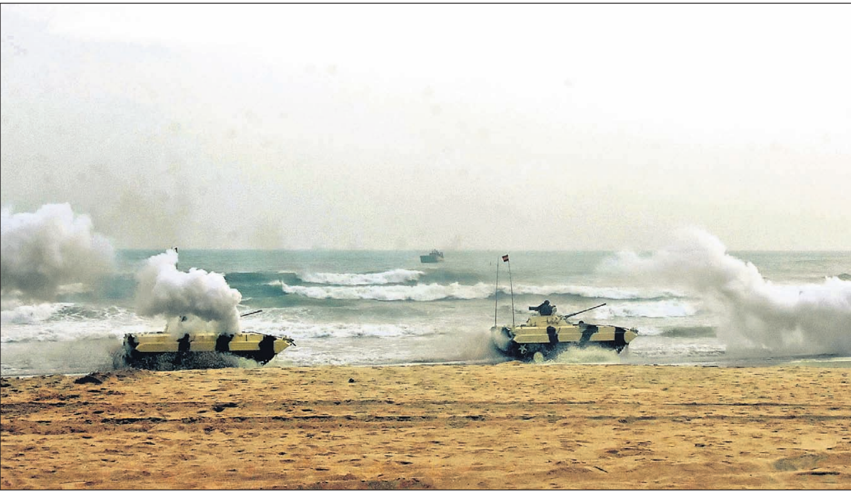
ନୌସେନା ବିକସ ପାଳନର ଅନ୍ୟବନ୍ଧିତ ପୂର୍ବରୁ ରବିବାର ପୁରୀ ସମୁଦ୍ର ବେଳାଭୂମିରେ ପ୍ରଦର୍ଶିତ ହୁଏ କୌଶଳ

ପ୍ରମୁଖ ଘୋରୁ ସୃଷ୍ଟି ହେଉଥିବା ସମ୍ପର୍କ ବିପଦ ସାମାଜିକ ଓ ପାରିବାରିକ ସମ୍ପର୍କ କ୍ଷେତ୍ରରେ ମଧ୍ୟ ଅତ୍ୟନ୍ତ ସୃଷ୍ଟି କରୁଛି। ଏକାକି ଛୁଟିରେ ପୋଲିସ୍ ବାହିନୀ କୁଡ଼ିମ ବୁଦ୍ଧିମତ୍ତା ଏବଂ ଆକାଂକ୍ଷା ଭାରତକୁ ନେଇ ଦେଶର ଏଆଇ ଶକ୍ତିକୁ ଉପଯୋଗ ପୂର୍ବକ ଏହି ଆହ୍ୱାନକୁ ସୁଯୋଗରେ ପରିବର୍ତ୍ତନ କରିବା ଉଚିତ ବୋଲି ପ୍ରଧାନମନ୍ତ୍ରୀ ଆହ୍ୱାନ ଦେଇଛନ୍ତି। କେବଳ ଏତିକି ନୁହେଁ, ସ୍ମାର୍ଟ ପୋଲିସ୍ ପ୍ରଶାସନର ମନୁକୁ ମଧ୍ୟ ଅଧିକ ବ୍ୟାପକ କରିବାକୁ ହେବ। ପୋଲିସକୁ ଅଧିକ ରଖିବାକୁ, ନିଷ୍ଠାପର, ଅନୁକୂଳ, ବିଶ୍ୱାସୀନ ଓ ସ୍ୱଚ୍ଛ ହେବାକୁ ପଡ଼ିବ। ସହରାଞ୍ଚଳ ପୋଲିସ୍ ବ୍ୟବସ୍ଥାରେ ନିଆଯାଇଥିବା ପଦକ୍ଷେପକୁ ପ୍ରଶଂସା କରିବା ସହ ଦେଶର ୧୦୦ଟି ସହରରେ ପଦକ୍ଷେପକୁ ସମ୍ପୂର୍ଣ୍ଣ ରୂପେ କାର୍ଯ୍ୟକାରୀ କରିବାକୁ ପରାମର୍ଶ ଦେଇଛନ୍ତି ବୋଲି ସରକାରଙ୍କ ପକ୍ଷରୁ ପୃଷ୍ଠା-୨