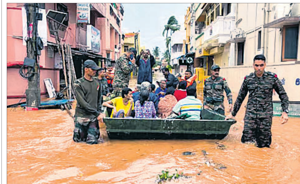
ପଶ୍ଚିମବଙ୍ଗରେ ପାଣିଭରଣରେ ରହିଥିବା ଲୋକମାନଙ୍କୁ ସେନା ଯବାନମାନେ ଉଦ୍ଧାର କରୁଛନ୍ତି।

କରାଯାଇଥିବା। କାଶ୍ ପଟେଲ ଆମେରିକାର କାଶ୍ ପଟେଲ ପ୍ରଭାସ ପର ଷ ଦ ର ଅଧିକାରୀ ଭାବେ କାର୍ଯ୍ୟ କରିଛନ୍ତି।