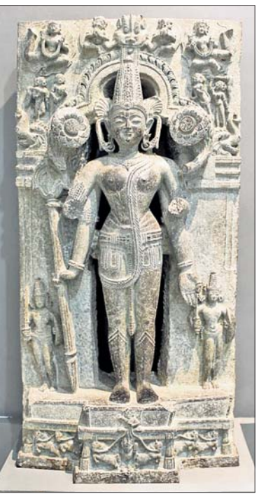
କୋଣାର୍କ ସଂଗ୍ରହାଳୟରେ ଥିବା ସୂର୍ଯ୍ୟ-ଶିବ ବିଗ୍ରହ ।