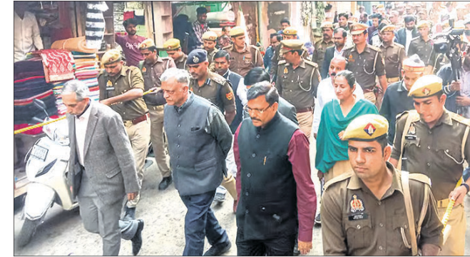
ସମ୍ବଲରେ ନ୍ୟାୟିକ କମିଶନର ୩ ସଦସ୍ୟ ସ୍ଥିତ ଅନୁଧ୍ୟାନ କରୁଛନ୍ତି।

ପରିବର୍ତ୍ତନ କରିଛନ୍ତି। ସେମାନେ ପୁଣିଥରେ ଆସିବେ ବୋଲି ଡିଜିଟାଲ କମିଶନର