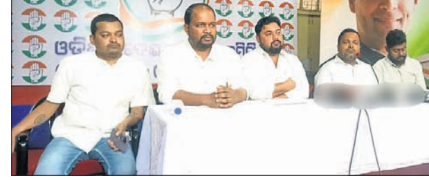
କଂଗ୍ରେସ ଭବନଠାରେ ରବିବାର ଖବରଦାତା ସମ୍ମିଳନୀରେ କଂଗ୍ରେସ ନେତାମାନେ।