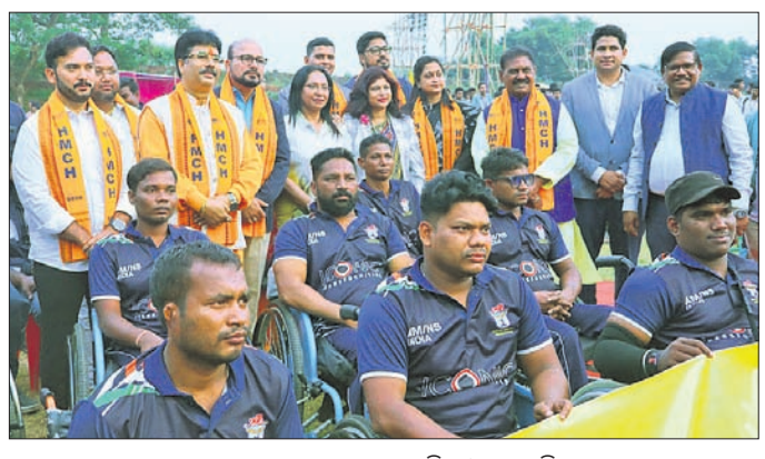
ଭଦ୍ରାଚଳ ଅବସରରେ ଅତିଥି ଓ ଖେଳାଳି ।

ଭୁବନେଶ୍ୱର, ୨୧୧୨ (ତପନ ସାଲ୍) ଓଡ଼ିଶା ବିଦ୍ୟାଳୟ ସ୍କୁଲରେ ଶିକ୍ଷା ଆରମ୍ଭ ହେବ।