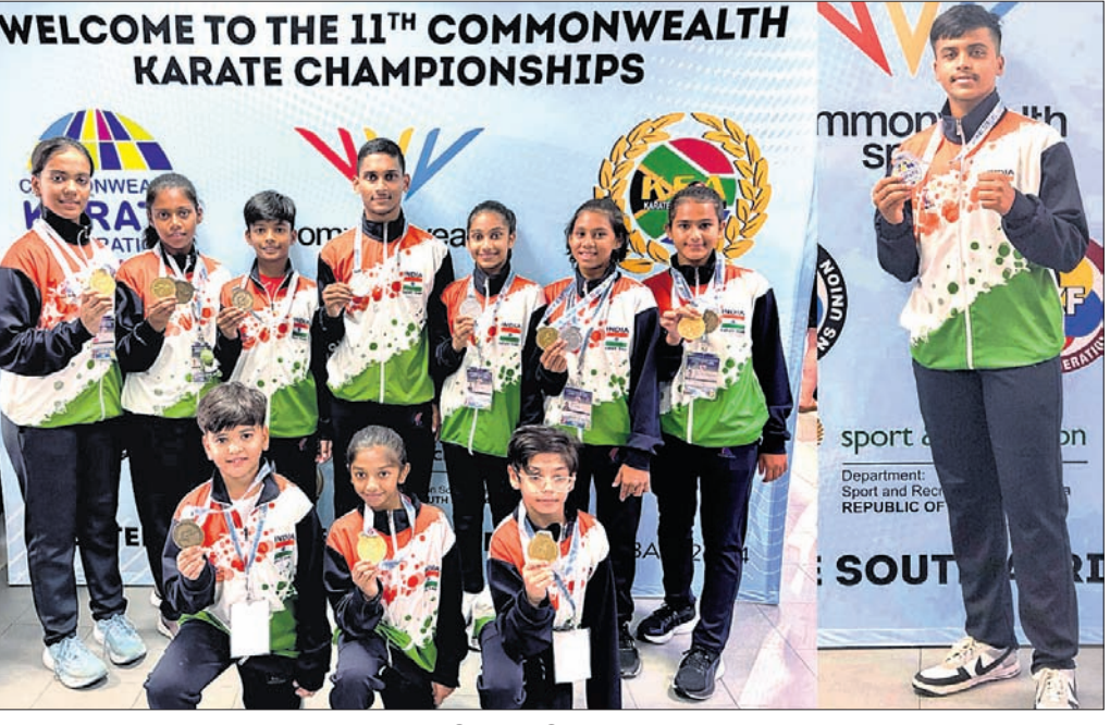
ପଦକ ବିଜେତା ଓଡ଼ିଶା କରାଗେକା ।

ଭୁବନେଶ୍ୱର, ୨୧୧୨ (ତପନ ସାଲ୍) ଦକ୍ଷିଣ ଆଫ୍ରିକାରେ ଚଳିଥିବା ୧୧ତମ କମନ୍ୱେଲଥ କାରାଟେ ଚାମ୍ପିୟନସିପ୍ରେ ଓଡ଼ିଶା କରାଗେକାମାନେ ଭାରତ ପକ୍ଷରୁ ପ୍ରତିନିଧିତ୍ୱ କରି ୧୧ ପଦକ ହାସଲ କରିଛନ୍ତି।