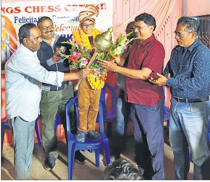
ସାହିକ ସାହିକଙ୍କୁ ଅତିଥିମାନେ ସମର୍ଥନ କରୁଛନ୍ତି ।

ଭୁବନେଶ୍ୱର, ୨୧୧୨ (ତପନ ସାଲ୍) ଏବଂ କେନ୍ଦ୍ରାପଡ଼ା ଜିଲ୍ଲା ଚେସ୍ ସଂଘର ଲଗାଲଗାତେ ଅନୁଷ୍ଠିତ ପିଟେ ଫ୍ଲୋର କ୍ୱାର୍ଟରଫାଇନାଲ ପର୍ଯ୍ୟାୟକୁ ଉନ୍ନତ ହେବେ।