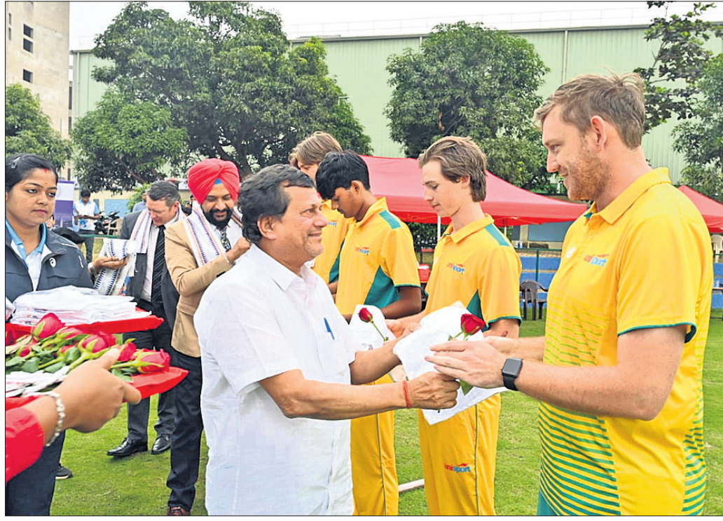
କିଟ୍ ଓ କିଟ୍ ପ୍ରତିଷ୍ଠା ଅଧିକାରୀଙ୍କୁ ପ୍ରଦାନ ଓ ଅନ୍ୟ ଅତିଥିମାନେ ଅଷ୍ଟ୍ରେଲିଆ ବିଶ୍ୱବିଦ୍ୟାଳୟ ଦଳର ଖେଳାଳିଙ୍କ ସହ ପରିଚିତ ହେଉଛନ୍ତି ।

ଅର୍ଥ ଦିନୀୟ ବିବେଚିତ କରାଯାଇଥିଲା। ସିରିଜର ପରବର୍ତ୍ତୀ ଦୁଇଟି ଟି୨୦ ମ୍ୟାଚ୍ ମଙ୍ଗଳବାର ଅନୁଷ୍ଠିତ ହେବ।