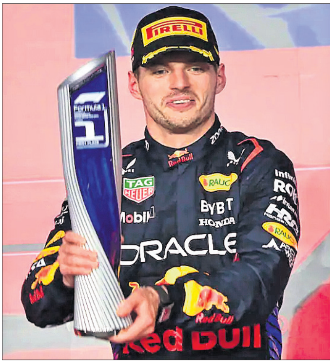
ପ୍ରି ଫର୍ସ୍ଟ ମାକ୍ସ ଭର୍ଷ୍ଟାପେନ୍ ।

ମାକ୍ସ ଭର୍ଷ୍ଟାପେନ୍ (୧: ୩୧: ୦୫.୩୨୩) ଘଟଣାବହୁଳ କାତାର ଫର୍ମୁଲାର ଫୋର୍ମରେ ରେସ୍ ଜିତିଛନ୍ତି।