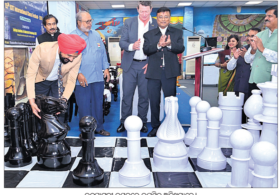
ଉଦ୍ଘାଟନା ଉତ୍ସବରେ ଉପସ୍ଥିତ ଅତିଥିମାନେ ।

୩ ବର୍ଷ ପାଇଁ ପୁରସ୍କାର ରାଶି ୬୦ ଲକ୍ଷ ୩୦ ହେକ୍ଟୋଗ୍ରାମ୍ମ ନେକେ ୧୨୦୦ ଖେଳାଳି