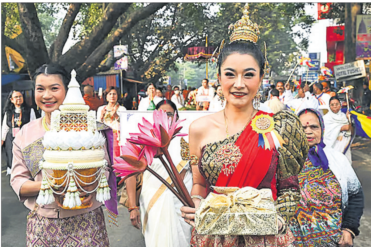
ବିହାରର ବୋଧଗୟାଠାରେ ଅନୁଷ୍ଠିତ ୧୯ତମ ଅନ୍ତର୍ଜାତୀୟ ତ୍ରିପିଟକ ଆବୃତ୍ତି ଉତ୍ସବରେ ଥାଇଲାଣ୍ଡର ବୌଦ୍ଧ ଧର୍ମାବଲମ୍ବୀ ।