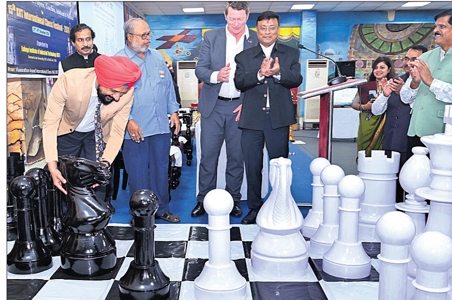
ଉଦ୍‌ଘାଟନା ଉତ୍ସବରେ ଉପସ୍ଥିତ ଅତିଥିମାନେ।

୩ ବର୍ଷ ପାଇଁ ପୁରସ୍କାର ରାଶି ୬୦ ଲକ୍ଷ ୩୦ ଦଶଲକ୍ଷ ଭାଗନେଲେ ୧୨୦୦ ଖେଳାଳି