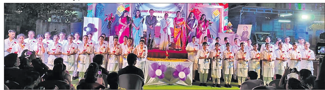
ନୂଆ ଛାତ୍ରାଛାତ୍ରୀଙ୍କ ଶପଥ ପାଠ କରୁଛନ୍ତି ।

ମାଲକାନଗିରି ଜିଲ୍ଲା ଘଡ଼େଇ ଆବାସିକ ମହାବିଦ୍ୟାଳୟ ତରଫରୁ ବିଭିନ୍ନ ନୂଆ କଲେଜ ପ୍ରଥମ ବର୍ଷ ଛାତ୍ରାଛାତ୍ରୀଙ୍କ ଲାମ୍ପ ଲାଗିତ ଓ ଶପଥ ପାଠ ଉତ୍ସବ ସୋମବାର ଅନୁଷ୍ଠିତ ହୋଇ ଯାଇଛି ।