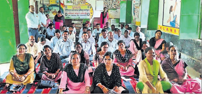
ଉଦ୍‌ଯାପନ କାର୍ଯ୍ୟକ୍ରମରେ ତାଲିମ ନେଇଥିବା ଶିକ୍ଷୟିତ୍ରୀ ଶିକ୍ଷକ ।

ପତିଆ ଥାନା ସଦର ପାଲୀଗୁଡ଼ା ଗ୍ରାମରେ ସାପ କାମୁଡ଼ାରେ ଜଣେ ଯୁବ ଚାଷୀଙ୍କର ଚିକିତ୍ସାଧୀନ ଅବସ୍ଥାରେ ମୃତ୍ୟୁ ଘଟିଛି ।