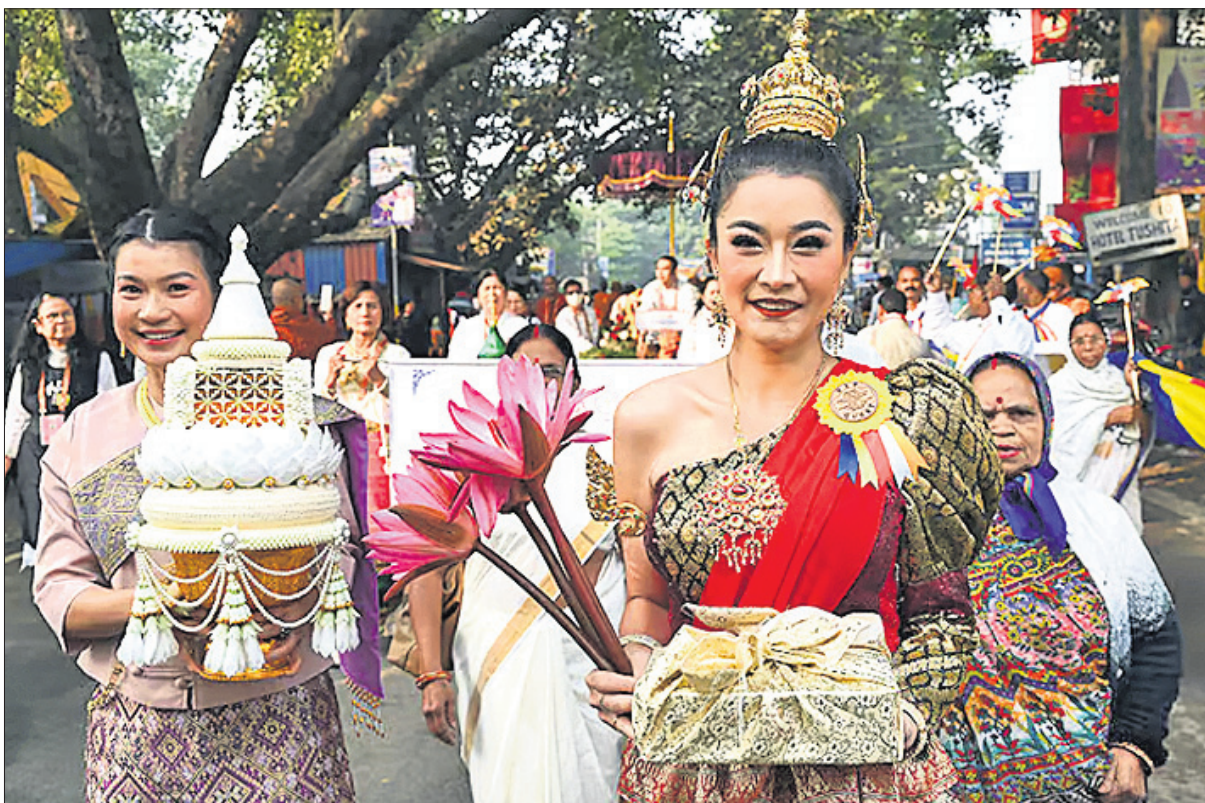
ବିହାରର ବୋଧଗୟାଠାରେ ଅନୁଷ୍ଠିତ ୧୯ତମ ଅନ୍ତର୍ଜାତୀୟ ତ୍ରିପିଟକ ଆବୃତ୍ତି ଉତ୍ସବରେ ଆଇଲାଣ୍ଡର ବୌଦ୍ଧ ଧର୍ମାବଲମ୍ବୀ ।