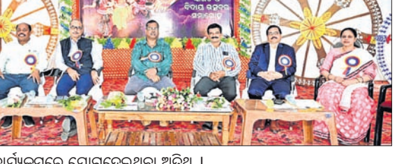
କାର୍ଯ୍ୟକ୍ରମରେ ଯୋଗଦେଇଥିବା ଅତିଥି ।