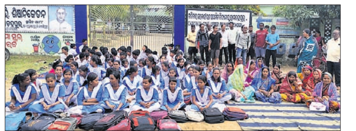
ଧାରଣାରେ ବସିଥିବା ଛାତ୍ରୀଛାତ୍ରୀ ଓ ଅଭିଭାବକମାନେ ।

ଚୈକାଳ ଉତ୍ସାହ ବିଦ୍ୟାଳୟ ରାମଚନ୍ଦ୍ରପୁର ■ ବାରମ୍ବାର ଶିକ୍ଷକଙ୍କ ବଦଳିକୁ ନେଇ ଅସନ୍ତୋଷ ■ ବିଜ୍ଞାନ ଶିକ୍ଷକଙ୍କୁ ଫେରାଇ ଆଣିବା ଦାବି