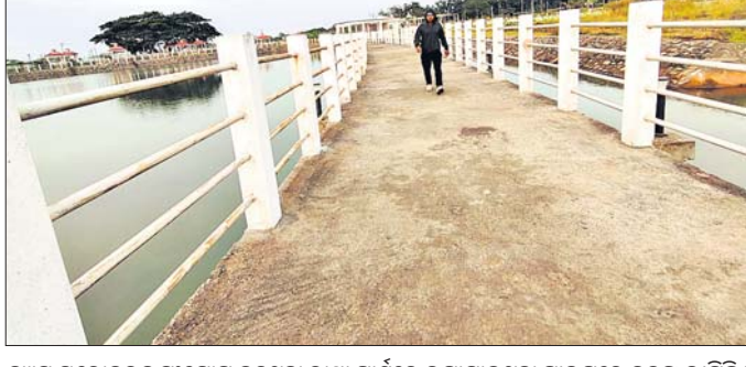
ବ୍ୟାସ ପରୋବରକୁ ବ୍ୟବହାର କରୁଥିବା ରାସ୍ତା ପାର୍ଶ୍ୱରେ ଲଗାଯାଇଥିବା ପାଇପରେ କଳଙ୍କ ଲାଗିଛି।

ମୋରମ ବାହାରକୁ ଚାଲାଇ ହେଉଛି। ଲୁଚ୍ ଖଣିଜ ସମ୍ପଦ ବାଲି, ଗ୍ରାନାଇଟ୍, ଅଣାଓଡ଼ିଆ ଠିକାସଂସ୍ଥା କ୍ରିଷ୍ଣା ବିଳତର୍ପ ଡିଏମ୍‌ଏଫ୍‌ରୁ ଆବେଷିତ ଅନୁଦାନକୁ ସଂଗ୍ରହ କରି ବ୍ୟବହାର କରିଥିବା ବେଳେ ଏବେ ଆଉ ଏକ ବାହାର ଠିକାସଂସ୍ଥା ଯୋଗୁଁ ମୂଲ୍ୟବାନ ମୋରମ ଲୁଚ୍ କରୁଥିବା ଚଳି ହେଉଛି।