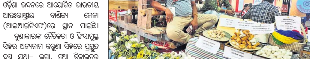
ବାଣିଜ୍ୟମେଳାରେ ପ୍ରଦର୍ଶିତ ହୋଇଥିବା କରୁଣା ସିଦ୍ଧି ବସ୍ତୁ ।