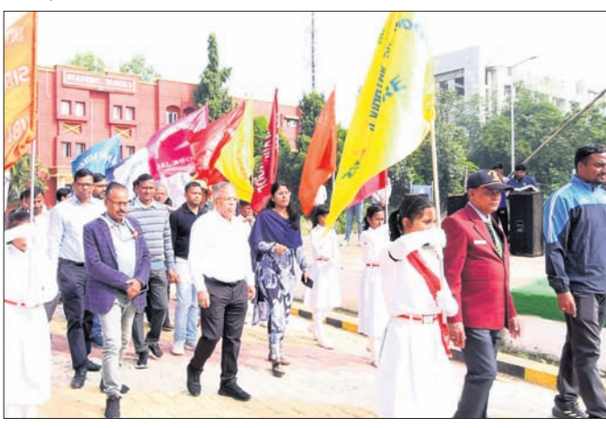
ଉଦ୍‌ଘାଟନା ସମାରୋହରେ କୁଳପତିଙ୍କ ସହ ଅନ୍ୟମାନେ।

ଭାରତରେ ୪୪ ବିଶ୍ୱବିଦ୍ୟାଳୟର ୨୬୦ ଖୋଲା ହେବାର ସମ୍ଭାବନା ଉଚ୍ଚ। ଓଡ଼ିଶା ଦଳର ପ୍ରଥମ ବିଜୟ ହେବାର ସମ୍ଭାବନା ଉଚ୍ଚ। ଓଡ଼ିଶା ଦଳର ପ୍ରଥମ ବିଜୟ ହେବାର ସମ୍ଭାବନା ଉଚ୍ଚ।