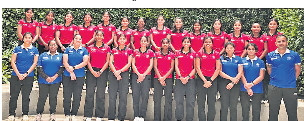
କୃତ୍ରିମ ମହିଳା ଏସିଆ କପ ହକି ଚୂନାମେଣ୍ଟ ପାଇଁ ମଙ୍ଗଳବାର ଓମାନ ଯାତ୍ରା ପୂର୍ବରୁ ଭାରତୀୟ ଦଳ।

ଭୁବନେଶ୍ୱର, ୩୧୨ (ତପନ ସାହୁ) ସର୍ବଭାରତୀୟ ଚେଷ୍ଟା ସଂଘ (ଏଆଇସିଏସ୍) ସହଯୋଗରେ କିଟ୍ ବିଶ୍ୱବିଦ୍ୟାଳୟର ବିଶ୍ୱନାଥୀୟ ଅନ୍ତର୍ଜାତୀୟ ଚେଷ୍ଟା ମହୋତ୍ସବ 'ଏ' ବର୍ଗର ୨ଟି ରାଉଣ୍ଡ ଖେଳ ମଙ୍ଗଳବାର ଅନୁଷ୍ଠିତ ହୋଇଯାଇଛି।