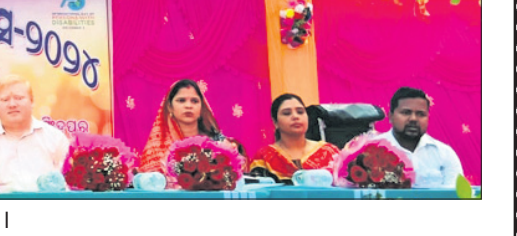
କାର୍ଯ୍ୟକ୍ରମରେ ଯୋଗଦେଇଥିବା ଅନ୍ୟ ଅଧିକାରୀ

କୃଷି ଓ କୃଷକ ସଶକ୍ତିକରଣ ବିଭାଗ ଓଡ଼ିଶା ସରକାର କୃଷି ଓ କୃଷକ ସଶକ୍ତିକରଣ ବିଭାଗ ଓଡ଼ିଶା ସରକାରଙ୍କୁ ସମର୍ଥନ କରାଯାଇଛି ।