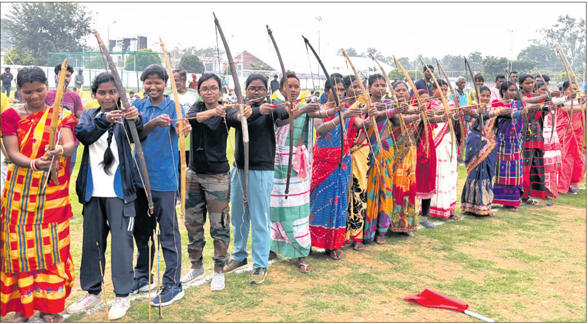
ମୟୂରଭଞ୍ଜ ମହାସଭା ଅବସରରେ ମଙ୍ଗଳବାର ବାରିପଦା ସ୍ଥିତିଭମ ପଡ଼ିଆରେ ମହିଳାମାନଙ୍କୁ ନେଇ ଅନୁଷ୍ଠିତ ଲାଖିବିକ୍ଷା ପ୍ରତିଯୋଗିତା।