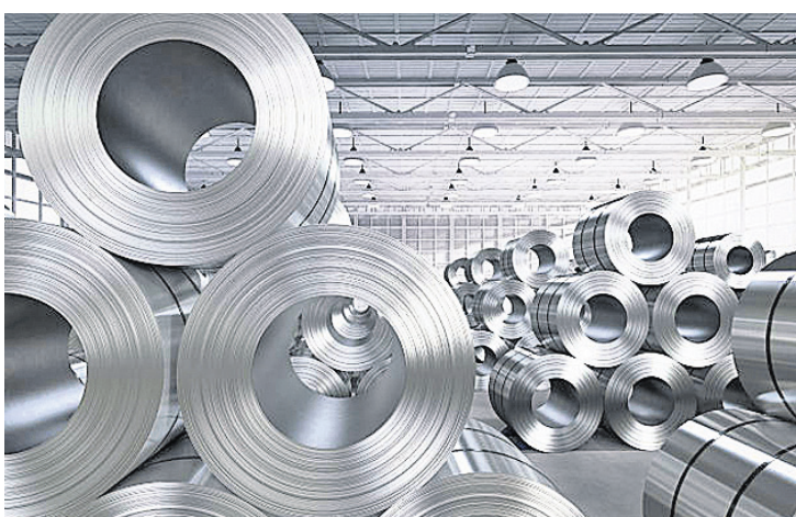
ନୂଆ ଆର୍ଥିକ ଡିମାଣ୍ଡ ଶୁଳ୍କରୁ ଉଦ୍ଧାରଣ ଆନୁମତି ପାଇଁ ନିର୍ଦ୍ଦିଷ୍ଟ ମାତ୍ରା ମିଳିବ