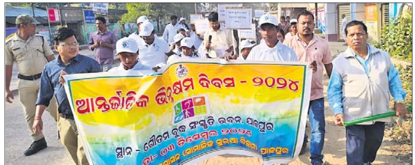
ଭିନ୍ନକ୍ଷମ ଦିବସ ଅବସରରେ ଆୟୋଜିତ ଶୋଭାଯାତ୍ରା।

ଯାଜପୁର ଗଜନ, ୩୧୨ (ପ୍ରୟତ୍ନା ପ୍ରିୟଦର୍ଶିନୀ ମହାନ୍ତି):