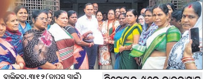
ବାଳିକୁଦା, ୩୧୨ (ପାପସା ସାଲ) ଡିସେମ୍ବର ୯ରେ ରାଜ୍ୟସ୍ତରୀୟ ଉପକ୍ରମ

କରତ୍ୟକ୍ତ ପୁର ୩୧୨ (ପ୍ରମୋଦ କୁମାର ନାୟକ) ସାଧାରଣ ସଂଗ୍ରାମୀଣ ଅଭିଭାବକ କୁହାଯାଉଥିବା ଅଳକାଶ୍ରମ କାଳକ୍ରମେ ତାର ଛୁଟି ହରାଇ ବସିଥିଲା । ଯୋଗାଣ ଅର୍ଦ୍ଧତ ଓ ଡାକର ଗ୍ରାମର ପୁଲ୍ଲଟ ଜେନାଙ୍କ ଘରୁ ଯୋଗାଣ ଚୋରି ହେବା ପରେ ଆନରେ ଅଭିଯୋଗ କରାଯାଇଛି ।