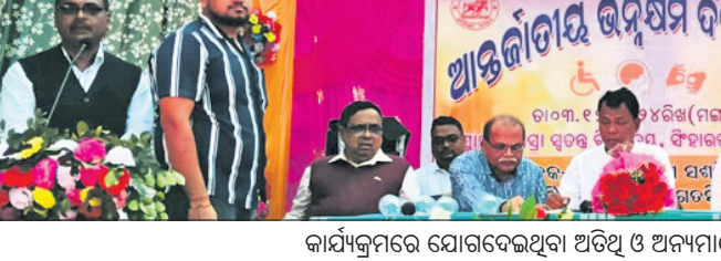
କାର୍ଯ୍ୟକ୍ରମରେ ଯୋଗଦେଇଥିବା ଅନ୍ୟ ଅଧିକାରୀ