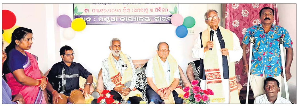
ଆମେଦି ସକ୍ଷମ କାର୍ଯ୍ୟାଳୟ ଉଦଘାଟନା ଉତ୍ସବରେ ମଞ୍ଚାଧିକାରୀ ଅତିଥି ।

ଧର୍ମଶାଳା/କାନ୍ଦାମା, ୩୧୨ (ଶିବପ୍ରସାଦ ମହାନ୍ତି):