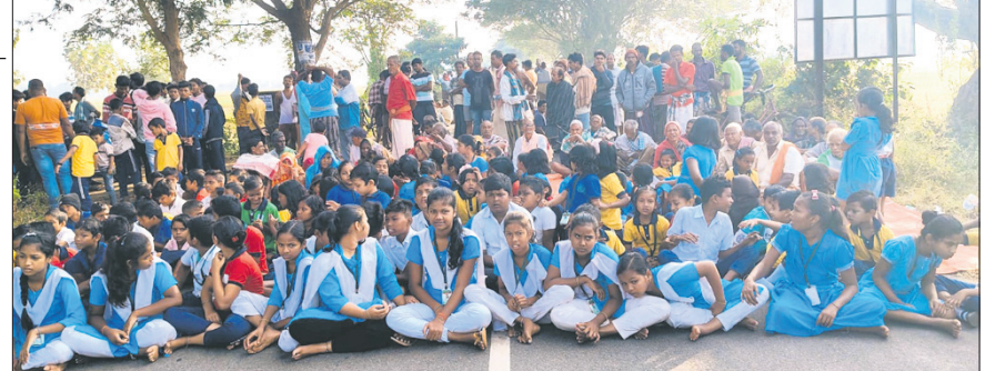
ଧାରଣାରେ ବସିଥିବା ଛାତ୍ରଛାତ୍ରୀ।