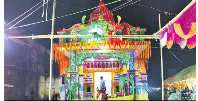
ରାଜକନିକା, ୪।୧୨ (ସଞ୍ଜୟ କୁମାର ଦାଶ)

ରାଜକନିକା ରୁକ୍ମ ଅନ୍ତର୍ଗତ ଚେଷ୍ଟାକ୍ରମରେ କଣ୍ଠକେଶ୍ୱର ମହାଦେବଙ୍କ ମନ୍ଦିର ପ୍ରତିଷ୍ଠା ପାଇଁ ଆବଶ୍ୟକୀୟ ପଦକ୍ଷେପ ଗ୍ରହଣ କରାଯାଇଛି।