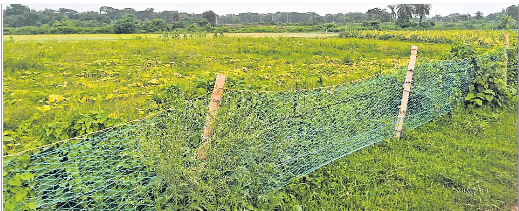
ପଟାପୁଣ୍ଡା, ୪।୧୨ (କଳ୍ପତରୁ ନାୟକ)

ରାଜକନିକା ରୁକ୍ମ ଅନ୍ତର୍ଗତ ଚେଷ୍ଟାକ୍ରମରେ କଣ୍ଠକେଶ୍ୱର ମହାଦେବଙ୍କ ମନ୍ଦିର ପ୍ରତିଷ୍ଠା ପାଇଁ ଆବଶ୍ୟକୀୟ ପଦକ୍ଷେପ ଗ୍ରହଣ କରାଯାଇଛି।