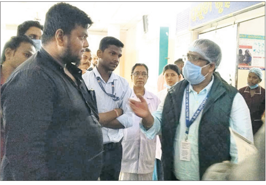
ଅଧିକାରୀଙ୍କ ସହ ଛାତ୍ର ସମ୍ପଦ ପାଠ୍ୟ ପଢ଼ାବଳିରେ ଅଧ୍ୟାପକଙ୍କୁ ଚିମ୍ ପ୍ରଦାନ କରାଯାଇଛି।