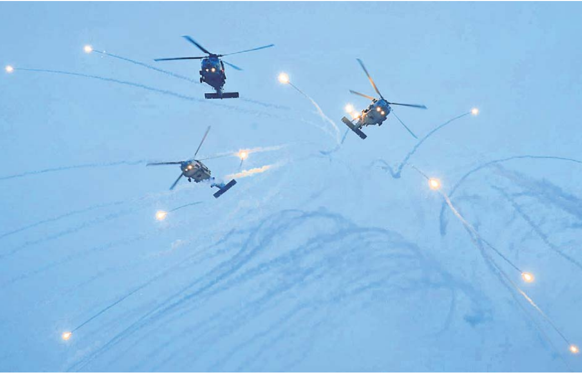
ପୁରୀ ବେଳାଭୂମିରେ ନୌସେନା ଦିବସ ପାଳନ ଅବସରରେ ବୁଧବାର ପ୍ରଦର୍ଶିତ ମୁକ୍ତିକୌଶଳ। (ରିପୋର୍ଟ: ପୁଷ୍ପା-୫)