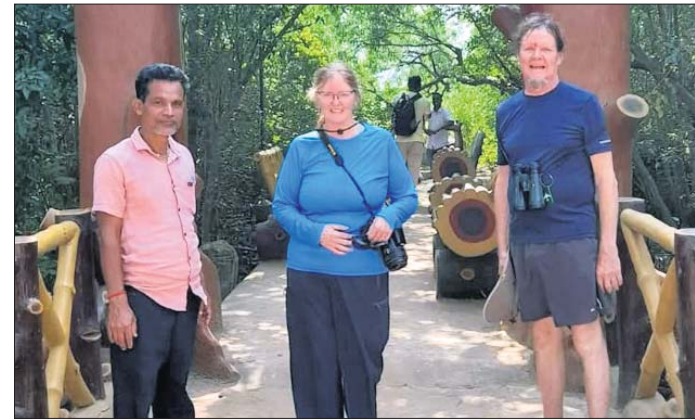
ରାଜନଗର, ୪।୧୨ (ଭାସ୍କର ରାଉତରାୟ)

ଭିତରକନିକାର ଶୋଭା ଉପଭୋଗ କଲେ ବିଦେଶୀ ପର୍ଯ୍ୟଟକ