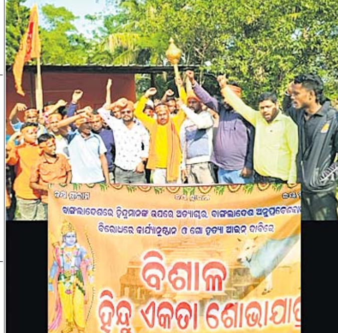
ହିନ୍ଦୁ ଏକତା ମଞ୍ଚର ସଦସ୍ୟମାନେ ଶୋଭାଯାତ୍ରାରେ ସହର ପରିକ୍ରମା କରୁଛନ୍ତି।