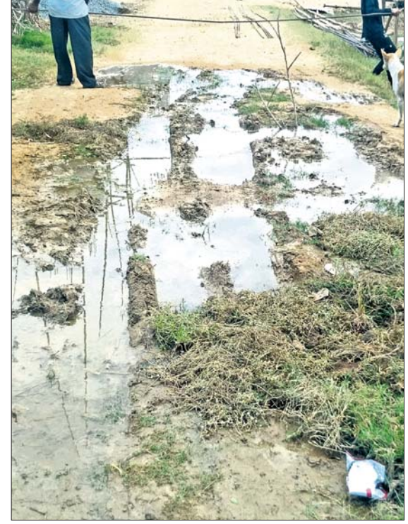
ସପ୍ତକୁରା, ୪।୧୨ (ରବୀନ୍ଦ୍ରନାଥ ବାରିକ)

ରବିବାର ରୁକ୍ମ ଅଧୀନ ବେତାରୀ ଗ୍ରାମରେ ଥିବା ପାନୀୟ ଜଳ ପ୍ରକଳ୍ପର ପାଇପ ବେତାରୀ ହନୁମାନ ମଞ୍ଚପ ନିକଟରେ ୧୮ ଦିନ ହେବ ଫାଟିଯାଇଛି। ଏହି ଉଦ୍‌ବୃତ୍ତ ପାଣି ନିକଟରେ ଥିବା ପାଟିଲା ଧାନ କିଆରି ଓ ଧାନ ଖଜାରେ ମଧ୍ୟ ପଶୁଛି।