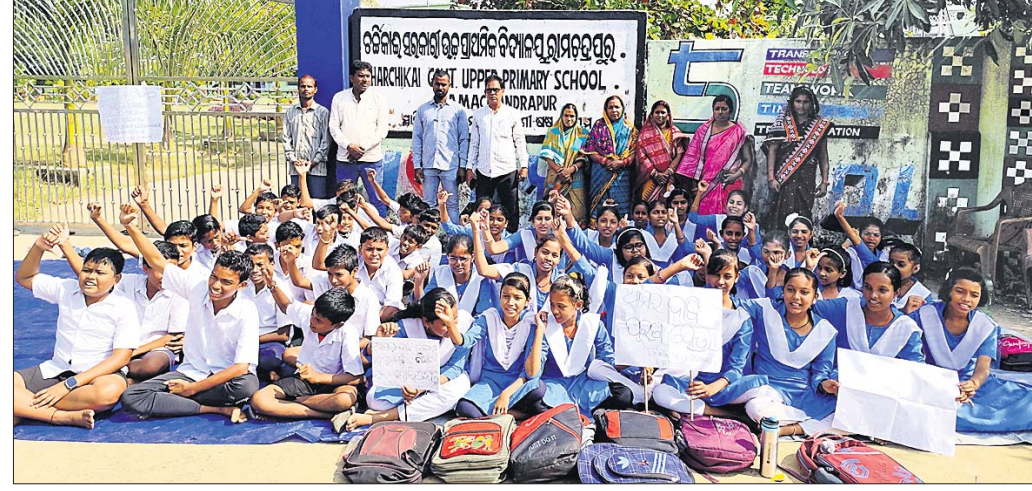
ବିଦ୍ୟାଳୟର ଛାତ୍ରୀଛାତ୍ରୀ ଓ ଅଭିଭାବକମାନେ ରେଟରେ ତାଲା ପକାଇ ଧାରଣା ଦେଇଛନ୍ତି।

ବାଲାଦେଶରେ ହିନ୍ଦୁଙ୍କୁ ପ୍ରତି ଅତ୍ୟାଚାର ଘଟଣା ଉଦ୍‌ବେଗ ସୃଷ୍ଟି କରିଛି। ବାଲାଦେଶରେ ହିନ୍ଦୁଙ୍କୁ ପ୍ରତି ଅତ୍ୟାଚାର ବହୁଥିବା ବେଳେ ରାଜନଗରରେ ଥିବା ବାଲା ଅନୁପ୍ରବେଶକାରୀଙ୍କୁ ହତାଇବାକୁ ଦାବି ଜୋର ଧରିଛି।