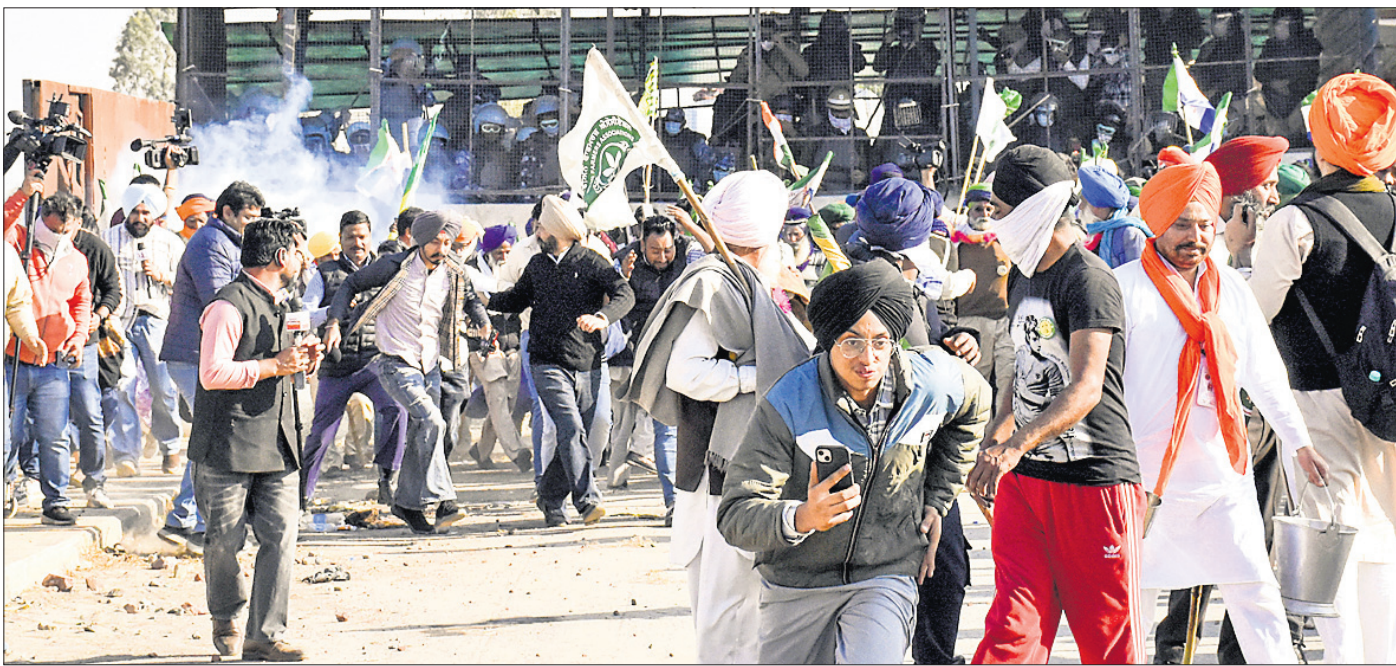
ଏମ୍.ଏସ୍.ପି.କୁ ଆକ୍ରମଣ କରିବା ପାଇଁ ଗୁଳିବାର 'ଦିଲ୍ଲୀ ଚଲୋ' ପଦଯାତ୍ରାରେ ବାହାରିଥିବା କୃଷକଙ୍କ ଉପରେ ଶମ୍ଭୁ ସାମାଜିକ ପୋଲିସ୍ ଲୁହରୁହା ବାସ୍ତୁ ପ୍ରୟୋଗ କରୁଛି।