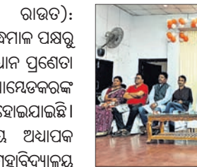
ଆୟତ୍ତକରଣ ପରିବର୍ତ୍ତନ ଦିବସ ପ୍ରସ୍ତୁତି ପାଇଁ ଶୁଭିଚ୍ଛା ମନୋନୀତ ।

ଜାଗ୍ରତ କର୍ମୀମାନଙ୍କ ପକ୍ଷରୁ ଆୟତ୍ତକରଣ ପରିବର୍ତ୍ତନ ଦିବସ । ଜାଗ୍ରତ କର୍ମୀମାନଙ୍କ ପକ୍ଷରୁ ଆୟତ୍ତକରଣ ପରିବର୍ତ୍ତନ ଦିବସ ।