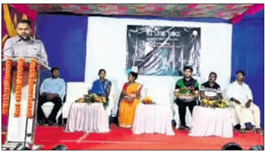
କାର୍ଯ୍ୟକ୍ରମରେ ମଞ୍ଚସ୍ଥାପନ ଅତିଥି ।

ପରିବେଶ, ଜଳବାୟୁ ପରିବର୍ତ୍ତନ ସମ୍ପର୍କିତ ଫିଲ୍ମ ଫେଷ୍ଟିଭାଲ । ପରିବେଶ, ଜଳବାୟୁ ପରିବର୍ତ୍ତନ ସମ୍ପର୍କିତ ଫିଲ୍ମ ଫେଷ୍ଟିଭାଲ ।