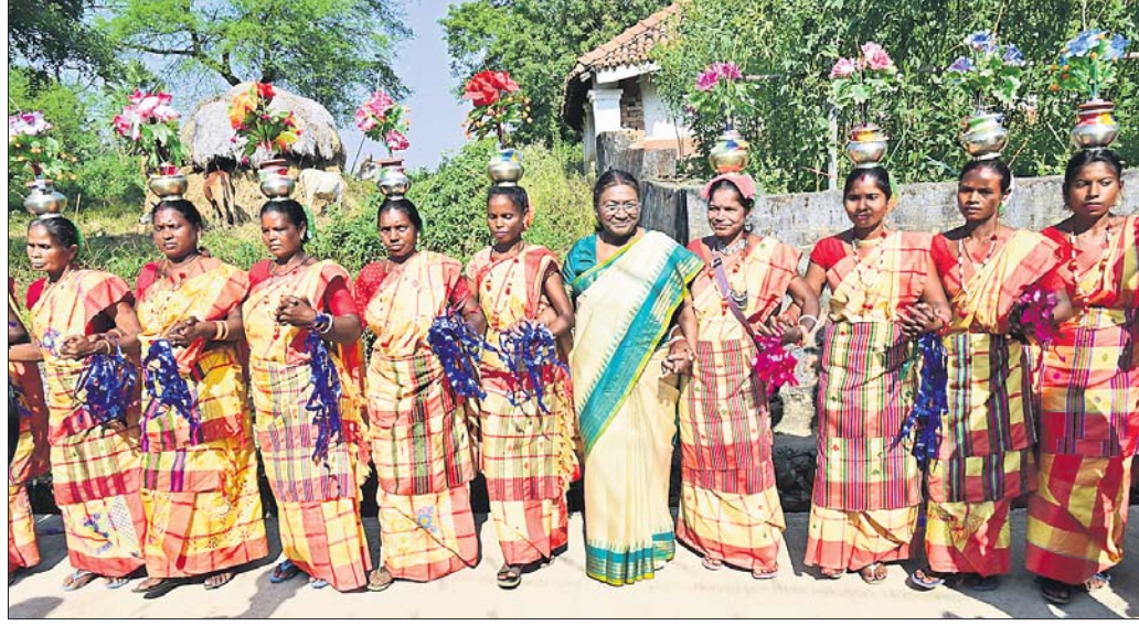
ପାରମ୍ପରିକ ଆଦିବାସୀ ନୃତ୍ୟରେ ସାମିଲ ହୋଇଛନ୍ତି ରାଷ୍ଟ୍ରପତି ଡ୍ରୌପଦୀ ମୁର୍ମୁ।

ପୂର୍ବରୁ ସଂକୀର୍ତ୍ତନ ଓ ପୋଥି ପୂରାଣ ଶୁଣିବାକୁ ଗାଁ ଲୋକେ ଏକାଠି ହେଉଥିଲେ। ସେହି ସମ୍ପର୍କରେ ସମସ୍ତେ ବାନ୍ଧିହୋଇ ରହୁଥିଲେ। ଏବେ ସେହି ସମ୍ପର୍କ ଓ ସ୍ନେହ ଶୁଣା ଭାବ କମିଥିବା ଜଣାପଡ଼ୁଛି। ତେଣୁ ଗାଁର ପୂର୍ବ ଏକତାକୁ ଅସ୍ମୁଣ୍ଡ ରଖିବାକୁ ହେବ। ସମସ୍ତଙ୍କୁ ଏକ ପୁସ୍ତକରେ ବାନ୍ଧି ରଖିବାକୁ ପଡ଼ିବ ବୋଲି ଦୁଇଦିନିଆ ମଧୁରଭଞ୍ଜ ଗସ୍ତରେ ଆସିଥିବା ରାଷ୍ଟ୍ରପତି ଡ୍ରୌପଦୀ ମୁର୍ମୁ କହିଛନ୍ତି।