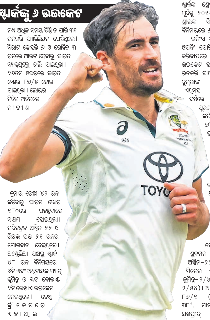
ନୂଆ ରେଣ୍ଡା ୪୨ ରନ କରିବାରୁ ଭାରତ ଷ୍ଟୋର ୧୮୦ରେ ପହଞ୍ଚିବାରେ ସକ୍ଷମ ହୋଇଥିଲା।

ଅଭିଳେଷ୍ ଓଭାଲ ଗ୍ରାଉଣ୍ଡରେ ଶୁକ୍ରବାର ଭାରତ-ଅଷ୍ଟ୍ରେଲିଆ ଦ୍ୱିତୀୟ ତଥା ପିଙ୍କ୍‌ବଲ୍ (ଦିନ/ରାତ୍ର) ଟେଷ୍ଟ ଆରମ୍ଭ ହୋଇଛି। ପ୍ରଥମ ଦିବସରେ ଅଷ୍ଟ୍ରେଲିୟା ଷ୍ଟ୍ରକ୍‌ସ୍ମିତ ମିଡେଲ ଷ୍ଟାର୍କଙ୍କୁ ମୁକାବିଲା କରିବାରେ ଭାରତୀୟ ବ୍ୟାଟର ବିଫଳ ହୋଇଛନ୍ତି।