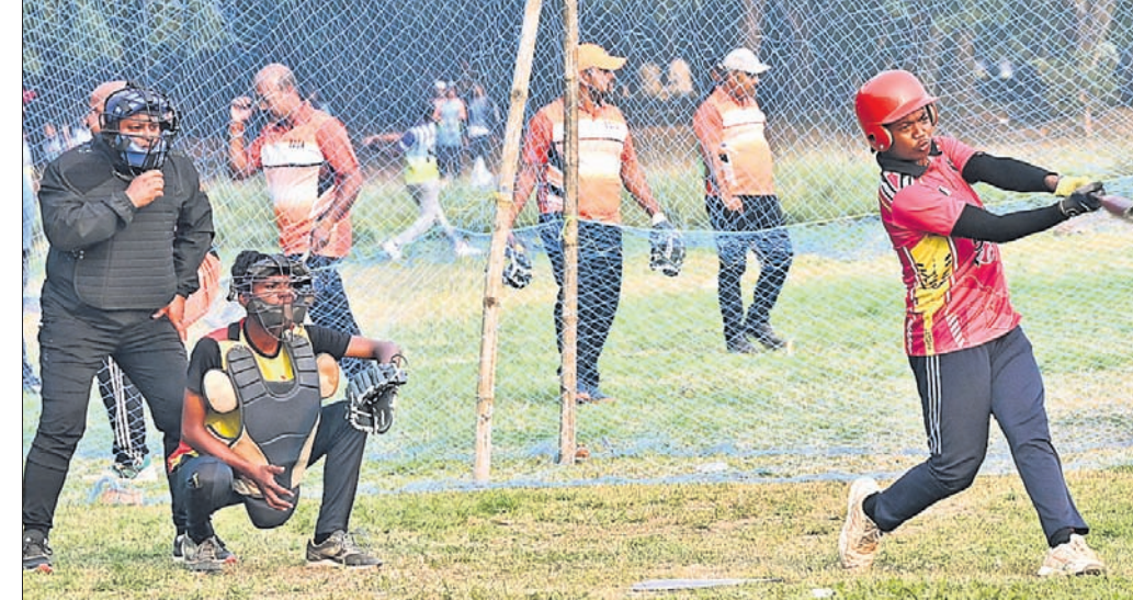
ପ୍ରଥମ ଦିବସରେ କିଏ ଓ ନୟାଗଡ଼ ମଧ୍ୟରେ ଅନୁଷ୍ଠିତ ମ୍ୟାଚ।

ଭୁବନେଶ୍ୱର, ୬୧୨ (ତପନ ସାହି) ଓଡ଼ିଶା ସଫ୍ଟବଲ ସଂଘ ଓ କ୍ରୀଡ଼ା ବିଭାଗର ମିଳିତ ଆୟତ୍ନରେ ୨୩ତମ ରାଜ୍ୟ ସିନିୟର ସଫ୍ଟବଲ ପ୍ରତିଯୋଗିତା ଶୁକ୍ରବାର କଟକର ସତ୍ୟବ୍ରତ ଷ୍ଟାଡ଼ିୟମରେ ଆରମ୍ଭ ହୋଇଛି।