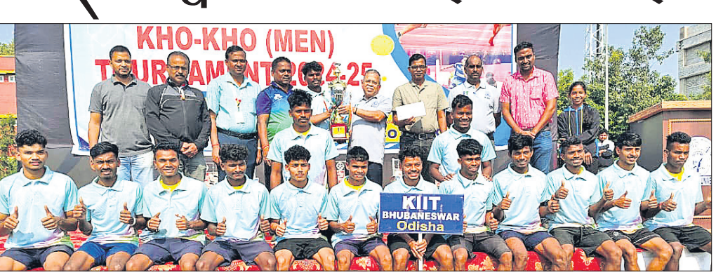
ଅତିଥିକ୍ରମେ ଉପସ୍ଥିତ ଗ୍ରହଣ ଅବସରରେ ଚାମ୍ପିୟନ କିର୍ ବିଶ୍ୱବିଦ୍ୟାଳୟ ଦଳ।