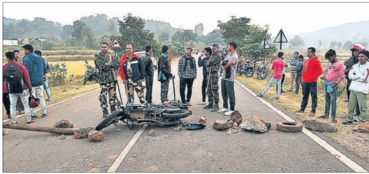
ଭୁବନେଶ୍ୱରରେ ବାଲିକୁଡ଼ା ଛାତ୍ରମାନଙ୍କୁ ନେଇ ଉଦ୍ଦେଶ୍ୟ

କନ୍ୟାମାନଙ୍କୁ ଉତ୍ସାହିତ କରିବା ପାଇଁ ରାଜ୍ୟ ସିନିୟର ଦଳ ଚୟନ ଶିବିରରେ ଯୋଗ ଦେଇଛନ୍ତି । ଓଡ଼ିଶା ରାଜ୍ୟ ଚୟନ ଶିବିରରେ ଯୋଗ ଦେଇଛନ୍ତି ।