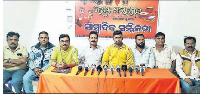
ଖବରଦାତା ସମ୍ମିଳନୀରେ ଆୟୋଜକ କମିଟି ସଦସ୍ୟ।