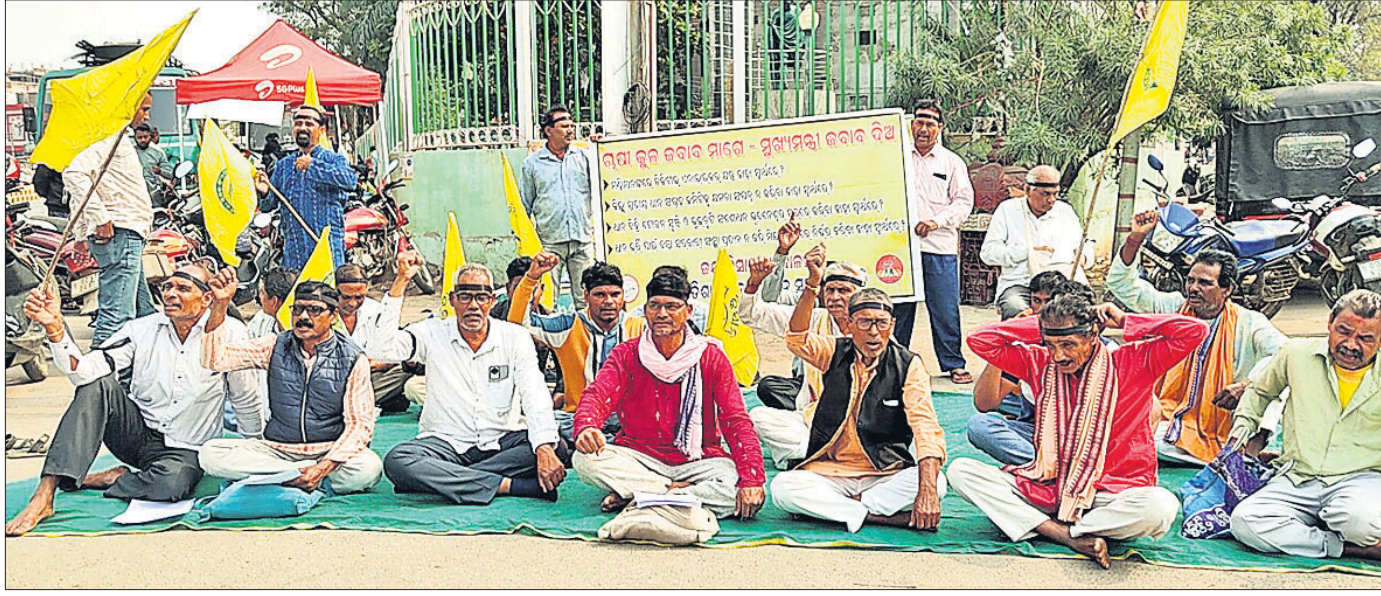
ଶନିବାର ବରଗଡ଼ ଗାନ୍ଧୀଛକରେ ଚାଷୀମାନେ ଧାରଣା ଦେଇଛନ୍ତି।