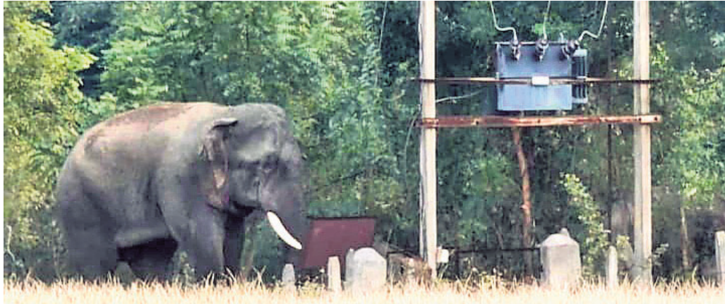
ପତ୍ତପୁର ଉପଖଣ୍ଡ ଝାଞ୍ଜ ପାହାଡ଼ ଅଞ୍ଚଳର ଚାଷକମିରେ ହାତୀ।

ରାଜପଥରେ ଶନିବାର ସକାଳ ଏକ ଦୁର୍ଘଟଣା ଘଟିଛି। ବରଗଡ଼ ପତ୍ତ ପାର ନେଇ ବରପାଳି ଆସୁଥିବା ଏକ ଟ୍ରକ୍ ବିପରୀତ ଦିଗରୁ ଆସୁଥିବା ପିକ୍‌ଅପ୍ ଭ୍ୟାନ (ନଂ.ଓଡିଏଲ/୨୨୮୮) ସହ ମୁହାଁମୁହିଁ ଧକ୍କା ହୋଇଥିଲା। ଫଳରେ ପିକ୍‌ଅପ୍ ଡ୍ରାଇଭର ଗୁରୁତର ହୋଇଛନ୍ତି। ତାଙ୍କୁ ବରପାଳି ସରକାରୀ ଡାକ୍ତରଖାନାରେ ପ୍ରାଥମିକ ଚିକିତ୍ସା ପରେ ବରଗଡ଼ ସ୍ଥାନାନ୍ତର କରାଯାଇଛି। ଟ୍ରକ୍ ଡ୍ରାଇଭର ଘଟଣାସ୍ଥଳକୁ ଫେରାର ହୋଇଯାଇଛନ୍ତି। ବରପାଳି ପୋଲିସ୍ ଘଟଣାସ୍ଥଳରେ ପହଞ୍ଚି ତଦନ୍ତ କରୁଛି।