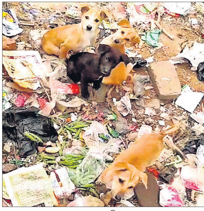
ବାସନ୍ତୀ କଳନାମୀର ଏକ ଅଳିଆ ଗରାବେ ବୁଲୁ କୁକୁର ।

ରାଉରକେଲା ସହରରେ ବୁଲୁ କୁକୁରଙ୍କ ସଂଖ୍ୟା ବୃଦ୍ଧିପାଇଛି। ରାସ୍ତାଘାଟରେ ସେମାନଙ୍କ ଅବାଧ ବିଚରଣ ଯୋଗୁଁ ବିଭିନ୍ନ ସମୟରେ ଦୁର୍ଘଟଣା ଘଟୁଛି। ସେହିପରି କୁକୁର କାମୁଡ଼ାରେ ଗତ ବର୍ଷକ ମଧ୍ୟରେ ପ୍ରାୟ ୮ ହଜାର ଲୋକ ଆହତ ହୋଇ ଆର୍ତ୍ତବିପ୍ଳବରେ ଚିତ୍କିତ ହୋଇଛନ୍ତି। ଅନ୍ୟତମେ ପ୍ରାଣୀ ସମ୍ପଦ ବିଭାଗ ବୁଲୁ କୁକୁରଙ୍କ ଜନ୍ମ ସର୍ବେକ୍ଷଣ କାର୍ଯ୍ୟ ବନ୍ଦ କରିଦେଇଥିବା ଜଣାପଡ଼ିଛି। ୨୦୨୩ରେ ପୁରୁଣା ହଳି ବିଷ୍ଣୁଙ୍କୁ ବେଳେ ରାଉରକେଲା ପ୍ରାଣୀଧନ ବିଭାଗ ଓ ଆରୁସ୍‌ସ୍‌ପି ନିକିତ ଭାବେ ସହରରେ ବୁଲୁକୁକୁରଙ୍କ ସର୍ବେକ୍ଷଣ କରିଥିଲେ। ପ୍ରାଣୀଧନ ବିଭାଗ ପୂର୍ତ୍ତା ଅନୁସାରେ ସହରରେ ବୁଲୁକୁକୁରଙ୍କ ସଂଖ୍ୟା ବୃଦ୍ଧି ପାଇବା ସହରର ପରିବେଶ ପାଇଁ ହାନିକାରକ। ଏଣୁ ସହରର ବୁଲୁ କୁକୁରଙ୍କ ପୁରଣା ଓ ପରିବେଶ ସୁରକ୍ଷା ଲାଗି ୨୦୨୩ରେ ସର୍ବେକ୍ଷଣ କରାଯାଇଥିଲା। ପାରିପାଶ୍ୱିକ ପରିବେଶ ଏବଂ ବୁଲୁ କୁକୁରଙ୍କ ହିତାଧିକାର ସର୍ବେକ୍ଷଣ, ଲିଙ୍ଗ ନିରୂପଣ, ବନ୍ଧ୍ୟାକରଣ, ଚିକାକରଣ