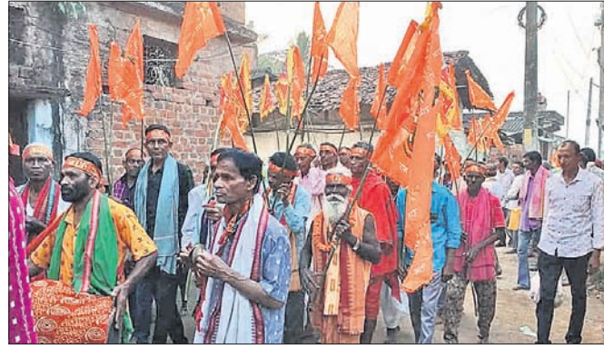
ଶୁଭସ୍ତ୍ରୟ ସ୍ଥାପନ ପାଇଁ ସଂକୀର୍ତ୍ତନ କରାଯାଇଛି।