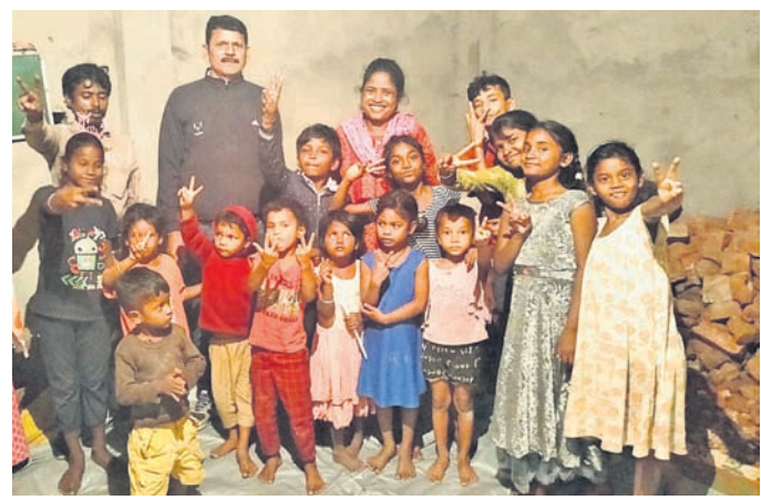
ସହାୟତା ପାଇଥିବା ଶିଶୁମାନେ ।