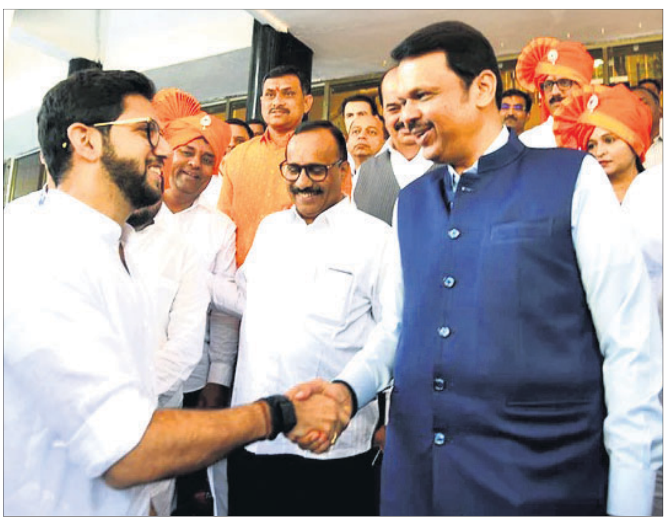
ମହାରାଷ୍ଟ୍ର ବିଧାନସଭାର ସ୍ପନ୍ଦନ ଅଧିବେଶନ ଚାଲିଥିବାବେଳେ ମୁଖ୍ୟମନ୍ତ୍ରୀ ଦେବେନ୍ଦ୍ର ଫଡ଼ନବିସ୍ ଓ ଶିବସେନା (ୟୁବିଟି) ବିଧାୟକ ଦଳ ନେତା ଆଦିତ୍ୟ ଠାକ୍ରେ ପରସ୍ପର ସହ କରମର୍ଦ୍ଦନ କରୁଛନ୍ତି।