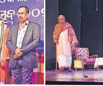
ନାଟ୍ୟ ମହୋତ୍ସବରେ ମଞ୍ଚାସୀନ ଅତିଥିମାନେ ।