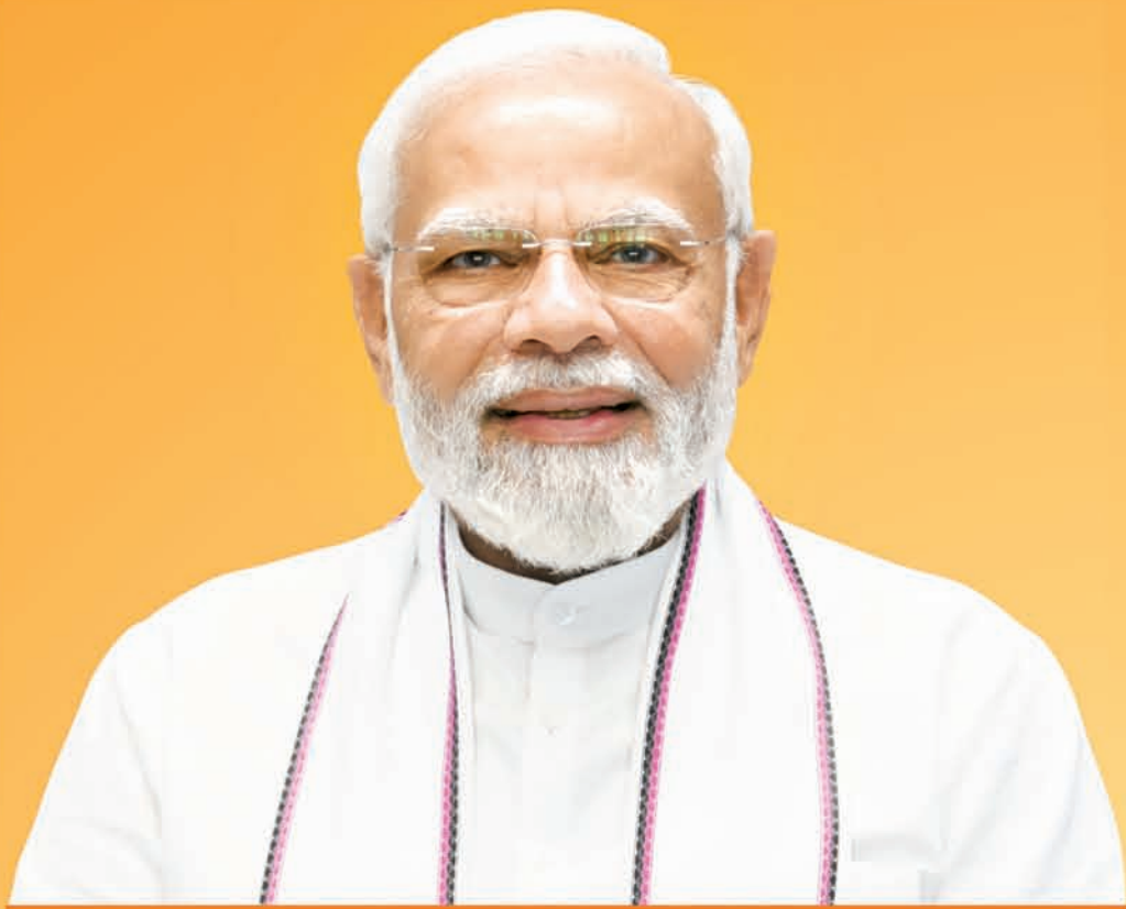
ଶ୍ରୀ ନରେନ୍ଦ୍ର ମୋଦୀ ପ୍ରଧାନମନ୍ତ୍ରୀ