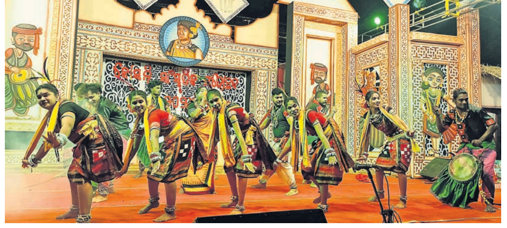
ସମ୍ବଲପୁରୀ ନୃତ୍ୟ ପରିବେଷଣ କରୁଛନ୍ତି ଛାତ୍ରାଛାତ୍ରୀ।