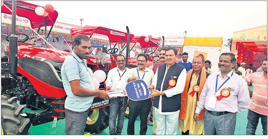
କୃଷି କ୍ଷେତ୍ରରେ ବ୍ୟବହାର ପାଇଁ ଜଣେ ଗଣୀଙ୍କୁ ଗ୍ରାହକ ଚାପି ପ୍ରଦାନ କରାଯାଇଛି।