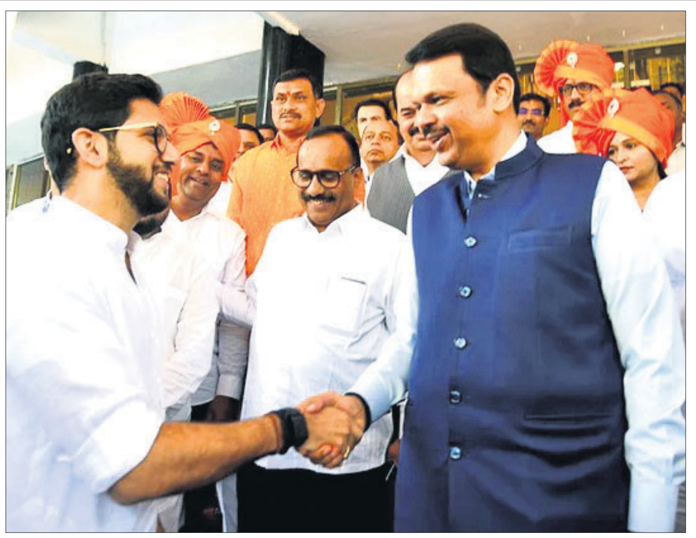
ମହାରାଷ୍ଟ୍ର ବିଧାନସଭାରେ ସ୍ୱତନ୍ତ୍ର ଅଧିବେଶନ ଚାଲିଥିବାବେଳେ ମୁଖ୍ୟମନ୍ତ୍ରୀ ଦେବେନ୍ଦ୍ର ଫଡ଼ନବିସ୍ ଓ ଶିବସେନା (ୟୁ.ପି.ଏ) ବିଧାୟକ ଦଳ ନେତା ଆଦିତ୍ୟ ଠାକୁର ସହ କରମର୍ଦ୍ଦନ କରୁଛନ୍ତି।