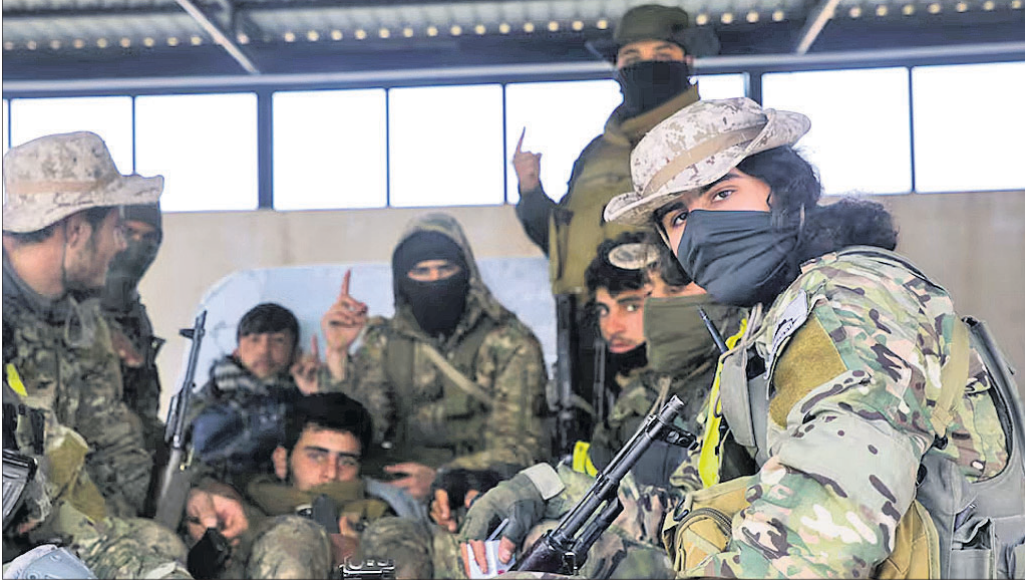
ସିରିଆ ବିଦ୍ରୋହୀମାନେ ହୋମ୍ ସହରରେ ପ୍ରବେଶ କରୁଛନ୍ତି।

ସିରିଆର ବିଦ୍ରୋହୀ ଯୋଦ୍ଧାମାନେ ଶନିବାର ଦକ୍ଷିଣ ଭାଗରେ ଥିବା ଦାରା ସହରକୁ ଦଖଲ କରିଛନ୍ତି। ଏହାକୁ ମିଶାଇ ବିଦ୍ରୋହୀମାନେ ବର୍ତ୍ତମାନ ସୁଦ୍ଧା ୪ଟି ସହରକୁ ନିଜ ଅଧିକାରକୁ ନେବା ପରେ ରାଜଧାନୀ ତାମାସ୍କସ୍ ଅଭିମୁଖେ ଅଗ୍ରସର ହେଉଛନ୍ତି। ଶୁକ୍ରବାରର ଆକ୍ରମଣରେ ୨୦୦ରୁ ଊର୍ଦ୍ଧ୍ୱ ଲୋକଙ୍କ ମୃତ୍ୟୁ ଘଟିବା ସହ ୨,୮୦,୦୦୦ରୁ ଅଧିକ ବିସ୍ଫାପିତ ହେଲେଣି। ସେମାନେ ରାଷ୍ଟ୍ରପତି ବଶର ଅଲ-ଆସାଦଙ୍କୁ ସମତାକୁ ହତାକିବା ପାଇଁ ପ୍ରତିଜ୍ଞା କରିଛନ୍ତି। ଅନ୍ୟପକ୍ଷରେ ରାଷ୍ଟ୍ରପତିଙ୍କ ହାତପୁଠା ଦୁର୍ବଳ ହେଉଥିବାବେଳେ ସେ ଯୁଦ୍ଧଭେତ୍ତ ଆରବ ଏମିରେଟ୍ସ (ୟୁଏଇ), ଇଜିପ୍ଟ ଏବଂ ଇରାକର ସହାୟତା ଲୋଡ଼ିଛନ୍ତି। ଅସାଦଙ୍କ ବିରୋଧରେ ୨୦୧୧ରେ ପୃଷ୍ଠି ହୋଇଥିବା ଗୃହଯୁଦ୍ଧର ଉତ୍ପତ୍ତି ସ୍ଥଳ ଥିଲା ଦାରା ସହର। ଏହି ସହରର ପତନ ବିଦ୍ରୋହୀମାନଙ୍କ ପାଇଁ ଏକ ବଡ଼ ସଫଳତା। କୋର୍ଡ଼ିନେଟିଂ ସାମାଜିକ ଲାଭିଥିବା ଏହି ପ୍ରାଦେଶିକ ରାଜଧାନୀ ସହରରେ ପ୍ରାୟ ୧୦ ଲକ୍ଷ ଲୋକ ବସବାସ କରୁଛନ୍ତି। ଖବର ଅନୁଯାୟୀ ଅସାଦଙ୍କ ସରକାର ଯୁଦ୍ଧ, ଇଜିପ୍ଟ, କୋର୍ଡ଼ିନେଟିଂ ଏବଂ ଇରାକରୁ ଅସ୍ତ୍ରଶସ୍ତ୍ର ଓ ଗୋଲିମା ସହାୟତା ଚାହୁଁଛନ୍ତି। ଦେଶର ବୃହତ୍ କେନ୍ଦ୍ରଗୁଡ଼ିକରେ ଏବଂ ବିଦ୍ରୋହୀଙ୍କ ନିକଟରେ ଆତ୍ମହତ୍ୟା କରିସାରିଲାଣି। ଅସାଦଙ୍କୁ ଦେଶ ଛାଡ଼ି ପଳାଇଯିବାକୁ କେତେଜଣ ଆରବ ଅଧିକାରୀ ପରାମର୍ଶ ଦେଇଥିବା ପତନ ବିଦ୍ରୋହୀମାନଙ୍କ ପାଇଁ ଏକ ବଡ଼ ଲକ୍ଷ୍ୟାଳୟ ଆଡ଼େଇବା ସଂଗଠନ ହୋଇଛି। ସେମାନେ ଆତ୍ମହତ୍ୟା ଏବଂ ନେତୃତ୍ୱରେ ସିରିଆ ବିଦ୍ରୋହୀମାନେ