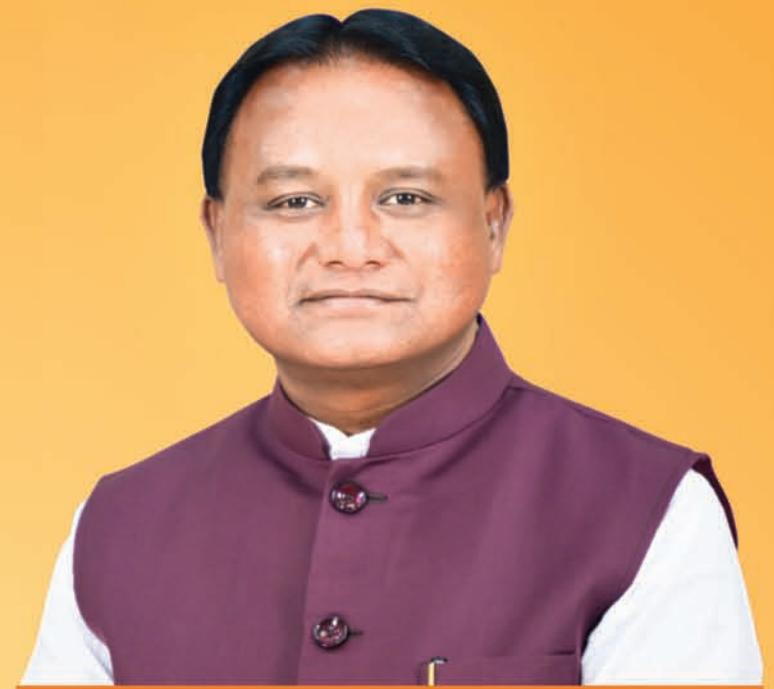
ଶ୍ରୀ ମୋହନ ଚରଣ ପାଢ଼ୀ ମୁଖ୍ୟମନ୍ତ୍ରୀ, ଓଡ଼ିଶା