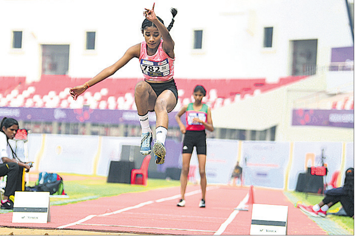
ଭୁବନେଶ୍ୱର କଳିଙ୍ଗ ଷ୍ଟାଡ଼ିୟମରେ ଶନିବାର ଆରମ୍ଭ ହୋଇଥିବା ୩୯ତମ ଜାତୀୟ ଜୁନିୟର ଆଥଲେଟିକ୍ସ ଚାମ୍ପିୟନଶିପ୍‌ର ମହିଳା ଲଞ୍ଜକମ୍ପରେ ଅଂଶଗ୍ରହଣ କରିଥିବା ଜଣେ ପ୍ରତିଯୋଗୀ। (ଫଟୋ: ବିକାଶ ନାୟକ)।