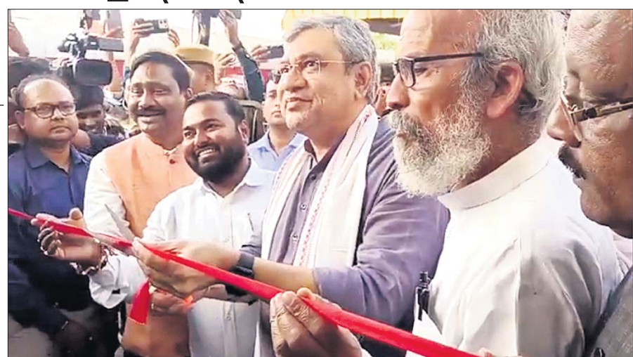
ଅତିଥିକ ବାବା ପୁର୍ ଓଭରବ୍ରିଜ୍ ଉଦ୍ଘାଟନ କରାଯାଇଛି।