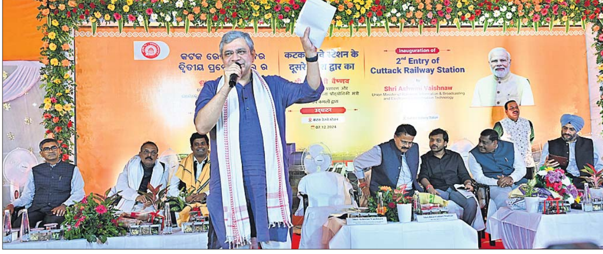
କଟକ ରେଳ ଷ୍ଟେଶନର ଦ୍ୱିତୀୟ ପ୍ରବେଶ ଦ୍ୱାର ଉଦ୍ଘାଟନା ସଭାରେ ରେଳମନ୍ତ୍ରୀ ଅଶ୍ୱିନୀ ବୈଷ୍ଣବ ଉଦ୍ଘୋଷଣା କରୁଛନ୍ତି।

କଟକ ରେଳ ଷ୍ଟେଶନର ଦ୍ୱିତୀୟ ପ୍ରବେଶ ଦ୍ୱାର ଉଦ୍ଘାଟନା ସଭାରେ ରେଳମନ୍ତ୍ରୀ ଅଶ୍ୱିନୀ ବୈଷ୍ଣବ ଉଦ୍ଘୋଷଣା କରୁଛନ୍ତି। ୨୭,୦୦୦ କୋଟି ଟଙ୍କାର ଯୋଜନା ପ୍ରସ୍ତୁତ କରାଯାଇ ଗତ ୬ ମାସରେ ୨୦ ହଜାର କୋଟି ଟଙ୍କାର ପ୍ରକଳ୍ପ କରାଯାଇପାରିବ। ଅଳ୍ପ ଦିନରେ ବାକିରାମାୟାଗାମୀଙ୍କୁ ଯୋଗାଇ ଦେବାକୁ ଯୋଜନା ପ୍ରସ୍ତୁତ କରାଯାଇଛି। ଏହାଛଡ଼ା ୩ ଲକ୍ଷ ଟଙ୍କାରେ ପାଇଁ ଅନୁମୋଦନ ହୋଇସାରିଛି। କୋଲକାତାକୁ ଚେନ୍ନାଇକୁ ଏହି ୩ ଲକ୍ଷ ଟଙ୍କାରେ ଯୋଗାଇ ଦେବାକୁ ଯୋଜନା ରହିଛି। ଭାଙ୍ଗିବା ସହଜରେ ନିର୍ବାଚନ ପ୍ରକଳ୍ପକୁ ପୂରା କରିବାକୁ ଯୋଜନା ରହିଛି। ଏହାଛଡ଼ା ୪ ଲକ୍ଷ ଟଙ୍କାରେ ଯୋଜନା ପ୍ରସ୍ତୁତ କରାଯାଇଛି। ଏହାଛଡ଼ା ୪ ଲକ୍ଷ ଟଙ୍କାରେ ଯୋଜନା ପ୍ରସ୍ତୁତ କରାଯାଇଛି। ଏହାଛଡ଼ା ୪ ଲକ୍ଷ ଟଙ୍କାରେ ଯୋଜନା ପ୍ରସ୍ତୁତ କରାଯାଇଛି।