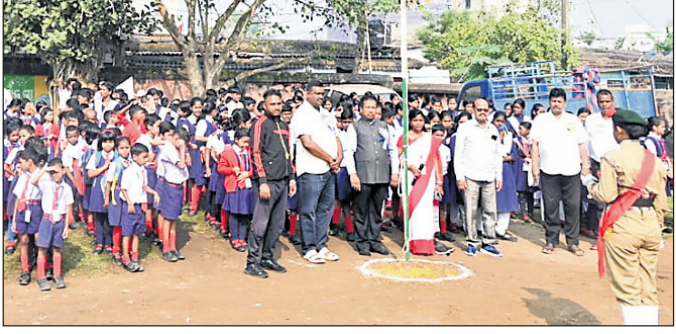
ବାସିକ କ୍ରୀଡ଼ା ଉତ୍ସବରେ ଉପସ୍ଥିତ ଅତିଥି, ଶିକ୍ଷୟିତ୍ରୀ ଶିକ୍ଷକ ଏବଂ ଛାତ୍ରଛାତ୍ରୀ ।