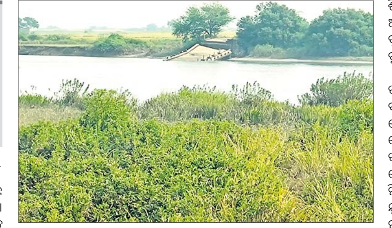
ମହାକାଳପଡ଼ା ବ୍ଲକ୍ ମହାନଦୀ ସଂଲଗ୍ନ ଆଖଡ଼ାଶାଳାଠାରେ ପ୍ରସ୍ତାବିତ ନଦୀଭିତ୍ତିକ ବନ୍ଦର ପ୍ରତିଷ୍ଠା ପାଇଁ ଗୁରୁତ୍ୱ ଦେଇଥିବା ସ୍ଥାନ।

କେନ୍ଦ୍ରାପଡ଼ା ଜିଲାରେ ଶିଳ୍ପ ପ୍ରତିଷ୍ଠା ପାଇଁ ବିଭିନ୍ନ ରାଜନୈତିକ ଦଳର ନେତା ଜୁମାର କାନ୍ଦଣା କାନ୍ଦୁଛନ୍ତି। ଭୋଟ ପୂର୍ବରୁ ସେମାନେ ବହୁ ବଡ଼ କଥା କହିଛନ୍ତି। ଏପରି କି କେନ୍ଦ୍ରାପଡ଼ା ଜିଲା ଶିଳ୍ପ ସାମ୍ରାଜ୍ୟ ହେବ ବୋଲି ଘୋଷଣା କରିଛନ୍ତି। ହେଲେ ନିର୍ବାଚନ ବୈତରଣୀ ଯାଉ ହେବା ପରେ ସେମାନେ ସବୁ ଭୁଲି ଯାଇଛନ୍ତି। ଅଧିକ ପଡ଼ୋଶୀ ପାରାଦୀପରେ ଉଭୟ କେନ୍ଦ୍ର ଓ ରାଜ୍ୟ ସରକାରଙ୍କ ଉଦ୍ୟମରେ ବହୁ ଶିଳ୍ପ ସମ୍ପା ପ୍ରତିଷ୍ଠା ହୋଇଛି। ଅଧିକ କେନ୍ଦ୍ରାପଡ଼ା ଜିଲାକୁ ଧ୍ୟାନ ଦେଇ ଶିଳ୍ପ ପ୍ରତିଷ୍ଠା ପାଇଁ ଅଣଦେଖା କରାଯାଉଛି। ଏହାକୁ ନେଇ ବୁଦ୍ଧିଜୀବୀ, ସାମାଜିକ କର୍ମୀ,