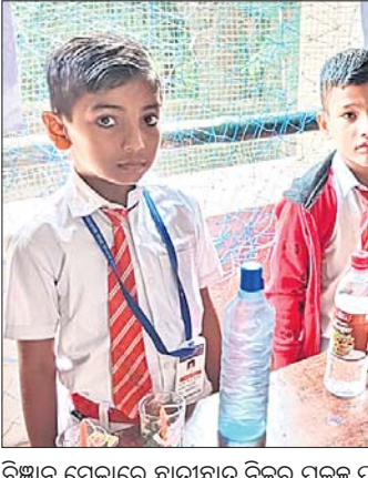
ବିଜ୍ଞାନ ମେଳାରେ ଛାତ୍ରାଛାତ୍ର ନିଜର ପ୍ରକଳ୍ପ ପ୍ରଦର୍ଶନ କରୁଛନ୍ତି ।

ଯାଜପୁର ଗଭନ, ୭।୧୨ (ପ୍ରସନ୍ନା ପ୍ରିୟଦର୍ଶିନୀ ମହାନ୍ତି): ଯାଜପୁର ନରଗଣ୍ଡିତ ଶ୍ରୀଗଣେଶ ଶିଶୁ ବିଜ୍ଞାନ ମେଳାରେ ଛାତ୍ରାଛାତ୍ର ନିଜର ପ୍ରକଳ୍ପ ପ୍ରଦର୍ଶନ କରୁଛନ୍ତି। ପରିସରରେ ବିଜ୍ଞାନ ମେଳା ଅନୁଷ୍ଠିତ ହୋଇଯାଇଛି। ଏଥିରେ ତୃତୀୟରୁ କାର୍ଯ୍ୟକ୍ରମକୁ ସଞ୍ଚାଳନ କରିଥିଲେ। ବିଦ୍ୟାଳୟର ସମସ୍ତ ଅଭିଭାବକ ମେଳାକୁ ଦେଖୁଥିଲେ।