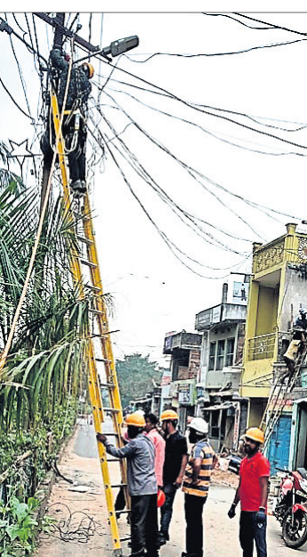
ଓଡ଼ିଶା, ୭।୧୨ (ଆବର୍ଣ୍ଣ କୁମାର ପଟ୍ଟନାୟକ)

୩୩ କେଡି ଲାଇନ ଅଟଳ ଥିବାରୁ ଅଳ୍ପକେ ବର୍ତ୍ତିଲେ ଲୋକେ