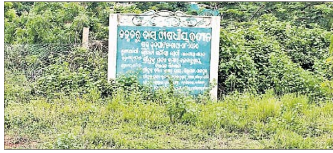
କଳ୍ପତରୁ ଦାସ ଓଷଧୀୟ ଉଦ୍ୟାନ।