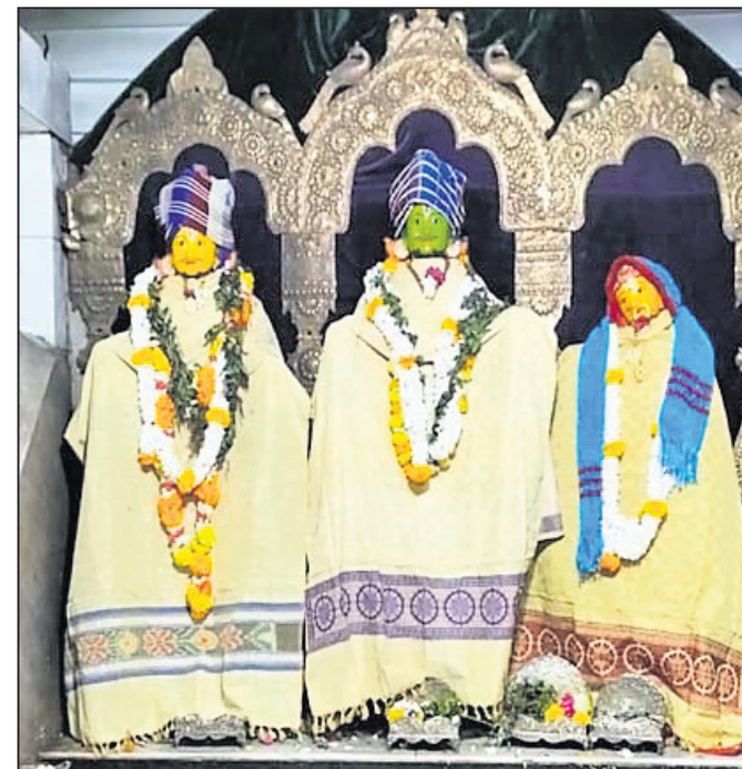
ଓଡ଼ିଶା, ୭ ଡିସେମ୍ବର (ଆଦର୍ଶ କୁମାର ପଟ୍ଟନାୟକ)

ମାନବୀୟ ଲାଳା ଅନ୍ତରାଳ ଓଡ଼ିଶାରେ ପ୍ରସ୍ତୁତ ହେବାର ସମ୍ଭାବନା ରହିଛି। ଖଣ୍ଡପଡ଼ା ପଞ୍ଚାୟତବାସୀଙ୍କୁ ଡରୁଛନ୍ତି।