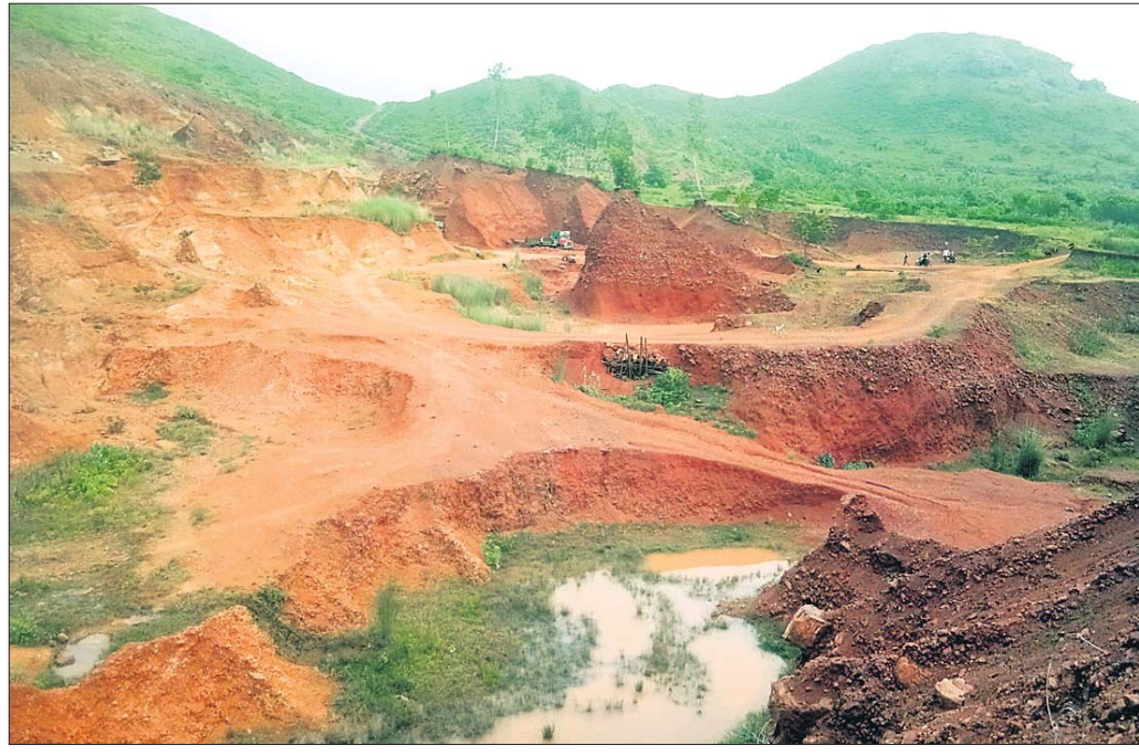
ଧାଉଡ଼ିଆପଦା ପାହାଡ଼। ପାହାଡ଼ ଉପର ଭାଗରେ ଷୋଳପୁଅ ମା' ଠାକୁରାଣୀ ରହିଥିବାବେଳେ ଏହାର ଅନତି ଦୂରରେ ହିନ୍ଦୁ ଓ ପୁସ୍ତକମାନଙ୍କ ସର୍ବଧର୍ମ ସମନ୍ୱୟସ୍ଥଳୀ ସତ୍ୟପୀଠ ପୂଜା ପାଉଛନ୍ତି। ଏହି ପାହାଡ଼କୁ ଦୈନିକ ୩୦ରୁ ଊର୍ଦ୍ଧ୍ୱ ଟ୍ରକରେ ବିଭିନ୍ନ ଗ୍ରାମକୁ ମୋରମ୍ ଚାଲାଣ କରାଯାଇଛି। ଏଠାରେ ଭଲ ମୋରମ୍ ବାହାରୁଥିବା ହେତୁ ଏହାର ଚାହିଦା ଅଧିକ ରହିଛି। ଐତିହାସିକମାନଙ୍କ ମତରେ ବୌଦ୍ଧପୀଠ ଉଦୟଗିରିରେ ଯେଉଁ ବୌଦ୍ଧ ଭିକ୍ଷୁମାନେ ରହୁଥିଲେ