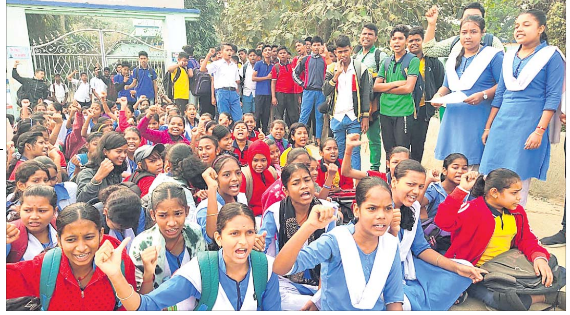
ସ୍କୁଲ ପାଠକ ସମ୍ମୁଖରେ ଧାରଣାରେ ବସିଥିବା ଛାତ୍ରାଛାତ୍ରୀ।