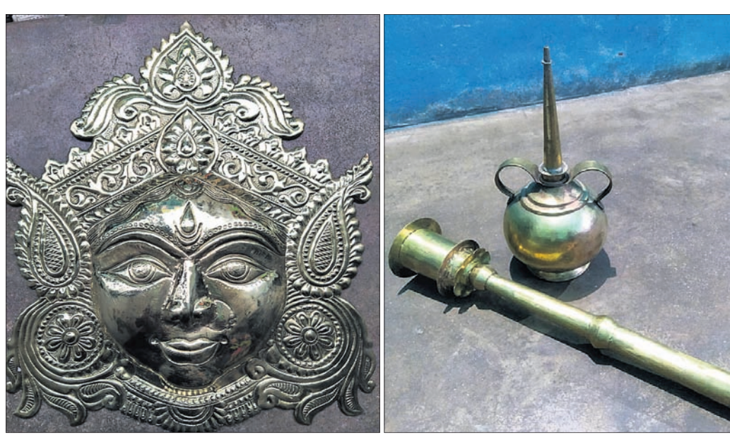
କଣ୍ଠିଲୋ ପିଇଲ କାର୍ଯ୍ୟକ୍ରମର ଦ୍ୱାରା ନିର୍ମିତ ବିଭିନ୍ନ ସାମଗ୍ରୀ।

ରାଜ୍ୟ ସମବାୟ ହସ୍ତଶିଳ୍ପ ନିଗମ ଲିମିଟେଡ୍ ପରିଚାଳନା ନିର୍ଦ୍ଦେଶିକା, ନିର୍ଦ୍ଦେଶକ କଣ୍ଠିଲୋ ଅଞ୍ଚଳକୁ ବିଭିନ୍ନ ସମୟରେ ପରିବର୍ତ୍ତନରେ ଆସିଆସିଛି। ସଂପୂର୍ଣ୍ଣ ଅଧିକାରୀମାନେ କଂପ୍ୟୁଟର ପଦ୍ଧତିରେ କାର୍ଯ୍ୟ କରିବା ପାଇଁ ଯୋଜନା କାର୍ଯ୍ୟ କରିବାକୁ ଚାହୁଁଛନ୍ତି। ତଥ୍ୟ ଓ ପିଇଲ ଚକର (ସିଡି)ରେ ପ୍ରସ୍ତୁତ ତଥ୍ୟ ଉପରେ ଆଧାର କରି ଯୋଜନା କାର୍ଯ୍ୟ କରିବାକୁ ଚାହୁଁଛନ୍ତି। କାର୍ଯ୍ୟକ୍ରମରେ ଅନୁମତି ପାଇ ନ ଥିବା ତଥ୍ୟ ବିଭିନ୍ନ ହସ୍ତଶିଳ୍ପ ତାଲିକାରେ ଯୋଜନା କାର୍ଯ୍ୟ କରିବାକୁ ଚାହୁଁଛନ୍ତି। କାର୍ଯ୍ୟକ୍ରମରେ ଅନୁମତି ପାଇ ନ ଥିବା ପରିଚାପର ବିଷୟ। କାର୍ଯ୍ୟକ୍ରମରେ ଅନୁମତି ପାଇ ନ ଥିବା ପରିଚାପର ବିଷୟ। କାର୍ଯ୍ୟକ୍ରମରେ ଅନୁମତି ପାଇ ନ ଥିବା ପରିଚାପର ବିଷୟ।