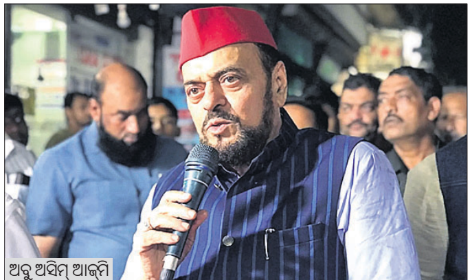
ଅରୁ ଅସିମ୍ ଆଜ୍ଞା

ସାମ୍ପ୍ରଦାୟିକ ବିଚାରଧାରା ସହ ଏସପି ରହିପାରିବ ନାହିଁ: ଅରୁ ଆଜ୍ଞା