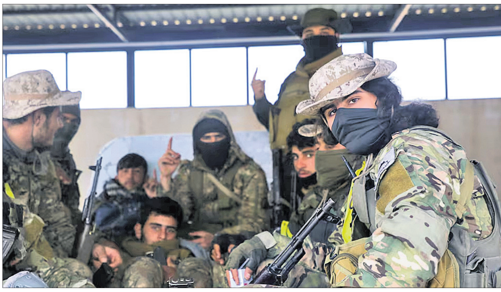
ସିରିଆ ବିଦ୍ରୋହୀମାନେ ହୋସ୍ ସହରରେ ପ୍ରବେଶ କରୁଛନ୍ତି।