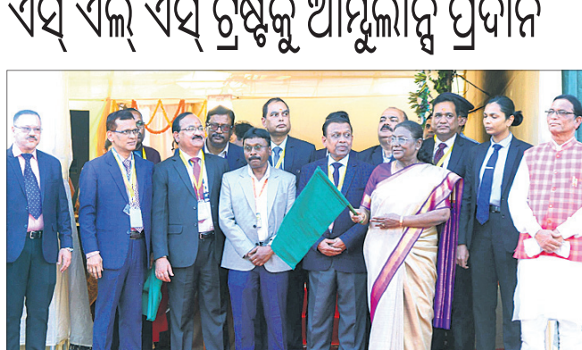
ଭୁବନେଶ୍ୱର, ୨୦୧୨ (ଅନୁରାଧା ମହାରଣା)

ଭାରତୀୟ ଜାତୀୟ ନିଗମ (ଏଲ୍‌ଆଇସି) ଗୋଲ୍ଡେନ୍ ଫାଉଣ୍ଡେଶନର କଟକ ମଞ୍ଚଳ ପକ୍ଷରୁ ସହାୟତାରେ ମୟୂରଭଞ୍ଜର ଏସ୍ ଏଲ୍ ଏସ୍ ଟ୍ରଷ୍ଟକୁ ସ୍ୱାସ୍ଥ୍ୟ ସେବା ପ୍ରଦାନ ପାଇଁ ଏକ ଆୟୁଲାନୁ ପ୍ରଦାନ କରାଯାଇଛି। ଏହି ଟ୍ରଷ୍ଟ ଏକ ଦର୍ଶନିୟ ଅଧିକ ସମୟ ହେବ ଜିଲ୍ଲାରେ ବିଭିନ୍ନ କାର୍ଯ୍ୟ କରିଆସୁଛି। ବିଶେଷକରି ଜଙ୍ଗଲ ଅଞ୍ଚଳ, ସୂର୍ଯ୍ୟ ପାହାଡ଼ିଆ ଅଞ୍ଚଳରେ ଥିବା ଆଦିବାସୀ, ହରିଜନ ଓ ଗରିବ ଲୋକମାନଙ୍କୁ ସ୍ୱାସ୍ଥ୍ୟ ସେବା ପ୍ରଦାନ