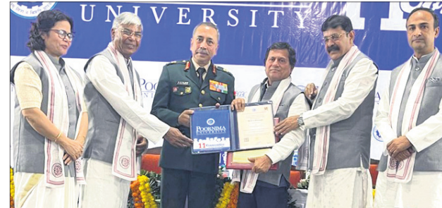
ଭୁବନେଶ୍ୱର, ୨୦୧୨