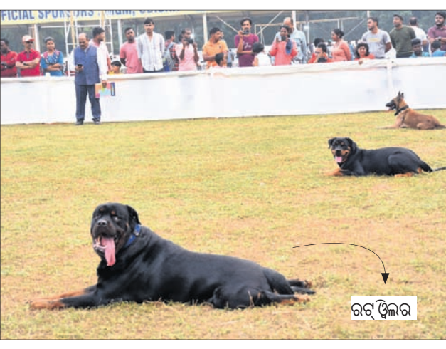
ଭୁବନେଶ୍ୱର, ୨୦୧୨ (ବନ୍ଦନା ସେଠୀ)

ଆଜି ଅଲ୍ ବ୍ରିଡ୍ ଡଗ୍ ଷୋ'ରେ ଭାଗନେବେ ୩୦୦ ଡଗ୍