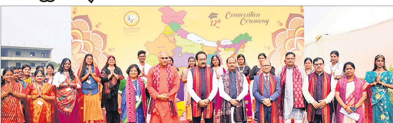
ଉତ୍ସବରେ ରାଜ୍ୟପାଳ ରଘୁବର ଦାସଙ୍କ ସହ ଅନ୍ୟ ଅତିଥିମାନେ ।