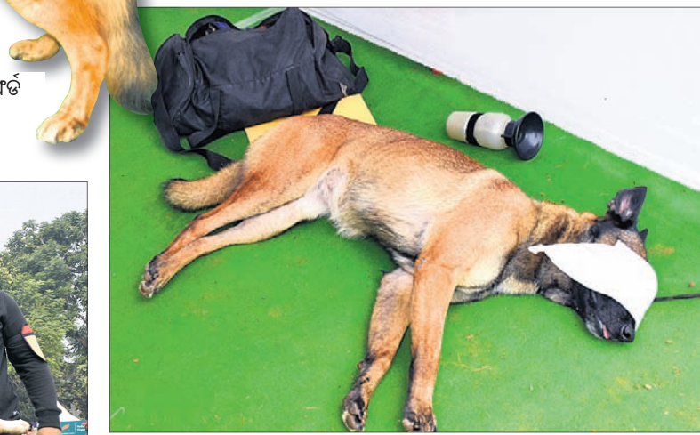
ଏକ କୁକୁର ମୁହଁରେ ଭୁଲାଇ ପକାଇ ମାଲିକଙ୍କ ଆଦେଶକୁ ଅପେକ୍ଷା କରିଛି।

ହୋଇଥିଲା। ଏକ୍ସପୋରଟର ଆସିଥିବା ଅନ୍ତରାଷ୍ଟ୍ରୀୟ ସ୍ନେଗାଲ୍ ଜର୍ମାନ ସେପର୍ଡ୍ କେମ୍ପିଟି ଜର୍ମାନ ସେପର୍ଡ୍ ସ୍ନେଗାଲ୍ ଷୋ'ର ଜର୍ମାନ ସେପର୍ଡ୍ ଭାବେ ଦାୟିତ୍ୱ ଗ୍ରହଣ କରିଥିଲେ। ଏଥିରେ ୩୦ଟି ଭୁଲାଇ ଥିବାବେଳେ ପର୍ଯ୍ୟାୟର ଏସିଆଇ ଅନ୍ତରାଷ୍ଟ୍ରୀୟ ଜର୍ମାନ ସେପର୍ଡ୍ ସହିତ ପ୍ରତିଦ୍ୱନ୍ଦ୍ୱିତା କରିବେ ବୋଲି କ୍ଲବ୍ ପେଇଲ୍ୟେଟୋ ଉଭୟ ବିଗଲ୍ ସ୍ନେଗାଲ୍ ଷୋ' ଏବଂ ଲାଗୁଡ଼ର୍ ସ୍ନେଗାଲ୍ ଷୋ'ର ବିଚାରକ ରହିଥିଲେ। ରବିବାର ମୁଖ୍ୟ କାର୍ଯ୍ୟକ୍ରମ 'ଅଲ୍ ବ୍ରିଡ୍ ଡଗ୍ ଷୋ' ଅନୁଷ୍ଠିତ ହେବ। ଏଥିରେ ୩୦ଟି ବ୍ରିଡ୍ ପ୍ରାୟ ୩୦୦ କୁକୁର ପରୀକ୍ଷା ସହିତ ପ୍ରତିଦ୍ୱନ୍ଦ୍ୱିତା କରିବେ ବୋଲି କ୍ଲବ୍ ପେଇଲ୍ୟେଟୋ ଉଭୟ ବିଗଲ୍ ସ୍ନେଗାଲ୍ ଷୋ' ଏବଂ ଲାଗୁଡ଼ର୍ ସ୍ନେଗାଲ୍ ଷୋ'ର ବିଚାରକ ରହିଥିଲେ। ରବିବାର ମୁଖ୍ୟ କାର୍ଯ୍ୟକ୍ରମ 'ଅଲ୍ ବ୍ରିଡ୍ ଡଗ୍ ଷୋ' ଅନୁଷ୍ଠିତ ହେବ। ଏଥିରେ ୩୦ଟି ବ୍ରିଡ୍ ପ୍ରାୟ ୩୦୦ କୁକୁର ପରୀକ୍ଷା ସହିତ ପ୍ରତିଦ୍ୱନ୍ଦ୍ୱିତା କରିବେ ବୋଲି କ୍ଲବ୍ ପେଇଲ୍ୟେଟୋ ଉଭୟ ବିଗଲ୍ ସ୍ନେଗାଲ୍ ଷୋ' ଏବଂ ଲାଗୁଡ଼ର୍ ସ୍ନେଗାଲ୍ ଷୋ'ର ବିଚାରକ ରହିଥିଲେ।