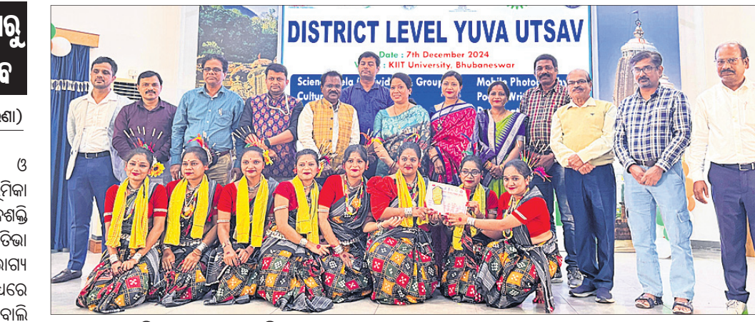
ଯୁବ ଉତ୍ସବରେ ଅତିଥିଙ୍କ ସହ ପୁରସ୍କୃତ ପ୍ରତିଯୋଗୀମାନେ।