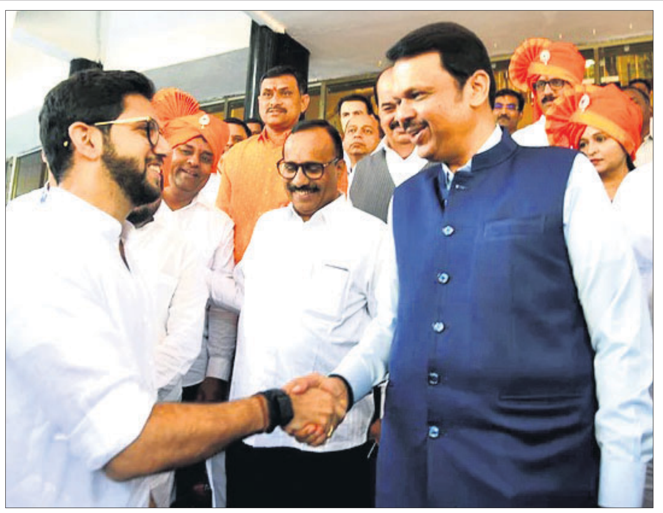
ମହାରାଷ୍ଟ୍ର ବିଧାନସଭାରେ ସ୍ୱତନ୍ତ୍ର ଅଧିବେଶନ ଚାଲିଥିବାବେଳେ ମୁଖ୍ୟମନ୍ତ୍ରୀ ଦେବେନ୍ଦ୍ର ଫଡ଼ନବିସ୍ ଓ ଶିବସେନା (ୟୁ.ଡି.ଏ.) ବିଧାୟକ ଦଳ ନେତା ଆଦିତ୍ୟ ଠାକୁର ସହ କରମର୍ଦ୍ଦନ କରୁଛନ୍ତି।