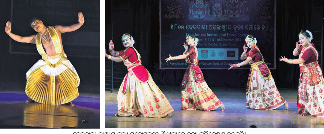
ଦେବଦାସୀ ରାଷ୍ଟ୍ରୀୟ ନୃତ୍ୟ ମହୋତ୍ସବରେ ଶିଳ୍ପୀମାନେ ନୃତ୍ୟ ପରିବେଷଣ କରୁଛନ୍ତି।