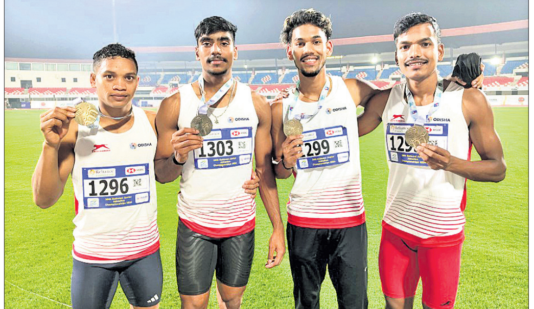
ରିଲେରେ ସ୍ୱର୍ଣ୍ଣ ପଦକ ବିଜୟୀ ଓଡ଼ିଶା ଦଳ।

ଭୁବନେଶ୍ୱର, ୯।୧୨ (ତପନ ସାହି): କଳିଙ୍ଗ ଷ୍ଟାଡ଼ିୟମରେ ଚାଳିଥିବା ୩୯ତମ ଜାତୀୟ କ୍ରିକେଟର ଖେଳ କ୍ରମରେ ଭାରତୀୟ ଖେଳାଳିମାନେ ଉତ୍ତମ ପ୍ରଦର୍ଶନ ଦେଖାଇଛନ୍ତି।