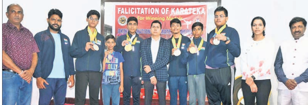
ଓଡ଼ିଶା ଦଳ ଓଡ଼ିଶା ଖେଳାଳିମାନଙ୍କୁ ବିଶ୍ୱକପ୍ ୨୦୨୫ ପାଇଁ ଚୟନ କରାଯାଇଛି।