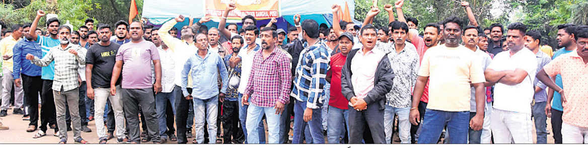
ଆନ୍ଦୋଳନରେ ଭେଦଭେଦ ହେଉ ନାହିଁ ବୋଲି କର୍ମଚାରୀ ।

ପୁରୀ ରେଳଷ୍ଟେଶନରେ କାମ କରୁଥିବା ଠିକା ଶ୍ରମିକ ତଥା ସଫେଇ କର୍ମଚାରୀ ଇଷ୍ଟକୋଷ୍ଠ ରେଳଘେ ଠିକା ମଜଦୁର ସଂଘ ପକ୍ଷରୁ ବିଭିନ୍ନ ଦାବି ଓ ନିଜ ଅଧିକାର ପାଇଁ ଆନ୍ଦୋଳନକୁ ଓହ୍ଲାଇଛନ୍ତି । ଏନେଇ ସଂଘ ପକ୍ଷରୁ ଖବରଦାତା ସମ୍ମିଳନୀରେ ସୂଚନା ଦିଆଯାଇଛି ଯେ, ଷ୍ଟେଶନ ସଫାକରି ପ୍ରଧାନମନ୍ତ୍ରୀ ସ୍ତମ୍ଭ ଭାବେ ଅଭିଯାନକୁ ସଫଳ ଭାବେ କାର୍ଯ୍ୟକାରୀ କରୁଛନ୍ତି । ଠିକା ସଫେଇ କର୍ମଚାରୀମାନେ ୪୪ ବର୍ଷରୁ ଉର୍ଦ୍ଧ୍ୱ, ଅଧିକାରୀ ଶ୍ରେଣୀରେ କାର୍ଯ୍ୟ କରୁଥିବା ସମୟରେ ଗତ ଏକବର୍ଷ