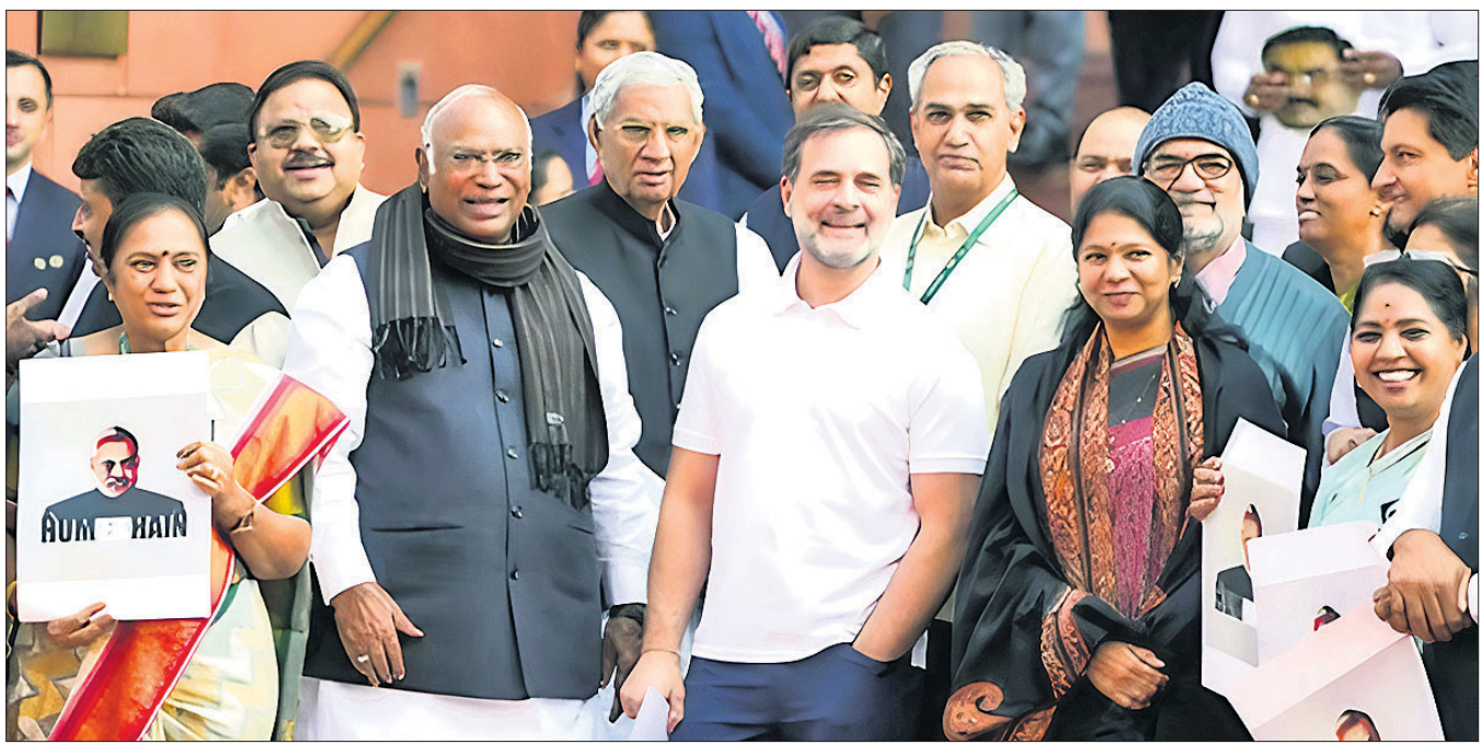
ଶ୍ରୀତ ଅଧିବେଶନ ଚାଲିଥିବାବେଳେ ସୋମବାର ପାର୍ଲିମେଣ୍ଟ ପରିସରରେ ଆଦାନୀ ପ୍ରସଙ୍ଗରେ ରାଜ୍ୟ ସଭାର ବିରୋଧୀ ଦଳ ନେତା ମିଳିକାର୍ଜୁନ ଖାର୍ଜେ, ଲୋକ ସଭାର ବିରୋଧୀ ଦଳ ନେତା ରାହୁଲ ଗାନ୍ଧୀ ଏବଂ ଇଣ୍ଡିଆ ବ୍ଲକ୍ ଅଫ୍ ଅନର୍ ଏମ୍ପିମାନେ ବିଶୋଭ କରୁଛନ୍ତି।