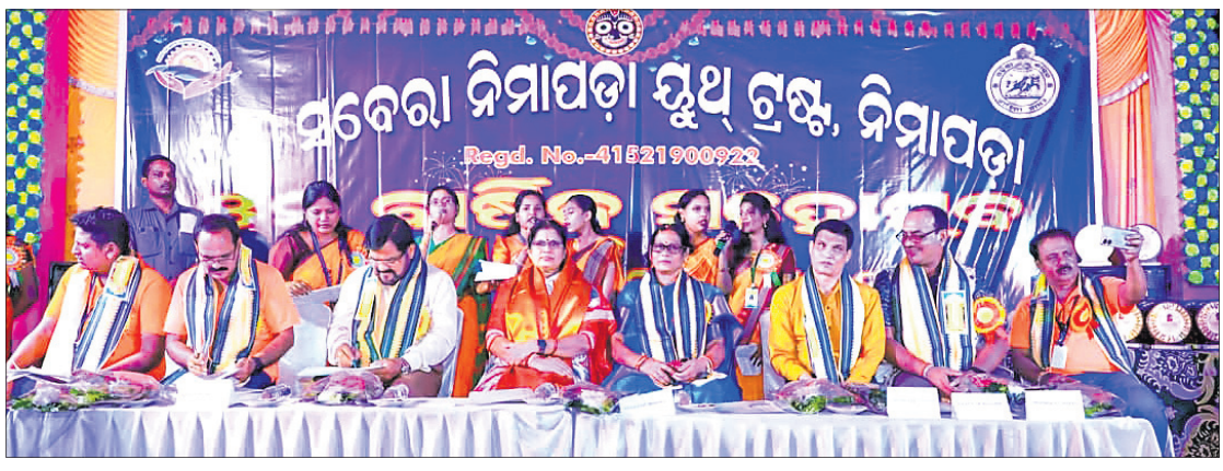
ଅତିଥିମାନଙ୍କ ସମ୍ମାନନା ପ୍ରତିଷ୍ଠା ସମ୍ପର୍କରେ, ସମ୍ମାନିତ ପ୍ରତିଷ୍ଠାଗଣା ।

ନିମାପତା ନିମାପତା ମୁଖ୍ୟ ଟ୍ରଷ୍ଟର ୪ମ ବାର୍ଷିକ ମହୋତ୍ସବ, ଶ୍ରେଣୀଭେଦ ସମ୍ମାନ ସମାରୋହ ଓ ପୁରସ୍କାର ବିତରଣ ଉତ୍ସବ ପୁରୀ ବ୍ୟବସାୟ ଗଠନାୟକ ମଣ୍ଡଳରେ ମହାସମାରୋହରେ ରବିବାର ଅନୁଷ୍ଠିତ ହୋଇଯାଇଛି।