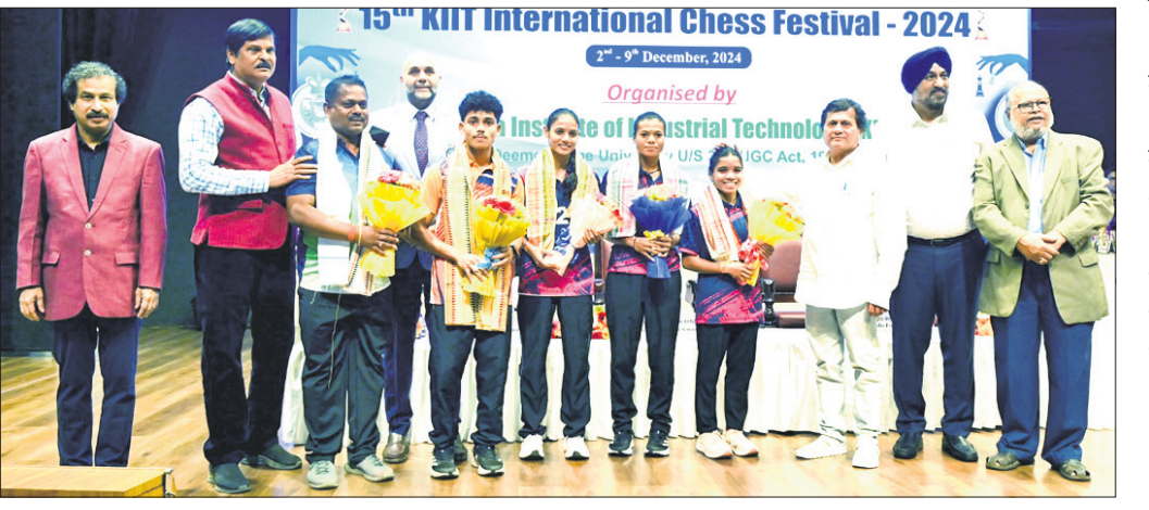
ଭାରତୀୟ ସମ୍ଭାରୀୟ ଖେଳାଳିଙ୍କୁ ବିଶ୍ୱକପ୍ ୨୦୨୫ ପାଇଁ ଚୟନ କରାଯାଇଛି।

ଭୁବନେଶ୍ୱର, ୯।୧୨ (ତପନ ସାହି): ଓଡ଼ିଶା ଦଳ ଓଡ଼ିଶା ଖେଳାଳିମାନଙ୍କୁ ବିଶ୍ୱକପ୍ ୨୦୨୫ ପାଇଁ ଚୟନ କରାଯାଇଛି।