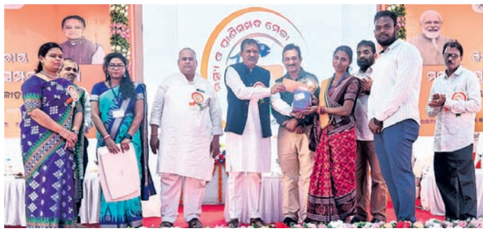
ଜଣେ ସଫଳ ମହିଳା ଚାଷୀଙ୍କୁ ସମର୍ଥନ କରାଯାଇଛି।