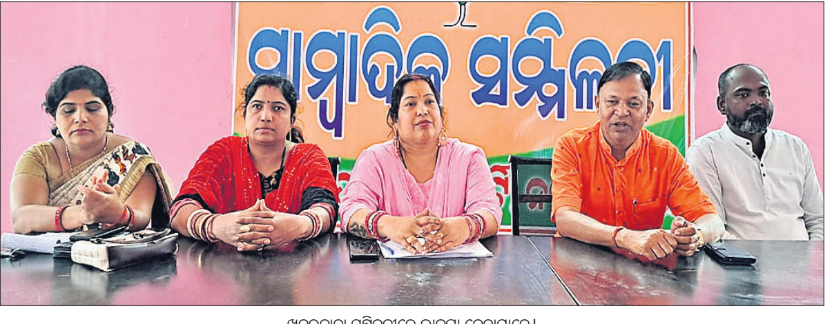
ଖବରଦାତା ସମ୍ମିଳନୀରେ ଭାଜପା ନେତାମାନେ ।