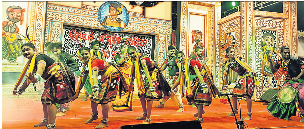
କଳାକାରମାନେ ନୃତ୍ୟ ପରିବେଷଣ କରୁଛନ୍ତି।