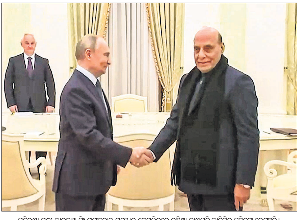
ପ୍ରତିରକ୍ଷା ମନ୍ତ୍ରୀ ରାଜନାଥ ସିଂ ମଙ୍ଗଳବାର ମଧ୍ୟରେ ଜେମଲିନରେ ଭୃଷିଆ ରାଷ୍ଟ୍ରପତି ଭାଡ଼ିମିର୍ ପୂର୍ବକୁ ଭେଟୁଛନ୍ତି।

ଜର୍ମାନୀରେ ଲିଙ୍ଗାୟତ ପଞ୍ଚମପାଲି ସମୁଦାୟ ପାଇଁ ସଂରକ୍ଷଣ ଦାବିରେ ମଙ୍ଗଳବାର ବିଧାନସଭା ଘେରାଉ କରାଯାଇଛି। ସମୁଦାୟର ଧାର୍ମିକ ମୁଖ୍ୟ ବସଭକ୍ତ ମୁଦୁମୁଖ୍ୟ ସ୍ୱାମିନାଥ ନେତୃତ୍ୱରେ ପ୍ରଦର୍ଶନକାରୀ ସୁରକ୍ଷା କର୍ତ୍ତନ ଭାଙ୍ଗି ବିଧାନସଭା ଆଡ଼କୁ ଯିବାକୁ ଚେଷ୍ଟା କରୁଥିବାବେଳେ ପୋଲିସ୍ ଲାଠିଚାର୍ଜ କରିଛି। ଫଳରେ ପୋଲିସ୍ ଓ ବିକ୍ଷୋଭକାରୀଙ୍କ ମଧ୍ୟରେ ଯୁଦ୍ଧାଧି ହୋଇଥିଲା। ପୋଲିସ୍ ସ୍ୱାମିନାଥ ସମେତ କେତେକଙ୍କ ଭାଙ୍ଗିପା ବିଧାୟକଙ୍କୁ ଅଟକ ରଖିଛି।