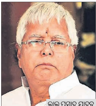
ଲାଲୁ ପ୍ରସାଦ ଯାଦବ

ନେତୃତ୍ୱ ନେବା ଉଚିତ। ଆମେ ତାଙ୍କୁ ସମର୍ଥନ ଜଣାଇବା। ଏବେ କଂଗ୍ରେସ ପ୍ରତିବାଦର କିଛି ମାନେ ନ ଥିବା ଆରକ୍ଷେତ୍ର ସୁପ୍ରିମୋ କହିଛନ୍ତି। ବିହାର ବିଧାନସଭା ନିର୍ବାଚନ ଆଉ ମାତ୍ର ବର୍ଷକୁ କମ୍ ସମୟ ଥିବାବେଳେ କଂଗ୍ରେସ-ଆରକ୍ଷେତ୍ର ମେଣ୍ଟରେ ଫାଟ ଦେଖିବାକୁ ମିଳିଛି। ଡିଏମ୍ପି ଇଣ୍ଡିଆ ବ୍ଲକ୍ ନେତୃତ୍ୱ ନେବା ପ୍ରସ୍ତାବକୁ କଂଗ୍ରେସର କେତେକ ଏମ୍ପି ବିରୋଧ କରିଥିବାବେଳେ କୌଣସି ପ୍ରତିକ୍ରିୟା ନ ଦେବାକୁ ରାହୁଲ ଗାନ୍ଧୀ