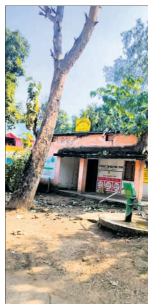
ଧନଜୀବନ ହାରି ଆଶଙ୍କା

ଖାରପୁରୁଆ ଜିଲ୍ଲା କୋଲାରା ଜୁକ୍ ଅନ୍ତର୍ଗତ ରଘୁନାଥପାଳି ପ୍ରଧାନିପାଳିତ ୫ ନମର ଆଜନୀନ ଓଡ଼ିଆ କେନ୍ଦ୍ରକୁ ଲାଗି ଏକ ବିରାଟକାନ୍ୟ ଶାଗୁଆନ ଗଛ ରହିଛି। କୌଣସି କାରଣରୁ ଉକ୍ତ ଗଛ ଗୋଟିଏ ପାଖକୁ ଆଜନୀନ ଓଡ଼ିଆ ଆଡ଼କୁ ବଙ୍କେଇ ହୋଇ ବିପଦସଙ୍କୁଳ ଅବସ୍ଥାରେ ରହିଛି।