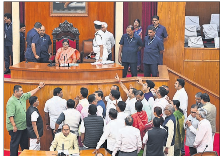
ବିଧାନସଭାରେ ମିଶନ୍ ଶକ୍ତି ମହିଳା ପ୍ରସଙ୍ଗକୁ ନେଇ ବିରୋଧୀମାନେ ହଇଚୋଳ କରୁଛନ୍ତି ।

ମହିଳାଙ୍କୁ ରାଜନୈତିକ ଉଦ୍ଦେଶ୍ୟରେ ବ୍ୟବହାର କରାଯାଉଥିଲା: ଭାଜପା