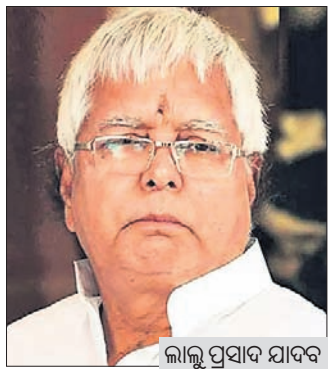
ଲାଲୁ ପ୍ରସାଦ ଯାଦବ

ପାଲୀମେଣ୍ଟର ଶୀତ ଅଧିବେଶନରେ ପ୍ରଧାନମନ୍ତ୍ରୀ ନରେନ୍ଦ୍ର ମୋଦିଙ୍କ ସରକାରକୁ ଯେଉଁ ପାଇଁ ବିରୋଧୀ ରଖନୀତି ପ୍ରସ୍ତୁତ କରିଥିବାବେଳେ ଏବେ ସେମାନଙ୍କ ମଧ୍ୟରେ ମତଭେଦ ବଢ଼ିବାରେ ଲାଗିଛି।