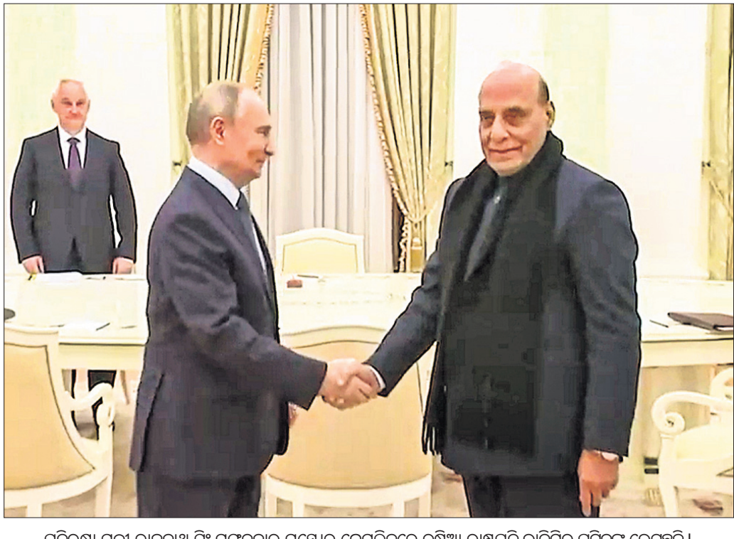
ପ୍ରତିରକ୍ଷା ମନ୍ତ୍ରୀ ରାଜନାଥ ସିଂ ମଙ୍ଗଳବାର ମଧ୍ୟାହ୍ନ ଭେଜେଟିଭ୍ ଭେଟିଂରେ ଭୁଣ୍ଡିଆ ରାଷ୍ଟ୍ରପତି ଭାଡିମିର୍ ପୁଟିନଙ୍କୁ ଭେଟୁଛନ୍ତି।

ଜର୍ମାନୀରେ ଲିଙ୍ଗାୟତ ପଞ୍ଚମପାଲି ସମୁଦାୟ ପାଇଁ ସଂରକ୍ଷଣ ଦାବିରେ ମଙ୍ଗଳବାର ବିଧାନସଭା ଘେରାଉ କରାଯାଇଛି।