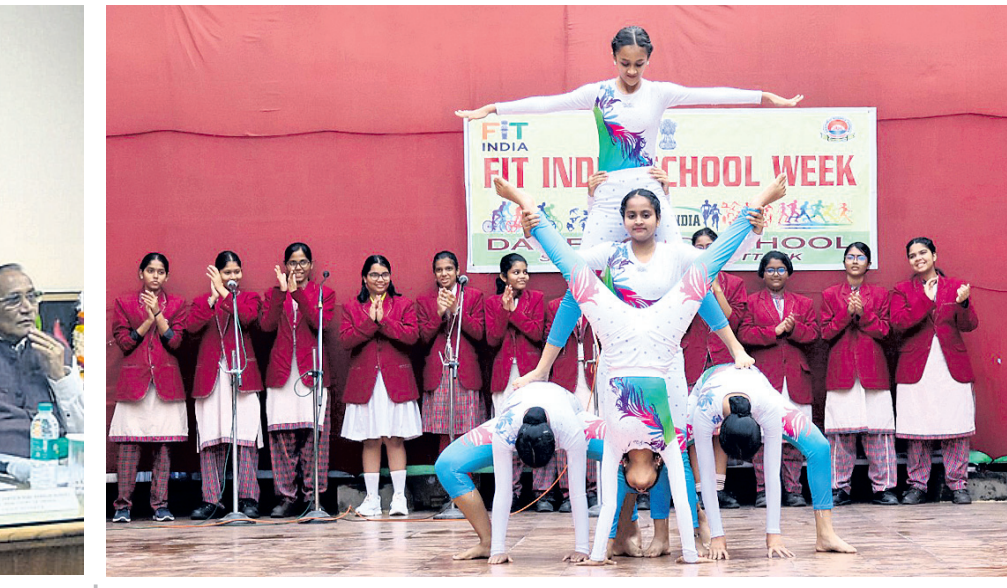
କଟକ ସିଟିସ୍ ସେକ୍ଟର-୬ସ୍ଥିତ ଡିଏସ୍ ପବ୍ଲିକ୍ ସ୍କୁଲରେ ଫିଟ୍ ଇଣ୍ଡିଆ ଉଦ୍‌ଘାଟନା ଅବସରରେ ଛାତ୍ରୀମାନେ ଯୋଗ ଦର୍ଶନ କରୁଛନ୍ତି ।