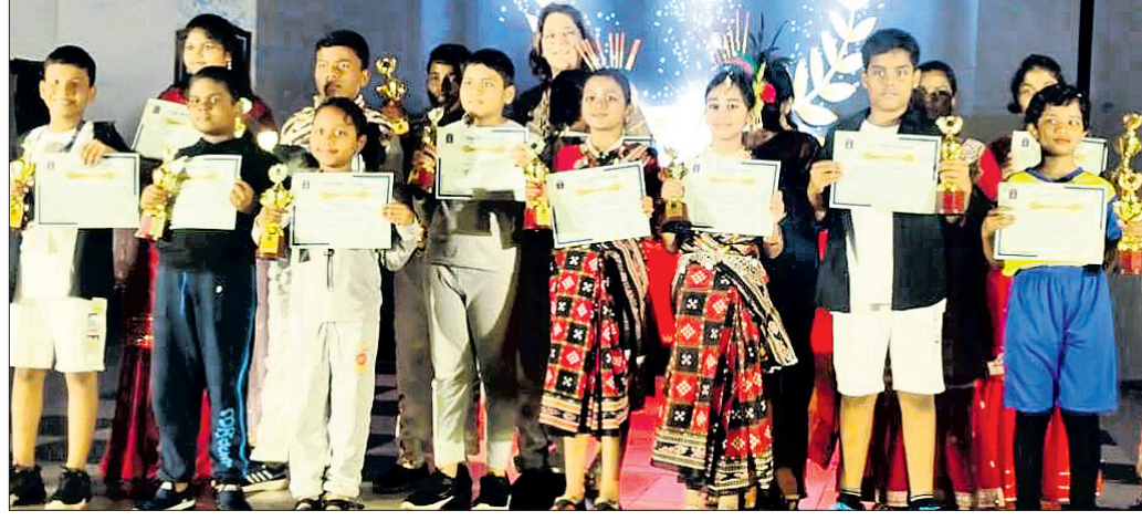
ବିଆଇପିଏଫ୍ ସ୍କୁଲର ବାର୍ଷିକ ଉତ୍ସବରେ କୁଟା ଛାତ୍ରୀଛାତ୍ର ଓ ଅନ୍ୟମାନେ ।

ବିଆଇପିଏଫ୍ ସ୍କୁଲର ବାର୍ଷିକ ଉତ୍ସବରେ କୁଟା ଛାତ୍ରୀଛାତ୍ର ଓ ଅନ୍ୟମାନେ । ଚୌଦ୍ୱାର, ୧୦.୧୨ (ଆଶୁଗୋଷ୍ଠୀ ଦାସ)