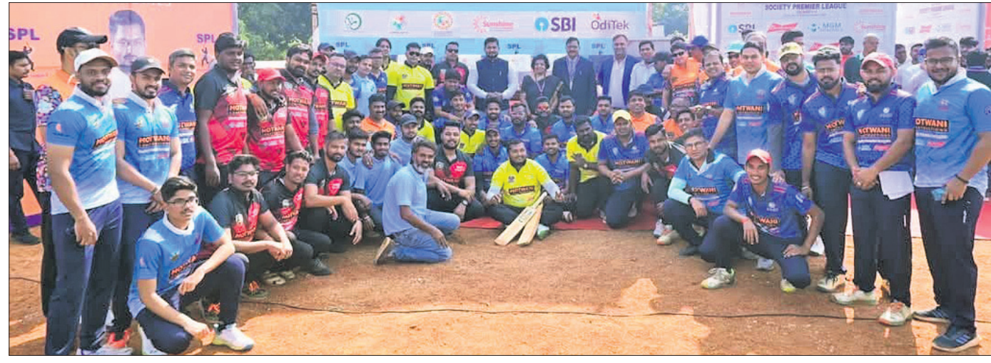
ଅତିଥି ଓ କର୍ମକର୍ତ୍ତାଙ୍କ ଗହଣରେ ସବୁ ଦଳର ଖେଳାଳି।

ଭୁବନେଶ୍ୱର, ୧୬୧୨ (ସରୋଜ କେନା) ଖ୍ରୀଷ୍ଟୀୟ ଗ୍ରହଣରେ ଗାଲାକ୍ରିଆନ ଟ୍ରଷ୍ଟ ଆନୁକୂଲ୍ୟରେ ସୋସାଇଟି ପ୍ରିମିୟର୍ ଲିଗ୍ (ଏସ୍.ପି.ଏଲ୍)ର ପଞ୍ଚମ ସଂସ୍କରଣ ସୋସାଇଟି ବିଶ୍ୱବିଦ୍ୟାଳୟ ପରିସରରେ ଆରମ୍ଭ ହୋଇଛି। ଏଥିରେ ହାଉସିଂ ସୋସାଇଟି ଗ୍ରାଉଣ୍ଡେଣ୍ଟ ଗାଲାକ୍ରିଆ, ଗାଗା ଏରିନା, ଜିପ୍ସି ଗାଡେଟ୍ସ, ଆଲିସାନ୍