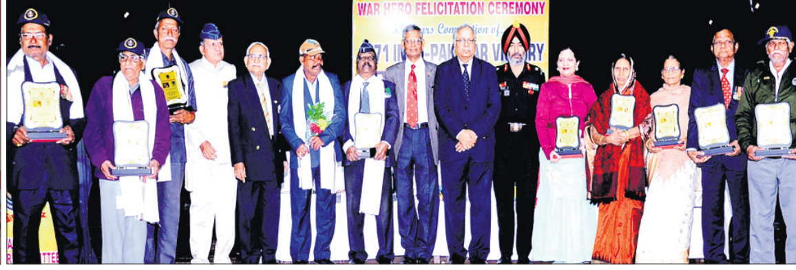
କଟକ କଳାବିକାଶ କେନ୍ଦ୍ରରେ ଅନୁଷ୍ଠିତ ସୂକ୍ଷ୍ମକାର ସମ୍ବର୍ଦ୍ଧନା ସମାରୋହରେ ସମ୍ବର୍ଦ୍ଧିତ ଧୀର ହିରୋ ଓ ପରିବାର ସଦସ୍ୟଙ୍କ ଗହଣରେ ଉପସ୍ଥିତ ଅତିଥିବୃନ୍ଦ।