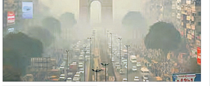
ଦିଲ୍ଲୀରେ ଜିଆର୍‌ସି-୪ କଟକଣା

ପ୍ରଦୂଷଣ ନିରୋଧୀ ବ୍ୟବସ୍ଥା କାର୍ଯ୍ୟକାରୀ ହେଉ ନ ଥିବାରୁ ଦିଲ୍ଲୀରେ ଜିଆର୍‌ସି-୪ (ଗ୍ରେଡେଡ୍ ରୋଡ୍) ଆକ୍ରମଣ ପ୍ଲାନ) କଟକଣା ବିଫଳ ହୋଇଥିବା କୋର୍ଟ କମିଶନ ଜଣାଇଥିଲେ। ଗତ ମାସରେ ଦିଲ୍ଲୀରେ ବାୟୁ ପ୍ରଦୂଷଣ ଅତ୍ୟନ୍ତ ଗମ୍ଭୀର