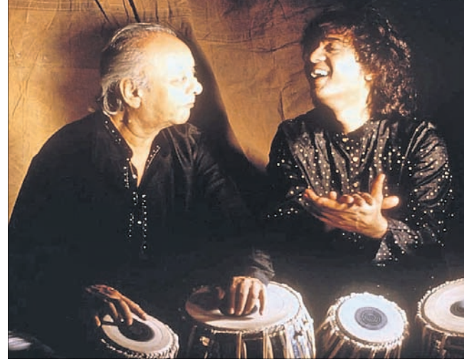
ବାଦ୍ୟ ତଥା ଗୁରୁ ଉତ୍ତମ ଆଲାରଖା ଖାନ୍ଙ୍କ ସହ ଜାକିର ହୁସେନ ।

ଭାରତର ସ୍ୱଚ୍ଛତା ସହର ଭୁବନେଶ୍ୱରରେ ଭିକାରି ଗୁଡ଼ିକକୁ ପ୍ରାୟ ୧୨ ହଜାର ମଧ୍ୟରେ ଭିକାରିଙ୍କୁ ଟଙ୍କା ଦେଉଥିବା ବ୍ୟକ୍ତିଙ୍କ ବିରୋଧରେ ମାମଲା ରୁଜୁ କରାଯିବ ବୋଲି ଜିଲ୍ଲା ପ୍ରଶାସନ ପକ୍ଷରୁ ସୋମବାର ଏହି ନିର୍ଦ୍ଦେଶନାମା ଜାରି କରାଯାଇଛି। ଏନେଇ ସୂଚନା ଦେଇ ଭୁବନେଶ୍ୱର ଜିଲ୍ଲାପାଳ ଆଶିଷ ସିଂହ କହିଛନ୍ତି, ସହରକୁ ଭିକାରିମୁକ୍ତ ଓ ଭିକାରୀମାନଙ୍କ ଅଭିଧାନ ପାଇଁ କେନ୍ଦ୍ର ସରକାରଙ୍କ ପକ୍ଷରୁ ଆରମ୍ଭ ହୋଇଥିବା ପାଇଁ କେନ୍ଦ୍ର ପ୍ରୋଜେକ୍ଟ ଉତ୍ତରରେ ଜିଲ୍ଲା ପ୍ରଶାସନ ଏହି ନିଷ୍ପତ୍ତି ନେଇଛି। ଭିକାରିଙ୍କୁ ଟଙ୍କା ଦେଇ ପାପର ଭାଗାଦାରି ନ ହେବାକୁ ସେ ଲୋକଙ୍କୁ ନିବେଦନ କରିଛନ୍ତି। ଆସନ୍ତା ୩୧ ଯାଏ ଜିଲ୍ଲା ପ୍ରଶାସନ ପକ୍ଷରୁ ଭିକାରିଙ୍କ ବିରୋଧରେ ସହର ବ୍ୟାପୀ ଜାଗରଣ ଅଭିଯାନ ଜାରି ରହିବ। ସହରକୁ ଭିକାରିମୁକ୍ତ କରିବା