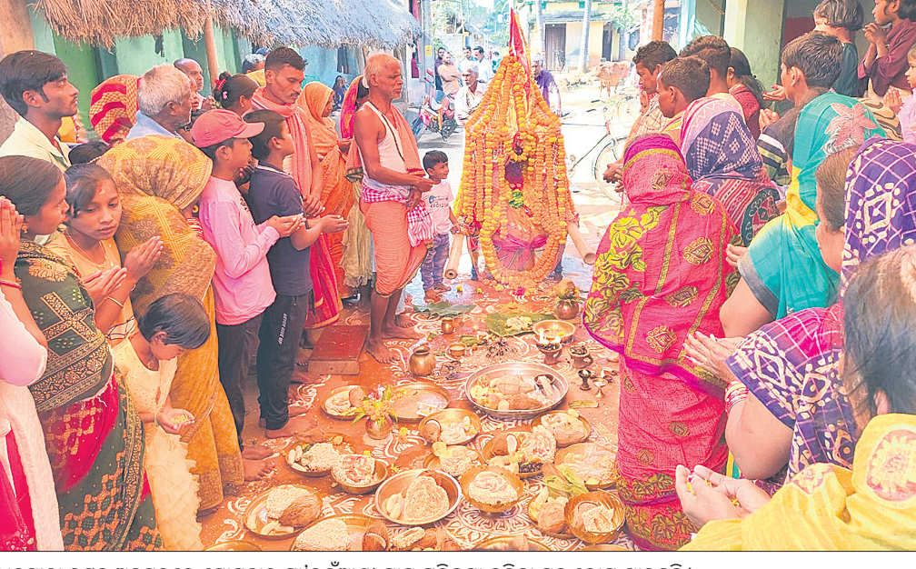
ଧନୁଯାତ୍ରା ଉତ୍ସବ ଅବସରରେ ଯୋଗବାର ମା' ଭୂଇଁଆଣୀ ଗ୍ରାମ ପରିକ୍ରମା କରିବା ସହ ଭୋଗ ଖାଉଛନ୍ତି।

ରଖିଥିଲା। ନୃତ୍ୟାୟନ କଳାକାରମାନେ ପ୍ରଥମ ଅର୍ଦ୍ଧରେ ଓଡ଼ିଶା ନୃତ୍ୟରେ ମଙ୍ଗଳାଚରଣ ପରିବେଷଣ କରିଥିଲେ। ପରେ ନୃତ୍ୟଧାରୀ ଭୁବନେଶ୍ୱର, ନାଳକୋଳ ନୃତ୍ୟ ଅନୁଷ୍ଠାନ, ସ୍ଥାନୀୟ ଗୁଳ୍ମ ଶାଳତର, ରଣପୁରର ଏସ୍‌ଆର୍ ଡ୍ୟାନ୍ସ ଗ୍ରୁପ୍ ଏବଂ ଦେବୀ ଡ୍ୟାନ୍ସ ଭୁବନେଶ୍ୱର କଳାକାରମାନେ ସାଂସ୍କୃତିକ ପରିବେଷଣ କରିଥିଲେ।