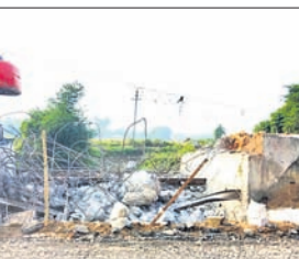
କଟକ ସଦର, ୧୬/୧୨ (ସୁଶାନ୍ତ କୁମାର ଜେନା)

୫୫ ନମ୍ବର ଜାତୀୟ ରାଜପଥର କଟକ ସଦର ବ୍ଲକ ଅନ୍ତର୍ଗତ ଅଥଳା ନିକଟରେ ଥିବା କାଠପୋଲକୁ ନବୀକରଣ ପାଇଁ ଭାଙ୍ଗି ଦିଆଯାଇଛି। ଭାରତୀୟ ନବୀକରଣ ଦଳରୁ ନୂଆ ଯୋଜନା ନିର୍ମାଣ କାର୍ଯ୍ୟ ଆରମ୍ଭ ହୋଇ ଆସିଛି। କୁନ୍ଦ ପୁଞ୍ଜା ଶେଷ କରାଯିବ ବୋଲି ଜାତୀୟ ରାଜପଥ ପ୍ରାଧିକରଣ ଲକ୍ଷ୍ୟ ରଖିଛି। ଜରୁରୀ-ହସ୍ତକ୍ଷେପ ଅଞ୍ଚଳକୁ ଯାତାୟତ ପାଇଁ ହଂଶୁଆ ନଦୀ ଉପରେ ବ୍ରିଜ୍ ଅବସ୍ଥାରେ ଏହି କାଠ ପୋଲ ନିର୍ମାଣ କରାଯାଇଥିଲା। ୧୯୫୨ ମସିହାରେ ଏଠାରେ ପକା ପୋଲ କରାଗଲା। କନ୍ଦପୁର ଲେବଲ କ୍ରସିଂ ନିକଟରେ ଓଭରବ୍ରିଜ୍ ନିର୍ମାଣରେ ବିଳମ୍ବ ଘଟିବା କାରଣରୁ କେଉଁ ସ୍ଥାନରେ ବ୍ରିଜ୍ କରାଯିବ ତାହା ଅଧ୍ୟୟନ ସ୍ଥିର ହୋଇପାରୁନାହିଁ। ତେଣୁ ଏହି ପୋଲକୁ ପ୍ରଶସ୍ତ କରାଯିବ। ଫଳରେ ଭବିଷ୍ୟତରେ ୨ ଲେନ୍ ରାସ୍ତା ହୋଇପାରିବ ବୋଲି ଜାତୀୟ ରାଜପଥ ପ୍ରାଧିକରଣ କରଣର ଜଣେ ବରିଷ୍ଠ ଯନ୍ତ୍ରୀ କହିଛନ୍ତି।