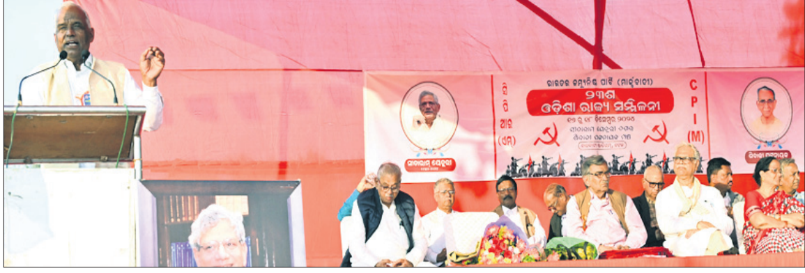
କଟକ ବାଲିଯାତ୍ରା ଉପରପଡ଼ିଆରେ ଅନୁଷ୍ଠିତ ସିପିଆଇ(ଏମ)ର ଓଡ଼ିଶା ରାଜ୍ୟ ସମ୍ମିଳନୀରେ ଉପସ୍ଥିତ ଅତିଥିବୃନ୍ଦ।