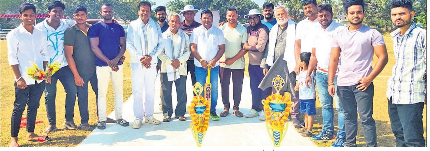
ଉଦ୍ଘାଟନା ଅବସରରେ ଉପସ୍ଥିତ ଅତିଥି ଓ କର୍ମକର୍ତ୍ତା।

ଭୁବନେଶ୍ୱର, ୧୬୧୨ (ବିଜୟ ରଣା) ଭଗବାନପୁର ଷ୍ଟାଡ଼ିୟମ୍ ଆଣ୍ଡ କଲଚରାଲ ଆସୋସିଏଶନ ଟ୍ରଷ୍ଟ ଆନୁକୂଲ୍ୟରେ ମିନିଷ୍ଟ୍ରିୟମରେ ୧୩ତମ ରାଜ୍ୟସ୍ତରୀୟ କ୍ରିକେଟ ଚୁନାମେଣ୍ଟ ଆରମ୍ଭ ହୋଇଛି। ସୋମବାର ଉଦ୍ଘାଟନା ଦିବସରେ ଅନୁଷ୍ଠିତ ଦୁଇଟି ଲିଗ୍ ମ୍ୟାଚରେ ତିସିସି