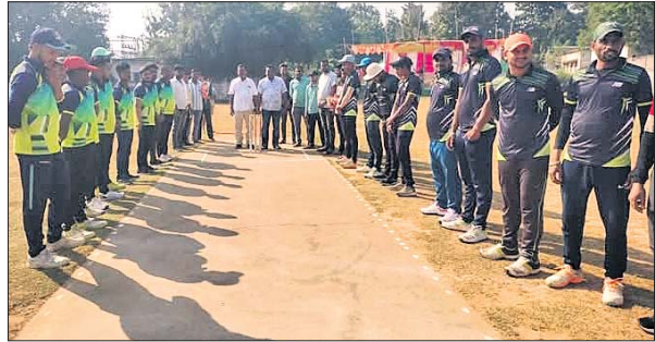
ଅତିଥିକ ଗହଣରେ ଉଭୟ ଦଳର ଖେଳାଳି।

ତିରିଆ କୁ ଅନ୍ତର୍ଗତ ଦୁଆପାଟଣାସ୍ଥିତ ଅର୍ଜୁନ ସ୍ମୃତି ଉଚ୍ଚ ବିଦ୍ୟାଳୟରେ ଛତ୍ରପତି ଶିବାଜୀ ଆସୋସିଏସନ ପକ୍ଷରୁ ୩୩ ତମ ରାଜ ପ୍ରତ୍ୟାୟ କ୍ରିକେଟ ଚୁନାବେଳାର ସୋମବାର ଦ୍ୱିତୀୟ ଭାର୍ଟି ଫାଇନାଲ ମ୍ୟାଚ ଅନୁଷ୍ଠିତ ହୋଇଯାଇଛି। ଏଥିରେ ଉପାପାଟଣା କୁ ଶ୍ୱାର କ୍ରିକେଟ କ୍ଲବ୍ ୪୫ ରନରେ ପରାସ୍ତ କରି ତିରିଆର ପ୍ରସନ୍ନମଣି କ୍ରିକେଟ କ୍ଲବ୍ ସେମିପାଇନାଲରେ ପ୍ରବେଶ କରିଛି। ଚତୁର୍ଥ ତିରିଆ ଦଳ ପ୍ରଥମେ ନିର୍ଦ୍ଧାରିତ ୨୦ ଓଭରରେ ସମସ୍ତ ଉଲ୍ଲେଖ ହରାଇ ୨୧୭ ରନ ସଂଗ୍ରହ