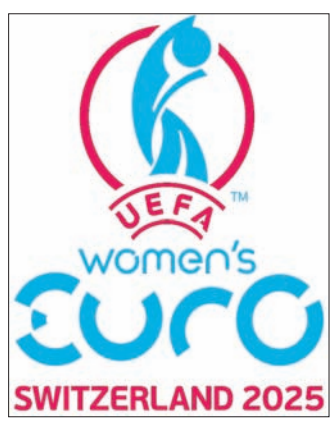
ପାଇବେ। ଏହି ରାଶିର ଅତିକମରେ ୩୦% ଅର୍ଥ ଖେଳାଳିମାନଙ୍କ ମଧ୍ୟରେ ବାଣ୍ଟି

ଲାଇଭାଗେ, ୧୬୧୨ (ଏପି) ମହିଳା ଯୁରୋପିଆନ ଫୁଟବଲ ଚାମ୍ପିୟନଶିପ୍ ୨୦୨୪ର ପୁରସ୍କାର ରାଶିକୁ ଗତବର୍ଷ ତୁଳନାରେ ଦୁଇଗୁଣାରୁ ଅଧିକ କରାଯାଇଛି। ଚୁନାମେଣ୍ଟରେ ଭାଗ ନେଉଥିବା ୧୬ଟି ଦଳ ୪୧ ନିୟୁଟ ଯୁରୋ (୪୩ ନିୟୁଟ ଡଲାର) କରାଯାଇଥିବା ଯୁରୋ (ୟୁନିୟନ ଅଫ୍ ଯୁରୋପିଆନ ଫୁଟବଲ ଆସୋସିଏଶନ୍) ସୋମବାର ପ୍ରକାଶ କରିଛି। ସୁଇଜରଲ୍ୟାଣ୍ଡରେ ଖେଳାଯିବାକୁଥିବା ଯୁରୋ ୨୦୨୪ରେ ଖେଳୁଥିବା ପ୍ରତ୍ୟେକ ଫେଡେରେଶନ ଅତିକମରେ ୧.୮ ନିୟୁଟ ଯୁରୋ (୧.୯ ନିୟୁଟ ଡଲାର)