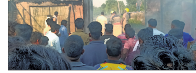
ନିରାକାରପୁର, ୧୬.୧୨ (ମାନସ ଚନ୍ଦ୍ର ପଟ୍ଟନାୟକ)

ନିରାକାରପୁର ବଜାରରେ ଯୋଗବାର ଦେଖି ଅଗ୍ନିଶମ ବିଭାଗକୁ ଜଣାଇଥିଲେ। ନବାନକ ଦୋକାନରେ ଥିବା ଟଙ୍କା ଏବଂ ବିଭିନ୍ନ କମ୍ପାନୀର ବିଷୁଟ, ଆଲମ୍ପି, କାଳ୍ପ, ପେସ୍ତାବାଦୀ ସହ ଅନ୍ୟାନ୍ୟ ସାମଗ୍ରୀ ପୋଡ଼ିଯାଇଛି। ସେହିପରି ହାପିକ ପରିବା ଦୋକାନ ଜଳିଯାଇଛି। ଦୋକାନରେ ଥିବା ଟଙ୍କା ସହ ଲକ୍ଷାଧିକ ଟଙ୍କାର ସାମଗ୍ରୀ ପୋଡ଼ି ପାର୍ଶ୍ୱ ହୋଇଯାଇଛି। ଖବରପାଇ ଗାଙ୍ଗା ଅଗ୍ନିଶମ ବାହିନୀ ପହଞ୍ଚି ସ୍ଥାନୀୟ ଲୋକଙ୍କ ସହାୟତାରେ ନିଆଁକୁ ଆୟତ୍ତ କରିଥିଲା। ତେବେ ଅଗ୍ନିକାଣ୍ଡର କାରଣ ଅସ୍ପଷ୍ଟ ରହିଛି। ସୂଚନା ମୁତାବକ, ଯୋଗବାର ସଂକ୍ରାନ୍ତି ଥିବାରୁ ବଜାରର ସ୍ତରଗ୍ରସ୍ତ ଦୋକାନୀଙ୍କୁ ସରକାରୀ ସହାୟତା ମାଗରେ ଦୋକାନଗୁଡ଼ିକକୁ ନିଆଁ ଏବଂ