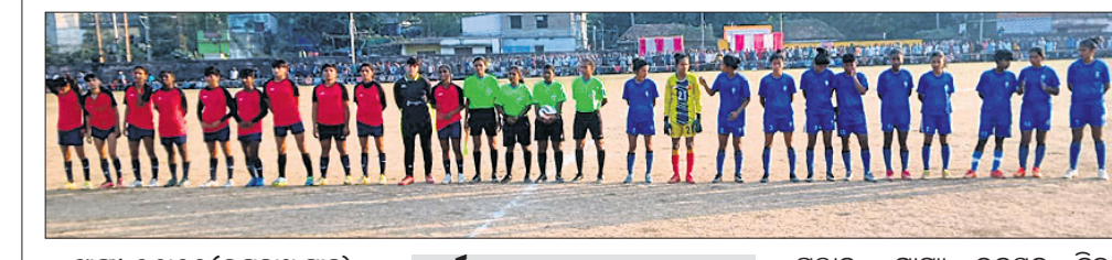
ଗାଙ୍ଗା, ୧୬.୧୨ (ରଞ୍ଜନାଥ ସାହୁ)

ତିନିଜା ଷ୍ଟାଡ଼ିୟମଠାରେ ଅନୁଷ୍ଠିତ ସର୍ବଭାରତୀୟ ମହିଳା ଫୁଟ୍‌ବଲ୍ ଟୁର୍ଣ୍ଣାମେଣ୍ଟ ଚାମ୍ପିୟନଶିପ୍‌ର ଦ୍ୱିତୀୟ ସେମିଫାଇନାଲ ମ୍ୟାଚ୍ କୋଲକାତା ଏକାଦଶୀ ଏବଂ ବିହାର ଏକାଦଶୀ ମଧ୍ୟରେ ହୋଇଥିଲା। ଏହି ମ୍ୟାଚ୍ ସଂପର୍କପୂର୍ଣ୍ଣ ହୋଇଥିବା ବେଳେ ୨-୦ ଗୋଲରେ କୋଲକାତା ଏକାଦଶୀ ବିଜୟୀ ହୋଇ ଫାଇନାଲରେ ପ୍ରବେଶ କରିଛି। କୋଲକାତା ଏକାଦଶୀ ଟିମ୍ ୭ ନମ୍ବର ଜର୍ସି ଖେଳାଇ ମନମୋହନ