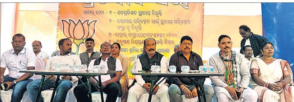
ପ୍ରତିବାଦ ସଭାରେ ମଞ୍ଚାସୀନ ଭାଜପା କର୍ମକର୍ତା।