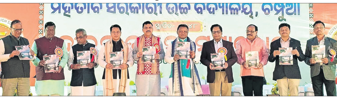
ମୁଖ୍ୟମନ୍ତ୍ରୀ ମୋହନ ଚରଣ ମାଝୀ ଏ ଅତିଥିମାନେ ସ୍ମରଣିକା ଉଦ୍ଘୋଷଣା କରୁଛନ୍ତି ।