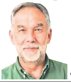
ମାଉରିସିଓ କାହ୍ନୋର ଲିୟନ