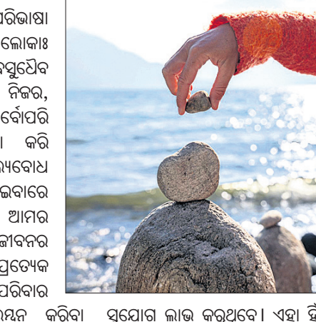
କାମନାର ଆବଶ୍ୟକତା ନିମନ୍ତେ ସମ୍ପୂର୍ଣ୍ଣ ହିତାଧିକାରୀଙ୍କ ଅବଦାନ କ'ଣ ରହିବ, ତାଙ୍କ ଜୀବନକୁ କେତେ ପରିମାଣରେ ଓ କେତେଦିନ ପର୍ଯ୍ୟନ୍ତ କୁହୁମିତି କରିବ ତା'ର ପୂର୍ଣ୍ଣାବୁଦ୍ଧି ବିଶେଷତା ଓ ପରାମର୍ଶ ରହିବା ଉଚିତ । ଉଭୟ ସେବା ପ୍ରଦାନକାରୀ ଓ ହିତାଧିକାରୀ ବ୍ୟକ୍ତିରେ ଅନଭିଜ୍ଞ ଥିବାକୁ ସୁଧିଆ ବା ଯୋଜନାକୁ ସାମାଜିକ ବୋଲି ଗ୍ରହଣ କରିନିଅନ୍ତି । ଏହି ଜୀବିକାର ସ୍ୱାଧିନ୍ୟ ଉପରେ ପ୍ରଶ୍ନାବଳୀ ସୃଷ୍ଟି ହେବା ସାମାଜିକ ପଥ । ସେହିପରି ଆବଶ୍ୟକତା ଆଧାରରେ ପରିବାର ସମ୍ପର୍କାକରଣ ସୁଧିଆ ଓ ଯୋଜନା ଯୋଡ଼ିବାର କାରଣ ହେଉଛି ସାମାଜିକ

ସେବା ବା ହାସଲ କରାଯାଉଥିବା ସଫଳତା ଓ ସୁବିଧାଗୁଡ଼ିକ ତିରଣୀୟା ହୋଇପାରୁନାହିଁ । କାରଣ ଗୋଟିଏ ଜୀବନ ପରିବାର ସହିତ, ପରିବାର ଗୋଷ୍ଠୀ ସହିତ, ଗୋଷ୍ଠୀ ଅଞ୍ଚଳ ସହିତ, ଅଞ୍ଚଳ ସହିତ ଦେଶ ଯୋଡ଼ା । ସେହିପରି ପ୍ରତିଟି ଜୀବନର ଆବଶ୍ୟକତା ପୂରଣ ଜୀବନର ମୂଲ୍ୟବୋଧ ସହିତ ସଂଯୁକ୍ତ । ଏହି ଜୀବନର ମୂଲ୍ୟବୋଧ ବିଷୟରେ ଆତ୍ମସତ୍ତ୍ୱରେ ନ ହେବା ଯାଏ ତିରଣୀୟା ବିକାଶର ପରିକଳ୍ପନା ଅସମ୍ଭବ । ଉଦାହରଣ ସ୍ୱରୂପ ଜୀବିକାର ଉନ୍ନତି ପାଇଁ ପ୍ରଦାନ କରାଯାଉଥିବା ଅର୍ଥର ଉପଯୁକ୍ତ ବିନିଯୋଗ, ଯୁକ୍ତି, ଲାଭକ୍ଷତର ହିସାବ ସହିତ ବ୍ୟବସାୟ ଯୋଜନାରେ ଗ୍ରାହକ ଓ ସମାଜର ମଙ୍ଗଳ