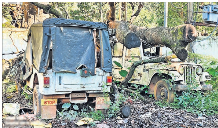
ସ୍ୱାସ୍ଥ୍ୟକେନ୍ଦ୍ର ପରିସରରେ ପଡ଼ିରହିଥିବା ଆମ୍ବୁଲାନ୍ସ।