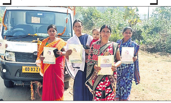
ସଚେତନତା ରଥ ବାହାର ଦେଓଗାଁ, କୁଳୁଲୀ, ବଡ଼ବନ୍ଧ, ଦେସଖଣ୍ଡ, ବନ୍ଧପଡ଼ା, ଭୁବନାହାଲ, ସିକୁଆଁ, ଭୂତିଆରବାହାଲ, ଗାଇବାହାଲ, ଉପରଘର, ମହଲେଇ, କୁଳାପଡ଼ା, ଅର୍ଜୁନପୁର, ବଡ଼ବାହାଲ, ଗୁଡ଼ଖାପଲୀ ପଞ୍ଚାୟତର ବିଭିନ୍ନ ଗ୍ରାମ ପରିକ୍ରମା କରାଯାଇଛି।

କଳାଜୀର ଜିଲ୍ଲା ଶିଶୁ ସୁରକ୍ଷା ଯୁକ୍ତ ପକ୍ଷରୁ ପୌଷ୍ୟ ସନ୍ତାନ ଗ୍ରହଣ ନିମନ୍ତେ ସଚେତନତା ଉପର ଗୁଡ଼ଖାପଲୀ ପଞ୍ଚାୟତର ଗ୍ରାମ ପରିକ୍ରମା କରାଯାଇଛି।