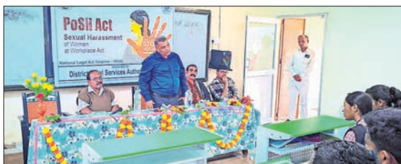
କୃଷ୍ଣା କଲେଜରେ ଆଇନ ସଚେତନତା କାର୍ଯ୍ୟକ୍ରମ।

କଳାଜୀର ଜିଲ୍ଲା ଦେଓଗାଁ ବ୍ଲକ୍ କୁଳୁଲୀ ପଞ୍ଚାୟତ ଅଧୀନସ୍ଥ ଧୂଳା ଆନନ୍ଦ ଉଚ୍ଚ ମାଧ୍ୟମିକ ବିଦ୍ୟାଳୟରେ ଆଇନ ସଚେତନତା କାର୍ଯ୍ୟକ୍ରମ ଗୁରୁବାର ଅନୁଷ୍ଠିତ ହୋଇଯାଇଛି।