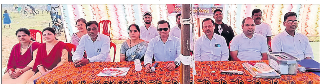
ବାର୍ଷିକ କ୍ରୀଡ଼ା ଉତ୍ସବରେ ଅତିଥିଗଣ।

ଏଥିରେ ବିଦ୍ୟାଳୟର ପ୍ରାୟ ୩୦୦ରୁ ଊର୍ଦ୍ଧ୍ୱ ଛାତ୍ରଛାତ୍ରୀ ସାମିଲ ହୋଇଥିଲେ। ଉତ୍ସବରେ ସିନିୟର, ଜୁନିୟର ଓ ସର୍ବଜୁନିୟର ଗ୍ରୁପରେ ଉଭୟ ବାଳକ ଓ ବାଳିକା ବିଭାଗରେ ପ୍ରାୟ ୨୮ ପ୍ରକାର ପ୍ରତିଯୋଗିତା ଅନୁଷ୍ଠିତ ହେବ।