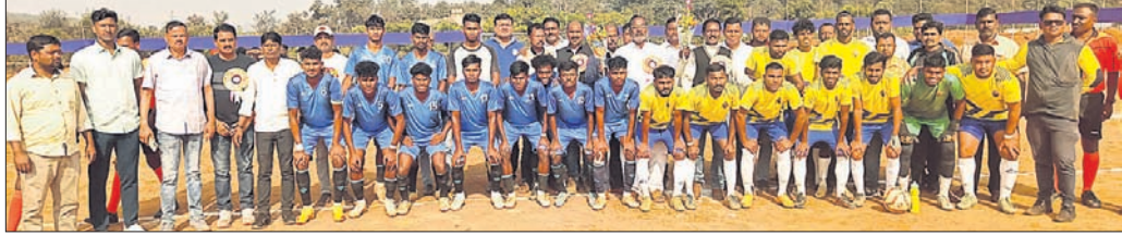
ଅତିଥିଙ୍କ ଗହଣରେ ପ୍ରତିଯୋଗୀତାରେ ଭାଗ ନେଇଥିବା ଖେଳାଳି।