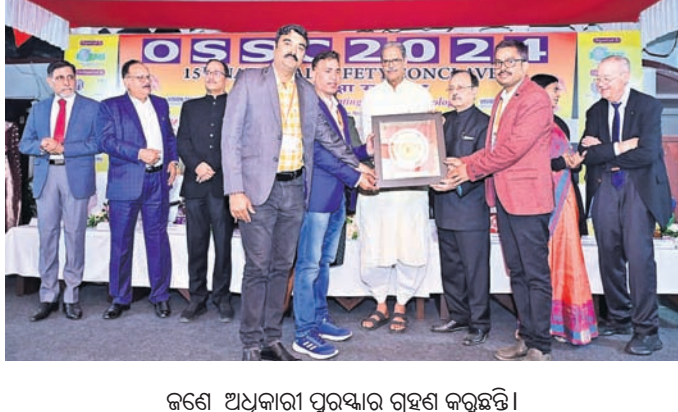
ଜଣେ ଅଧିକାରୀ ପୁରସ୍କାର ଗ୍ରହଣ କରୁଛନ୍ତି।

ଭୁବନେଶ୍ୱରଠାରେ ଆୟୋଜିତ ୧୫ତମ ଜାତୀୟ ପୁରସ୍କାର ସମ୍ମାନରେ ସୁନ୍ଦରଗଡ଼ ଜିଲ୍ଲା କୋଇଲାଠାରେ ଥିବା ରୁଜ୍ଜାଟା ମାଇସ୍ଟ୍ର ଲିମିଟେଡ କମଣ୍ଡ ଷ୍ଟିଲ୍ ପ୍ଲାଣ୍ଟକୁ ସ୍ୱର୍ଣ୍ଣ ପୁରସ୍କାର ପ୍ରଦାନ କରାଯାଇଛି। ୧୫ତମ ଜାତୀୟ ପୁରସ୍କାର ସମ୍ମାନରେ ଭାଗିନୀ ଥିବା ସମସ୍ତ ପ୍ରକଳ୍ପ ମଧ୍ୟରେ ସ୍ୱୀକୃତି ପୁରସ୍କାର, ସ୍ୱାସ୍ଥ୍ୟ ଏବଂ ପରିବେଶ ପ୍ରତି ସଙ୍ଗଠନର ଅତ୍ୟନ୍ତ ପ୍ରତିବନ୍ଧକ, ବିଶ୍ୱସ୍ତରୀୟ ପୁରସ୍କାର ମାନବସ୍ତ କାର୍ଯ୍ୟକାରୀ ଏବଂ ବଜାୟ ରଖିବା, ଏହାର କର୍ମଚାରୀ,