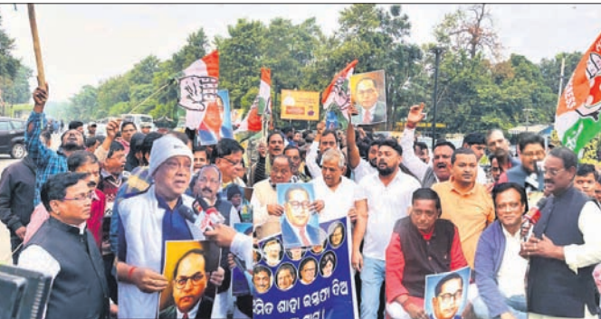
ଭାମରାଓ ଆମେତକରଙ୍କ ପ୍ରତି ଅସମ୍ମାନକରକ ମତବ୍ୟ ଦେଇଥିବା ଭୁବନେଶ୍ୱର ମାଷ୍ଟରକ୍ୟାଣ୍ଟିନଠାରେ ସ୍ୱରାସ୍ତ୍ରମୁଖୀ ଅନିର୍ଦ୍ଧ ଶାହାଙ୍କ କୁଶପୁରଜିକା ଦାହ କରୁଛନ୍ତି କଂଗ୍ରେସ ନେତା ଓ କର୍ମୀ।