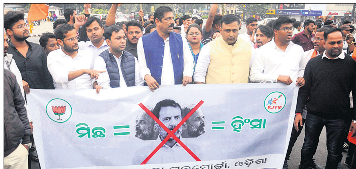
ଏସପଦେ କଂଗ୍ରେସ ନେତା ରାହୁଲ ଗାନ୍ଧୀଙ୍କ ହିଂସାମୂଳକ ଆଚରଣ ପ୍ରତିବାଦରେ ଭୁବନେଶ୍ୱର ମାଷ୍ଟରକ୍ୟାଣ୍ଟିନଠାରେ ଭାଜପା ମୁଦମୋର୍ଚ୍ଚା ପକ୍ଷରୁ ବିକ୍ଷୋଭ ପ୍ରଦର୍ଶନ କରାଯାଇଛି।