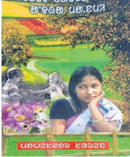
ନାଟକ ପ୍ରସ୍ତୁତ 'ସେତେତ ସାଂସାର ରେନ୍ଦ୍ର ଅଧା ମାନ୍ଦ୍ୟା' (ଶିକ୍ଷିତ ସମାଜର ଅଧମାନେ) ପାଇଁ ଏହି କାଟାୟ ପୁରସ୍କାର ପାଇବେ।

ଗୋଷ୍ଠୀ ସାମ୍ବ୍ୟକେନ୍ଦ୍ରରେ ପାର୍ମ୍ୟସିଦ୍ଧ ଭାବେ କାର୍ଯ୍ୟ କରୁଛନ୍ତି। ସାମ୍ବ୍ୟସେବା କ୍ଷେତ୍ରରେ ନିଜର କର୍ତ୍ତବ୍ୟ ସମ୍ପାଦନ କରିବା ସହ ସାହାଜି ନାଟକ ସାହିତ୍ୟରେ ସାଧନା କରି ରହିଛନ୍ତି।