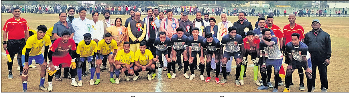
ଅତିଥି ଗହଣରେ ଉଭୟ ଦଳର ଖେଳାଳି।

ଗଙ୍ଗା, ୧୯୧୨ (ରଘୁନାଥ ସାହୁ) କୁହୁଡ଼ି ମହାବୀର ଆଧୁନିକ ଆସୋସିଏଟସ୍ ଆରୁଦ୍ଧ୍ୟରେ ଜନତା ଷ୍ଟାଡ଼ିୟମରେ ଗୁରୁତ୍ୱପୂର୍ଣ୍ଣ ୫୫ତମ ସର୍ବଭାରତୀୟ ମହାବୀର କପ୍ ଫୁଟବଲ୍ ଚୁନାମେଝ ଆରମ୍ଭ ହୋଇଛି। ଉଦ୍‌ଘାଟନା ମ୍ୟାଚ୍ ଯୁଥ୍ ଡେଭାଲପମେଣ୍ଟ କ୍ଲବ୍ ଗଞ୍ଜପୁର ଭୁବନେଶ୍ୱର ଏବଂ ଦକ୍ଷିଣ ପୂର୍ବ ରେଲ୍‌ୱେ ଚକ୍ରଧରପୁର ଚିମ୍ ମଧ୍ୟରେ ହୋଇଥିଲା। ମ୍ୟାଚ୍ ସଂଘର୍ଷପୂର୍ଣ୍ଣ ହୋଇଥିବାବେଳେ ଚକ୍ରଧରପୁର ଚିମ୍ ମଧ୍ୟରେ ହୋଇଥିଲା। ଚକ୍ରଧରପୁର ଚିମ୍ ମଧ୍ୟରେ ହୋଇଥିଲା। ଚକ୍ରଧରପୁର ଚିମ୍ ମଧ୍ୟରେ ହୋଇଥିଲା। ଚକ୍ରଧରପୁର ଚିମ୍ ମଧ୍ୟରେ ହୋଇଥିଲା।