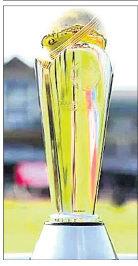
ଭାରତ ଓ ପାକିସ୍ତାନ ମ୍ୟାଚ୍ ପାଇଁ ନିରପେକ୍ଷ ଭେନ୍ୟୁରେ ହେବ।