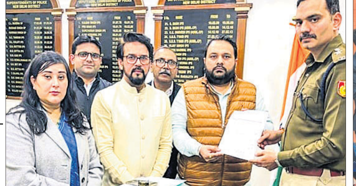
ଭାଜପା ଏମ୍ପି ଅନୁରାଗ ଠାକୁର, ବାଂସୁରି ସ୍ୱରାଜ ଓ ଅନ୍ୟମାନେ ପାଲିମେଣ୍ଟ ସ୍ତ୍ରୀ ଆନରେ ରାହୁଲ ଗାନ୍ଧୀଙ୍କ ବିରୋଧରେ ଏତଲା ଦେଇଛନ୍ତି।

ସାମନାକୁ ଆସିଛି। ଆମେ ତାଙ୍କ ଲସ୍ତୁଫା ଓ କ୍ଷମା ଦାବି କରିଥିଲୁ। ଶାହା ଲସ୍ତୁଫା ଦେଇନାହାନ୍ତି କି କ୍ଷମା ଦି ମାଗିନାହାନ୍ତି। ବିରୋଧୀ ଲଢ଼ିଆ କୁ ସଦସ୍ୟମାନେ