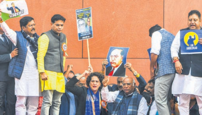
ରାଜ୍ୟ ସଭାର ବିରୋଧୀ ଦଳ ନେତା ମଲ୍ଲିକାର୍ଜୁନ ଖାର୍ଜେ, କଂଗ୍ରେସ ଏମ୍ପି ପ୍ରିୟଙ୍କା ଗାନ୍ଧୀ ଭଦ୍ରା ଓ ଲଢ଼ିଆ କୁ ସଦସ୍ୟମାନେ ପାଲିମେଣ୍ଟ ପରିସରରେ ସ୍ୱରାଷ୍ଟ୍ରମନ୍ତ୍ରୀ ଅମିତ ଶାହାଙ୍କ ମନ୍ତବ୍ୟ ବିରୋଧରେ ବିକ୍ଷୋଭ କରୁଛନ୍ତି।