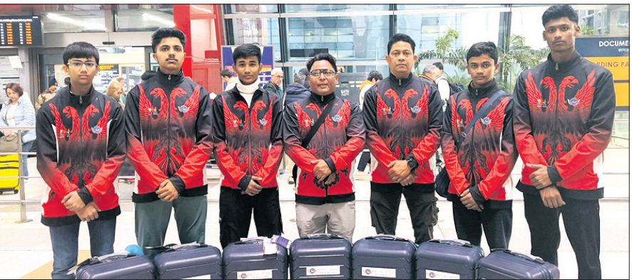
ବିଶ୍ୱ ପେନ୍‌ଟାକ୍ ବିଲାଟ ଚାମ୍ପିୟନସ୍ ପାଇଁ ମନୋନୀତ ଓଡ଼ିଆ ଖେଳାଳି।