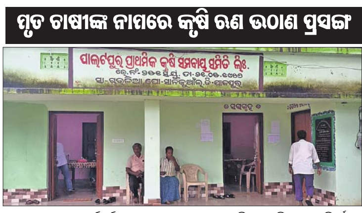
ମୃତ ଚାଷୀଙ୍କ ନାମରେ କୃଷି ରଣ ଉଠାଇ ପ୍ରସଙ୍ଗ