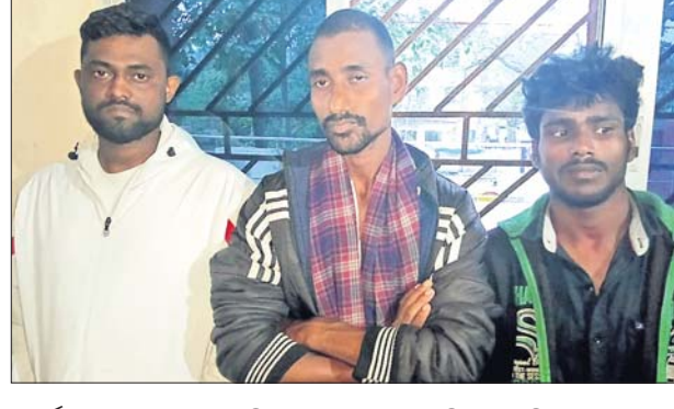
ଅର୍ଦ୍ଧେକ ଆକ୍ରମଣ କରିଥିଲେ। ମୁବକକୁ ଗିରଫ କରିଥିଲେ। ଏନେଇ ଖବର ପାଇ ଯାଜପୁର ପୋଲିସ ଆନାରେ ନଂ.୫୧୦/୨୪ରେ ଏକ ପହଞ୍ଚି ଘଟଣାର ତଦନ୍ତ କରି ସମ୍ପୂର୍ଣ୍ଣ ୩ ମାମଲା ରୁକ୍ତ ହୋଇଛି।