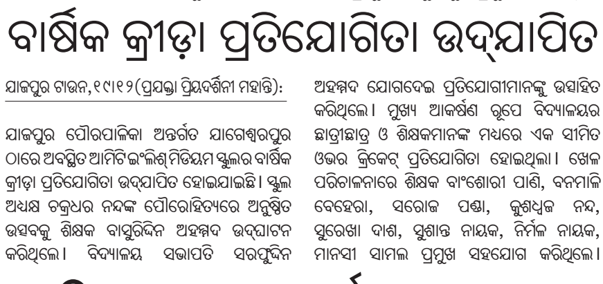
ଯାଜପୁର ଗଞ୍ଜନ, ୧୯୧୨ (ପ୍ରୟତ୍ନା ପ୍ରିୟବର୍ତ୍ତନୀ ମହାନ୍ତି): ଯାଜପୁର ପୌରପାଳିକା ଅନ୍ତର୍ଗତ ଯାଗେଶ୍ୱରପୁର...