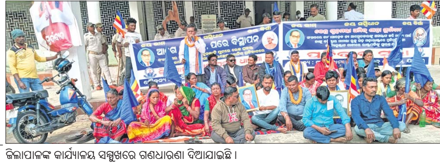
କିଲିପାଳଙ୍କ କାର୍ଯ୍ୟାଳୟ ସମ୍ମୁଖରେ ଗଣଧାରଣା ଦିଆଯାଇଛି।