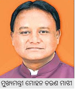
ମୁଖ୍ୟମନ୍ତ୍ରୀ ମୋହନ ଚରଣ ମାଝୀ

ବାଲେଶ୍ୱର ଏମ୍ପି ପ୍ରତାପ ଷଡ଼ଙ୍ଗା ସଂସଦ ପହଞ୍ଚିବା ପୂର୍ବେ ଆହତ ଘଟଣାକୁ ନେଇ ମୁଖ୍ୟମନ୍ତ୍ରୀ ମୋହନ ଚରଣ ମାଝୀ ନିନ୍ଦା କରିଛନ୍ତି । ସୋସିଆଲ ମିଡ଼ିଆ ଏକ୍ସପ୍ରେସରେ ସେ କହିଛନ୍ତି, କଂଗ୍ରେସ ଏମ୍ପି ରାହୁଲ ଗାନ୍ଧୀଙ୍କ ଦାୟିତ୍ୱହୀନ ତଥା ଆପରିଜନକ କ୍ଷତ୍ଯମ୍ପି-୪