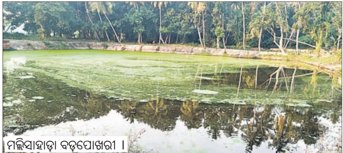
ମଲିସାହାଡ଼ା ବଡ଼ପୋଖରୀ ।

୧୯,୦୧ ୬୩୭ ଟଙ୍କା ସରକାରୀ ଅର୍ଥ ହରଜିତ୍ ହୋଇଥିବା ଗ୍ରାମର ସଚେତନ ସୁବକ୍ତାମାନେ କେନ୍ଦ୍ରାପଡ଼ା ଜିଲ୍ଲାପାଳଙ୍କୁ ଅଭିଯୋଗ କରିଛନ୍ତି। ଦୁର୍ନୀତିର ସାମାନ୍ୟ ସମସ୍ତ ଉନ୍ନତୀକରଣ କାର୍ଯ୍ୟରେ ହରଜିତ୍ ହୋଇଥିବାବେଳେ, ଗତବାର୍ଷିକ ସମୟରେ ଆଦୌ ରକ୍ଷାଧ୍ୟାୟ ନ ଦେଇ ବିଲ ହେବା, ଏବେ ଅନୁମୋଦିତ ହୋଇଥିବା ସିଡିଆର (ସାଇକ୍ଲୋନ ତ୍ୟାମେଜ ରେଷ୍ଟୋରେଶନ)