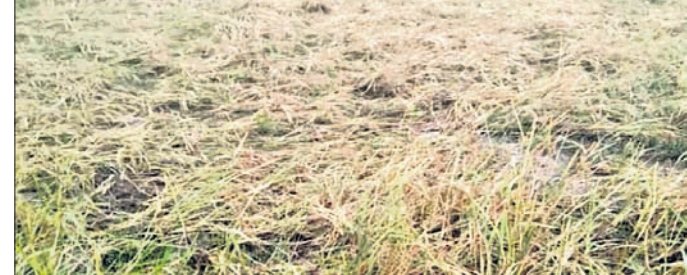
ବିଲରେ ପଡ଼ି ରହିଛି ଧାନ।