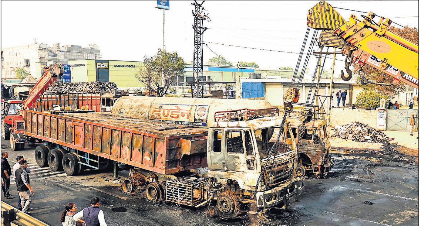
ରାଜସ୍ଥାନର ଜୟପୁର-ଅଜମେର ରାଜପଥରେ ଏଲପିଜି ଟ୍ୟାଙ୍କର ଟ୍ରକ୍‌କୁ ଧକ୍କା ଦେବା ପରେ ଗ୍ୟାସ୍ ଲିକ୍ ହୋଇଛି। ଏଥିରେ ପ୍ରାୟ ୪୦ ଗାଡ଼ି ଜଳିଯିବା ସହ ୧୧ ଜଣଙ୍କ ମୃତ୍ୟୁ ଘଟିଛି। ଘଟଣାସ୍ଥଳରେ ଉଦ୍ଧାର କାର୍ଯ୍ୟ ବେଳର ଦୃଶ୍ୟ। (ବିପୋଷ୍ଟ: ପୃଷ୍ଠା-୪)