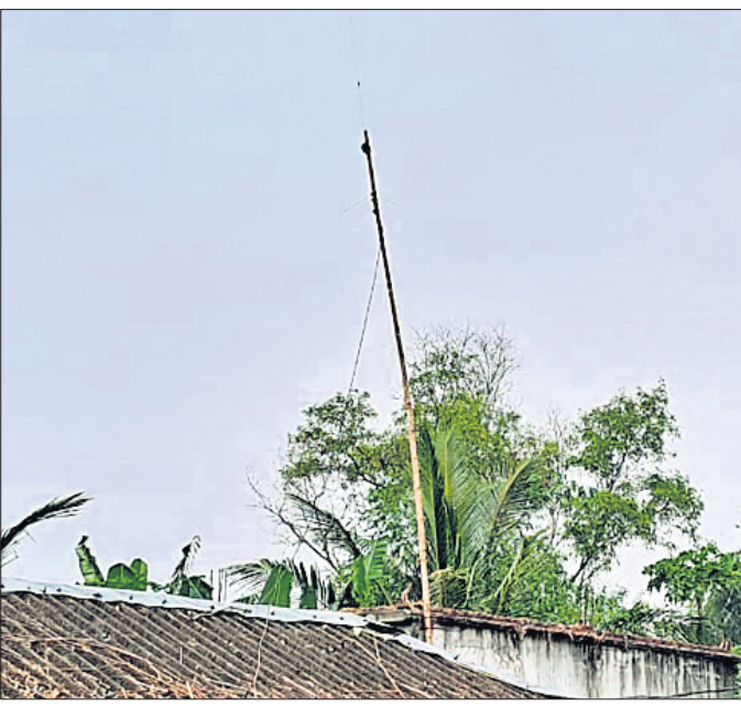
ଡକ୍ଟରପାଳ ଗାଁରେ ବେଆଇନ ଭାବେ ବାଉଁଶରେ ଭିଏଟ୍‌ଏମ୍ ଚାଷୀର ଝୁଲୁଛି।

କେନ୍ଦ୍ରାପଡ଼ା ଜିଲ୍ଲା ମହାକାଳପଡ଼ା ବ୍ଲକ୍ ଗହୀରମଥାରେ ଅଲିଭ୍ ରିଭ୍‌ଲେ କଲ୍‌ଚର ପାଇଁ ସାମୂହିକ ଅଭ୍ୟାସକୁ ନିଷିଦ୍ଧାନ୍ତ ଦେଖାଯାଇଛି। କଲ୍‌ଚର ପାଇଁ ୨୦୨୪ ନଭେମ୍ବର ୧୦ ୨୦୨୫ ମେ ପର୍ଯ୍ୟନ୍ତ ଚଳୁଥିବା, ଡକ୍ଟର, ବୋଷ୍ଟର ମାଛଧରା ଉପରେ କଟକଣା ଘାଟି କରାଯାଇଛି। ହେଲେ ବ୍ଲକ୍ ଅଧୀନ ତିଆରିପାଳ, ଚରପକ୍, ଶାସନପେଟା, ନରସିଂହପୁର ଓ ପୁନାପି ଗାଁରେ କେତେକ ଚଳର ଡ୍ରାଇଭର, ମହାଜୀବୀଙ୍କ ଘରେ ୨୦୦ ଡକ୍ଟର ବାଉଁଶରେ ଭିଏଟ୍‌ଏମ୍ (ଭେରି ହାଇ ପ୍ରୋଟିନ୍‌ସ୍ ରେଡିଓ ଗ୍ରାଉଣ୍ଡ) ଚାଷୀ ଲାଗିଛି। ଏହା ମାଧ୍ୟମରେ ସମୁଦ୍ରରେ ମାଛ ଧରୁଥିବା ଡ୍ରାଇଭର ଓ ମହାଜୀବୀଙ୍କୁ ଚାଷରେ ବାଧା ଦିଆଯାଇଛି। ଏ ସମ୍ପର୍କରେ ଧରିଚାଳିତ ଅଲିଭ୍ ରିଭ୍‌ଲେ କଲ୍‌ଚର ବାଉଁଶ ଚାଷୀର ବିପଦ ସମ୍ପର୍କିତ ଖବର ପ୍ରକାଶ ପାଇଥିଲା। ଏହା ପରେ ବନ ବିଭାଗ ପକ୍ଷରୁ କେବଳ ମାମଲା ରୁଦ୍ଧ ହୋଇଛି। ହେଲେ ଉପରୋକ୍ତ ଗାଁ ଗ୍ରାମ ଡ୍ରାଇଭର ଓ ମହାଜୀବୀଙ୍କ ଘର ଛାଡ଼ି ଉପରେ ଲାଗିଥିବା ଚାଷୀଙ୍କୁ ହରାଇବାପାଇଁ, ଯାହାକି ଆଭ୍ୟନ୍ତରୀଣ ଉପକୂଳ ସୁରକ୍ଷା ପ୍ରତି ପ୍ରକୃତାବଳୀ ଦୃଷ୍ଟି