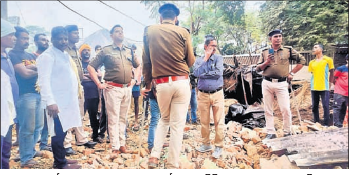
ରେକବାଳ କର୍ତ୍ତୃପକ୍ଷ ଏବଂ ରେକ ସୁରକ୍ଷା କର୍ମୀଙ୍କ ଉପସ୍ଥିତିରେ ଉଚ୍ଚେଦ କରାଯାଉଛି।