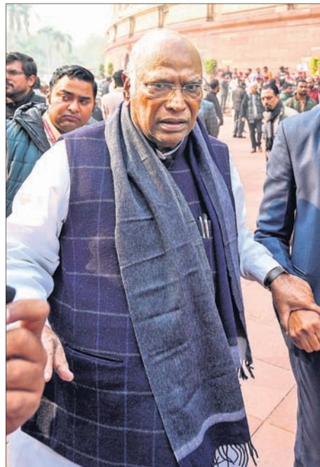
ପାର୍ଲିମେଣ୍ଟ ପରିସରରେ ସ୍ୱରାଷ୍ଟ୍ରମନ୍ତ୍ରୀ ଅମିତ ଶାହାଙ୍କ ବିରୋଧରେ କଂଗ୍ରେସ୍ ଅଧ୍ୟକ୍ଷ ମଲ୍ଲିକାର୍ଜୁନ ଖାର୍ଗେଙ୍କ ବିକ୍ରୋଧ।