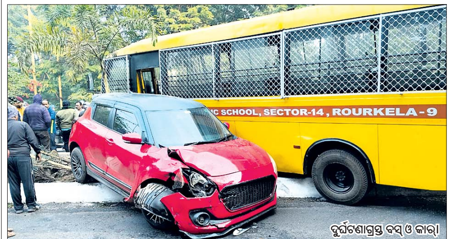
ଦୁର୍ଘଟଣାଗ୍ରସ୍ତ ବସ୍ ଓ କାର୍