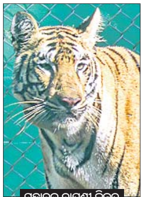
ମହାବଳ ବାଲୁଗା ଜିନିଷ

ମୟୂରଭଞ୍ଜ ଜିଲ୍ଲା ଶିଳିପାଳ ଅଭୟାରଣ୍ୟ ଛାଡ଼ି ଝାଡ଼ଖଣ୍ଡ ପକାଇଥିବା ମହାବଳ ବାଲୁଗା ଜିନିଷ ଶୁକ୍ରବାର ପଶ୍ଚିମବଙ୍ଗରେ ପ୍ରବେଶ କରିଛି। ଝାଡ଼ଖଣ୍ଡ ରାଜ୍ୟ ଗର୍ଭବସା ଜଙ୍ଗଲ ଦେଇ ପଶ୍ଚିମବଙ୍ଗର ଝାଡ଼ଖଣ୍ଡ ବନଖଣ୍ଡର ବେଲପାହାଡ଼ି ରୋଷି ଜଙ୍ଗଲରେ ସେ ରହିଥିବା ସୂଚନା ମିଳିଛି। ଗୋଟିଏ ଦିନରେ ସେ ପାଖାପାଖି ୨୮ କି.ମି. ଚାଲିଥିବା ଜଣାପଡ଼ିଛି। ଜିନିଷର ପ୍ରବେଶ ପରେ ଉଚ୍ଚ ଅଞ୍ଚଳରେ ସାଜାଧାରଣ କାରି କରାଯାଇଛି। ଗତ ୮ ଚାରିଖଣ୍ଡ ବାଲିପୋଷି ଦେଇ ଝାଡ଼ଖଣ୍ଡର ବାଲୁଗା ଅଞ୍ଚଳର ବିଭିନ୍ନ ଅଞ୍ଚଳରେ ସୁଲିଭ ସହ ୧୯ ଚାରିଖଣ୍ଡରେ ଚିତରା, ଚିକିଲିଡ଼, ଚିକିନି, ପରିହାଟା, ବୁଦ୍ଧପୁର ଓ ସିଲିଦା ଦେଇ