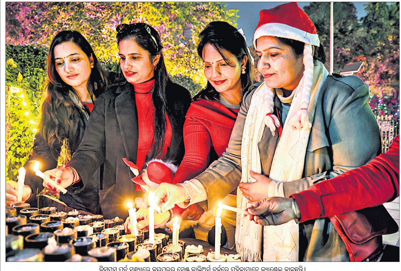
କ୍ରିସ୍ମାସ ପୂର୍ବ ସନ୍ଧ୍ୟାରେ ଜୟପୁରର ସେଣ୍ଟ ଜାଭିଅର୍ ଚର୍ଚ୍ଚରେ ମହିଳାମାନେ କ୍ୟାଣ୍ଡେଲ୍ ଜାଳୁଛନ୍ତି।

ଉତ୍ତର-ପଶ୍ଚିମ ତୁର୍କୀର ଏକ ଅସ୍ତ୍ର କାରଖାନାରେ ମଙ୍ଗଳବାର ସକାଳେ ବିସ୍ଫୋରଣ ଘଟି ଅନୁାମ ୧୨ ଜଣଙ୍କ ମୃତ୍ୟୁ ହେବା ସହ ଅନ୍ୟ ୫ ଜଣ ଆହତ ହୋଇଛନ୍ତି। ବିସ୍ଫୋରଣ ଏତେ ଶକ୍ତିଶାଳୀ ଥିଲା ଯେ, ଫ୍ୟାକ୍ଟି କାଟ ଓ ଧାତବ ଛୁଟୁଡ଼ାଗୁଡ଼ିକ ବିଛାଡ଼ିହୋଇ ପଡ଼ିବା ସହ ପାଖ ବିଲ୍ଡିଂରେ ଫାଟ ସୃଷ୍ଟି ହୋଇଛି। ବିସ୍ଫୋରଣ ଯୋଗୁ କାରଖାନାର ଗୋଟିଏ ଭାଗ ଭୁସ୍ଥି ପଡ଼ିଛି। ତେବେ ବିସ୍ଫୋରଣର କାରଣ ଜଣାପଡ଼ି ନ ଥିବା ତୁର୍କୀ ଗୃହମନ୍ତ୍ରୀ ଅଲି ଯୋଲିକାୟା କହିଛନ୍ତି। ପ୍ରାୟତଃ ଛୁଟି ଯୋଗୁ ବିସ୍ଫୋରଣ ଘଟିଥିବା ପାରେ ବୋଲି ଗ୍ରାହକମାନେ କହିଛନ୍ତି।