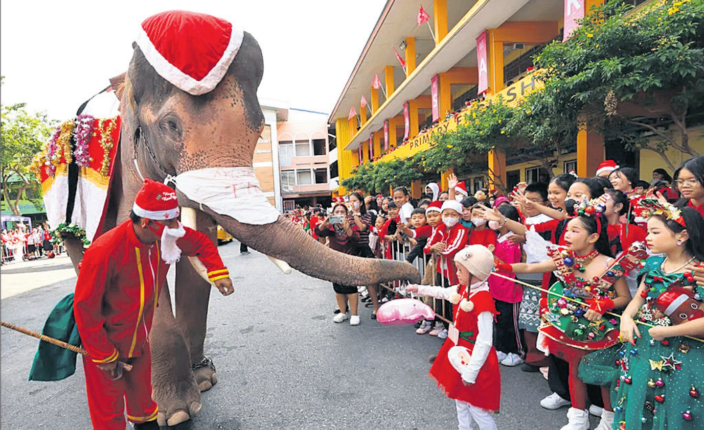
ଆଇଲାଣ୍ଡର ଜିରାସର୍ଡ଼ିଆୟାସ୍ଥିତ ଏକ ସ୍କୁଲରେ ମଙ୍ଗଳବାର କ୍ରିସ୍ମସ ପାଳନ ଅବସରରେ ଛାତ୍ରଛାତ୍ରୀଙ୍କୁ ଉପହାର ଦେଉଛି ହାତୀ।