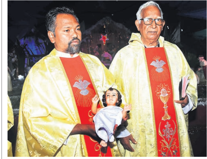
ଶ୍ରୀମ୍ନାଥ ଅବସରରେ ମଙ୍ଗଳବାର ପୂରୀ କ୍ୟାଥୋଲିକ ଚର୍ଚ୍ଚ ପରିସରରେ ପ୍ରଭୁ ଯିଶୁଙ୍କ ଜନ୍ମୋତ୍ସବ ପାଳନ କରାଯାଇଛି।