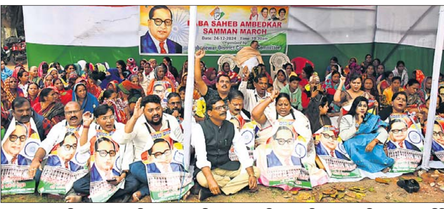
ଆନ୍ଦୋଳନର ପ୍ରତି ସ୍ୱରାଷ୍ଟ୍ର ମନ୍ତ୍ରୀ ଅମିତ ଶାହାଙ୍କ ଅଭିମତକୁ ବିରୋଧ କରି ଭୁବନେଶ୍ୱର ଜିଲ୍ଲା କଂଗ୍ରେସ କମିଟି ପକ୍ଷରୁ ମଙ୍ଗଳବାର ଅତିରିକ୍ତ ଜିଲ୍ଲାପାଳଙ୍କ କାର୍ଯ୍ୟାଳୟ ସମ୍ମୁଖରେ ଧାରଣା ଦିଆଯାଇଛି।