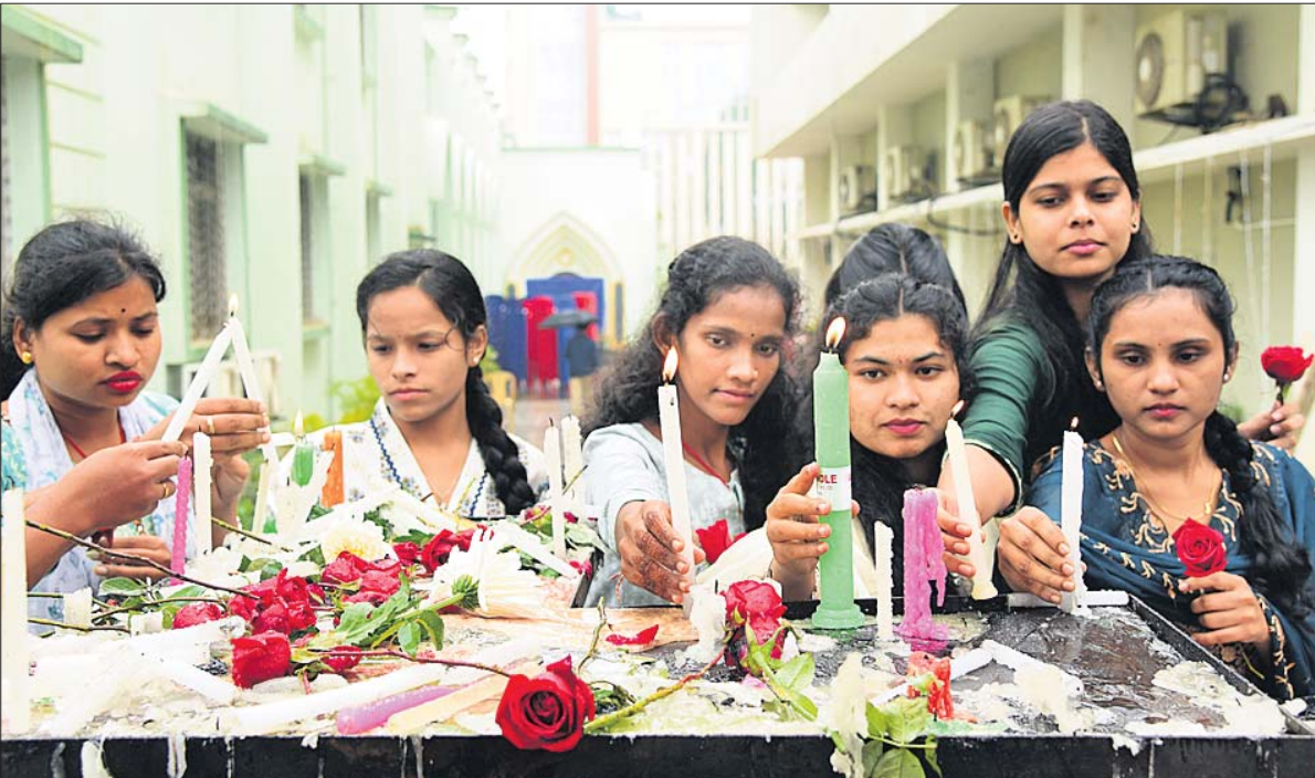
କ୍ରିୟମୟ ଓ ବଡ଼ଦିନ ଅବସରରେ ରୁଧିବାର ଭୁବନେଶ୍ୱର ସତ୍ୟନଗରସ୍ଥିତ କ୍ୟାଥୋଲିକ୍ ଚର୍ଚ୍ଚରେ ଶ୍ରଦ୍ଧାଳୁମାନେ ମହମଦୀ କାଳି, ଗୋଲାପ ଦେଇ ପ୍ରଭୁ ଯିଶୁଙ୍କୁ ଭକ୍ତି ନିବେଦନ କରୁଛନ୍ତି ।

ଭୁବନେଶ୍ୱର, ୨୫ ଡିସେମ୍ବର (ସୌମ୍ୟରଞ୍ଜନ ରାଉତ) ମଧ୍ୟରାତିରେ ପ୍ରଭୁ ଯିଶୁଙ୍କ ଧରାବତରଣ ପରେ ରୁଧିବାର ଧୂମଧାମ୍ରେ ଉତ୍ସବ ମନାଇଥିଲେ ଖ୍ରୀଷ୍ଟ ଧର୍ମାବଲମ୍ବୀ ଶ୍ରଦ୍ଧାଳୁ । ଶାନ୍ତି, ପ୍ରେମ, ମୈତ୍ରୀର ବାଣୀ ନେଇ କ୍ରିୟମୟ ପର୍ବ ସହ ବଡ଼ଦିନ ପାଳନ କରିଥିଲେ । ଏଥିପାଇଁ ରାଜଧାନୀ ଭୁବନେଶ୍ୱର ସୁନ୍ଦର-ଠଣ୍ଡିତ ବାପୁଟିଷ୍ଟି ଓ ସତ୍ୟନଗରସ୍ଥିତ କ୍ୟାଥୋଲିକ୍ ଚର୍ଚ୍ଚ ସହ ଏହାର ଶାଖା କଳିଙ୍ଗ ବିହାର, କଳିଙ୍ଗ ନଗର ଓ ଚନ୍ଦ୍ରଶେଖରପୁରରେ ଥିବା ଚର୍ଚ୍ଚକୁଡ଼ିକ ଉତ୍ସବମୁଖର ହୋଇପଡ଼ିଥିଲା । ତେବେ ଏଥିରେ ବର୍ଷା ବାଧକ ସାଜିଥିଲେ ମଧ୍ୟ ଶ୍ରଦ୍ଧାଳୁଙ୍କୁ ଅଟକାଇପାରି ନ ଥିଲେ । ବହୁ ଶ୍ରଦ୍ଧାଳୁ ଚର୍ଚ୍ଚରେ