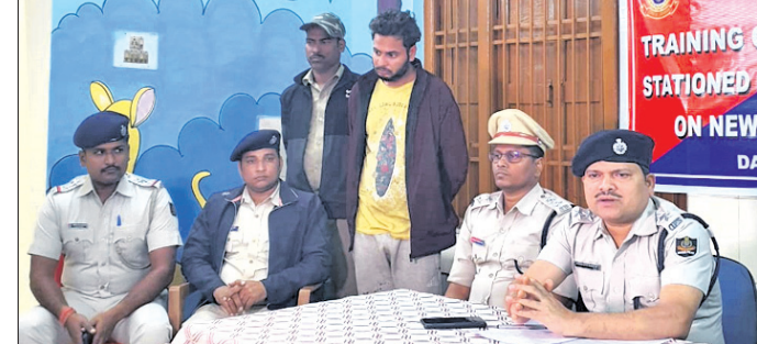
ଖବରଦାତା ସମ୍ମିଳନୀରେ ଗିରଫ ଅଭିଯୁକ୍ତଙ୍କ ସହ ପୋଲିସ୍ । ପୋଲିସ୍ ଉଦ୍ଧାର କରିଥିବା ଟ୍ରକ୍ ।