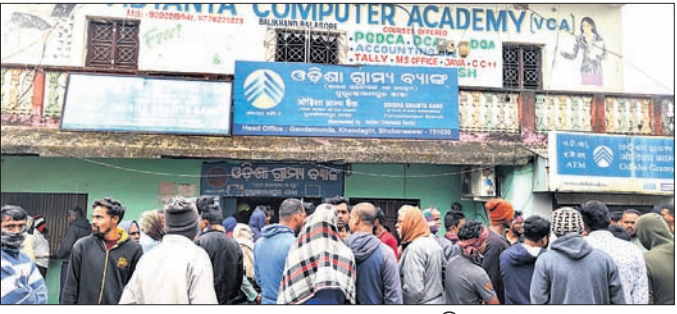
ବ୍ୟାଙ୍କ ସମ୍ମୁଖରେ ଲୋକଙ୍କ ଗହଳି

ବାଲେଶ୍ୱର ଜିଲ୍ଲା ସିସିଟିଭି ଥାନା ବାଲିଖଣ୍ଡ ବଜାରରେ ଥିବା ଓଡ଼ିଶା ଗ୍ରାମ୍ୟ ବ୍ୟାଙ୍କ, ପୁରୁଷୋତ୍ତମପୁର ଶାଖାରେ ଦୁର୍ଭିକ୍ଷମାନେ ଲୁଟ୍ କରିବା ପରେ ନିଆଁ ଲଗାଇଦେଇଥିବା ପ୍ରଶ୍ନାସନ ପକ୍ଷରୁ ଅନୁମାନ କରାଯାଇଛି । ଘଟଣାସ୍ଥଳରେ ଅତ୍ୟନ୍ତ ଚଳାଣୀ ଗଠି ଦମକକ ପହଞ୍ଚି ନିଆଁ ଆୟତ୍ତ କରିଥିଲା । ବୁଧବାର ସକାଳେ ବ୍ୟାଙ୍କରୁ ଧୂଆଁ ବାହାହୁଥିବା ଦେଖି ସ୍ଥାନୀୟ ଲୋକେ ଜମିବାଡ଼ି ବିବାଦ କାରଣରୁ ନାବାଳକଙ୍କୁ ହତ୍ୟା କରିଥିବା ଅଭିଯୁକ୍ତ ସ୍ୱାକାର କରିଥିବା ଆଇଆଇସି ସୂଚନା ଦେଇଛନ୍ତି ।