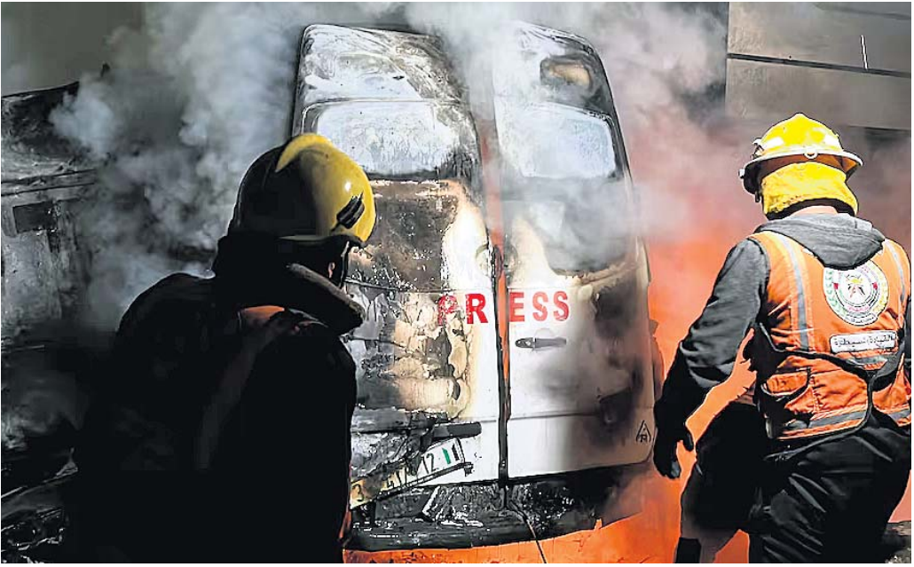
ସିଭିଲ୍ ଡିଫେନ୍ସ ସଦସ୍ୟମାନେ ଗାଜାସ୍ଥିତ ଅଲ-ଅଫ୍ତା ହସ୍ତିଚାଳ ବାହାରେ ଅଲ-କାହ୍ନୁ ନ୍ୟୁଜ୍ ଟ୍ରକ୍ ଉପରେ ଲାଗିଥିବା ନିଆଁ ଲିଭାଉଛନ୍ତି।

ପରଠୁ ଅସାଧାରଣ ଇସ୍ରାଏଲୀ ଆକ୍ରମଣରେ ୧୯୦ ପାଲେଷ୍ଟିନୀୟ ଖବରଦାତାଙ୍କ ଜୀବନ ଗଲାଣି। ଖବରଦାତାମାନେ ନିଜ ଗଣମାଧ୍ୟମ ଓ ମାନବୀୟ କର୍ତ୍ତବ୍ୟ ପାଳନ କରୁଥିବାବେଳେ ଇସ୍ରାଏଲୀ ସେନାକୁ ହତ୍ୟା କରିଛି। ସେହିପରି କମିଟି ରୁ ପ୍ରୋଟେକ୍ଟ ଜର୍ନାଲିଷ୍ଟସ୍ତ ପକ୍ଷରୁ ମଧ୍ୟ ଏହି ଆକ୍ରମଣକୁ ନିନ୍ଦା କରାଯାଇଛି। ଇସ୍ରାଏଲୀ ବିଦେଶୀ ସାମ୍ବିଦ୍ୟକୁ ଗାଜାକୁ ପ୍ରବେଶ କରିବାକୁ ଦେଉ ନ ଥିବା ଏହି ସମ୍ପ୍ରଦାୟ କହିବା ହେଲା, ଗୁରୁତ୍ୱପୂର୍ଣ୍ଣ ଆତଙ୍କବାଦୀଙ୍କ ଉପରକୁ ଚାରେଟ କରିଥିବା କହିଛି। ସେଲେ ଏକ ଗାଡ଼ିକୁ ଚାରେଟ କରାଯାଇଛି। ଗତ ୨ ଦଶନ୍ଧି ମଧ୍ୟରେ ଇସ୍ରାଏଲୀ ବିରୋଧରେ ଅନେକ ମୃତ୍ୟୁ ଲଢ଼ିସାରିଥିବା ହମାସ୍ ସହଯୋଗୀ ତଥା ଇରାନ୍ ସମର୍ଥକ ଇସ୍ରାଏଲୀକ୍ ହିସାବ ଗୁପ୍ତ ମୃତ୍ୟୁ ଆରମ୍ଭ ହେବା ଦିନଠାରୁ ନିଜ ଅଭିଯାନକୁ କୋରସାରେ କରିଆସିଛି। ଇସ୍ରାଏଲୀ ପ୍ରଶାସନୀ ହୋଇଥିବା ଶତାଧିକ ଲୋକ ଏହି ଆତଙ୍କବାଦୀ ସଙ୍ଗଠନ ଛତ୍ରଛାୟା ତଳେ ରହିଥିବା କୁହାଯାଇଛି।