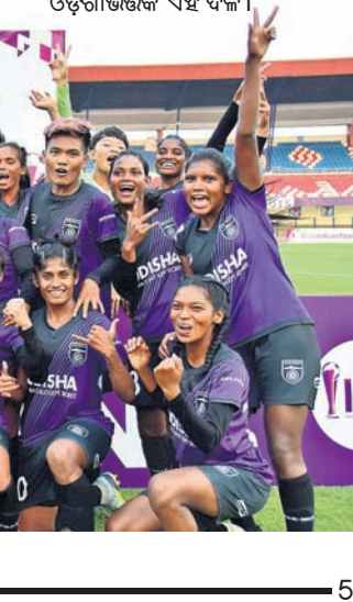
ଆଇଡବ୍ଲ୍ୟୁଏଲ୍ ଚାମ୍ପିୟନ ଓଡ଼ିଶା ଏସିଆ ଦଳ ।

ଲିଜେଣ୍ଡ୍ ଲିଗ୍ କ୍ରିକେଟ୍ ଚୁନାମେଣ୍ଟରୁ ତୃତୀୟ ସଂସ୍କରଣ ଗତ ସେପ୍ଟେମ୍ବରରେ ରାଜସ୍ଥାନର ଯୋଧପୁରରେ ଆରମ୍ଭ ହୋଇଥିଲା । ଏଥିରେ ପ୍ରଥମଥରପାଇଁ ସାମିଲ ହେଇଥିଲା ଓଡ଼ିଶାଭିତ୍ତିକ ପ୍ରାଥମିକ ଦଳ 'କୋଶାଳି ପୂର୍ଣ୍ଣସ୍ୟ ଓଡ଼ିଶା' । ପଦାର୍ପଣରେ ଦମ୍ ଦେଖାଇ ଫାଇନାଲରେ ପହଞ୍ଚିଥିଲା କୋଶାଳି ପୂର୍ଣ୍ଣସ୍ୟ । ସଦର୍ ନୁପୁର ଷ୍ଟାଡ଼ିୟମରେ ପ୍ରଥମ ଓଡ଼ିଶା ଦଳର ପ୍ରଥମ ଓଡ଼ିଶାଭିତ୍ତିକ ହୋଇ ରନର ଅପ୍ ହୋଇଥିଲା ଓଡ଼ିଶାଭିତ୍ତିକ ଏହି ଦଳ ।