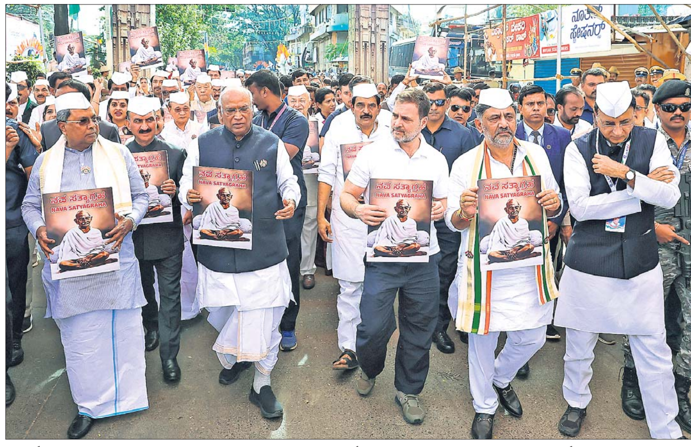
କର୍ମଚାରୀ ବେଳାଗାମୀରେ ମହାନ୍ତ ଗାନ୍ଧୀଙ୍କ ସମ୍ମାନାର୍ଥେ ଅନୁଷ୍ଠିତ କଂଗ୍ରେସ୍ ଆଧିବେଶନର ଶତବାର୍ଷିକୀ ଅବସରରେ ବେଳାଗାମୀରେ ଭୁବନେଶ୍ୱର ଅନୁଷ୍ଠିତ କଂଗ୍ରେସ୍ କାର୍ଯ୍ୟକାରୀ କମିଟିର ବୈଠକରେ