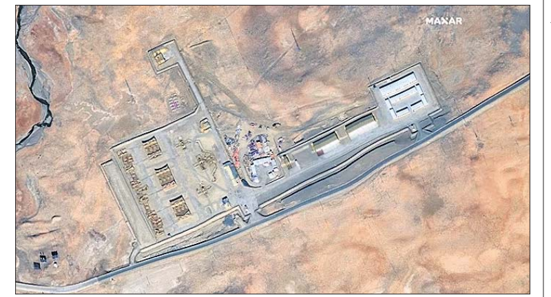
ଏଲ୍‌ଏସ୍‌ଆର୍ରେ ଚାଇନା ସେନାର ନୂଆ ଶିବିର

ହୋଇଛି। ଲବାଖର ଡେପୁଟି ଏସ୍ ଟେମ୍ପୋରରୀ ସୈନ୍ୟ ପ୍ରତ୍ୟାହାର ପରେ ଡେପୁଟି ଚାଇନା ନୂଆ ପିଏସ୍‌ଏସ୍ କ୍ୟାମ୍ପ ଦେଖିବାକୁ ମିଳିଛି।