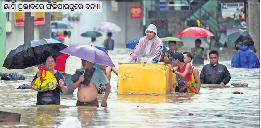
ୟାଗି ପ୍ରଭାବରେ ଫିଲିପାଇନ୍ସରେ ବନ୍ୟା

ସେପ୍ଟେମ୍ବର ପ୍ରଥମ ସପ୍ତାହରେ ଦକ୍ଷିଣ-ପୂର୍ବ ଏସୀୟା ଏବଂ ଦକ୍ଷିଣ ଚାଇନାରେ ଦେଖିବାକୁ ମିଳିଥିଲା ବାତ୍ୟା 'ୟାଗି'ର ପ୍ରକୋପ । ସେପ୍ଟେମ୍ବର ୨ରେ ଏହା ଫିଲିପାଇନ୍ସର କାସିଗୁରାନରେ ସ୍ଥଳଭାଗ ଛୁଇଁଥିବା ବାତ୍ୟା ଯାଗି ସେହିମାସ ୯ ତାରିଖ ଯାଏ ଭିଏଟନାମ, ହୁଙ୍ଗ, ମଳାଓ, ଦକ୍ଷିଣ ଚାଇନା, ଲାଓସ, ଆଇଲାଣ୍ଡ, ମ୍ୟାନ୍ମାରର ଅନେକ ଅଞ୍ଚଳରେ ବ୍ୟାପକ କ୍ଷତିଗ୍ରସ୍ତ ଘଟାଇଥିଲା । ପ୍ରବଳ ବର୍ଷା ଓ ପବନ ଯୋଗୁ ଏହି ସବୁ ଦେଶରେ ମୋଟ ୮୪୪ ଜଣଙ୍କ ମୃତ୍ୟୁ ଘଟିଥିବାବେଳେ ୨,୨୭୯କଣ ଆହତ ହୋଇଥିଲେ । ଅସୀୟା ୧୨୯କଣ ନିଖୋଜ ରହିଛନ୍ତି । ମ୍ୟାନ୍ମାରରେ ବର୍ଷା, ବନ୍ୟା ଓ ଭୂସଙ୍କଳନ ଘଟି ୪୨୩୩ ଜଣଙ୍କ ପ୍ରାଣହାନି ଘଟିଥିବାବେଳେ ଭିଏଟନାମରେ ୩୨୫, ଆଇଲାଣ୍ଡରେ ୫୨, ଫିଲିପାଇନ୍ସରେ ୨୧ ଜଣଙ୍କ ମୃତ୍ୟୁ ଘଟିଥିଲା । ଏହି ଝଡ଼ ଅନେକ ଗଛ, ବିଦ୍ୟୁତ୍ ଖୁଣ୍ଟ, ଘର ନଷ୍ଟ କରିଥିବାବେଳେ ୧୬.୬ ବିଲିୟନ ଡଲାରର କ୍ଷତି ଘଟିଛି ।