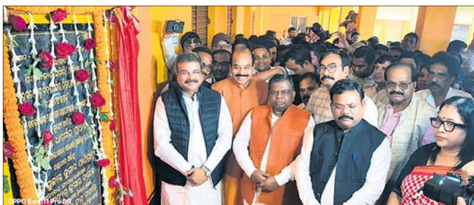
ଭଞ୍ଜନଗର ସରକାରୀ ଶିଶୁ ମନ୍ଦିର ନୂତନ କୋଠାକୁ ଉଦଘାଟନ କରୁଛନ୍ତି କେନ୍ଦ୍ରମନ୍ତ୍ରୀ ଧର୍ମେନ୍ଦ୍ର ପ୍ରଧାନ ।

ପୂର୍ବତନ ପୁଞ୍ଜିକାର୍ଯ୍ୟାଳୟ ତଥା ବିରୋଧୀ ଦଳ ନେତା ନବୀନ ପଟ୍ଟନାୟକଙ୍କ ବକ୍ତବ୍ୟକୁ ନେଇ ଜୋର୍ ଧରି ରାଜନୀତି। ରାଜ୍ୟର ବିକାଶ ସମସ୍ୟା ନବୀନ ଦେଇଥିବା ଏକ ବିବୃତିର କେନ୍ଦ୍ରମନ୍ତ୍ରୀ ଧର୍ମେନ୍ଦ୍ର ପ୍ରଧାନ ପାଇଁ ଜବାବ ଦେଇଛନ୍ତି।