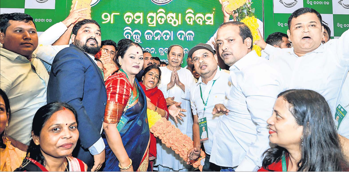
ଶର୍ମା ଭବନରେ ବିଜେଡିର ପ୍ରତିଷ୍ଠା ଦିବସ ଅବସରରେ ସଭାପତି ନବୀନ ପଟ୍ଟନାୟକଙ୍କୁ ଦଳର ନେତା ଓ କର୍ମୀମାନେ ସ୍ୱାଗତ କରୁଛନ୍ତି ।