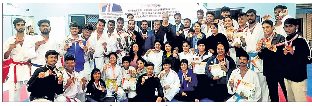
ଅଧିକାରୀଙ୍କ ଦ୍ୱାରା ପଦକ ବିଜୟୀ କରାଚେ।