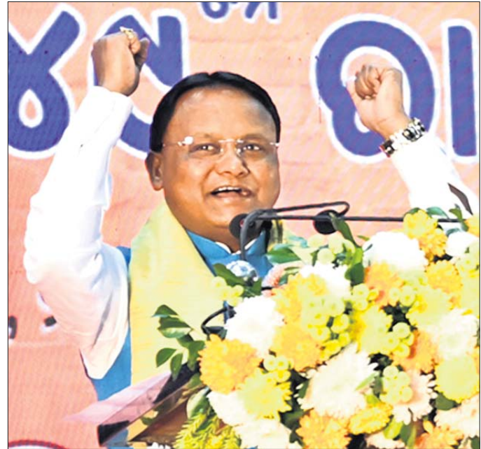
କଟକ ଇନ୍ଦ୍ରଦତ୍ତ ଶ୍ରୀକୃଷ୍ଣଙ୍କୁ ଆୟୋଜିତ ଏକ ସମ୍ମିଳନୀରେ ଉପସ୍ଥିତ ମୁଖ୍ୟମନ୍ତ୍ରୀ