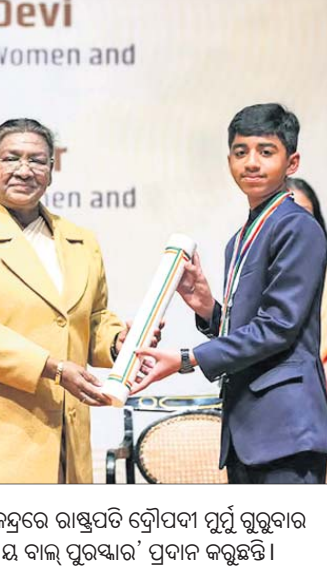
ନୂଆଦିଲ୍ଲୀର ରାଷ୍ଟ୍ରପତି ଭବନ ସାଂସ୍କୃତିକ କେନ୍ଦ୍ରରେ ରାଷ୍ଟ୍ରପତି ଦ୍ରୌପଦୀ ମୁର୍ମୁ ଗୁରୁବାର ଅବସର ଭେଟାକଳ୍ପ ପ୍ରଧାନମନ୍ତ୍ରୀ ରାଷ୍ଟ୍ରୀୟ ବାଲ୍ ପୁରସ୍କାର ପ୍ରଦାନ କରୁଛନ୍ତି।

ରାଷ୍ଟ୍ରପତି ଭବନର ସାଂସ୍କୃତିକ କେନ୍ଦ୍ରରେ ଗୁରୁବାର ଆୟୋଜିତ ଏକ ସମାବେଶରେ ରାଷ୍ଟ୍ରପତି ଦ୍ରୌପଦୀ ମୁର୍ମୁ ୧୭ଟି ବିଭିନ୍ନ ବର୍ଗରେ ଅସାଧାରଣ ଉପଲବ୍ଧି ପାଇଁ ୧୪ ରାଜ୍ୟ ଏବଂ କେନ୍ଦ୍ରଶାସିତ ଅଞ୍ଚଳରେ ୧୭ ଶିଶୁଙ୍କୁ ରାଷ୍ଟ୍ରୀୟ ବାଲ୍ ପୁରସ୍କାର ସମ୍ମାନ ପ୍ରଦାନ କରିଛନ୍ତି। ସେଥିମଧ୍ୟରୁ ୭ ବାଳକ ଏବଂ ୧୦ ବାଳିକା ରହିଛନ୍ତି। ଏହି ଅବସରରେ ରାଷ୍ଟ୍ରପତି ସମସ୍ତ ପୁରସ୍କାର ବିକେତାଙ୍କୁ ଅଭିନନ୍ଦନ ଜଣାଇବା ସହ ପୁରା ଦେଶ ଓ ସମାଜ ସେମାନଙ୍କୁ ନେଇ ଗର୍ବ କରୁଛି ବୋଲି କହିଛନ୍ତି। ଶିଶୁମାନଙ୍କର ଅସାଧାରଣ ସାମର୍ଥ୍ୟ ସର୍ବାଦା ରାଷ୍ଟ୍ର ବିକାଶରେ ସହାୟକ ହୋଇଥାଏ ବୋଲି ଶେଷ କହିଛନ୍ତି। ଗତବର୍ଷ ୧୧ ଶିଶୁଙ୍କୁ ଏହି ପୁରସ୍କାର ଦିଆଯାଇଥିଲା।