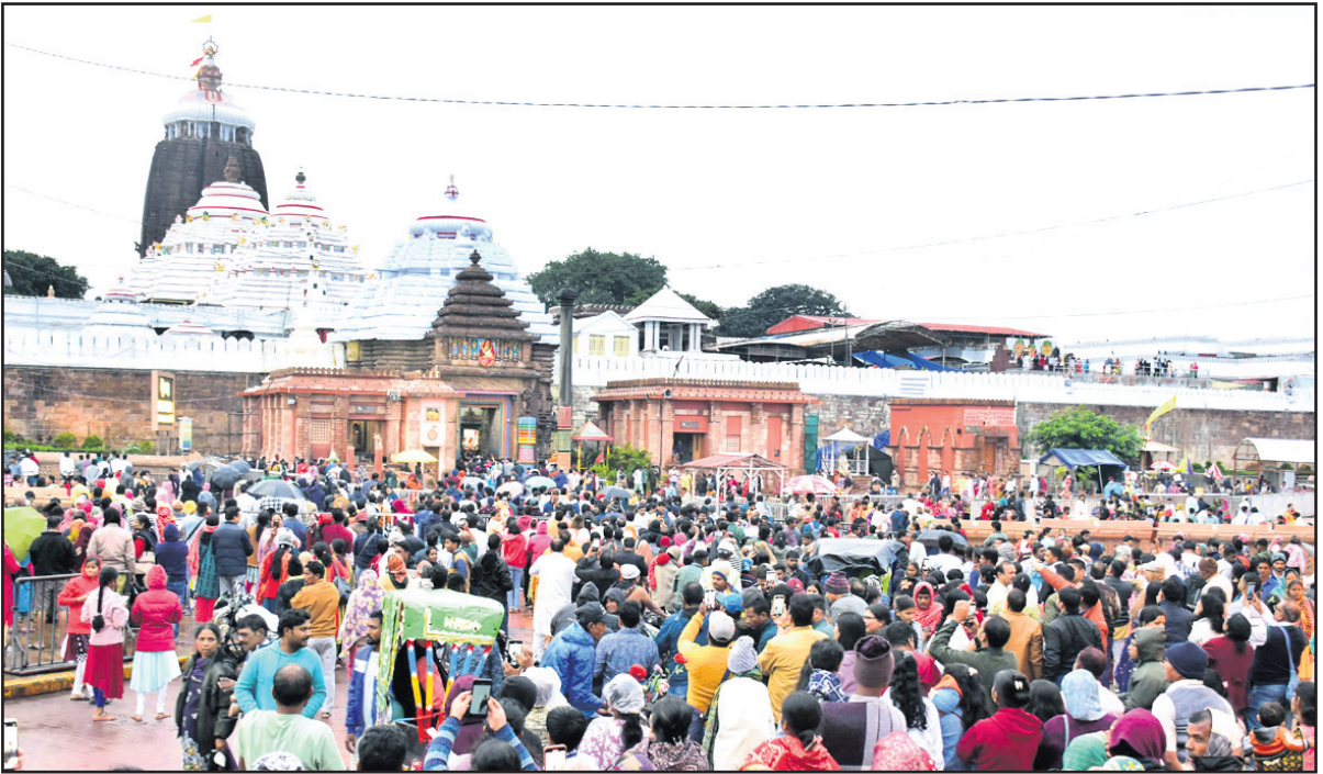
ଶ୍ରୀମନ୍ଦିର ସିଂହଦ୍ୱାରରେ ସୋମବାର ଭକ୍ତଙ୍କ ଭିଡ଼।

ନୂଆବର୍ଷ ଉପଲକ୍ଷେ ଶ୍ରୀମନ୍ଦିରରେ ଦେଖାଦେଇଛି ଭକ୍ତଙ୍କ ପ୍ରବଳ ଭିଡ଼। ଆବଶ୍ୟକତାଠାରୁ କେତେ ଅଧିକ ଭକ୍ତଙ୍କ ଆଗମନ ହେଉଥିବାରୁ ମନ୍ଦିର ପରିସର ଏବଂ ବାହାରେ ଅସମ୍ଭବ ଭିଡ଼ ଉପୁଜିଛି। ଫଳରେ ସୋମବାର ଦଳାଚକଟାରେ ୧୨ରୁ ଊର୍ଦ୍ଧ୍ୱ ଭକ୍ତ ଅସୁସ୍ଥ ହୋଇ ହସ୍ପିଟାଲରେ ଚିକିତ୍ସିତ ହେଉଛନ୍ତି। ଭିଡ଼କୁ ଦୂରରେ ରଖି ଡିସେମ୍ବର ୩୧ ଏବଂ ଜାନୁଆରୀ ୧ରେ କେବଳ ସିଂହଦ୍ୱାର ଦେଇ ଭକ୍ତଙ୍କ ପ୍ରବେଶ ପାଇଁ ଶ୍ରୀମନ୍ଦିର ପ୍ରଶାସନ ପକ୍ଷରୁ ନିଷ୍ପତ୍ତି ନିଆଯାଇଛି।