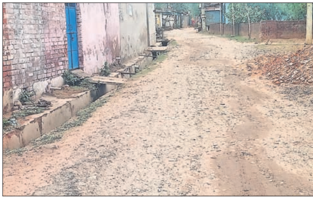
ପୁଖ୍ୟରାସ୍ତା ପାର୍ଶ୍ୱ ଡ୍ରେନ୍ ଅତିଆ ଆବର୍ଜନାପୂର୍ଣ୍ଣ ହୋଇଛି ।