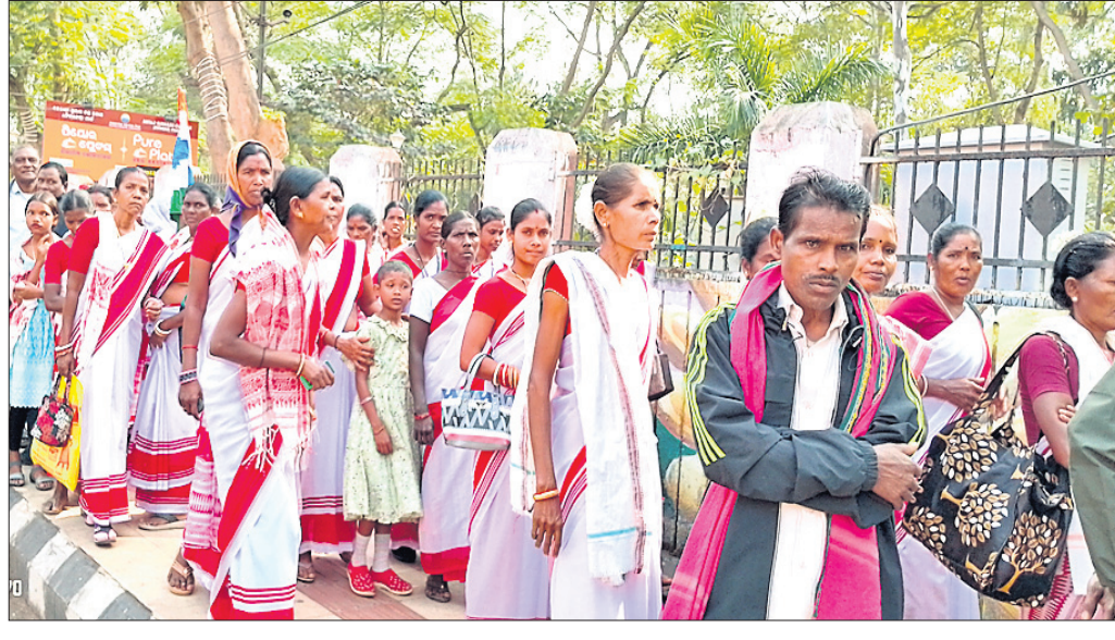
ଆଦିବାସୀ ସମ୍ପ୍ରଦାୟର ଲୋକେ ଶୋଭାଯାତ୍ରାରେ ଯାଉଛନ୍ତି ।

ଶୁଳ ଅଧିକାରି ଅଫ୍ ଇଣ୍ଡିଆ ଲିମିଟେଡ ୨୦୨୫ ଜାନୁଆରୀରୁ ୨୦୨୬ ଜାନୁଆରୀ ପର୍ଯ୍ୟନ୍ତ ଗ୍ରେଟ୍ ପ୍ଲେସ୍ ଟୁ ଓଡ଼ିଶା ଭାରତୀୟ ସମାଜକର୍ମକ ଗ୍ରେଟ୍ ପ୍ଲେସ୍ ଟୁ ଓଡ଼ିଶା ପ୍ରମାଣପତ୍ର ହାସଲ କରିଛି। ସେଲ କ୍ରମାଗତ ବୃତ୍ତିତ୍ୟ ଧର ପାଇଁ ଏହି ପ୍ରମାଣପତ୍ର ପାଇଛି। ପ୍ରଥମେ ୨୦୨୩ ଡିସେମ୍ବରରୁ ୨୦୨୪ ଡିସେମ୍ବର ପର୍ଯ୍ୟନ୍ତ ହାସଲ କରିଥିଲା। ଏହି କ୍ରମାଗତ ବସ୍ତିର ସ୍ୱାକ୍ଷର, କମ୍ପାନୀ ଅଭିନବ ଏଥାର ପଦକ୍ଷେପ ଯଥା ଓଡ଼ିଶା ସହ ନିର୍ବାଣି ଓଡ଼ିଶା ଗୃହମନ୍ତ୍ରାଳୟ ଯୋଜନା, ସହର ଭିତ୍ତିକ କର୍ମଚାରୀଙ୍କ ପାଇଁ ନିର୍ମାଣ ସମୟ, ଲିଜ୍‌ହୋଲ୍‌ଲିଙ୍ଗ୍ ହବ୍, ଇ-ପାଠଶାଳା ମାଧ୍ୟମରେ ନିର୍ଦ୍ଧାରଣ କରାଯାଇ ପ୍ରମାଣପତ୍ର ହାସଲ କରିବା, ଏକ ସ୍ୱତନ୍ତ୍ର କର୍ମକ୍ଷେତ୍ର ସଂସ୍କୃତି ପ୍ରତିପାଦନ କରିବା ଓ ବିଶ୍ୱାସ, ସହଯୋଗ ଏବଂ କର୍ମଚାରୀଙ୍କ ସମାଜିକକରଣ ଉପରେ ନିର୍ଦ୍ଧିତ ଏକ ସହାୟକ କର୍ମଚାରୀ ଅଭିଭାଗ ପ୍ରଦାନ ପାଇଁ ସେଲର ନିରନ୍ତର ସମର୍ଥନ ପ୍ରଦାନକୁ ପ୍ରମାଣିତ କରୁଛି। କଠିନ ପରିସ୍ଥିତି ଏବଂ ଅଧିକ ଆଗକୁ ବଢିବାକୁ ସମଗ୍ର ସାମ୍ବେଦନଶୀଳ ଏହି ପ୍ରମାଣପତ୍ର ଉଦ୍ଦୀଷ୍ଟ କରିବ ବୋଲି କୁହାଯାଇଛି।