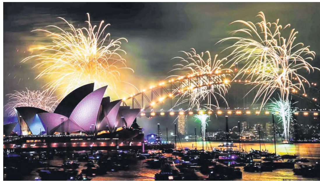
ନବବର୍ଷ ୨୦୨୫କୁ ସ୍ୱାଗତ ଅବସରରେ ଅଷ୍ଟ୍ରେଲିଆର ସିଡ୍ନୀ ହାର୍ବରରେ ମଙ୍ଗଳବାର ଆତସବାଜିରେ ଆଲୋକିତ ଆକାଶ ।