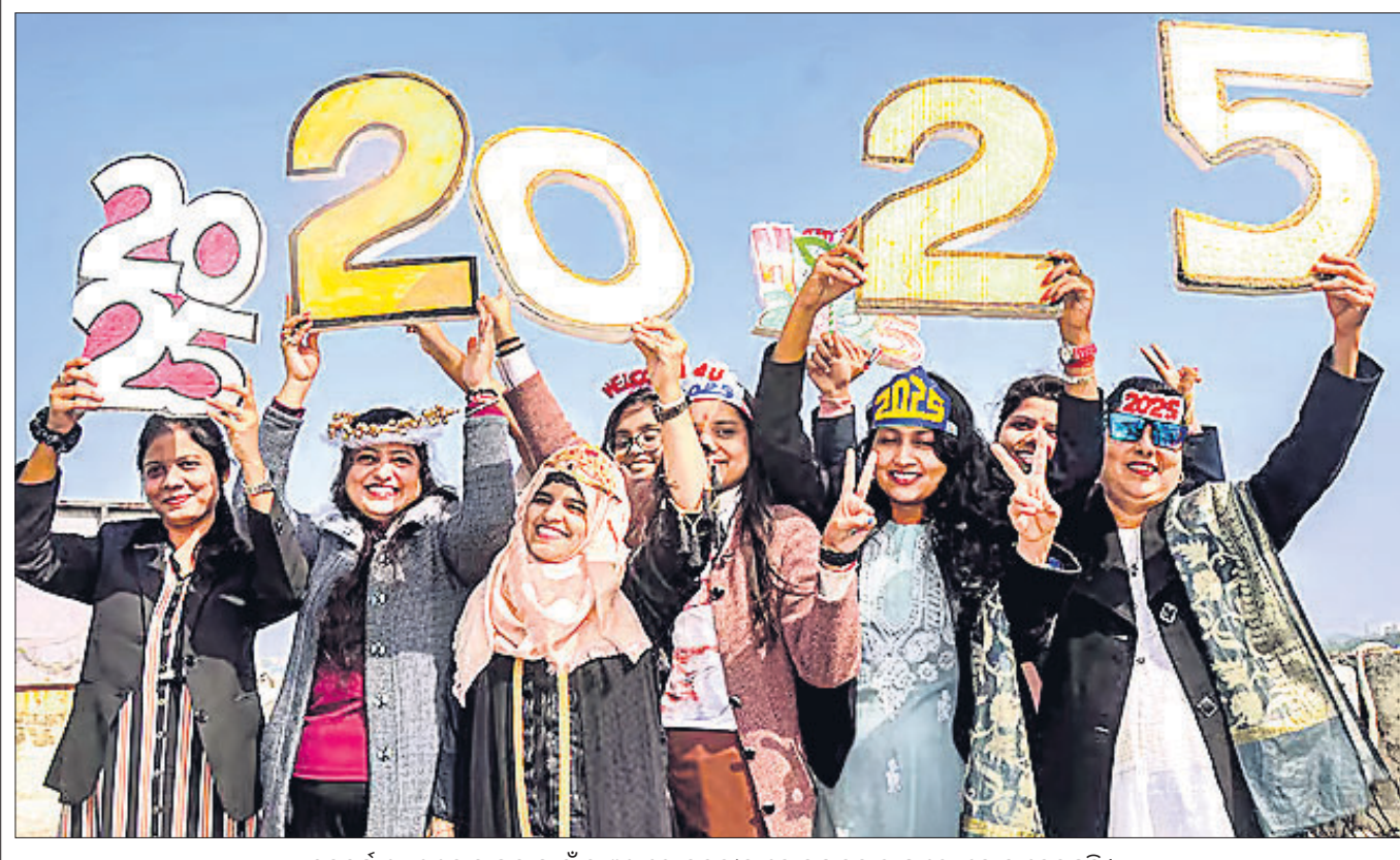
ନବବର୍ଷ ୨୦୨୫କୁ ସ୍ୱାଗତ ପାଇଁ ରାଷ୍ଟ୍ରରେ ଯୁବତୀମାନେ ମଜାକସାର ଫଟୋ ଯୋଗ ଦେଇଛନ୍ତି।

ଭାରତ-ପ୍ରାନ୍ତ ମହାସାଗରୀୟ ଅଞ୍ଚଳରେ ତାହାର ସାମରିକ ସାମର୍ଥ୍ୟ ବଢ଼ାଇବାବେଳେ ଉକ୍ତ ଅଞ୍ଚଳକୁ ମୁକ୍ତ, ସ୍ଥିର ଓ ଶାନ୍ତିପୂର୍ଣ୍ଣ ରଖିବା ଦିଗରେ କାର୍ଯ୍ୟ କରିବା ଲାଗି ଭାରତ ଏବଂ କ୍ୱାଡ୍ରାଏ ଥରେ ସହଯୋଗ ରାଷ୍ଟ୍ରଗୁଡ଼ିକ ମଜାକସାର ସେମାନଙ୍କ ନିଷ୍ପତ୍ତିକୁ ଯୋଗଦେଇ ଦୋହରାଇଛନ୍ତି।