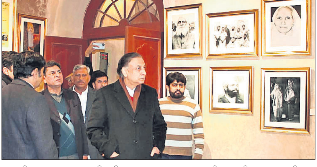
ପାକିସ୍ତାନ ପଞ୍ଜାବ ରାଜ୍ୟର ପୁଞ୍ଜ ହାଇଭର ଭଗତ ସିଂ ଗ୍ୟାଲେରିକୁ ଉଦ୍ଘାଟନ କରୁଛନ୍ତି।

ସାଙ୍ଗ-ମୋକ୍ ନିର୍ଦ୍ଦେଶ ଦେଇଥିଲେ। ମୁଖ୍ୟ ଏୟାରପୋର୍ଟକୁ ଜାନୁଆରୀ ୭ ପର୍ଯ୍ୟନ୍ତ ବନ୍ଦ ରଖାଯାଇଛି।