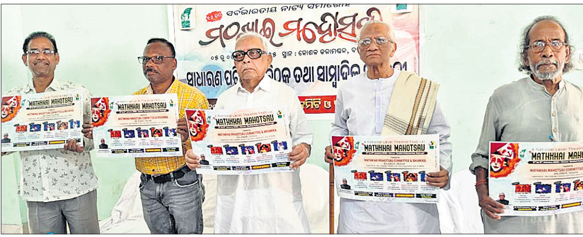
୧୬ତମ ମଠଖାଇ ମହୋତ୍ସବ ପୋଷ୍ଟରକୁ ଅଧ୍ୟକ୍ଷ, ଉପଦେଷ୍ଟା ଲୋକାର୍ପଣ କରୁଛନ୍ତି।

ମଠଖାଇ ମହୋତ୍ସବର ପୋଷ୍ଟର ଉନ୍ମୋଚନ ■ ବହୁଭାଷୀ ନାଟକ ସମାରୋହ ମଠଖାଇ ମହୋତ୍ସବର ସାଧାରଣ ବୈଠକ ■ ନାଟକ ମାଧ୍ୟମରେ ସମାଜ ସଂସ୍କାର, ବିକାଶ ଲକ୍ଷ୍ୟ ■ ମଞ୍ଚସ୍ଥ ହେବ ଦୁଇ କୋଶଳୀ, ଦୁଇ ହିନ୍ଦୀ ଓ ଗୋଟିଏ ଓଡ଼ିଆ ନାଟକ