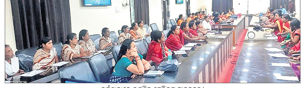
କର୍ମଶାଳାରେ ଉପସ୍ଥିତ ଟେଲିକମ୍ ଗ୍ରାହକବୃନ୍ଦ।

କରଗଡ଼, ୩୧।୧୨(ପ୍ରେମାନନ୍ଦ ଖମ୍ବାରୀ) ହୋଇଯାଇଛି। ବୋଲି କର୍ମଶାଳାରେ ମତପ୍ରକାଶ ପାଇଥିଲା। ସାଧାରଣ ଶ୍ରେଣୀର ଗ୍ରାହକମାନଙ୍କୁ ସଚେତନତା କର୍ମଶାଳା ଅନୁଷ୍ଠିତ ହୋଇଯାଇଛି। ବିଭିନ୍ନ ବର୍ଗର ଗ୍ରାହକମାନଙ୍କୁ ସଚେତନତା କର୍ମଶାଳାରେ ମତପ୍ରକାଶ ପାଇଥିଲା। ଉଦ୍ଦେଶ୍ୟରେ ଏକ ଆଲୋଚନା ଯୋଗଦେଇ ଏହାକୁ ଉଦ୍‌ଘାଟନା କରିଥିଲେ। ଡିଜିଟାଲ୍ ସାକ୍ଷରତା ଏବଂ ଉଚ୍ଚ-ସେବା ଉପରେ ନିର୍ଭରଶୀଳ ତଥା ସୁରକ୍ଷିତ ଲୋକଙ୍କ ପାଇଁ ମୋବାଇଲ୍, ଭିଏଟ୍‌ନାମ ଓ ସେମାନଙ୍କୁ ସଚେତନ କରିଥିଲେ।