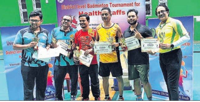
ବ୍ୟାଡ୍ମିଣ୍ଟନ ପ୍ରତିଯୋଗିତାରେ ଖେଳାଳିମାନେ।