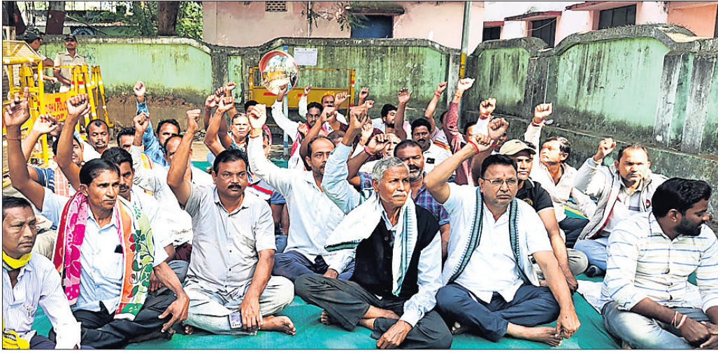
ଜିଲ୍ଲାପାଳଙ୍କ କାର୍ଯ୍ୟାଳୟ ଆଗରେ ଚାଷୀମାନେ ଧାରଣା ଦେଇଛନ୍ତି।

କରଗଡ଼ ଜିଲ୍ଲାରେ ଖରିଫ ଧାନ ସଂଗ୍ରହ ପ୍ରକ୍ରିୟାରେ ଅବ୍ୟବସ୍ଥା ଲାଗି ରହିଛି। ଜିଲ୍ଲାର ବିଭିନ୍ନ ମଣ୍ଡଳ ଚାଷୀମାନେ ଧାନ ଆଶୁଛନ୍ତି। କିନ୍ତୁ ଉଚ୍ଚ ଧାନକୁ ଠିକ୍ ଭାବେ ଉଠାଯାଇ ନ ଥିବା ସେମାନେ ଅଭିଯୋଗ କରୁଛନ୍ତି। ମିଳିତ ଚାଷୀ (ଆଇଟିଏସ୍) ନ ଥିବା, କଟନାକ୍ଷତନ ଆଦି ଆକ ଦେଖାଇ ଧାନ ଉଠାଯାଇନାହିଁ। ଫଳରେ ଚାଷୀମାନେ ଶୀତ, କାଳରେ ବିଭିନ୍ନ ମଣ୍ଡଳରେ ଧାନକୁ ଜରି ରହିଛି। ଏଭଳି ଧାନ କିଶାବିକା ସମସ୍ୟା ନେଇ ଚାଷୀ ଅସନ୍ତୋଷ ବଢ଼ିବାରେ ଲାଗିଛି। ମଣ୍ଡଳରେ ପଡ଼ିଥିବା ସମସ୍ତ ଧାନ ଭୁକ୍ତ ହୋଇଯାଇ ଦାବି କରି ସଂପୂର୍ଣ୍ଣ କୃଷକ ସଙ୍ଗଠନ ନେତୃତ୍ୱରେ ଚାଷୀମାନେ ସେତେଦିନ ଯାଏ ଧାରଣା କରି ରହିବେଇ ନାହିଁ।