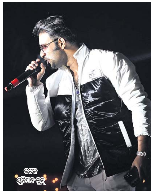
କଟକ ସୁନିଆଳ କୁର୍