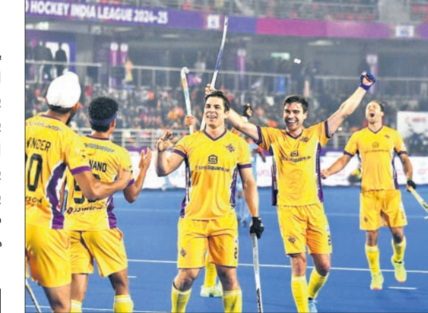
ବିଜୟ ପରେ ଉଲ୍ଲସିତ ହାଇଦ୍ରାବାଦ ଚୋପାନ ଦଳର ଖେଳାଳି।