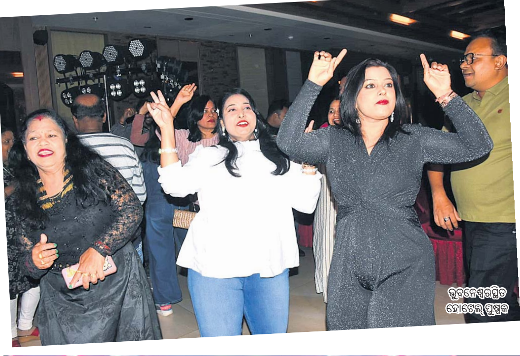
ଭୁବନେଶ୍ୱରସ୍ଥିତ ହୋଟେଲ୍ ପୁସ୍ତକ