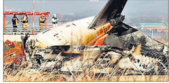
ଦକ୍ଷିଣ କୋରିଆ ବିମାନ ଦୁର୍ଘଟଣାର ତଦନ୍ତ

ଦକ୍ଷିଣ କୋରିଆ କେନ୍ଦ୍ର ଏୟାରଲାଇନ୍ ୭୩୭-୮୦୦ ବିମାନ ଦୁର୍ଘଟଣାରେ ସମସ୍ତ ୧୭୫ ଯାତ୍ରୀ ଏବଂ ୪ ଜଣ କ୍ରିଜ୍ ସଦସ୍ୟଙ୍କ ମୃତ୍ୟୁ ଘଟିଥିଲା। ମୃତକମାନଙ୍କ ତିନିଟି କାର୍ଯ୍ୟରେ ପୋଲିସ୍ ବ୍ୟସ୍ତ ଥିବାବେଳେ କେଉଁ କାରଣରୁ ଏକି ଭୟାବହ ଦୁର୍ଘଟଣା ଘଟିଲା, ତାହାର ତଦନ୍ତକୁ ମଙ୍ଗଳବାର ଭାରତୀୟ ବିମାନ ଅଧିକାରୀ କରାଯାଇଛି।