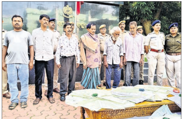
ଜବତ କାଲ ପଢ଼ା ଓ ରିପଟ ଅଭିଯୁକ୍ତମାନେ ।