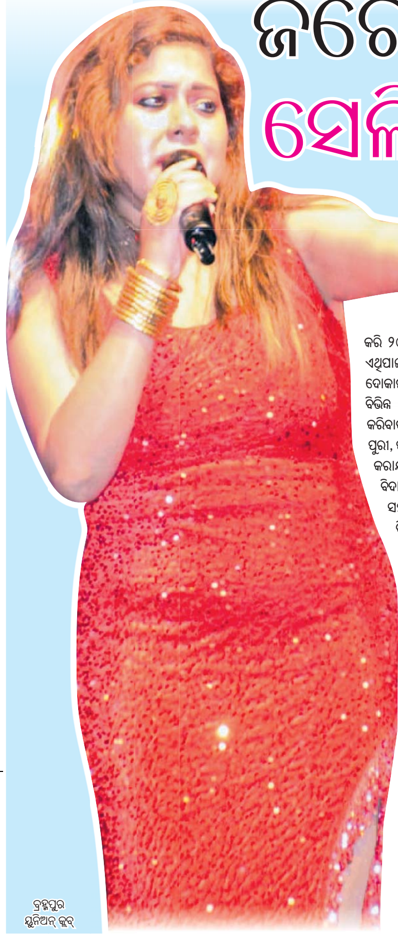
କ୍ରମପୁର ସୁନିଆଳ କୁର୍

ନୂଆ ଆଶା ଓ ଉତ୍ତେଜା ନେଇ ଆସିଛି ନୂତନବର୍ଷ। ବୁଲ୍‌ବୁଲି, ଭୋଜିଭାତ, ମଉଜମସ୍ତିପରେ ଜିରୋନାଲଟ୍‌ସେଲିବ୍ରେଶନ କରି ୨୦୨୪କୁ ବିଦାୟ ଦେବା ସହ ୨୦୨୫କୁ ସ୍ୱାଗତ କରିଛନ୍ତି ସହରବାସୀ। ଏଥିପାଇଁ ସହରପୁରୀ ସବୁଠି ଲାଗିରହିଥିଲା ହସଖୁସିର ମାହୋଲ। ମିଠା ଓ ଫୁଲ ଦୋକାନଠାରୁ ଆରମ୍ଭ କରି ପର୍ଯ୍ୟଟନସ୍ଥଳ, ମଠ, ମନ୍ଦିର ଆଦି ଧର୍ମପୀଠ ସମେତ ବିଭିନ୍ନ ସ୍ଥାନରେ ଭିଡ଼ ଲାଗିରହିଥିଲା। ନୂଆବର୍ଷକୁ ନିଆରା ଭାବେ ପାଳନ କରିବାକୁ ରାଜଧାନୀ ଭୁବନେଶ୍ୱର, ରୌପ୍ୟ ନଗରୀ କଟକ, ଆଧ୍ୟାତ୍ମିକ ସହର ପୁରୀ, ପାଳକ ନଗର ଖୋର୍ଦ୍ଧା ଓ ରେଶମ ସହର ବ୍ରହ୍ମପୁରରେ ସ୍ୱତନ୍ତ୍ର ଆୟୋଜନ କରାଯାଇଥିଲା। କୁର୍, ହୋଟେଲଠାରୁ ଆରମ୍ଭ କରି ଘରେ, ବାହାରେ ସବୁଠି ବିଦାୟ-ସ୍ୱାଗତ ପର୍ବ ବେଶ୍ ଆକର୍ଷଣୀୟ ଥିବା ଦେଖିବାକୁ ମିଳିଥିଲା। ୪ ସହର ରଙ୍ଗିନ ଆଲୋକମାଳାରେ ଝଲସୁଥିବା ବେଳେ ଜିରୋ ନାଲଟ୍‌ରେ ତିଜେ ଓ ସଙ୍ଗୀତରେ ଝୁମିଥିଲେ ସହରବାସୀ। ଠିକ୍ ରାତି ୧୨ଟାରେ ବାଣ ଫୁଟାଇ, କେକ୍ କାଟି ନୂଆବର୍ଷକୁ ସମସ୍ତେ ସ୍ୱାଗତ କରିଥିବାବେଳେ ଶେଷ ପ୍ରହରରେ ନୂତନ ସୂର୍ଯ୍ୟୋଦୟ ଦେଖିଥିଲା ଓଡ଼ିଶା ମାଟି।