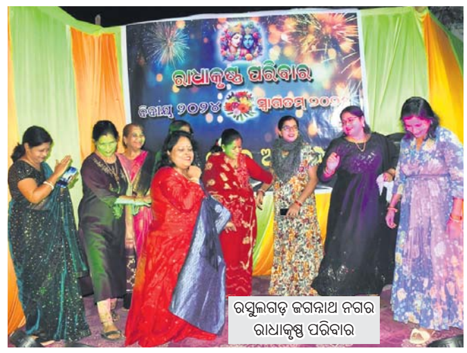
ରଘୁଲଗଡ଼ ଜଗନ୍ନାଥ ନଗର ରାଧାକୃଷ୍ଣ ପରିବାର