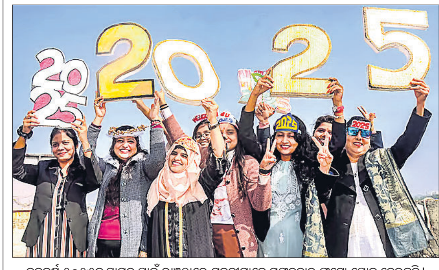
ନବବର୍ଷ ୨୦୨୫କୁ ସ୍ୱାଗତ ପାଇଁ ରାଷ୍ଟ୍ରଠାରେ ଯୁବତୀମାନେ ମଙ୍ଗଳବାର ଫଟୋ ପୋଜ ଦେଉଛନ୍ତି।

ଫଟୋ, ଚିଠି, ତାଙ୍କ ସମ୍ବନ୍ଧିତ ପ୍ରକାଶିତ ଖବର, ତାଙ୍କ ମୃତ୍ୟୁଦଣ୍ଡର ପ୍ରମାଣ ପତ୍ର ଏବଂ ଜୀବନୀ ଓ ସ୍ୱାଧୀନତା ସଂଗ୍ରାହ ସହ ଜଡ଼ିତ ବିଭିନ୍ନ ଐତିହାସିକ ଦସ୍ତାବିଜ ରହିଛି।