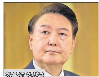
ସୁନ୍ ସୁନ୍ ଘେନେନ୍

ଭାରତ-ପ୍ରଶାନ୍ତ ମହାସାଗରୀୟ ଅଞ୍ଚଳରେ ଚାଲିବା ଏହାର ସାମରିକ ସାମର୍ଥ୍ୟ ବଢ଼ାଇଥିବାବେଳେ ଉଚ୍ଚ ଅଞ୍ଚଳକୁ ମୁକ୍ତ, ସ୍ଥିର ଓ ଶାନ୍ତିପୂର୍ଣ୍ଣ ରଖିବା ଦିଗରେ କାର୍ଯ୍ୟ କରିବା ଲାଗି ଭାରତ ଏବଂ କ୍ୱାଡ୍ର ଅନ୍ୟ ସଦସ୍ୟ ରାଷ୍ଟ୍ରଗୁଡ଼ିକ ମଙ୍ଗଳବାର ସେମାନଙ୍କ ନିଷ୍ଠାବାଦ ପ୍ରତିଶ୍ରୁତିବଦ୍ଧତାକୁ ଦୋହରାଇଛନ୍ତି।