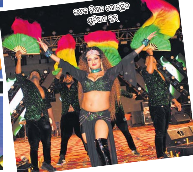
କଟକ ନିଗମ ରୋଡ୍‌ସ୍ଥିତ ସୁନିଆଳ କୁର୍