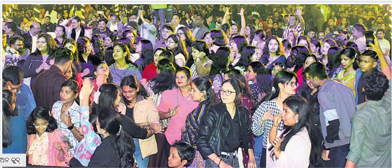
କଟକ ସୁନିଆଳ କୁର୍