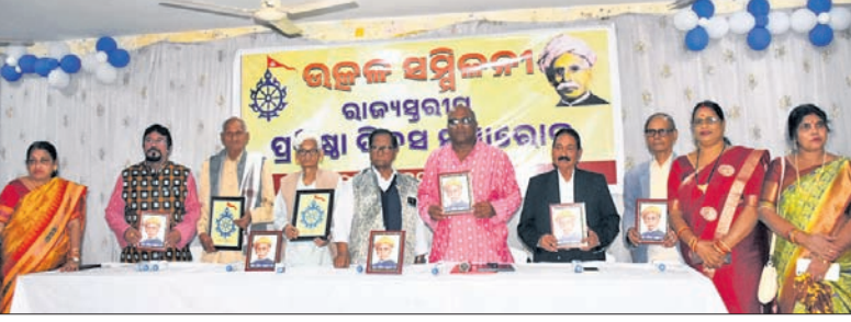
ଭୁବନେଶ୍ୱର, ୩୧୧୨୨ (ସତ୍ୟକିର ଗୋପ): ଗଙ୍ଗାଠାକୁ ଗୋଦାବରୀ ପର୍ଯ୍ୟଟନ ଯୋଗୁଁ ଓଡ଼ିଶା ପରିବ୍ୟାପ୍ତ ଥିଲା...

ଭୁବନେଶ୍ୱର, ୩୧୧୨୨ (ସତ୍ୟକିର ଗୋପ): ଗଙ୍ଗାଠାକୁ ଗୋଦାବରୀ ପର୍ଯ୍ୟଟନ ଯୋଗୁଁ ଓଡ଼ିଶା ପରିବ୍ୟାପ୍ତ ଥିଲା, ତାକୁ ଆଜି ମହାନଦୀ ପାରୀ ନିହାରି। ତାହାର ସୀମା ଆଜି ଅସୁରକ୍ଷିତ।