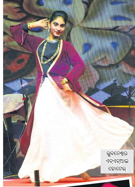
ଭୁବନେଶ୍ୱର ଏଲ୍‌ଏକ୍‌ଆଇ ହୋଟେଲ