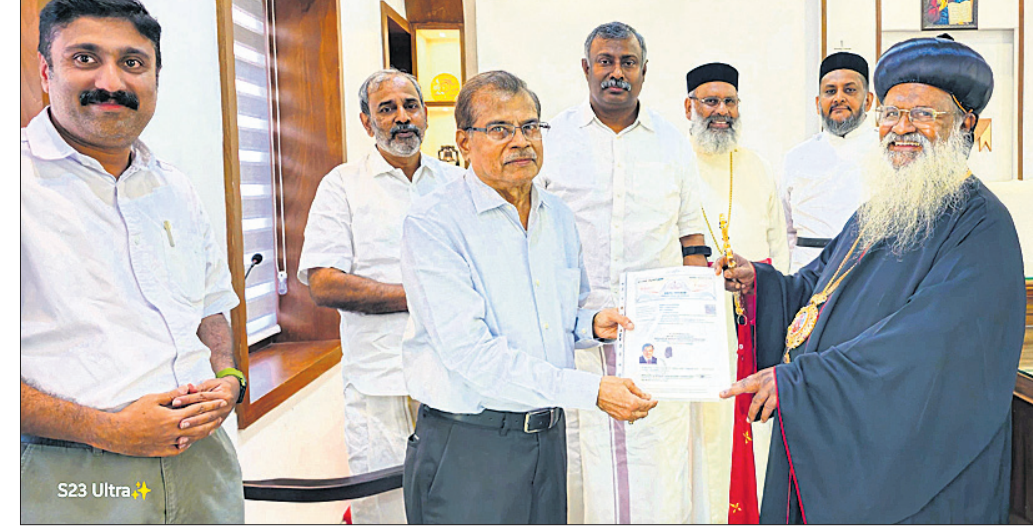
ଡି.ଏ.ଏ. ପକ୍ଷରୁ ମୁଖ୍ୟ ପରିବାର ପକ୍ଷରୁ ମୂଲ୍ୟବାନ ଜମି ଦାନ କରାଯାଇଛି । ଏହି ଅବସରରେ ମୁଖ୍ୟ ପରିବାର ପକ୍ଷରୁ ମୂଲ୍ୟବାନ ଜମି ଦାନ କରାଯାଇଛି ।

ଦୁଆବିଳା, ୧.୧୧ ଦେଶର ପ୍ରମୁଖ ଘରୋଇ ସଂସ୍ଥା ମୁଖ୍ୟ ପରିବାର ପକ୍ଷରୁ ମୂଲ୍ୟବାନ ଜମି ଦାନ କରାଯାଇଛି । ଏହା ଟିକସ ଆଦାନର ଇତିହାସରେ ସର୍ବୋଚ୍ଚ ସ୍ତରରେ ଉଠିଛି ।