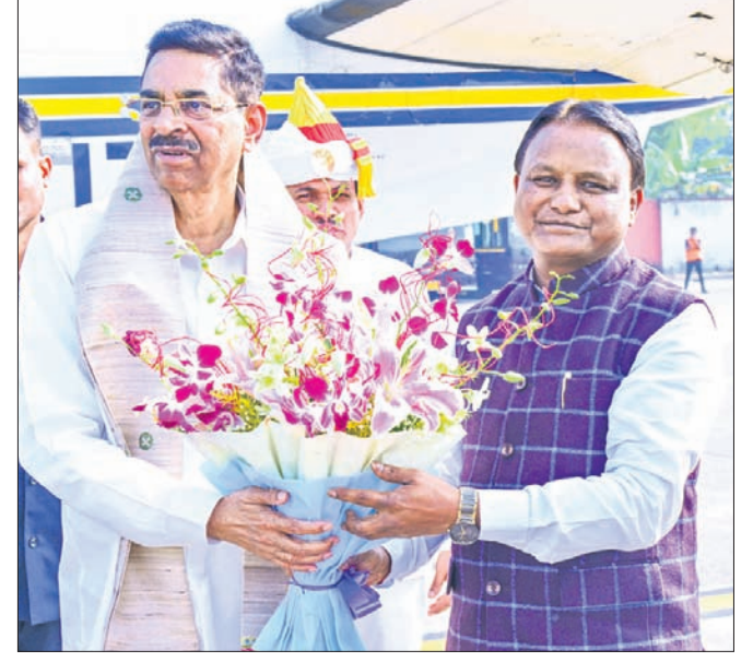
ଓଡ଼ିଶାର ନୂଆ ରାଜ୍ୟପାଳ ହରିବୀରୁ କମ୍‌ପତି ଗୁରୁବାର ଭୁବନେଶ୍ୱର ବିମାନବନ୍ଦରରେ ମୁଖ୍ୟମନ୍ତ୍ରୀ ମୋହନ ଚରଣ ମାଝୀ ସ୍ୱାଗତ ଜଣାଇଛନ୍ତି।