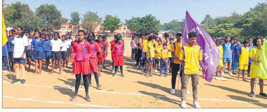
ପ୍ରତିଯୋଗିତାରେ ଭାଗ ନେଇଥିବା କ୍ରୀଡ଼ାବିତ୍ତମାନେ।