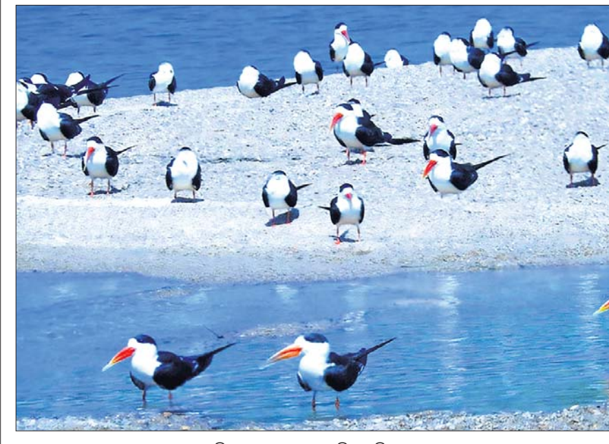
ସାତକୋଶିଆ ଅଭୟାରଣ୍ୟକୁ ଆସିଥିବା ବିଦେଶୀ ପକ୍ଷୀ।