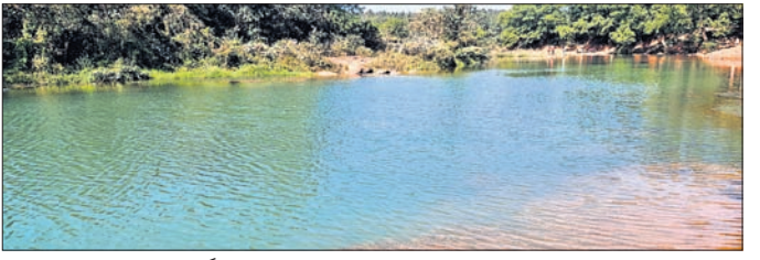
କାରୁବାକୀ ପରେଷ୍ଟ ପାର୍କ' ଦେଇ ଯାଇଥିବା କାରୋନବା।

କେନ୍ଦୁଝର ଜିଲ୍ଲାରେ ଅନେକ ପ୍ରାକୃତିକ ସୌନ୍ଦର୍ଯ୍ୟ ଭରା ପର୍ଯ୍ୟଟକ କ୍ଷେତ୍ର ରହିଛି। ସେଥି ମଧ୍ୟରୁ ଅନେକ ନଦୀକୂଳ, ଜଳପ୍ରପାତ ଓ ତ୍ୟାମ୍ବୁଲୁଧାରୀ ଅବସ୍ଥାରେ ରହିଯାଇଛି। ସେଥି ମଧ୍ୟରୁ ବଡ଼ବିଲ ଯୌରାଞ୍ଚଳର ଉପକଣ୍ଠରେ ଆକର୍ଷଣୀୟ 'କାରୁବାକୀ ପରେଷ୍ଟ ପାର୍କ' ଅନ୍ୟତମ। ଏଠାରେ ଏବେ ଭୋଜିର ଆସର ଜମୁଛି। ପ୍ରକାଶ ଯେ, କରୋ ସଂରକ୍ଷିତ ଜଙ୍ଗଲର କାରୋନଦୀ କୂଳରେ ପିକନିକ ସ୍ପଟ ରହିଛି। ବଡ଼ବିଲ ତଥା ଆଖପାଖ ଅଞ୍ଚଳକୁ ଲୋକେ ଏଠାରେ ବଣଭୋଜି କରି ପ୍ରାକୃତିକ ଦୃଶ୍ୟକୁ ଉପଭୋଗ କରୁଛନ୍ତି। ବଡ଼ବିଲ ଦୃଶ୍ୟକୁ ବସଷ୍ଟାଣ୍ଡଠାରୁ ମାତ୍ର ୫ କିଲୋମିଟର ଓ ବଡ଼ବିଲ ରେଳ ଷ୍ଟେଶନଠାରୁ ମାତ୍ର ୫ କିଲୋମିଟର ଦୂରରେ ଥିବା ଏହି କାରୋନଦୀ କୂଳ 'କାରୁବାକୀ ପରେଷ୍ଟ ପାର୍କ'କୁ ଯିବାକୁ