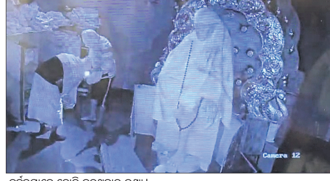
ଧୂର୍ତ୍ତରାମନେ ଚୋରି କରୁଥିବାର ଦୃଶ୍ୟ

ଗଞ୍ଜାମ ଜିଲ୍ଲା ଭଞ୍ଜନଗର ବାଇପାସ ରୋଡ଼ରେ ଥିବା ଶିରିଡ଼ି ସାଇ ମନ୍ଦିରରୁ ଶୁକ୍ରବାର ବିକଳିତ ରାତିରେ ବଡ଼ ଧରଣର ଚୋରି ହୋଇଛି।