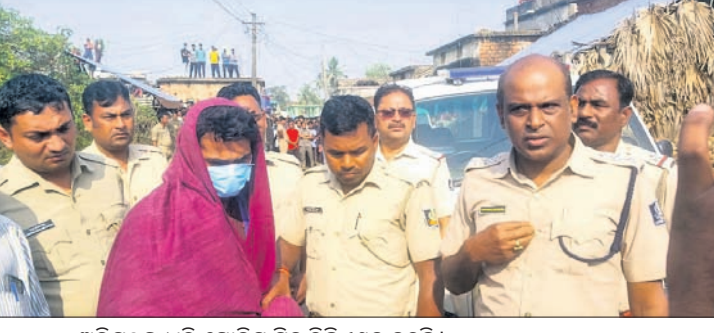
ଅଭିଯୁକ୍ତ ଧରି ପୋଲିସ୍ ସିନ୍ଦ୍ରି ରିଜିଷ୍ଟ୍ରେସନ କରିଛି

ଡେକାନାଲ ଜିଲ୍ଲା ପରଜଙ୍ଗ ଥାନା ବସୋଇ ଗ୍ରାମରେ ଦୁଆବର୍ଷ ଦିନ ଘଟିଥିବା ବାଉଁଶ ହତ୍ୟା ଘଟଣାର ୪୮ ଘଣ୍ଟା ପରେ ପୋଲିସ୍ ଅଭିଯୁକ୍ତଙ୍କୁ ଗିରଫ କରିଛି।