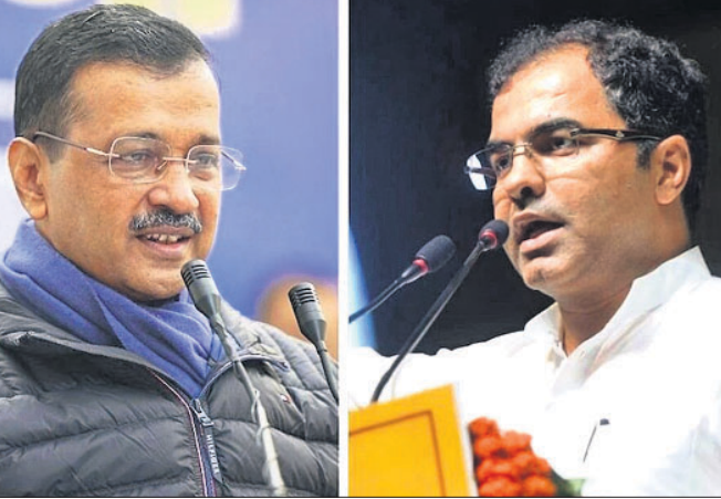
ଆପ୍ ଆବାହକ ଅରବିନ୍ଦ କେଜ୍ରିୱାଲ ଭାଜପା ନେତା ପ୍ରବେଶ ବର୍ମା

ପ୍ରଥମ ପର୍ଯ୍ୟାୟ ପ୍ରାର୍ଥୀ ତାଲିକା ଘୋଷଣାକଲା ଭାଜପା