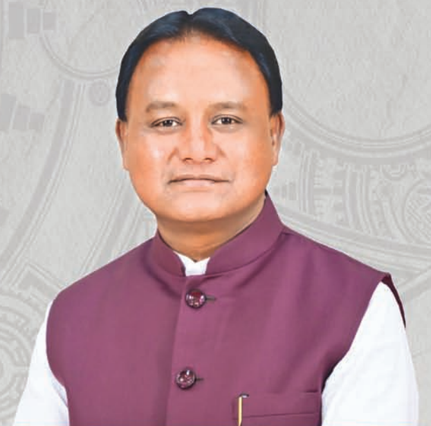
Shri Mohan Charan Majhi Chief Minister, Odisha

UTKARSH ODISHA MAKE IN ODISHA CONCLAVE '25 BHUBANESWAR | 28 th - 29 th JAN | 2025