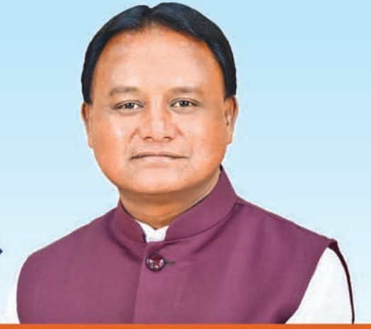
ଶ୍ରୀ ମୋହନ ଚରଣ ମାଝୀ ମୁଖ୍ୟମନ୍ତ୍ରୀ, ଓଡ଼ିଶା