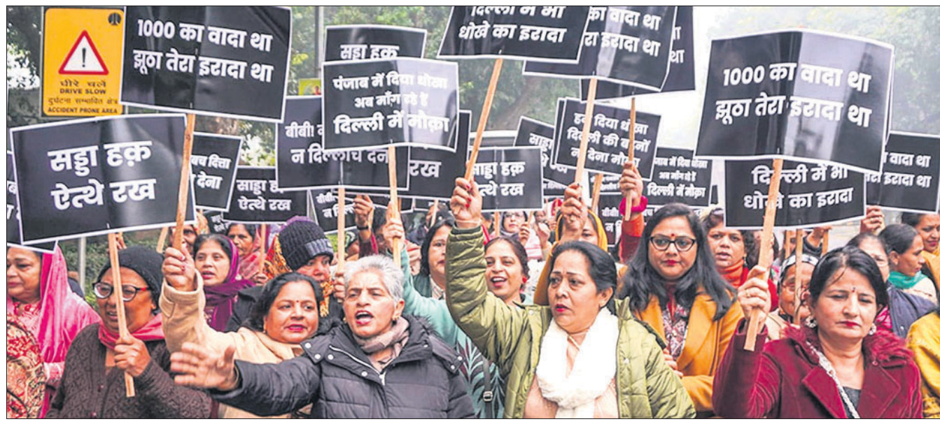
ଦିଲ୍ଲୀର ପୂର୍ବତନ ମୁଖ୍ୟମନ୍ତ୍ରୀ ତଥା ଆପ୍ ଆବାହକ ଅରବିନ୍ଦ କେଜ୍ରିୱାଲଙ୍କ ନୂଆଦିଲ୍ଲୀସ୍ଥିତ ବାସଭବନ ସମ୍ମୁଖରେ ପଞ୍ଜାବର ମହିଳାମାନେ ବିଭିନ୍ନ ପ୍ରସଙ୍ଗକୁ ନେଇ ପ୍ରତିବାଦ କରୁଛନ୍ତି ।