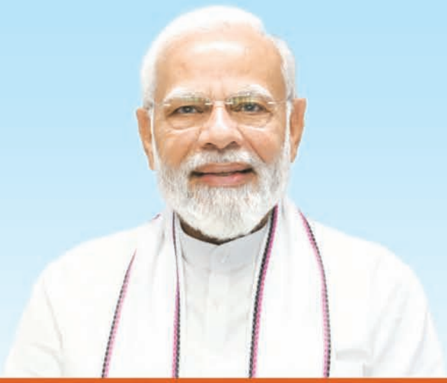
ଶ୍ରୀ ନରେନ୍ଦ୍ର ମୋଦୀ ପ୍ରଧାନମନ୍ତ୍ରୀ