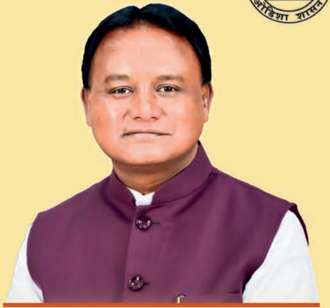
ଶ୍ରୀ ମୋହନ ଚରଣ ମାଝୀ ମୁଖ୍ୟମନ୍ତ୍ରୀ, ଓଡ଼ିଶା