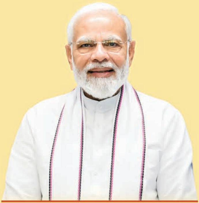
ଶ୍ରୀ ନରେନ୍ଦ୍ର ମୋଦୀ ପ୍ରଧାନମନ୍ତ୍ରୀ