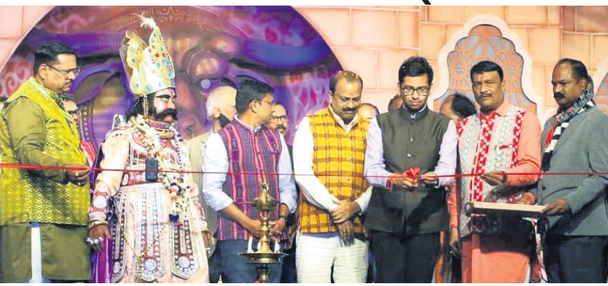
ବରଗଡ଼ ଜିଲ୍ଲାପାଳ ରଙ୍ଗମଞ୍ଚ ଉଦଘାଟନ କରୁଛନ୍ତି।

କର୍ମଚାରୀ କର୍ମକର୍ତ୍ତା ଉପସ୍ଥିତ ଥିଲେ। ରଙ୍ଗମଞ୍ଚ ଉଦଘାଟନ ପରେ ବିଭିନ୍ନ ସାଂସ୍କୃତିକ ଦଳ ନୃତ୍ୟ ପରିବେଷଣା କରିଥିଲେ। କଳାକାରଙ୍କ ନୃତ୍ୟ ପରିବେଷଣା ପରେ କ୍ୟୁ ମହାରାଜା ହାତୀ ପିଠିରେ ବସି ହାତପଦାଗ୍ର ଗଳ