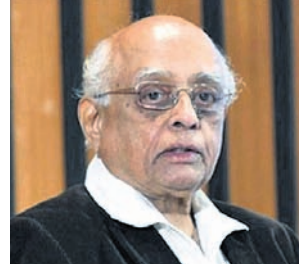
ପୁୟା, ୪୧ (ପି.ଟି.)

୧୯୭୪ ଏବଂ ୧୯୯୮ରେ ଭାରତର ଆଣବିକ ପରୀକ୍ଷାରେ ପ୍ରମୁଖ ଭୂମିକା ନେଇଥିବା ଖ୍ୟାତନାମା ପଦାର୍ଥ ବିଜ୍ଞାନୀ ରାଜଗୋପାଳ ଚିଦାମ୍ବରମ୍ଙ୍କ ଶନିବାର ପରଲୋକ ହୋଇଯାଇଛି। ତାଙ୍କୁ ୮୮ ବର୍ଷ ହୋଇଥିଲା। ଅଣୁଅସ୍ତ୍ର କାର୍ଯ୍ୟକ୍ରମରେ ସମ୍ପୃକ୍ତ ଥିବା ଚିଦାମ୍ବରମ୍ ପୁୟାରେ ଯଶଲୋକ ହସିତାଳରେ ଶେଷ ନିଶ୍ୱାସ ତ୍ୟାଗ କରିଛନ୍ତି। ତାଙ୍କ ଦେହାନ୍ତରେ ପ୍ରଧାନମନ୍ତ୍ରୀ ନରେନ୍ଦ୍ର ମୋଦିଙ୍କ ସମେତ ବହୁ ବିଶିଷ୍ଟ ବ୍ୟକ୍ତି ଗଭୀର ଶ୍ରଦ୍ଧାଘାତ ପୂର୍ଣ୍ଣ।