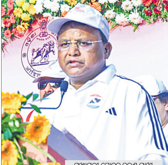
ମୁଖ୍ୟମନ୍ତ୍ରୀ ମୋହନ ଚରଣ ମାଝୀ

ଦୁର୍ଘଟଣା ଏଡ଼ାଇବାରେ ସହାୟକ ହେବ ବୋଲି ଶନିବାର ଜାତୀୟ ପୁରସ୍କାର ମାଧ୍ୟମ ରାଜ୍ୟପ୍ରଭାସ, ଉତ୍ତରକୁ ଉଦ୍‌ଘାଟନ କରି ମୁଖ୍ୟମନ୍ତ୍ରୀ ମୋହନ ଚରଣ ମାଝୀ ପୂର୍ଣ୍ଣା ଦେଇଛନ୍ତି। ମୁଖ୍ୟମନ୍ତ୍ରୀ କହିଛନ୍ତି, ସଡ଼କ ଦୁର୍ଘଟଣା ରୋକିବାରେ ଟେକ୍ନୋଲୋଜିର ଭୂମିକା ଗୁରୁତ୍ୱପୂର୍ଣ୍ଣ। କାର୍ତ୍ତିକ ପ୍ରୟୋଗରେ ନିର୍ମିତ ସ୍ମାର୍ଟ ଡିଭାଇସ୍ ଗାଡ଼ି ତାଳକ ଡ୍ରାଇଭିଂ ବେଳେ ନିଶ୍ଚିତ ଭାବେ ଘରକୁ ଫେରିବାକୁ ସେ ସମସ୍ତଙ୍କୁ ନିବେଦନ କରିଛନ୍ତି। ସଚେତନତା କାର୍ଯ୍ୟକ୍ରମକୁ ପ୍ରଭାବଶାଳୀ କରିବାକୁ ମାଷ୍ଟରକ୍ୟାମ୍ପନ ଛକରୁ ଶ୍ରୀରାମ ମନ୍ଦିର ଯାଏ ମୁଖ୍ୟମନ୍ତ୍ରୀ ପଦଯାତ୍ରା କରିଛନ୍ତି । କେନ୍ଦ୍ର ସଡ଼କ ପରିବହନ ଓ ରାଜପଥ ମନ୍ତ୍ରାଳୟ ପକ୍ଷରୁ ଜାନୁଆରୀ ମାସ ବ୍ୟାପୀ ଜାତୀୟ ସଡ଼କ ସୁରକ୍ଷା ପୂର୍ଣ୍ଣା।