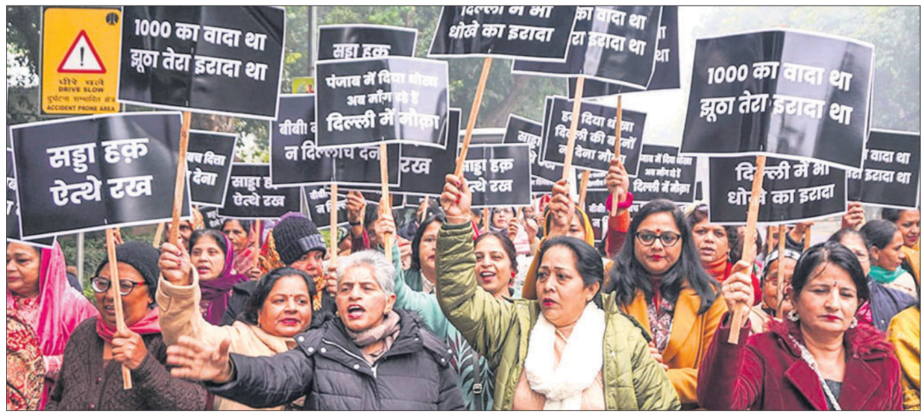
ଦିଲ୍ଲୀର ପୂର୍ବତନ ମୁଖ୍ୟମନ୍ତ୍ରୀ ତଥା ଆପ୍ ଆବାହକ ଅରବିନ୍ଦ କେଜ୍‌ରିୱାଲଙ୍କ ନୂଆଦିଲ୍ଲୀସ୍ଥିତ ବାସଭବନ ସମ୍ମୁଖରେ ପଞ୍ଜାବର ମହିଳାମାନେ ବିଭିନ୍ନ ପ୍ରସଙ୍ଗକୁ ନେଇ ପ୍ରତିବାଦ କରୁଛନ୍ତି ।