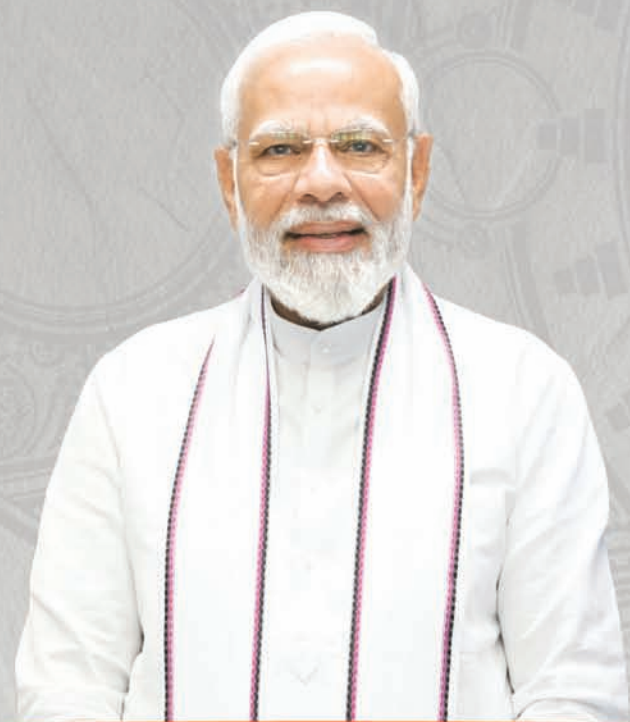
Shri Narendra Modi Prime Minister