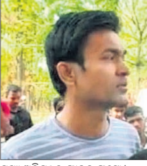
ସୂକ୍ଷ୍ମ ଅଭିଯୁକ୍ତର ଫାଲୁ ଫଟୋ।

ଡେକାନାଲ ଜିଲ୍ଲା ପରଜଙ୍ଗ ଥାନା ବସୋଳ ଗ୍ରାମରେ ନୂଆବର୍ଷ ଦିନ ଘଟିଥିବା ବାକସ ହତ୍ୟା ଘଟଣାର ୪୮ ଘଣ୍ଟା ପରେ ପୋଲିସ୍ ଅଭିଯୁକ୍ତଙ୍କୁ ଗିରଫ କରିଛି।