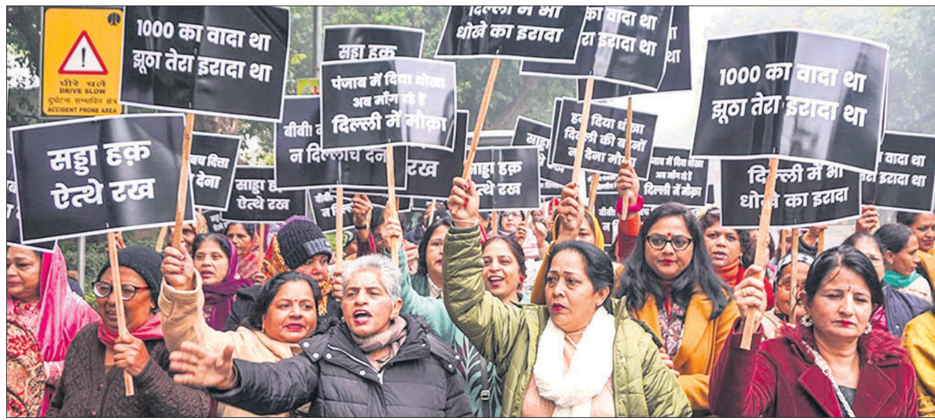
ଦିଲ୍ଲୀର ପୂର୍ବତନ ମୁଖ୍ୟମନ୍ତ୍ରୀ ତଥା ଆପ୍ ଆବାହକ ଅରବିନ୍ଦ କେଜ୍‌ରିୱାଲଙ୍କ ନୂଆଦିଲ୍ଲୀସ୍ଥିତ ବାସଭବନ ସମ୍ମୁଖରେ ପଞ୍ଜାବର ମହିଳାମାନେ ବିଭିନ୍ନ ପ୍ରସଙ୍ଗକୁ ନେଇ ପ୍ରତିବାଦ କରୁଛନ୍ତି ।