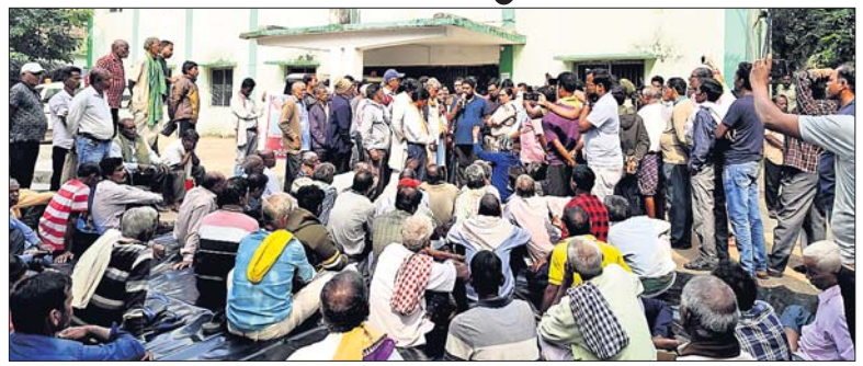
ବରା, ୨୧ (ମହେନ୍ଦ୍ର ସାହୁ)

ବରା ବ୍ଲକର ଦୁର୍ଗାବିଳାସ ଗଣାଘର ପାଳିଚିଲି ବିଗତ ଦିନରେ ପ୍ରଧାନମନ୍ତ୍ରୀ ଆବାସ ଯୋଜନା, ମହାତ୍ମା ଗାନ୍ଧୀ ଜାତୀୟ ଗ୍ରାମୀଣ ନିରକ୍ଷିତ କର୍ମ ନିମ୍ବୁକ୍ତି ଯୋଜନା (ଏମ୍.ଜି.ଏନ.ଆର.ଇ.ଜି.ଏସ୍) ରେ ବିଦ୍ୟାଳୟ, ବାକ୍ସି କନିଟ ଗୋରାରେ ପଢ଼ିତ ହୋଇଥିବା ବୃକ୍ଷାବୃକ୍ଷ ଶ୍ରମିକ ଦର୍ଶାଯାଇ ଲକ୍ଷ୍ୟାଧିକ ଚଳା ବିଭିନ୍ନ ପ୍ରକଳ୍ପ ମାଧ୍ୟମରେ ଆତ୍ମସାତ କରାଯାଇଥିବା ଅଭିଯୋଗ ହୋଇଥିଲା। ବିଶେଷ କରି ବରା ବ୍ଲକ ଅଧୀନ ଗଣ୍ଡୁ ପଞ୍ଚାୟତରେ ଏମ୍.ଜି.ଏନ.ଆର.ଇ.ଜି.ଏସ୍ରେ ବ୍ୟାପକ ଅର୍ଥ ହରିଲୁଟ ହେବା, ବାତ୍ୟା ଦାନା ପାଇଁ ୪୦ ଆଶ୍ରୟସ୍ଥଳୀରେ ବେଆଇନ ଭାବେ ଆଶ୍ରୟ ନେଇଥିବା ଲୋକମାନଙ୍କ ନାମ ଦର୍ଶାଯାଇ ପ୍ରାୟ ୧୯ ଲକ୍ଷ ଟଙ୍କା ବିଭିନ୍ନ ପଞ୍ଚାୟତର ସରପଞ୍ଚମାନେ କାର୍ଯ୍ୟନିର୍ବାହୀ ଅଧିକାରୀମାନଙ୍କୁ ହାତ କରି ଆତ୍ମସାତ କରିଥିବା ଅଭିଯୋଗ ହୋଇଥିଲା। ଏହାକୁ ନେଇ ନବ ନିର୍ମାଣ କୃଷକ ସଙ୍ଗଠନ ଜିଲ୍ଲା ସଂଯୋଜକ ନିର୍ମାଣ ଚରଣ ରାୟଙ୍କ ନେତୃତ୍ୱରେ ଭିଜିଲାଟ୍