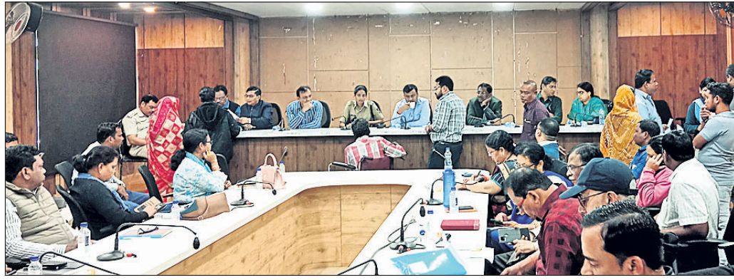
ପ୍ରଶାସନିକ ଅଧିକାରୀମାନେ ଲୋକଙ୍କ ଅଭିଯୋଗ ଶୁଣୁଛନ୍ତି।