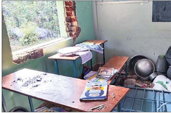
ହାତୀପଲ ଭାଙ୍ଗି ଦେଇଥିବା ବିଦ୍ୟାଳୟ କାଢ଼ ।

ଭୁବନେଶ୍ୱର, ୬୧ (ବାବୁଲୀ ପ୍ରଧାନ) ଗଞ୍ଜାମ ଜିଲ୍ଲା ଭଞ୍ଜନଗର ବ୍ଲକ୍ ବିରିକୋଟ ଉଚ୍ଚ ପ୍ରାଥମିକ ବିଦ୍ୟାଳୟରେ ରବିବାର ହାତୀପଲ ପଶି ପାଚେରି ସମେତ ଅନ୍ୟାନ୍ୟ ଜିନିଷ ଭଙ୍ଗାଗୁଡ଼ିକା କରିଛନ୍ତି । ଖବର ପାଇ ସୋମବାର ବନ ବିଭାଗ କର୍ମଚାରୀ ଘଟଣା ସ୍ଥଳରେ ପହଞ୍ଚି ଏହାର ତଦ୍ୱାରା ଆରମ୍ଭ କରିଛନ୍ତି । ବିଗତ ଦୁଇ ସପ୍ତାହ ଧରି ପୁଲିଗଡ଼ ବନାଞ୍ଚଳରେ ହାତୀପଲ ବିଭିନ୍ନ ସ୍ଥାନରେ ଘର ଭାଙ୍ଗିବା ସହ ଧାନ ଓ ଚାଉଳ ବସ୍ତ୍ର ଚାଣି ନେଇ ଖାଉଛନ୍ତି । ବର୍ତ୍ତମାନ ଏହି ହାତୀପଲ ତହ ସେକସନ ଅଧୀନ ବିରିକୋଟ ଗ୍ରାମ ନିକଟବର୍ତ୍ତୀ ଜଙ୍ଗଲ ଅଞ୍ଚଳରେ ଚଳପ୍ରଚଳ କରୁଛନ୍ତି । ହାତୀପଲ କିଛି ଚାଷୀଙ୍କ ପରିବା ବାଡ଼ି ନଷ୍ଟ କରିଥିବା ବେଳେ କେତେଜଣ ଚାଷୀଙ୍କ ଘରୁ