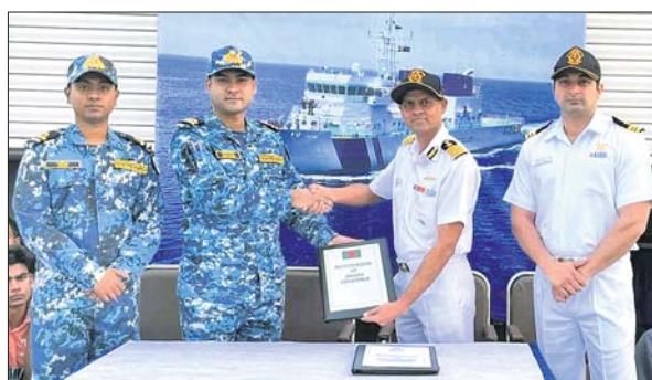
ଭାରତ ଓ ବାଂଲାଦେଶୀ କୋଷ୍ଟଗାର୍ଡ ଟିମ୍ ପରସ୍ପରକୁ ପ୍ରତ୍ୟର୍ପଣ ସମ୍ପର୍କିତ ରୁକ୍ଷନାମା ହସ୍ତାନ୍ତର କରୁଛନ୍ତି ।

ପାରାଦୀପରେ ତିସେମସ ୧୦ରୁ ଅଧକ ଥିବା ୬୮ ବାଂଲାଦେଶୀ ମହାସୂଚୀ ଓ ୨ ବୋଟ ସୋମବାର ପ୍ରମୁଖରେ ସ୍ୱଦେଶ ଫେରିଯାଇଛନ୍ତି । ସୋମବାର ସହ ପୂର୍ବରୁ କୋଲକାତାରେ ଅଟକ ଥିବା ୧୨ ମହାସୂଚୀଙ୍କୁ ମଧ୍ୟ ପଠାଇ ଦିଆଯାଇଛି । ଜବାବରେ ବାଂଲାଦେଶରେ ଅଟକ ଥିବା ୬ ଭାରତୀୟ ମାଛଧରା ବୋଟ ସମେତ ସେଠାକାର ଜଳସୀମାରେ ଧରାପଡ଼ିଥିବା ୯୫ ମହାସୂଚୀଙ୍କୁ ବାଂଲାଦେଶୀ କୋଷ୍ଟଗାର୍ଡ ଟିମ୍ ଛାଡ଼ିଦେଇଛି । ଭାରତ-ବାଂଲାଦେଶୀ ଜଳସୀମା ପାଖରେ ଉଭୟ ପକ୍ଷର କୋଷ୍ଟଗାର୍ଡ ଟିମ୍ ପରସ୍ପର ଦେଶର ନାଗରିକଙ୍କୁ ପ୍ରତ୍ୟର୍ପଣ କରିବା ସହ ରୁକ୍ଷନାମା ହସ୍ତାନ୍ତର କରିଥିଲେ । ଏହାପରେ ଭାରତୀୟ କୋଷ୍ଟଗାର୍ଡର ପାଗ୍ରୋଲିଂ ଜାହାଜ ସମ୍ପୃକ୍ତ ବୋଟଗୁଡ଼ିକୁ ନେଇ ଧାର୍ଯ୍ୟ ସ୍ଥାନରେ ଛାଡ଼ି ଦେଇଛି । ସୂଚନାଯୋଗ୍ୟ, ଗତ ତିସେମସ ୯ରେ ବାଂଲାଦେଶର ବୁକ୍ରିଟ ବଡ଼ ମାଛଧରା ବୋଟ ଭାରତୀୟ ଜଳସୀମାରେ ପ୍ରବେଶ କରି ଫିଶି