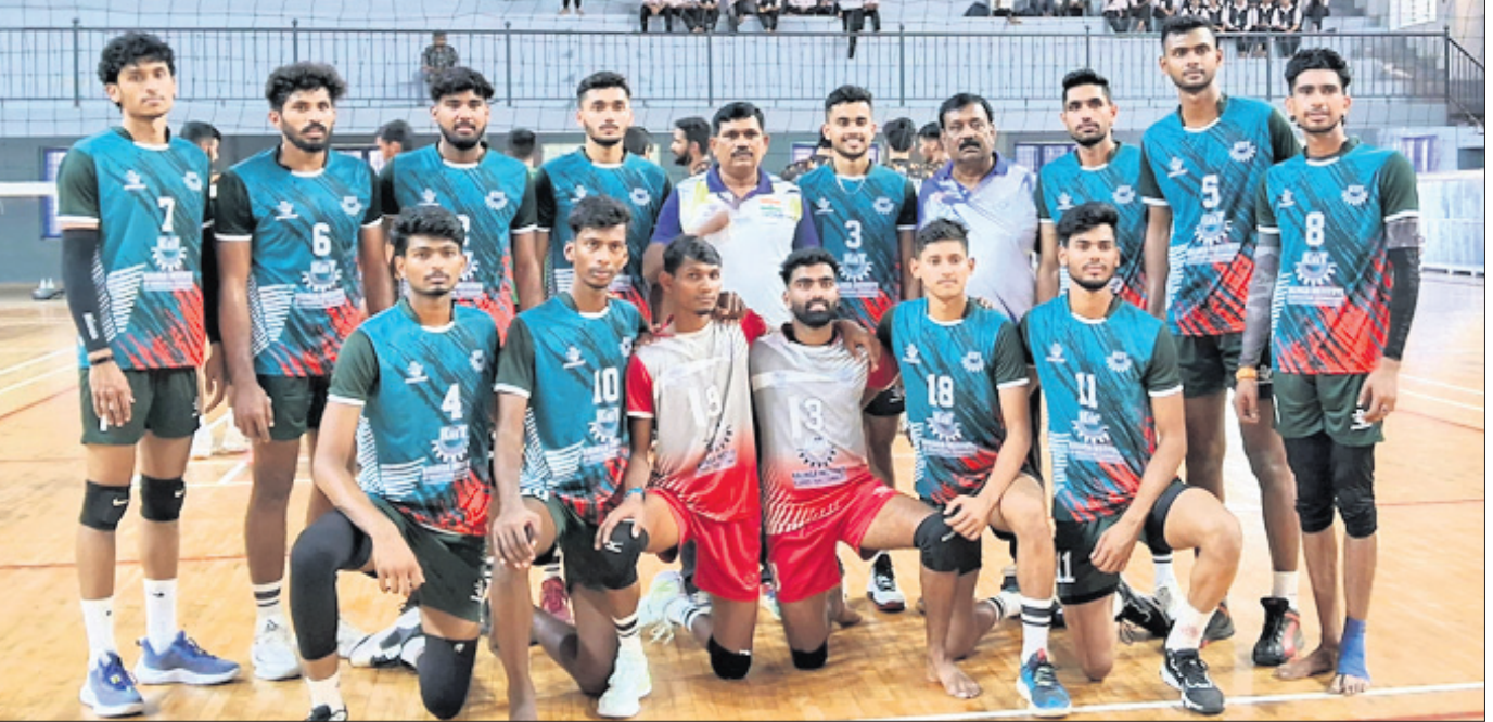
ସର୍ବଭାରତୀୟ ଆକ୍ଷୟ ବିଶ୍ୱବିଦ୍ୟାଳୟ ଭଲିବଲ ପ୍ରତିଯୋଗିତାରେ ଅଂଶଗ୍ରହଣ କରିଥିବା କିଟ୍ ଦଳ।