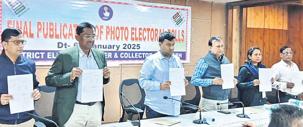
ଜିଲ୍ଲାପାଳ ଓ ପ୍ରଶାସନିକ ଅଧିକାରୀମାନେ ଚୁଡ଼ାନ୍ତ ଭୋଟର ତାଲିକା ଦେଖାଉଛନ୍ତି ।