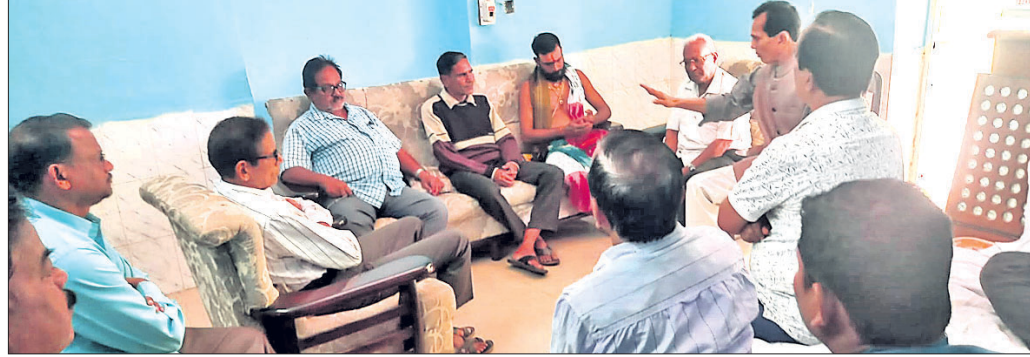
ବୈଠକରେ ଯୋଗ ଦେଇଥିବା ମାଘ ମେଳା ମହୋତ୍ସବ କମିଟିର ସଦସ୍ୟମାନେ।