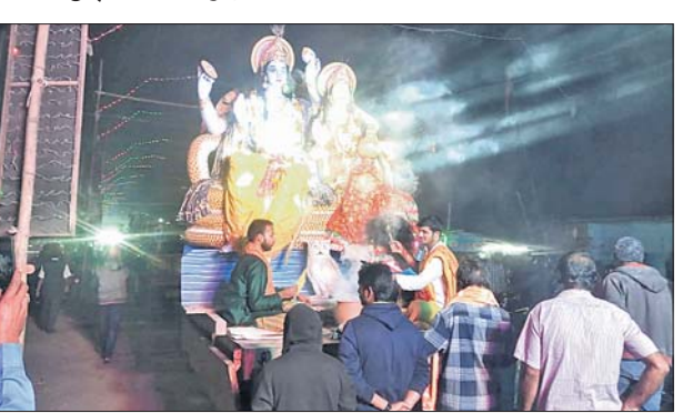
ଶୁଭାପନରେ ପାଳନ କରିଛନ୍ତି। ମଣ୍ଡପରୁ ମା ଲକ୍ଷ୍ମୀ, ପ୍ରଭୁ ନାରାୟଣଙ୍କ ମୂର୍ତ୍ତିକୁ ପାଠ୍ୟାଧାର, ଗୁରୁଜି ବାଦ୍ୟ, ଶଙ୍ଖୁଆ, ନେଇ ଏକ ବିରାଟ ପରୁଷ୍ଠାରେ ବଜାର କାର୍ଯ୍ୟକର୍ତ୍ତାମାନେ ଭସାଣ ଉତ୍ସବକୁ ଖୁସି

ଯାଜପୁର ଜିଲ୍ଲାର ଗଣପର୍ବ ଭାବେ ପରିଚିତ ରଘୁଲପୁର ବ୍ଲକର ୭୦ତମ କୁଆଖିଆ ଲକ୍ଷ୍ମୀନାରାୟଣ ପୂଜା ଉତ୍ସବ ଓ ୧୨ତମ କୁଆଖିଆ ମହୋତ୍ସବ-୨୦୨୪ ସୋମବାର ଶେଷ ହୋଇଛି। ଏହି ଅବସରରେ ପୂଜା ମଣ୍ଡପରେ ମାଧ୍ୟାଧିକ କାଳ ପୂଜା ପାଉଥିବା ପ୍ରଭୁ ଗଜ ଉଦ୍‌ଯାପିତ ମୂର୍ତ୍ତି ମେଳାଣି ନେଇଛନ୍ତି। ଭସାଣ ଉତ୍ସବରେ ଭକ୍ତ ଓ ଭଗବାନଙ୍କ ମଧ୍ୟରେ ଭାବାବେଗ ପରିବେଶ ସୃଷ୍ଟି ହୋଇଥିଲା। ଲକ୍ଷ୍ମୀ ନାରାୟଣ ପୂଜା କମିଟିର କାର୍ଯ୍ୟକର୍ତ୍ତାମାନେ ଭସାଣ ଉତ୍ସବକୁ ଖୁସି