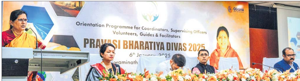
ଉପଯୁକ୍ତମନ୍ତ୍ରୀ ପ୍ରଭାତୀ ପରିଡ଼ା ପର୍ଯ୍ୟଟନ ଗାଇଡ୍, ସୁପରଭାଇଜର ଓ ସଂଯୋଜକଙ୍କୁ ପରାମର୍ଶ ଦେଉଛନ୍ତି ।