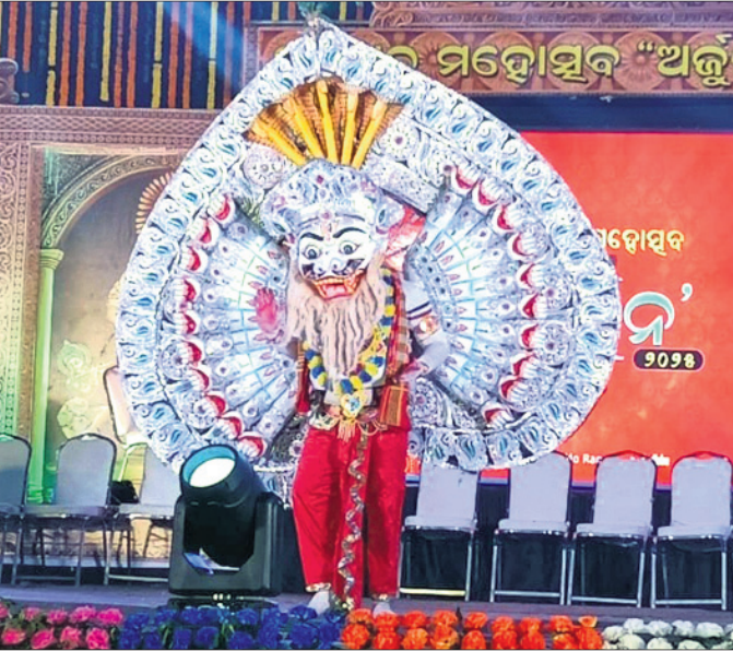
କଳାକାରଙ୍କ ଦ୍ୱାରା ନୃତ୍ୟ ପରିବେଷଣ ।