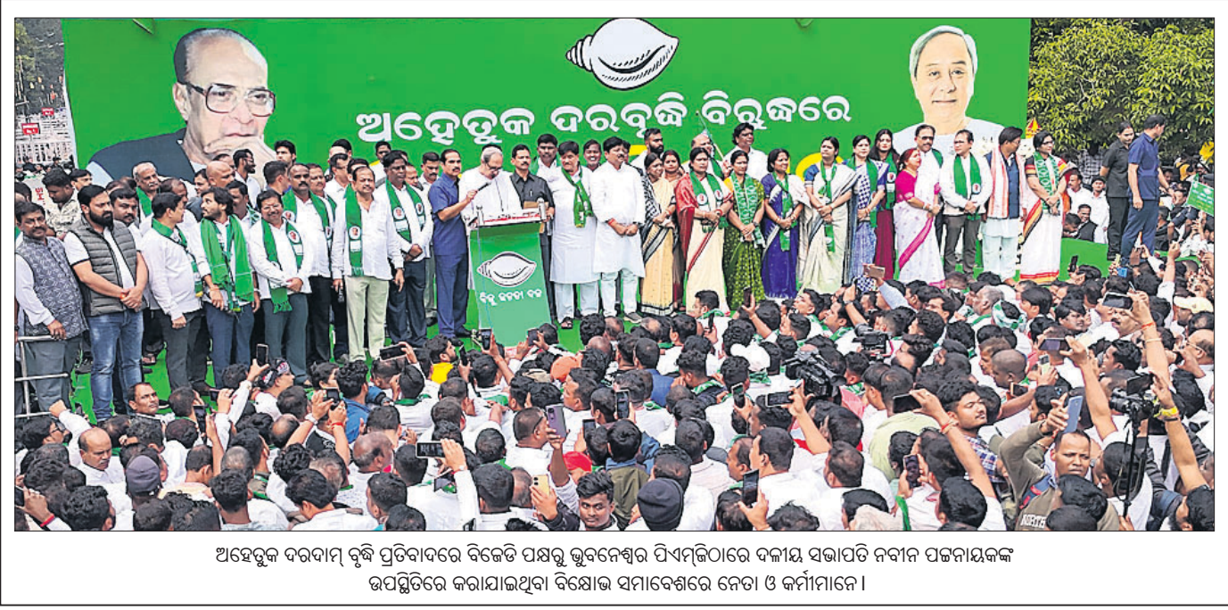
ଅହେତୁକ ଦରବୃଦ୍ଧି ବିରୁଦ୍ଧରେ ବିଜେଡି ପକ୍ଷରୁ ଭୁବନେଶ୍ୱର ପିଏମ୍‌ଜିଓରେ ଦଳୀୟ ସଭାପତି ନବୀନ ପଟ୍ଟନାୟକଙ୍କ ଉପସ୍ଥିତିରେ କରାଯାଇଥିବା ବିରୋଧ ସମାବେଶରେ ନେତା ଓ କର୍ମୀମାନେ ।