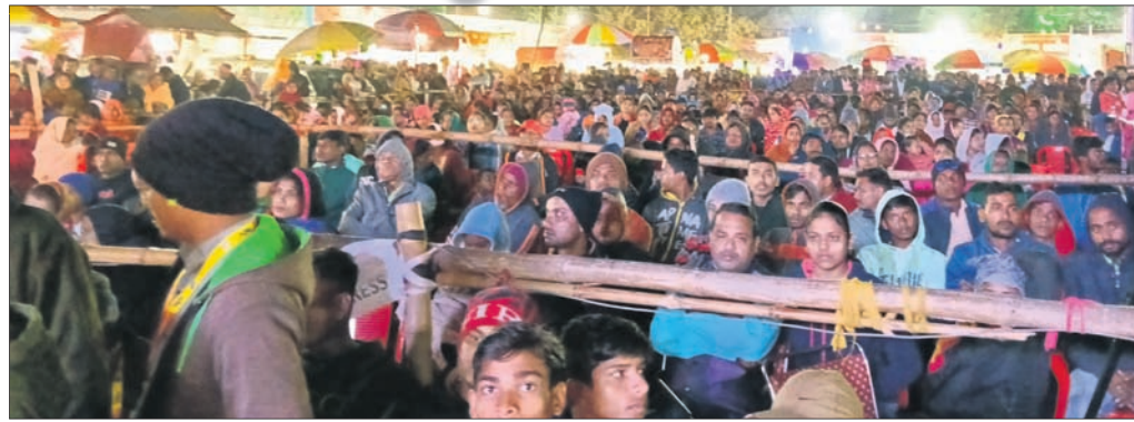
ସାଂସ୍କୃତିକ କାର୍ଯ୍ୟକ୍ରମ ଦେଖିବା ଲାଗି ଲୋକଙ୍କ ଗହଳି ।