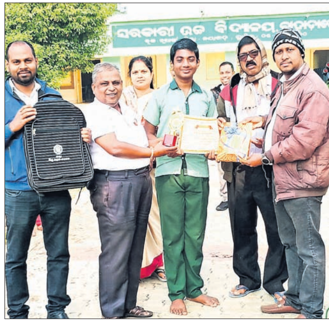
କବିତା ପାଇଁ କାହ୍ନୁକୁ ସମର୍ଥନ କରାଯାଇଛି।

ନୟାଗଡ଼/ଓଡ଼ିଶା, ୬।୧ (ଲୋକନାଥ ମିଶ୍ର/ଆଦର୍ଶ କୁମାର ପଟ୍ଟନାୟକ)