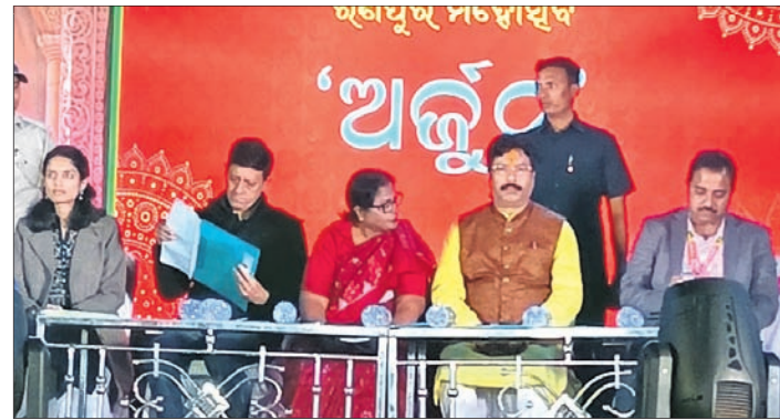
ମହୋତ୍ସବରେ ବାଚସ୍ପତି ସୁରମା ପାଢ଼ୀ, ମନ୍ତ୍ରୀ କୃଷ୍ଣଚନ୍ଦ୍ର ମହାପାତ୍ର, ବିଧାୟକ ସିଦ୍ଧାନ୍ତ ମହାପାତ୍ର ଓ ଅନ୍ୟମାନେ ।