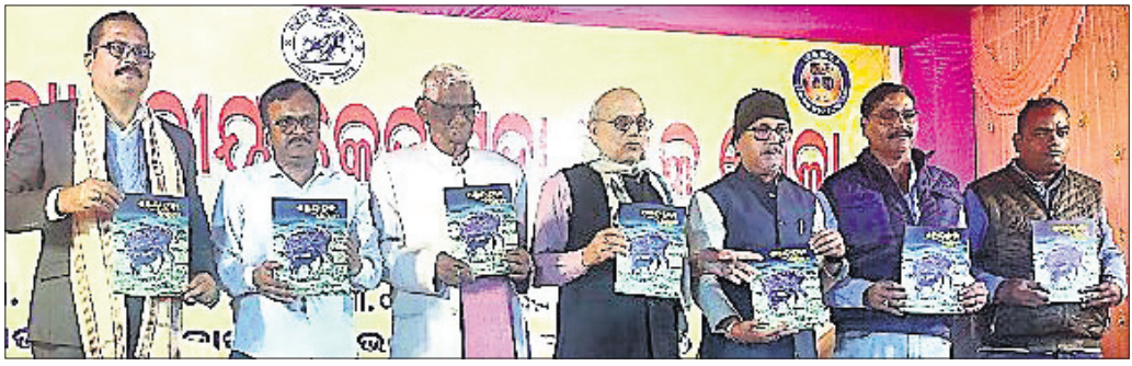
ଅତିଥିମାନେ ମେଳାରେ ପୁସ୍ତକ ଉଦ୍‌ଘାଟନ କରୁଛନ୍ତି।