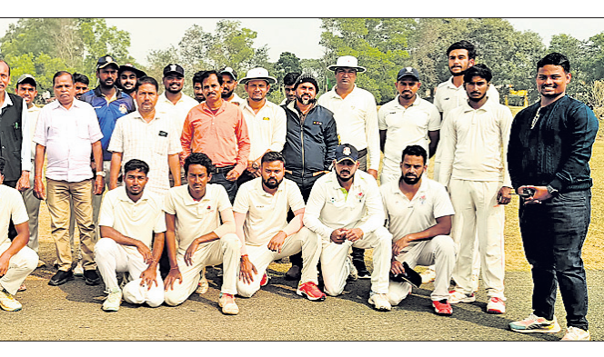
ଅତିଥିଙ୍କ ଗହଣରେ ଉଚ୍ଚ ଉପକ୍ରମ ଖେଳାଳିମାନେ।