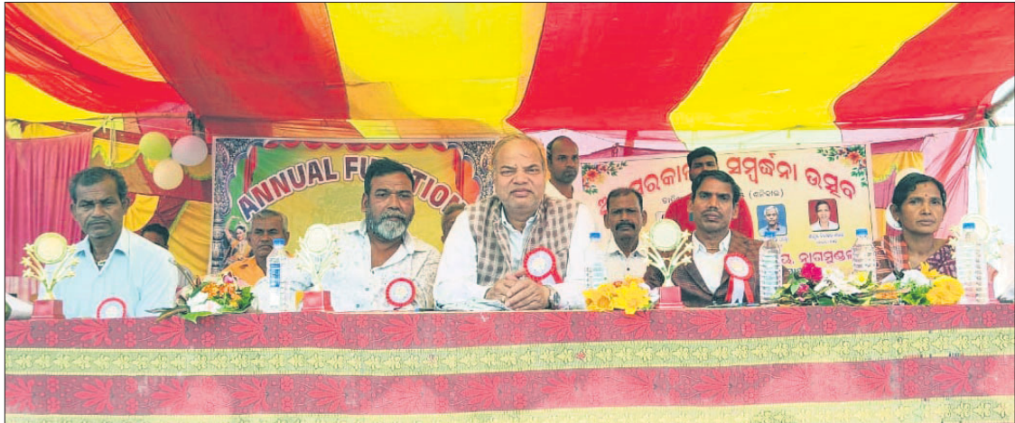
ଉତ୍ସବରେ ଉପସ୍ଥିତ ଅତିଥି।