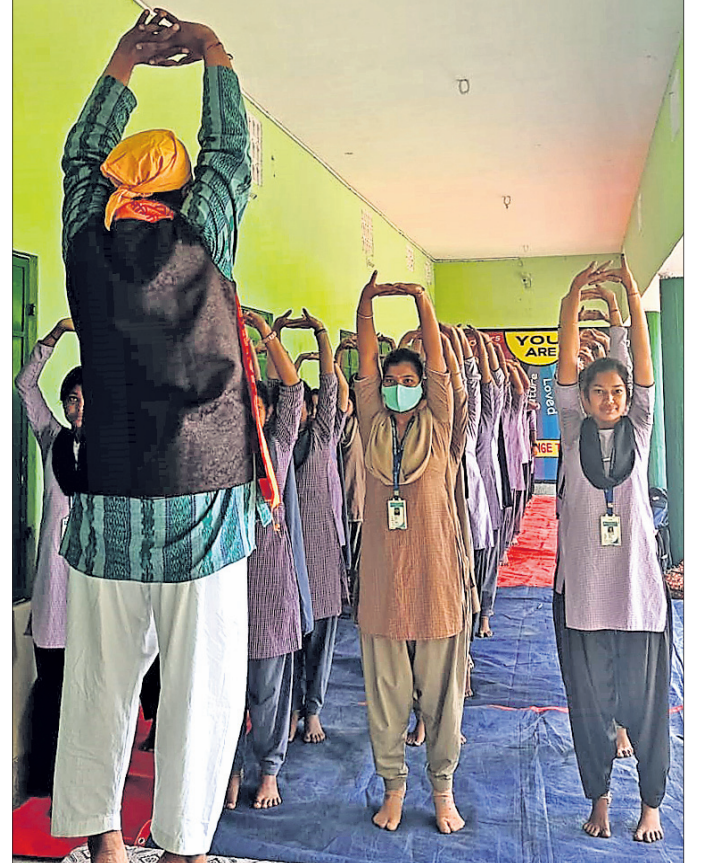
ଛାତ୍ରମାନଙ୍କୁ ଯୋଗ ପ୍ରଶିକ୍ଷଣ ଦିଆଯାଇଛି ।