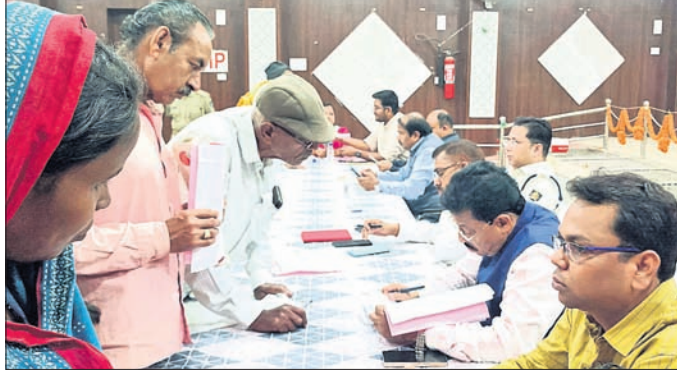
ପ୍ରଶାସନିକ ଅଧିକାରୀ ଲୋକଙ୍କ ଅଭିଯୋଗ ଶୁଣୁଛନ୍ତି।