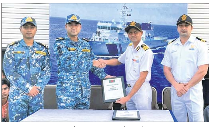
ଭାରତ ଓ ବାଂଲାଦେଶୀ କୋଷ୍ଟଗାର୍ଡ ଟିମ୍ ପରସ୍ପରକୁ ପ୍ରତ୍ୟର୍ପଣ ସମ୍ପର୍କିତ ଚୁକ୍ତିନାମା ହସ୍ତାନ୍ତର କରୁଛନ୍ତି

ପାରାଦୀପରେ ଡିସେମ୍ବର ୧୦ରୁ ଅଟକ ଥିବା ୬୮ ବାଂଲାଦେଶୀ ମହାସୂଚୀ ଓ ୨ ବୋଟ ଯୋମବାଦ ପ୍ରତ୍ୟୁତ୍ଥରେ ସ୍ୱଦେଶ ଫେରିଯାଇଛନ୍ତି । ସେମାନଙ୍କ ସହ ପୂର୍ବରୁ କୋଲକାତାରେ ଅଟକ ଥିବା ୧୨ ମହାସୂଚୀଙ୍କୁ ମଧ୍ୟ ପଠାଇ ଦିଆଯାଇଛି । ଜବାବରେ ବାଂଲାଦେଶରେ ଅଟକ ଥିବା ୬ ଭାରତୀୟ ମାଲିଆ ବୋଟ ସମେତ ସେଠାକାର ଜଳସୀମାରେ ଧରାପଡ଼ିଥିବା ୯୫ ମହାସୂଚୀଙ୍କୁ ବାଂଲାଦେଶ କୋଷ୍ଟଗାର୍ଡ ଟିମ୍ ଛାଡ଼ିଦେଇଛି । ଭାରତ-ବାଂଲାଦେଶ ଜଳସୀମା ପାଖରେ ଉଭୟ ପକ୍ଷର କୋଷ୍ଟଗାର୍ଡ ଟିମ୍ ପରସ୍ପର ଦେଶର ନାଗରିକଙ୍କୁ ପ୍ରତ୍ୟର୍ପଣ କରିବା ସହ ଚୁକ୍ତିନାମା ହସ୍ତାନ୍ତର କରିଥିଲେ । ଏହାପରେ ଭାରତୀୟ କୋଷ୍ଟଗାର୍ଡର ପାଟ୍ରୋଲିଂ କ୍ରମକୁ ବ୍ୟାପକ ଭାବରେ ନେଇ ଧାର୍ଯ୍ୟ ସ୍ଥାନରେ ଛାଡ଼ି ଦେଇଛି । ସୂଚନାଯୋଗ୍ୟ, ଗତ ଡିସେମ୍ବର ୯ରେ ବାଂଲାଦେଶର ଚୁକ୍ତିବଦ୍ଧ ମାଲିଆ ବୋଟ ଭାରତୀୟ ଜଳସୀମାରେ ପ୍ରବେଶ କରି ପିଙ୍ଗି କରୁଥିଲେ । ସେହିବୋଟ ଚୁକ୍ତି ବିରୋଧରେ ଦୃଢ଼ କାର୍ଯ୍ୟାନୁଷ୍ଠାନ ନେବାକୁ ବନ୍ୟପ୍ରାଣୀ ପ୍ରେମୀ ଦାବି କରିଛନ୍ତି ।