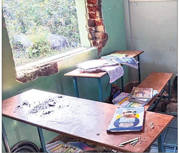
ହାତୀପଲ ଭାଙ୍ଗି ଦେଇଥିବା ବିଦ୍ୟାଳୟ କାଳ ।

ଗଞ୍ଜାମ ଜିଲ୍ଲା ଭଞ୍ଜନଗର ବ୍ଲକ୍ ବିରିକୋଟ ଉଚ୍ଚ ପ୍ରାଥମିକ ବିଦ୍ୟାଳୟରେ ରବିବାର ହାତୀପଲ ପଶି ପାଠପଢ଼ା ସମେତ ଅନ୍ୟାନ୍ୟ ଜିନିଷ ଉଠାଯାଇଛି । ଖବର ପାଇ ସୋମବାର ବନ ବିଭାଗ କର୍ମଚାରୀ ଘଟଣା ସ୍ଥଳରେ ପହଞ୍ଚି ଏହାର ତଦନ୍ତ ଆରମ୍ଭ କରିଛନ୍ତି । ବିଗତ ଦୁଇ ସପ୍ତାହ ଧରି ପୂଜାଗଡ଼ ବନାଞ୍ଚଳରେ ହାତୀପଲ ବିଭିନ୍ନ ସ୍ଥାନରେ ଘର ଭାଙ୍ଗିବା ସହ ଧାନ ଓ ଚାଉଳ ବସ୍ତ୍ର ଚାଣି ନେଇ ଖାଇଛନ୍ତି । ବର୍ତ୍ତମାନ ଏହି ହାତୀପଲ ତହ ସେକ୍ସନ ଅଧୀନ ବିରିକୋଟ ଗ୍ରାମ ନିକଟବର୍ତ୍ତୀ ଜଙ୍ଗଲ ଅଞ୍ଚଳରେ ଚଳପ୍ରଚଳ କରୁଛନ୍ତି । ହାତୀପଲ ଛାଡ଼ି ଗଞ୍ଜାମ ପରିବା ବାଡ଼ି ନଷ୍ଟ କରିଥିବା ବେଳେ କେତେକ ଗଞ୍ଜାମ ଘରୁ ଧାନ ବସ୍ତ୍ର ଚାଣି ନେଇଥିବା ଗଞ୍ଜାମ ପ୍ରକାଶ କରିଛନ୍ତି । ରବିବାର ରାତିରେ ହାତୀପଲ ବିରିକୋଟ ଉଚ୍ଚ ପ୍ରାଥମିକ ବିଦ୍ୟାଳୟରେ ପଶି ଝରଞ୍ଜା ଭାଙ୍ଗିବା ସହ ବ୍ୟାପକ କ୍ଷୟକ୍ଷତି କରିଛନ୍ତି ।