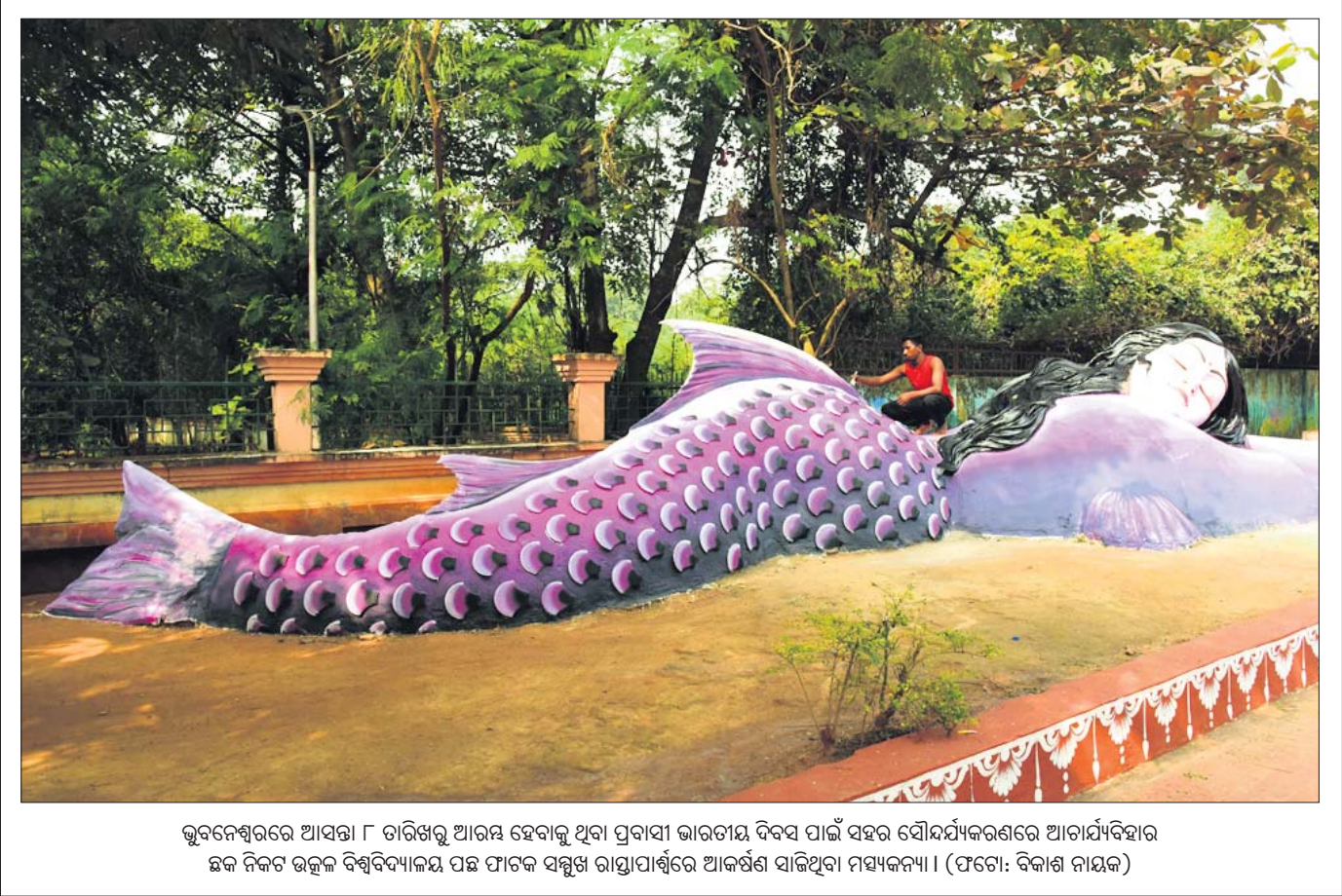
ଭୁବନେଶ୍ୱରରେ ଆସନ୍ତା ୮ ତାରିଖରୁ ଆରମ୍ଭ ହେବାକୁ ଥିବା ପ୍ରବାସୀ ଭାରତୀୟ ଦିବସ ପାଇଁ ସହର ସୌନ୍ଦର୍ଯ୍ୟକରଣରେ ଆବାର୍ଯ୍ୟବିହାର ଛକ ନିକଟ ଉତ୍କଳ ବିଶ୍ୱବିଦ୍ୟାଳୟ ପଛ ଫାଟକ ସମ୍ମୁଖ ରାସ୍ତାପାର୍ଶ୍ୱରେ ଆକର୍ଷଣ ସାଜିଥିବା ମହାସୂଚୀ ।

୯୫ ମାଲିଆ ଥିଲା । ସମ୍ପୂର୍ଣ୍ଣ ୨ ବୋଟକୁ ଭାରତୀୟ କୋଷ୍ଟଗାର୍ଡ ଟିମ୍ କାବୁ କରି ପାରାଦୀପରେ ପହଞ୍ଚିବା ପରେ ସେଥିରେ ଥିବା ବାଂଲାଦେଶୀ ମହାସୂଚୀମାନଙ୍କୁ ପାରାଦୀପ ଆବର୍ଣ୍ଣ ଥାନାକୁ ହସ୍ତାନ୍ତର କରାଯାଇଥିଲା । ଏହାପରେ ପୋଲିସ୍ ବାଂଲାଦେଶୀ ମହାସୂଚୀମାନଙ୍କୁ ଚିରଫ କରି କୋର୍ଟ ଚାଲାଣ କରିବା ପାଇଁ ସମସ୍ତ ପ୍ରକାର କାର୍ଯ୍ୟକ୍ରମ ପ୍ରସ୍ତୁତ କରିଥିଲା । ମାତ୍ର ଡିସେମ୍ବର ୧୨ରେ ଭାରତ ସରକାର ବାଂଲାଦେଶ ସେଣ୍ଟ୍ରାଲ୍ ପ୍ରତ୍ୟର୍ପଣ କରିବାକୁ ଆଲୋଚନା କରିଥିଲେ । ଏଥିସହ ମହାସୂଚୀମାନଙ୍କୁ ଛାଡ଼ିବାକୁ ନିଷ୍ପତ୍ତି ନେଇଥିଲେ । ସେବେଠାରୁ ଉଭୟ ବୋଟ ପାରାଦୀପ ବନ୍ଦର କୋଷ୍ଟଗାର୍ଡ ବର୍ଥରେ ଥିଲା ।