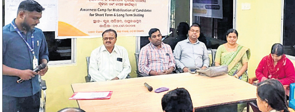
ଶିବିରରେ ଯୋଗଦେଇଥିବା ନିମ୍ନକୃତ୍ୱିକା ଓ ଅନ୍ୟମାନେ।