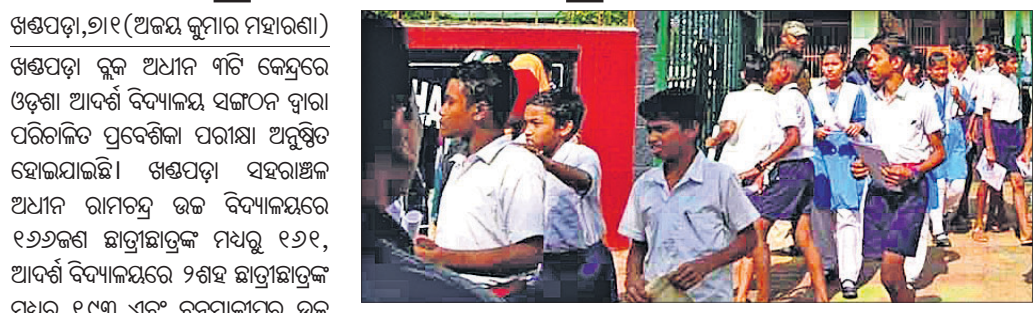
ଖଣ୍ଡପଡ଼ା, ୨୧ (ଅଜୟ କୁମାର ମହାରଣା)

ଖଣ୍ଡପଡ଼ା ବୁକ ଅଧୀନ ୩ଟି କେନ୍ଦ୍ରରେ ଓଡ଼ିଶା ଆଦର୍ଶ ବିଦ୍ୟାଳୟ ସଙ୍ଗଠନ ଦ୍ୱାରା ପରିଚାଳିତ ପ୍ରବେଶିକା ପରୀକ୍ଷା ଅନୁଷ୍ଠିତ ହୋଇଯାଇଛି । ଖଣ୍ଡପଡ଼ା ସହରାଞ୍ଚଳ ଅଧୀନ ରାମଚନ୍ଦ୍ର ଉଚ୍ଚ ବିଦ୍ୟାଳୟରେ ୧୬୬ଜଣ ଛାତ୍ରଛାତ୍ରୀଙ୍କ ମଧ୍ୟରୁ ୧୬୧, ଆଦର୍ଶ ବିଦ୍ୟାଳୟରେ ୨୫୫ ଛାତ୍ରଛାତ୍ରୀଙ୍କ ମଧ୍ୟରୁ ୧୯୩ ଏବଂ ବନମାଳୀପୁର ଉଚ୍ଚ ବିଦ୍ୟାଳୟରେ ୧୬୦ ଛାତ୍ରଛାତ୍ରୀଙ୍କ ମଧ୍ୟରୁ ୧୬୮ ଜଣ ପରୀକ୍ଷାର୍ଥୀ ପରୀକ୍ଷା ଦେଇଥିବା ବିଭିନ୍ନ ବିଭାଗରେ ୧୬୦ ଛାତ୍ରଛାତ୍ରୀଙ୍କୁ ପ୍ରକ୍ରିୟା