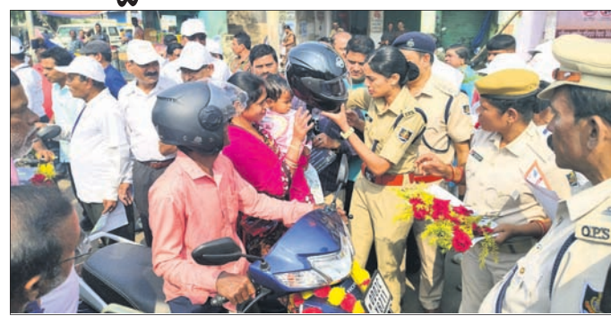
ନୟାଗଡ଼, ୨୧ (ଲୋକନାଥ ମିଶ୍ର)