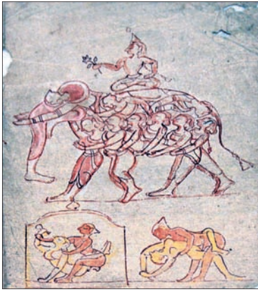
ଯଦୁମଣିଙ୍କ ଦ୍ୱାରା ଅଙ୍କିତ ଚିତ୍ର ଓ ଲେଖିତ୍ୱା ଯୋଗୁଁ