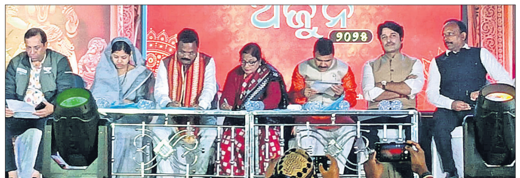
ମହୋତ୍ସବରେ ଉପସ୍ଥିତ ଅତିଥିମାନେ ଏବଂ କଳାକାରମାନଙ୍କ ଦ୍ୱାରା ପାଳିତ ଆଖଡ଼ା ପ୍ରଦର୍ଶନ ।

ଖଣ୍ଡପଡ଼ା ବୁକ ଅଧୀନ ୩ଟି କେନ୍ଦ୍ରରେ ଓଡ଼ିଶା ଆଦର୍ଶ ବିଦ୍ୟାଳୟ ସଙ୍ଗଠନ ଦ୍ୱାରା ପରିଚାଳିତ ପ୍ରବେଶିକା ପରୀକ୍ଷା ଅନୁଷ୍ଠିତ ହୋଇଯାଇଛି । ଖଣ୍ଡପଡ଼ା ସହରାଞ୍ଚଳ ଅଧୀନ ରାମଚନ୍ଦ୍ର ଉଚ୍ଚ ବିଦ୍ୟାଳୟରେ ୧୬୬ଜଣ ଛାତ୍ରଛାତ୍ରୀଙ୍କ ମଧ୍ୟରୁ ୧୬୧, ଆଦର୍ଶ ବିଦ୍ୟାଳୟରେ ୨୫୫ ଛାତ୍ରଛାତ୍ରୀଙ୍କ ମଧ୍ୟରୁ ୧୯୩ ଏବଂ ବନମାଳୀପୁର ଉଚ୍ଚ ବିଦ୍ୟାଳୟରେ ୧୬୦ ଛାତ୍ରଛାତ୍ରୀଙ୍କ ମଧ୍ୟରୁ ୧୬୮ ଜଣ ପରୀକ୍ଷାର୍ଥୀ ପରୀକ୍ଷା ଦେଇଥିବା ବିଭିନ୍ନ ବିଭାଗରେ ୧୬୦ ଛାତ୍ରଛାତ୍ରୀଙ୍କୁ ପ୍ରକ୍ରିୟା