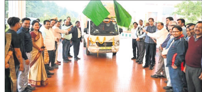
ପଠକା ଦେଖାଇ ସଡ଼କ ସୁରକ୍ଷା ସଚେତନତା ରଥକୁ ଶୁଭାରମ୍ଭ କରାଯାଇଛି।