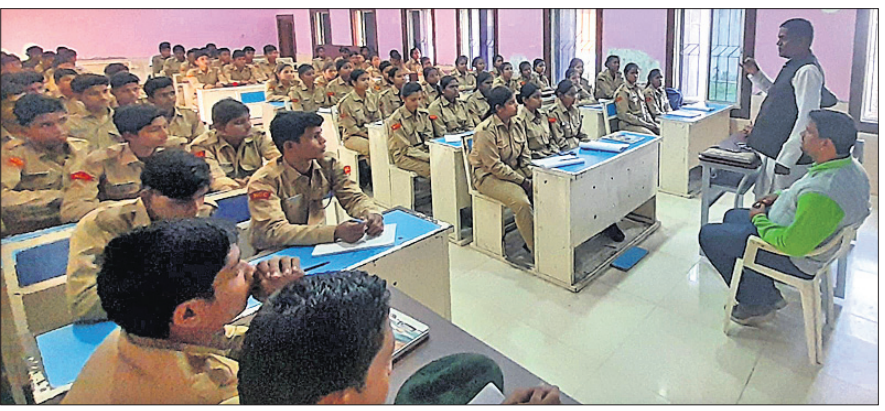
କାର୍ଯ୍ୟକ୍ରମରେ ଯୋଗଦେଇଥିବା ଏନ୍ ସିସି କ୍ୟାଡେଟ୍ମାନେ।

ନାଉରୀ, ୨୧ (ପୁଷ୍ପା ବେହେରା): ନାଉରୀ ବୁକ୍ ଅନ୍ତର୍ଗତ ଅଲଗାଝାଡ଼ ସରକାରୀ ଉଚ୍ଚ ବିଦ୍ୟାଳୟରେ ମଙ୍ଗଳବାର