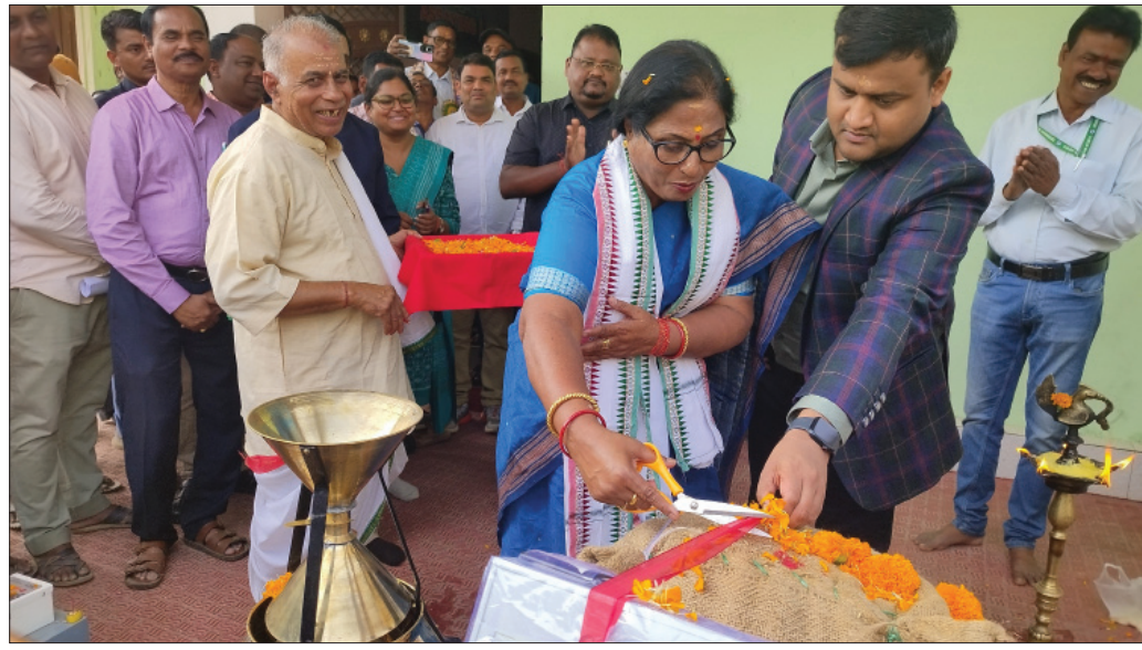
ବାଟସଂଗ୍ରହ ପୁରୁଣା ପାଠା ଧାନମଣ୍ଡଳ ଉଦ୍ଘାଟନ କରୁଛନ୍ତି ।

୧୨ ଲକ୍ଷ ୯୦ ହଜାର ୨୯୪ କୁଲ୍ୟାଳ ଧାନକିଣିବାର ଗାର୍ଟେଟ ମିଲିଛି। ୧୫ଜଣ ମିଳର ଧାନ କିଣାରେ ନିୟୋଜିତ ଅଛନ୍ତି। ଧାନ ବିକ୍ରି ପାଇଁ ୫୩ ହଜାର ୮୩୯ ଗଣ୍ଡା ନାଁ ପଞ୍ଜୀକୃତ କରିଥିବାବେଳେ ୫୩ ହଜାର ୮୦୪ ଜଣ ଗଣ୍ଡା ଧାନ ବିକ୍ରି କରିବାକୁ ଯୋଗ୍ୟ ବିବେଚିତ ହୋଇଛନ୍ତି। ୪୦ଟି ମିଳର ସାହାଯ୍ୟରେ ସର୍ବୋତ୍ତମ ଧାନ ଧାନକୁ କେତେଜଣ ଗଣ୍ଡାକ ଗୋଦନ ଦିଆଯିବାର ବିଳୟ ହୋଇଛି। ମଙ୍ଗଳବାର ପୁଣି ଜିଲାକୁ କିଣାଯିବ। ଚଳିତବର୍ଷ ପ୍ରଥମ ପର୍ଯ୍ୟାୟରେ