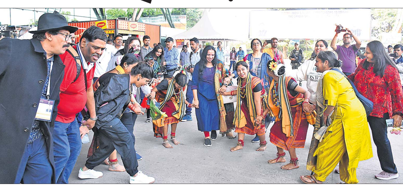
ଭୁବନେଶ୍ୱର ବିମାନବନ୍ଦରରେ ମଙ୍ଗଳବାର ପ୍ରବାସୀ ଭାରତୀୟଙ୍କୁ ସ୍ୱାଗତ କରି ସମ୍ବଳପୁରୀ ନୃତ୍ୟ ପରିବେଷଣ କରାଯାଉଛି।

ପ୍ରବାସୀ ଦେଖୁର ଓଡ଼ିଶା କଳା, ସଂସ୍କୃତି, ଐତିହ୍ୟ ଓ ପରମ୍ପରାର ଝଲକା ରାଜଧାନୀ ଭୁବନେଶ୍ୱରସ୍ଥିତ ଜନତା ମଇଦାନରେ ରୁଧିରାଠାରୁ ଆରମ୍ଭ ହେବାକୁ ଯାଉଛି ଅଷ୍ଟାଦଶ ପ୍ରବାସୀ ଭାରତୀୟ ଦିବସ। ପ୍ରଥମ ଥର ପାଇଁ ଏଭଳି ଆୟୋଜନର ସୁଯୋଗ ମିଳିଥିବାରୁ ରାଜ୍ୟ ସରକାରଙ୍କ ପକ୍ଷରୁ ସବୁ ପ୍ରସ୍ତୁତି ଶେଷ ହୋଇଛି। ଏହି ବୃହତ୍ ସମାବେଶରେ ଯୋଗଦେବା ପାଇଁ ବିଶ୍ୱର କୋଣଅନୁକୋଣରୁ ପ୍ରବାସୀ ଅତିଥିଙ୍କ ଆଗମନ ହୋଇଛି। ଏହି ୩ ଦିନିଆ ଅନ୍ତର୍ଜାତୀୟ ସମାବେଶ କରିଆରେ ଓଡ଼ିଶା ନିଜ କଳା, ସଂସ୍କୃତି ଓ ଐତିହ୍ୟର ଉତ୍କର୍ଷକୁ ବିଶ୍ୱବ୍ୟାପୀରେ ପହଞ୍ଚାଇବା ନିମନ୍ତେ 'ଅତିଥି ଦେବୋ ଭବ' ଯୋଗାନ ଦେଇ ପ୍ରବାସୀ ଭାରତୀୟ ଦିବସକୁ ଅଧିକ ଆକର୍ଷଣୀୟ ଓ ସଫଳ କରିବାରେ ଲାଗିଛି।