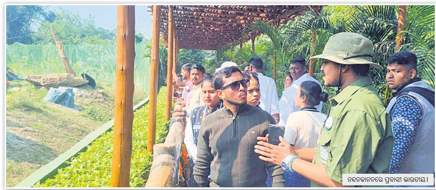
ନବନିକାନନରେ ପ୍ରବାସୀ ଭାରତୀୟ।