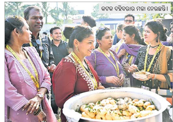
କଟକ ଦହିବରାର ମଜା ନେଉଛନ୍ତି।