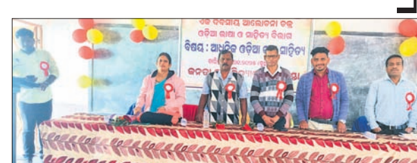
କର୍ମକ୍ରମରେ ଯୋଗଦାନ କରିଥିଲେ। ଉପସାପନା ଉଦ୍ଦେଶ୍ୟରେ ପ୍ରମୁଖ ଅତିଥି ଭାବେ ଯୋଗଦେଇ ପ୍ରମୁଖ ପୁରସ୍କାର ରାଶି ଅର୍ପଣ କରିଥିଲେ।