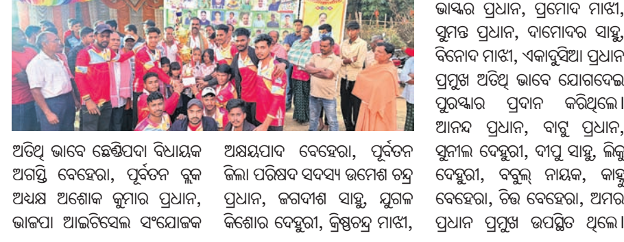
କର୍ମକ୍ରମରେ ଯୋଗଦାନ କରିଥିଲେ। ଉପସାପନା ଉଦ୍ଦେଶ୍ୟରେ ପ୍ରମୁଖ ଅତିଥି ଭାବେ ଯୋଗଦେଇ ପ୍ରମୁଖ ପୁରସ୍କାର ରାଶି ଅର୍ପଣ କରିଥିଲେ।