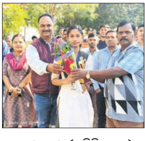
କର୍ମକ୍ରମରେ ଯୋଗଦାନ କରିଥିଲେ। ଉପସାପନା ଉଦ୍ଦେଶ୍ୟରେ ପ୍ରମୁଖ ଅତିଥି ଭାବେ ଯୋଗଦେଇ ପ୍ରମୁଖ ପୁରସ୍କାର ରାଶି ଅର୍ପଣ କରିଥିଲେ।