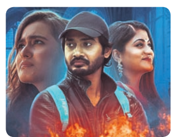
'ଅଦୃଶ୍ୟ' ଫିଲ୍ମର ଏକ ଦୃଶ୍ୟ

ସାତ ଜଣ ସମ୍ପୂର୍ଣ୍ଣ ଅପରିଚିତ ବ୍ୟକ୍ତି ଏକ ପ୍ରାୟୋଗିକ ଏକତ୍ର କରିବାରେ ବନ୍ଧୁକୋଳି କରିବା ପାଇଁ ଦାବିକାରୀ ହୋଇଛନ୍ତି। ଫେରିବା ବାଟରେ ଗାଡ଼ି ଖରାପ ହେଉଛି ଓ ସମସ୍ତେ ଗୋଟିଏ ଆଦିବାସୀ ହସ୍ତେଲରେ ରାତିକ ପାଇଁ ରହିଛନ୍ତି। ସକାଳେ ଭାଇଭଉଣୀ ଗାଡ଼ି ସଜାଡ଼ିବା ପାଇଁ ୧୫ କିଲୋମିଟର ଦୂରରେ ଥିବା ଏକ ଗାଁକୁ ନେଇ ଯାଉଛି। ଖବର ପହଞ୍ଚି ମାଉସୀମାନେ ଗାଁର ଉତ୍ତର ପାର୍ଶ୍ୱରେ ରାସ୍ତା ଅବରୋଧ କରି ଏକ ମିଳିଗାରା ଭ୍ୟାନୁ ଡାକିବାକୁ ନିର୍ଦ୍ଦେଶ ଦେଇଛନ୍ତି। ସେଠାରେ କିଛି ଦିନ ଅବକାଶିତ ସମୟରେ କେତେ ଜଣଙ୍କର ଆତତାୟୀ ଭୂମିରେ ମୃତ୍ୟୁ ହୋଇଛି। ତେବେ ଏହି ମତର ପଛରେ କି କାରଣ ରହିଛି ତାହା ସିନେମା ଦେଖିଲେ ଜାଣିପାରିବେ। ସମ୍ପେଦକ ପ୍ରୀତିପାଲ ଚାନ୍ଦରା ଏହି ନୂଆ ଓଡ଼ିଆ ସିନେମାଟି ହେଉଛି