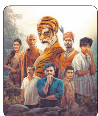
'ରଙ୍ଗଶୁର' ଫିଲ୍ମର ଏକ ଦୃଶ୍ୟ