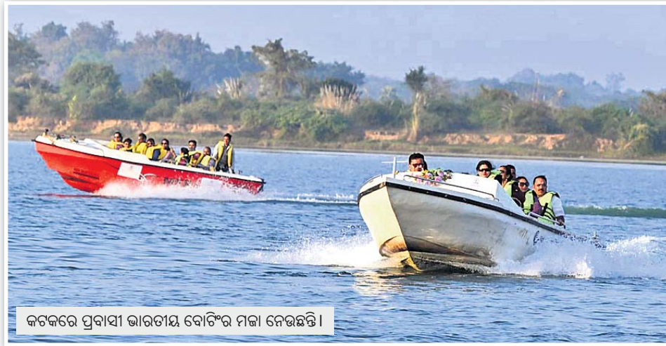
କଟକରେ ପ୍ରବାସୀ ଭାରତୀୟ ବୋଟିଂର ମଜା ନେଉଛନ୍ତି।