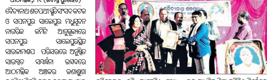
କର୍ମକ୍ରମରେ ଯୋଗଦାନ କରିଥିଲେ। ଉପସାପନା ଉଦ୍ଦେଶ୍ୟରେ ପ୍ରମୁଖ ଅତିଥି ଭାବେ ଯୋଗଦେଇ ପ୍ରମୁଖ ପୁରସ୍କାର ରାଶି ଅର୍ପଣ କରିଥିଲେ।