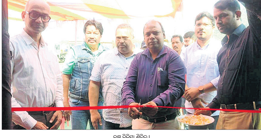
ଚନ୍ଦ୍ର ଚିକିତ୍ସା ଶିବିର।

ତେଜନାଳ, ୮୧୧ (ରତନ ନାୟକ) ତେଜନାଳ ଜିଲା ଆଞ୍ଚଳିକ ପରିବହନ ବିଭାଗ ପକ୍ଷରୁ ସଡ଼କ ସୁରକ୍ଷା ମାସ ପାଳନ ଉପଲକ୍ଷେ ରୂପବର ପୂର୍ଣ୍ଣାଙ୍କୁରେ ସହଯୋଗିତ ମହିଷାପାଟ ପଲିଗ୍ରୀ ମେଳା ପରିଆଡ଼ରେ ଏକ ବୁଲିଦିନିଆ ଚନ୍ଦ୍ର ଚିକିତ୍ସା ଶିବିର ଆୟୋଜିତ ହୋଇଯାଇଛି। ଯାନବାହାନ ଚାଳକଙ୍କର ଚନ୍ଦ୍ର ପରୀକ୍ଷା ପାଇଁ ଏହି ଶିବିର ଆୟୋଜିତ