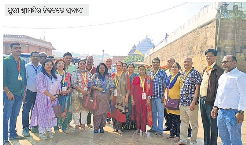
ପୁରୀ ଶ୍ରୀମନ୍ଦିର ନିକଟରେ ପ୍ରବାସୀ।