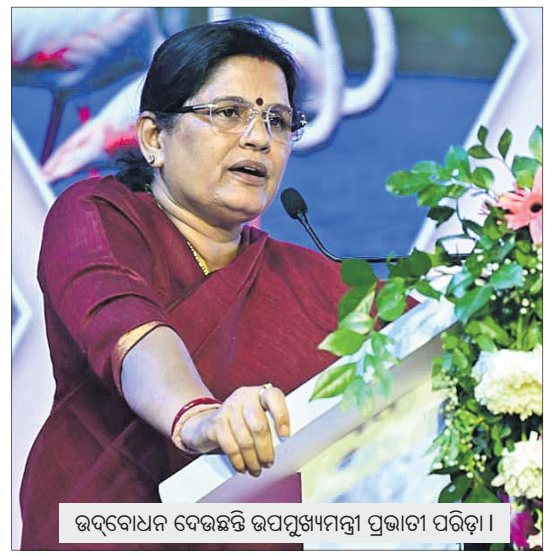
ଉଦ୍‌ବୋଧନ ଦେଉଛନ୍ତି ଉପପୁଖ୍ୟମନ୍ତ୍ରୀ ପ୍ରଭାତା ପରିଡ଼ା।