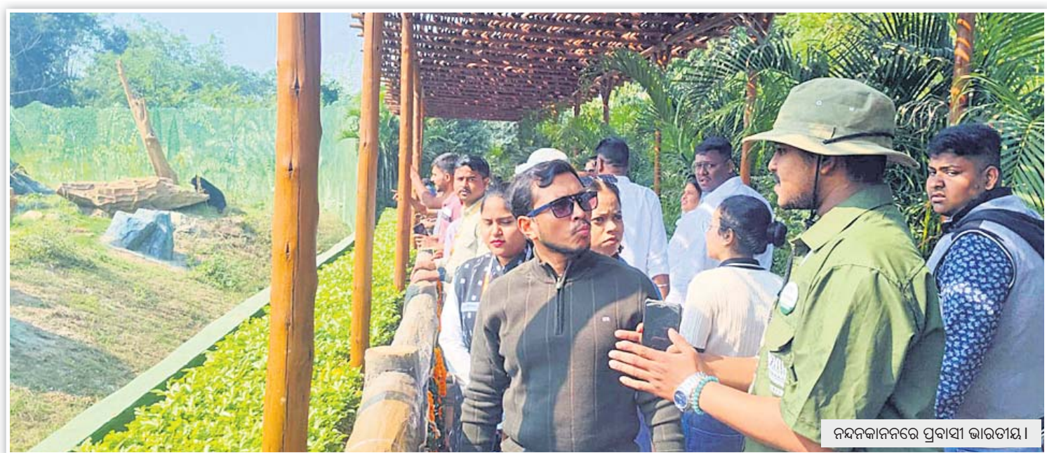
ନନ୍ଦକାନନରେ ପ୍ରବାସୀ ଭାରତୀୟ।