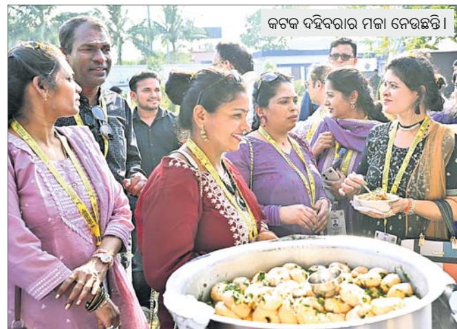
କଟକ ଦହିବରାର ମଜା ନେଉଛନ୍ତି।