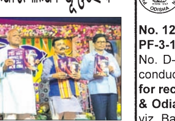
ମୁଖପତ୍ର ଉଦ୍ଘୋଷଣ କରାଯାଇଛି।

ବାସୁଦେବପୁର,୮୧(ନାରାୟଣ ପ୍ରସାଦ ବାରିକ): ବାସୁଦେବପୁର ହନୁମାନ ବାରିକା ପରିସରରେ ଥିବା ସରସ୍ୱତୀ ଶିଶୁ ବିଦ୍ୟାଳୟର ବାର୍ଷିକ ଉତ୍ସବ ମଙ୍ଗଳାକାର ଅନୁଷ୍ଠିତ ହୋଇଯାଇଛି।