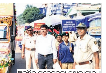
ଅନୁଷ୍ଠିତ ସଚେତନତା ଶୋଭାଯାତ୍ରା।

ଭଦ୍ରକ,୮୧(ସମାଜ ସାହାଯ୍ୟ) ଡିସ୍ଟ୍ରିକ୍ଟର ରୂପବାର ସଡ଼କ ସୁରକ୍ଷା ସଚେତନତା ଶୋଭାଯାତ୍ରା ଅନୁଷ୍ଠିତ ହୋଇଯାଇଛି।