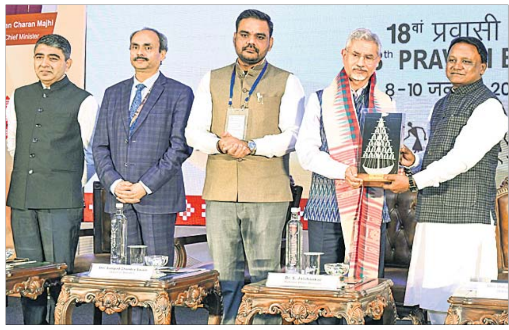
ପୁଖ୍ୟମନ୍ତ୍ରୀ ମୋହନ ଚରଣ ମାଝୀ ବହିର୍ବ୍ୟାପାର ମନ୍ତ୍ରୀ ଏସ୍. ଜୟଶଙ୍କରଙ୍କୁ ଉପହାର ଦେଉଛନ୍ତି।