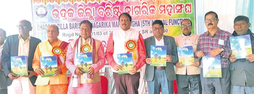
ଅତିଥିକ ଦ୍ୱାରା ମୁଖପତ୍ର ଲୋକାର୍ପଣ କରାଯାଇଛି। ଭଦ୍ରକ,୮୧(ସମାଜ ସାହାଯ୍ୟ)

ବରିଷ୍ଠ ନାଗରିକମାନେ ନିଜ ବୃତ୍ତିରୁ ଅବସର ନେଇଥିଲେ ମଧ୍ୟ ସମାଜ ପାଇଁ ସେମାନଙ୍କ ଦିଗ୍‌ଦର୍ଶନ ସବୁ ସମୟରେ ରହିଛି। ସେମାନଙ୍କର ଉପଦେଶ ସମାଜ ପାଇଁ ବହୁ ଗୁରୁତ୍ୱପୂର୍ଣ୍ଣ ବୋଲି ଭାଗବତ କଲ୍ୟାଣ ମଣ୍ଡପରେ ଭଦ୍ରକ ଜିଲା ବରିଷ୍ଠ ନାଗରିକ ମହାସଂଘର ୫ମ ବାର୍ଷିକ ସମାରୋହରେ ବକ୍ତାମାନେ ମତବ୍ୟକ୍ତ କରିଛନ୍ତି।