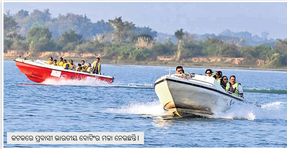
କଟକରେ ପ୍ରବାସୀ ଭାରତୀୟ ବୋଟିଂର ମଜା ନେଉଛନ୍ତି।