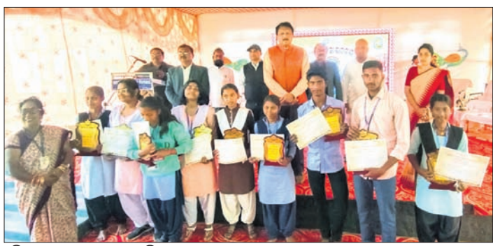
ଅତିଥିକ ଗହଣରେ କୃତା ପ୍ରତିଯୋଗୀମାନେ ଭାରତୀୟ ଦିବସର ସିଧାପ୍ରସାରଣ ଛାତ୍ରାଛାତ୍ରୀମାନଙ୍କୁ ପ୍ରଦର୍ଶିତ କରାଯାଇଥିଲା।

ପ୍ରବାସୀ ଭାରତୀୟ ଦିବସ ଭଦ୍ରକ,୮୧(ସମାଜ ସାହାଯ୍ୟ)