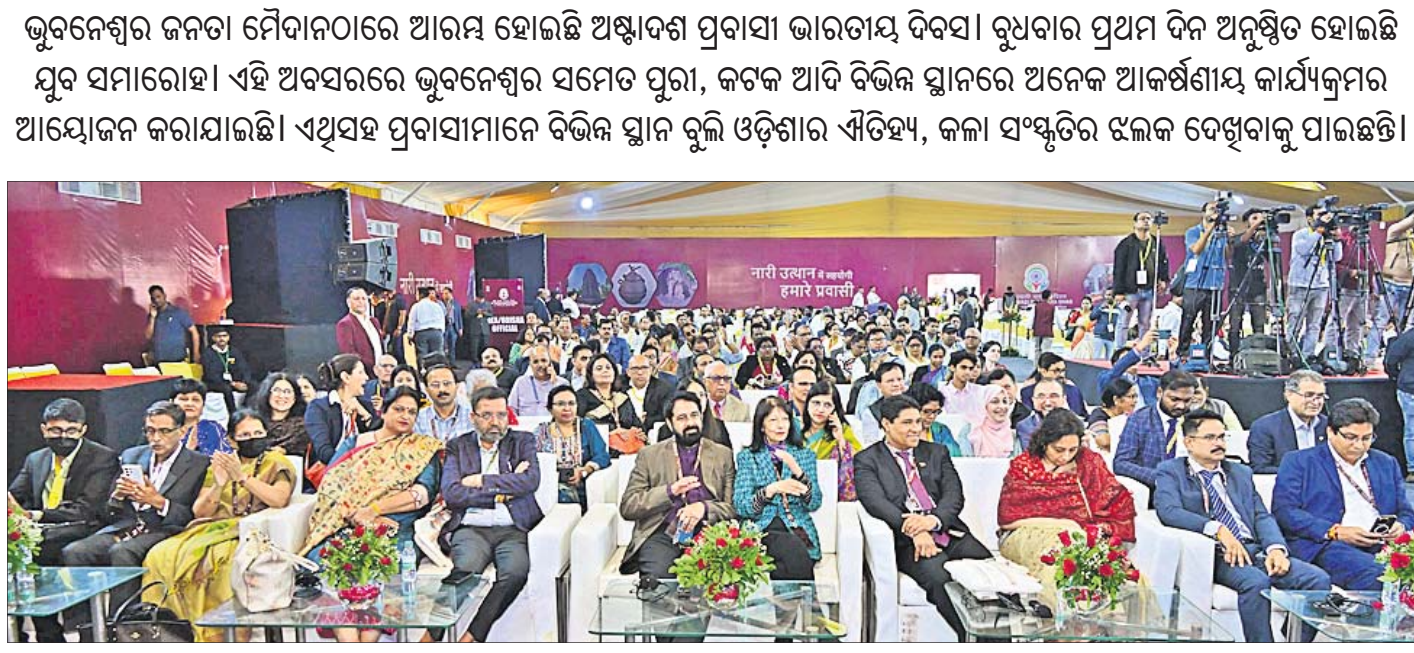
କାର୍ଯ୍ୟକ୍ରମରେ ଯୋଗଦେଉଥିବା ପ୍ରବାସୀ।