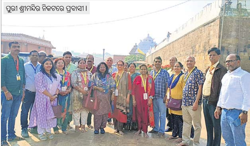
ପୁରୀ ଶ୍ରୀମନ୍ଦିର ନିକଟରେ ପ୍ରବାସୀ।