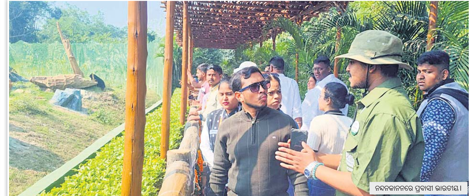
ନନ୍ଦକାନନରେ ପ୍ରବାସୀ ଭାରତୀୟ।