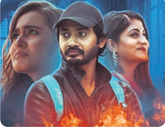
‘ଅଦୃଶ୍ୟ’ ଫିଲ୍ମର ଏକ ଦୃଶ୍ୟ

ସାତ ଜଣ ସମ୍ପୂର୍ଣ୍ଣ ଅପରିଚିତ ବ୍ୟକ୍ତି ଏକ ପ୍ରାଣକ୍ଷୟ ଏକେଡ଼ି କଥାରେ ବଣଭୋଜି କରିବା ପାଇଁ ଦାବିକାରୀ ହୋଇଛନ୍ତି। ଫେରିବା ବାଟରେ ଗାଡ଼ି ଖରାପ ହେଉଛି ଓ ସମସ୍ତେ ଗୋଟିଏ ଆଦିବାସୀ ହସ୍ତେଲରେ ରାତିକ ପାଇଁ ରହିଛନ୍ତି। ସକାଳେ ଭାଇଭଉଣୀ ଗାଡ଼ି ସଜାଡ଼ିବା ପାଇଁ ୧୫ କିଲୋମିଟର ଦୂରରେ ଥିବା ଏକ ଗାଁକୁ ନେଇ ଯାଉଛି। ଖବର ପହଞ୍ଚି ମାଉସୀମାନେ ଗାଁର ଉତ୍ତର ପାର୍ଶ୍ୱରେ ରାସ୍ତା ଅବରୋଧ କରି ଏକ ମିଳିଗାରା ଭ୍ୟାନୁ ଡାକିବାକୁ ନିର୍ଦ୍ଦେଶ ଦେଇଛନ୍ତି। ସେଠାରେ କିଛି ଦିନ ଅବକାଶିତ ସମୟରେ କେତେ ଜଣଙ୍କର ଆତତ୍ୟାଗୀ ଭୂମିରେ ମୃତ୍ୟୁ ହୋଇଛି। ତେବେ ଏହି ମତର ପଛରେ କି କାରଣ ରହିଛି ତାହା ସିନେମା ଦେଖିଲେ ଜାଣିପାରିବେ। ସମ୍ପେଦକ ପ୍ରାଣକ୍ଷୟର ଏହି ନୂଆ ଓଡ଼ିଆ ସିନେମାଟି ହେଉଛି