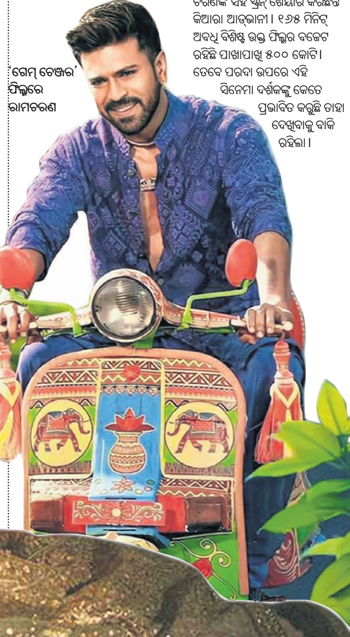
‘କୋମ୍ କୋଞ୍ଚକ’ ଫିଲ୍ମରେ ରାମଚରଣ

ଏହି ସିନେମାର କାହାଣୀ ରଚନା କରିଛନ୍ତି କାର୍ତ୍ତିକ ଶୁଭରାଜ୍। ଏହାର ମୁଖ୍ୟ ଭୂମିକାରେ ଅଭିନୟ କରିଛନ୍ତି ରାମ ଚରଣ। ଏଥିରେ ସେ ଜଣେ କର୍ତ୍ତବ୍ୟନିଷ୍ଠ ଆଇ.ଏ.ଏସ୍ ଅଫିସର ଭୂମିକାରେ ଦେଖାଦେବେ। ଦୁର୍ଗାଚିତ୍ର ଗାଳ୍ପନିକାଙ୍କ ବିରୋଧରେ ସେ ଲଢ଼େଇ କରିଛନ୍ତି ଏବଂ ତାହାର ଫଳ କ’ଣ ହେଉଛି ତାହା ସିନେମାରେ ଦେଖିବାକୁ ମିଳିବ। ଏଥିରେ ରାମ ଚରଣଙ୍କ ସହ ସ୍ତ୍ରୀ ଶେୟାର କରିଛନ୍ତି କିଆରୀ ଆଡ଼ଭାନୀ। ୧୬୫ ମିନିଟ୍ ଅବଧି ବିଶିଷ୍ଟ ଉକ୍ତ ଫିଲ୍ମର ବକେଟ୍ ରହିଛି ପାଖାପାଖି ୫୦୦ କୋଟି। ତେବେ ପରଦା ଉପରେ ଏହି ସିନେମା ଦର୍ଶକଙ୍କୁ କେତେ ପ୍ରଭାବିତ କରୁଛି ତାହା ଦେଖିବାକୁ ବାକି ରହିଲା।