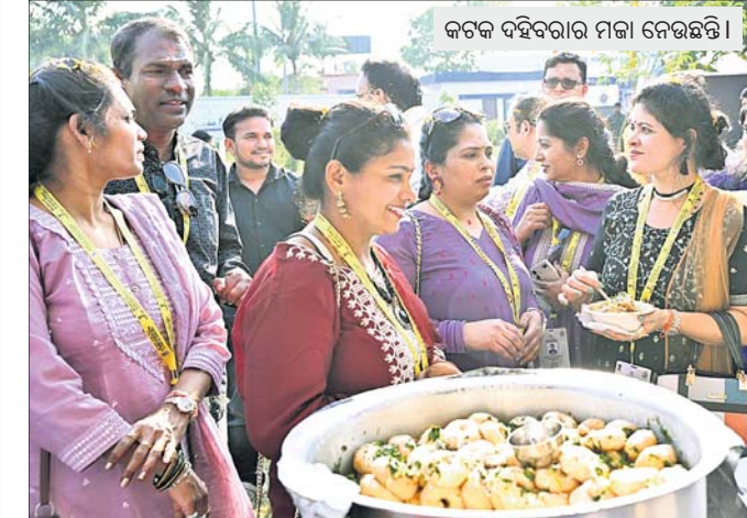
କଟକ ଦହିବରାର ମଇଳା ନେଉଛନ୍ତି।