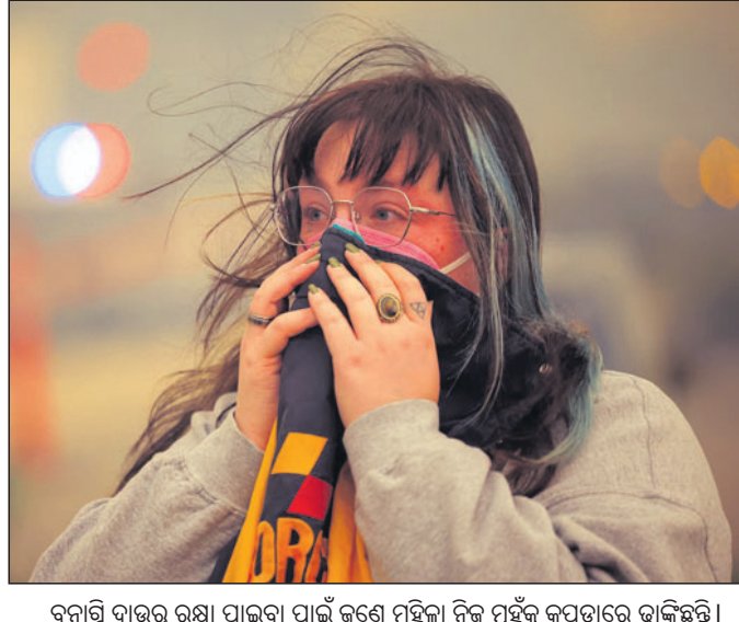
ବନାଗ୍ନି ଦାଉରୁ ରକ୍ଷା ପାଇବା ପାଇଁ ଜଣେ ମହିଳା ନିଜ ମୁହଁକୁ କପଡ଼ାରେ ଭାଙ୍ଗିଛନ୍ତି।

ସରକାରୀ ସହାୟତା ଯୋଗ୍ୟ କରିଛନ୍ତି। ବାଲଡେନ୍ ଲକ୍ଷ୍‌ଏଞ୍ଜେଲ୍‌ରୁ ଏୟାର ଫୋର୍ସ୍ ଓ ଡ୍ରାନ୍ ବିମାନରେ ଯିବା ପାଇଁ ଯୋଜନା କରିଥିଲେ। ତେବେ ବନାଗ୍ନିର ଭୟାବହତାକୁ ଦେଖି ସେ ଏଥିରୁ ଓହ୍ଲାଇଛନ୍ତି। ପ୍ରଭାବିତ ଅଞ୍ଚଳର ବାସିନ୍ଦାମାନଙ୍କୁ ସ୍ଥାନାନ୍ତର ନିର୍ଦ୍ଦେଶ ଅନୁଯାୟୀ ପାଇ ପରାମର୍ଶ ଦିଆଯାଇଛି। ଲୋକଙ୍କ ସୁରକ୍ଷା ସୁନିଶ୍ଚିତ କରିବା ପାଇଁ ଅଧିକାରୀମାନଙ୍କୁ ନିର୍ଦ୍ଦେଶ ଦିଆଯାଇଛି।