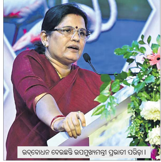
ଉଦ୍‌ବୋଧନ ଦେଉଛନ୍ତି ଉପପୁଖ୍ୟମନ୍ତ୍ରୀ ପ୍ରଭାତା ପରିଡ଼ା।