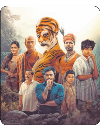
‘ରଙ୍ଗଶୁର’ ଫିଲ୍ମର ଏକ ଦୃଶ୍ୟ