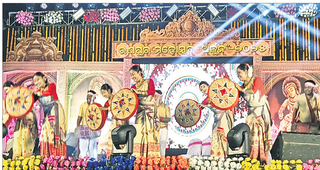
ରଣପୁର ମହୋତ୍ସବର ୪ର୍ଥ ସନ୍ଧ୍ୟାରେ କଳାକାରମାନେ ପାରମ୍ପରିକ ନୃତ୍ୟ ପ୍ରଦର୍ଶନ କରୁଛନ୍ତି ।

ଲାଭଣୀ ଓ ଖୁମୁରା ନୃତ୍ୟରେ ରଙ୍ଗିନି ହେଲା ମଞ୍ଚ