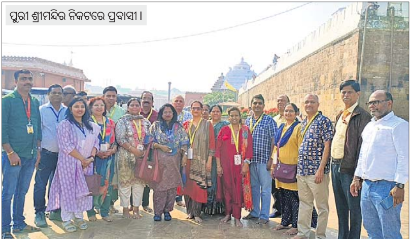
ପୁରୀ ଶ୍ରୀମନ୍ଦିର ନିକଟରେ ପ୍ରବାସୀ।