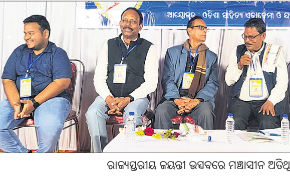
ରାଜ୍ୟସ୍ତରୀୟ ଜୟନ୍ତୀ ଉତ୍ସବରେ ମଞ୍ଚାସୀନ ଅତିଥି ।