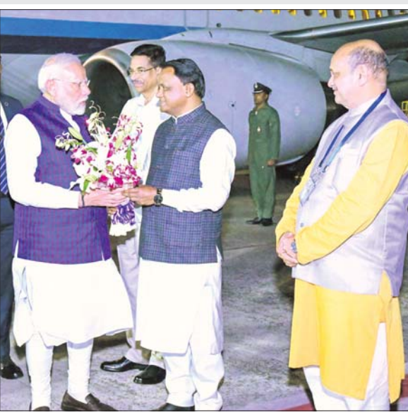
ବିମାନ ବନ୍ଦରରେ ପ୍ରଧାନମନ୍ତ୍ରୀ ନରେନ୍ଦ୍ର ମୋଦିଙ୍କୁ ସ୍ୱାଗତ କରୁଛନ୍ତି ପୁଖ୍ୟମନ୍ତ୍ରୀ ମୋହନ ଚରଣ ମାଝୀ।

ଗୁରୁବାର ପୂର୍ବାହ୍ନ ୧୦ଟାରୁ ୧୧ଟା ୩୦ ପର୍ଯ୍ୟନ୍ତ ପ୍ରଧାନମନ୍ତ୍ରୀ ଓଡ଼ିଶାରେ ଅନୁଷ୍ଠିତ ହେଉଥିବା ୧୮ତମ ପ୍ରବାସୀ ଭାରତୀୟ ସମ୍ମିଳନୀର ଉଦ୍‌ଘାଟନକରି ଉଦ୍‌ଘୋଷଣା ରଖିବେ। ପ୍ରଧାନମନ୍ତ୍ରୀଙ୍କୁ ସ୍ୱାଗତକରିବା ଲାଗି ସବୁଆଡ଼େ ରାଜ୍ୟ ସରକାରଙ୍କ ପକ୍ଷରୁ ବଡ଼ ବଡ଼ ସ୍ୱେଚ୍ଛା ଏବଂ ବ୍ୟାଜନରେ ଛାଡ଼ଣା କରାଯାଇଛି। ପ୍ରଧାନମନ୍ତ୍ରୀ ବୁଧବାର ରାଜଭବନଠାରେ ରାତ୍ରିପାଠନ କରିବେ। ଗୁରୁବାରର କାର୍ଯ୍ୟକ୍ରମ ସାରି ସ୍ୱତନ୍ତ୍ର ବିମାନ ଯୋଗେ ଦିଲ୍ଲୀ ପ୍ରତ୍ୟାବର୍ତ୍ତନ କରିବେ ବୋଲି ଜଣାପଡ଼ିଛି। ଅନ୍ୟପଟେ ପ୍ରବାସୀ ଭାରତୀୟ ସମ୍ମିଳନୀର ଉଦ୍‌ଘାଟନା ଉତ୍ସବରେ ଯୋଗଦେବା ଲାଗି ଗୁରୁବାର ରାତିରେ ରାଷ୍ଟ୍ରପତି ଡ୍ରୌପଦୀ ମୁର୍ମୁ ୨ଦିନିଆ ଓଡ଼ିଶା ଗସ୍ତରେ ଆସିବେ। ରାଷ୍ଟ୍ରପତି ଶୁକ୍ରବାର ଏହି କାର୍ଯ୍ୟକ୍ରମରେ ଯୋଗଦେଇ ରାତିରେ ଦିଲ୍ଲୀ ଫେରିଯିବେ।