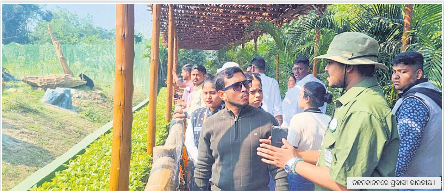
ନନ୍ଦକାନନରେ ପ୍ରବାସୀ ଭାରତୀୟ।