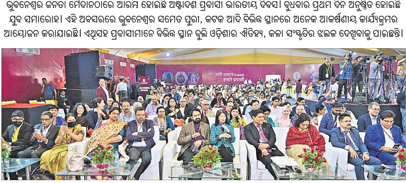
କାର୍ଯ୍ୟକ୍ରମରେ ଯୋଗଦେଉଥିବା ପ୍ରବାସୀ।