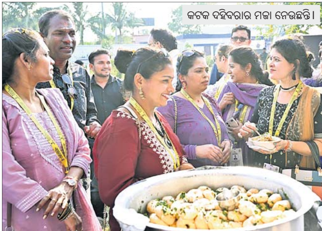
କଟକ ଦହିବରାର ମଇଳା ନେଉଛନ୍ତି।