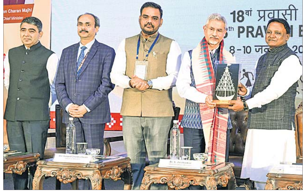
ପୁଖ୍ୟମନ୍ତ୍ରୀ ମୋହନ ଚରଣ ମାଝୀ ବହିର୍ବ୍ୟାପାର ମନ୍ତ୍ରୀ ଏସ୍. ଜୟଶଙ୍କରଙ୍କୁ ଉପହାର ଦେଉଛନ୍ତି।