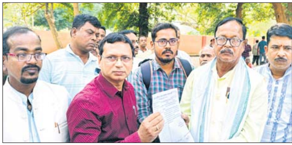
ଉପଜିଲାପାଳଙ୍କୁ ଦାବପତ୍ର ପ୍ରଦାନ କରୁଛନ୍ତି ଗାଷୀଗେଟୀ।

ବେଲଗୁଣ୍ଡା/ଭଞ୍ଜନଗର,୮୧୧(କୃଷ୍ଣ ଚନ୍ଦ୍ର ପଟ୍ଟନାୟକ/ବାଲୁକା ପ୍ରଧାନ)