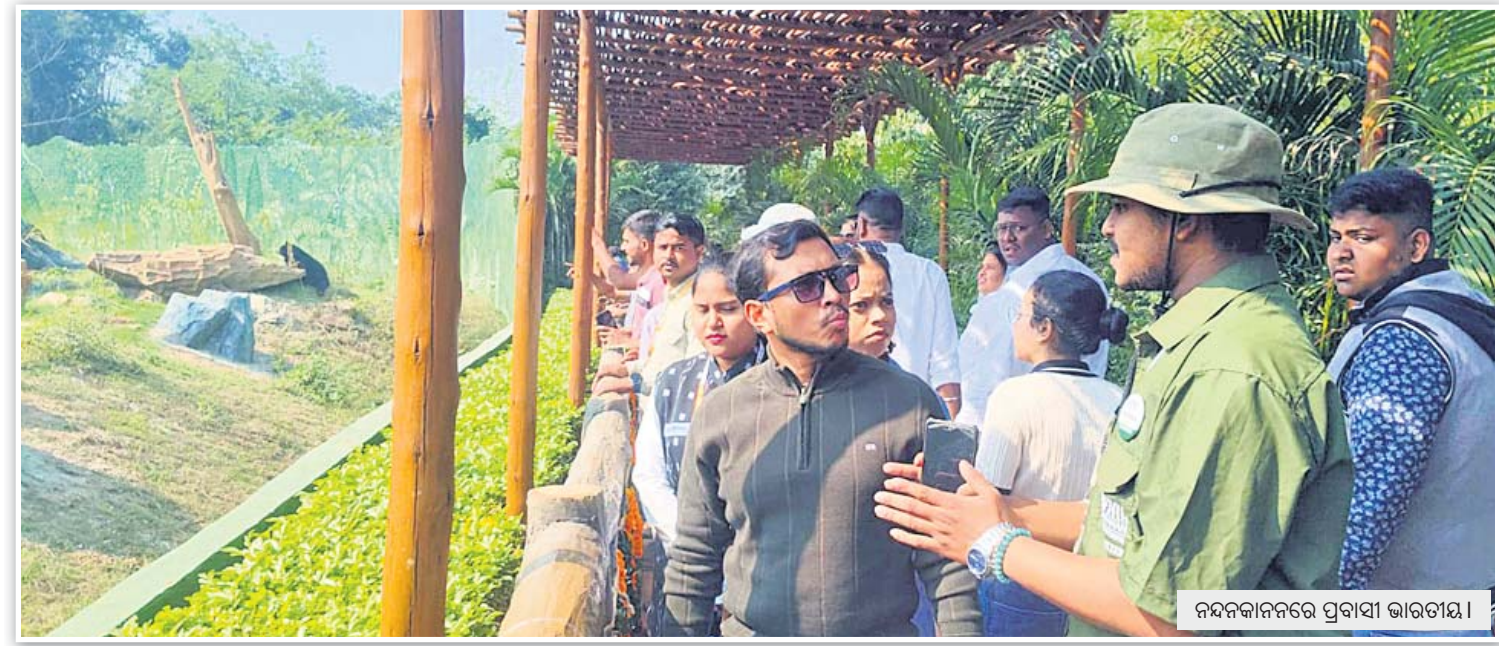
ନୟନକାନନରେ ପ୍ରବାସୀ ଭାରତୀୟ।