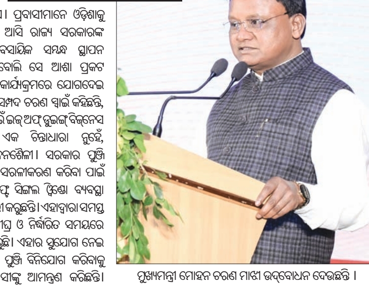
ମୁଖ୍ୟମନ୍ତ୍ରୀ ମୋଦିଙ୍କ ଚରଣ ମାଝି ଉଦ୍‌ଘୋଷଣା କରୁଛନ୍ତି।

ଅକ୍ଷୟ ଶକ୍ତି, ପେଟ୍ରୋକେମିକାଲ, ଟେକ୍ସଟାଇଲ, ପାର୍ମାଣୁକୋଇଲା ଏବଂ ବାୟୋଟେକ୍ନୋଲୋଜି ଆଦି ପାଇଁ ସ୍ୱତନ୍ତ୍ର ରୋଡମାପ ପ୍ରସ୍ତୁତ କରିଛନ୍ତି। ପର୍ଯ୍ୟଟନ କ୍ଷେତ୍ରରେ ପୁଞ୍ଜି ବିନିଯୋଗର ଏକ ପ୍ରକଳ୍ପ ମାଝି ପ୍ରସ୍ତୁତ ହୋଇଛି। 'ବହିର୍ବ୍ୟାପାର ମାଝି ଏବଂ ଜୟଶଙ୍କର କହିଛନ୍ତି, ଭାରତ ଏହାର ବୈଦେଶିକ ନୀତିରେ ୩-୮ (ଡ୍ରୋଡ, ଟେକ୍ନୋଲୋଜି ଆଞ୍ଚଳିକ)କୁ ଅଗ୍ରାଧିକାର ଦେଉଛି। ପ୍ରଗତି ଆରମ୍ଭ ଦିବସରେ ଏହାର ସୁବିନିଯୋଗ ଓଡ଼ିଶାରେ କରିପାରିବେ। ରାଜ୍ୟର ପର୍ଯ୍ୟଟନ ପ୍ରସାରଣ ସମ୍ପର୍କରେ ଉଲ୍ଲେଖ କରି ଜୟଶଙ୍କର କହିଛନ୍ତି, ପର୍ଯ୍ୟଟନ ହେଉଛି ଏକ ବଡ଼ ନିୟୁତ କ୍ଷେତ୍ର ଏବଂ ଏହା ବିଶ୍ୱରେ ବହୁଗୁଣା