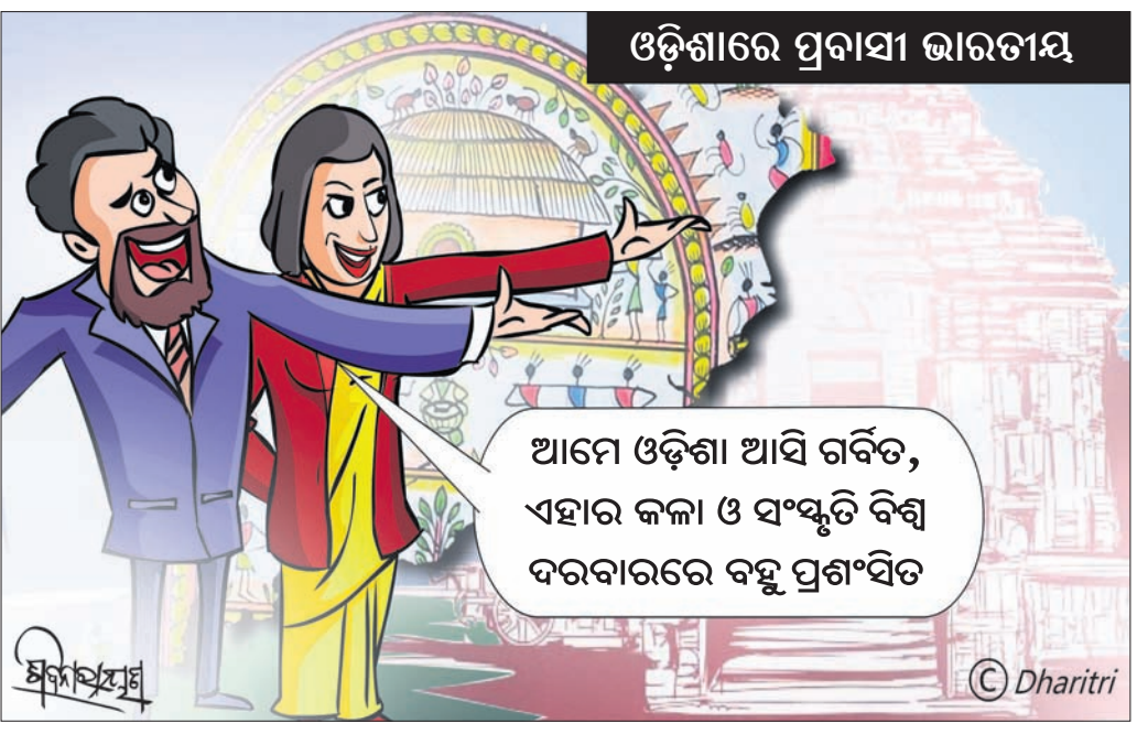
ଓଡ଼ିଶାରେ ପ୍ରଗତି ଭାରତୀୟ

ଆମେ ଓଡ଼ିଶା ଆସି ଗର୍ବିତ, ଏହାର କଳା ଓ ସଂସ୍କୃତି ବିଶ୍ୱ ଦରବାରରେ ବହୁ ପ୍ରଶଂସିତ