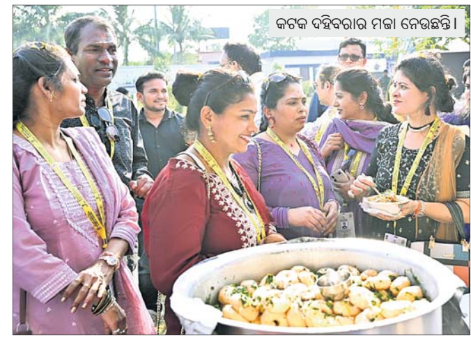
କଟକ ଦହିବରାର ମଜା ନେଉଛନ୍ତି।