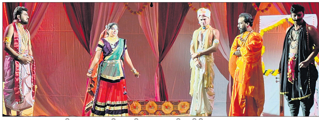
ହିନ୍ଦୀ ନାଟକ ସୁରଜ କି ଅନ୍ତମ କିରନ୍ ସେ ସୁରଜ କି ପହଲି କିରନ୍ ତକ୍ତ ଏକ ଦୃଶ୍ୟ।