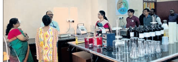
ଭୂବନେଶ୍ୱର, ୮୧ (ଅନୁରାଧା ମହାରଣା)