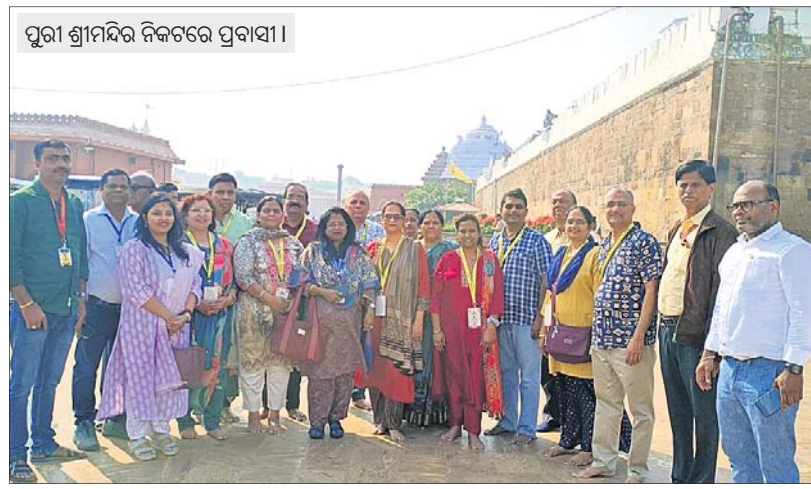
ପୁରୀ ଶ୍ରୀମନ୍ଦିର ନିକଟରେ ପ୍ରବାସୀ।