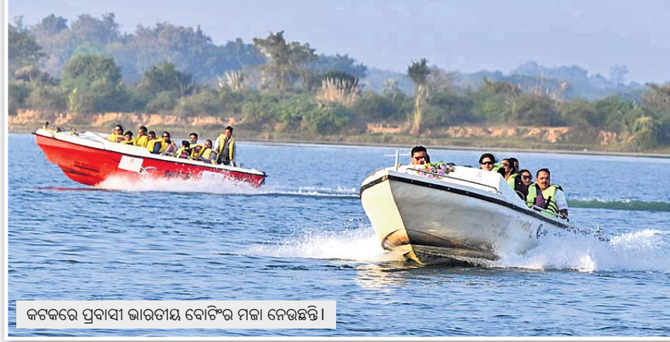
କଟକରେ ପ୍ରବାସୀ ଭାରତୀୟ ବୋଟିଂର ମଜା ନେଉଛନ୍ତି।