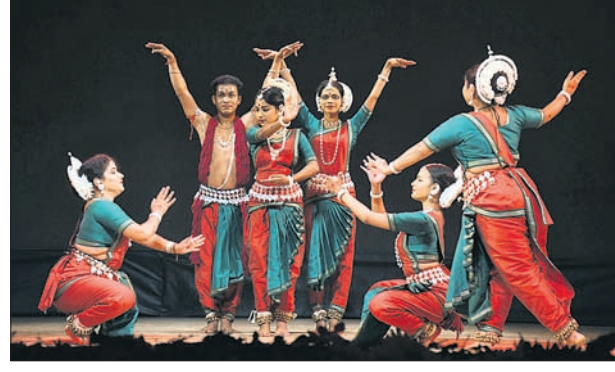
ଭୂବନେଶ୍ୱର, ୮୧ (ସୌନ୍ଦର୍ଯ୍ୟର ରାଜତ)