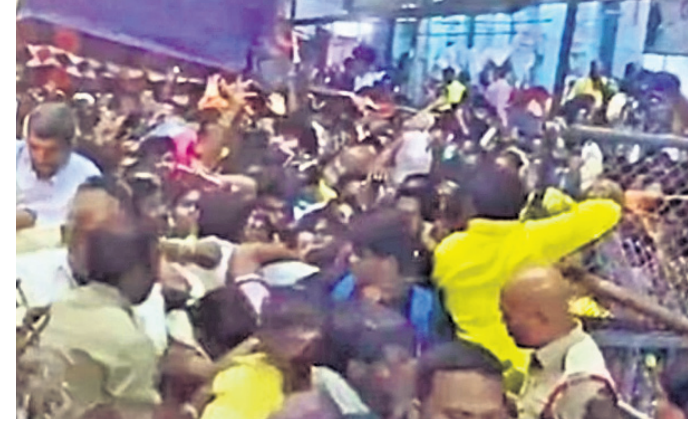
ଦଳାତକଟା ହେତୁ ମୃତ୍ୟୁ ହୋଇଥିବା ବ୍ୟକ୍ତିଙ୍କୁ ଶ୍ରଦ୍ଧାଘାଟଣା କରାଯାଇଛି।

ତିରୁପତି, ୮୧ ଶ୍ରୀକୃଷ୍ଣପୁର ଗୋବିନ୍ଦପୁର ଗ୍ରାମରେ ଦଳାତକଟା ହେତୁ ୬ ଜଣଙ୍କ ମୃତ୍ୟୁ ହୋଇଛି।