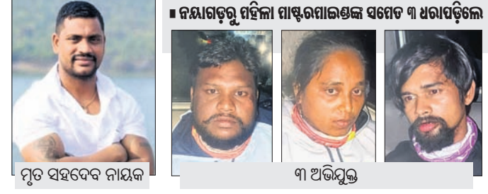
ମୃତ ସହସାଧ୍ୟକ ନାୟକ ଓ ଅଭିଯୁକ୍ତ

ରାଜଧାନୀ ବିଏମ୍ ରାସ୍ତାରେ ଜଣେ ପୂର୍ବତନ ପୋଲିସ୍ ମିତ୍ର ତଥା ବିଏମ୍ ସମ୍ପର୍କୀୟ କର୍ମଚାରୀଙ୍କୁ ହତ୍ୟା କରାଯାଇଛି।