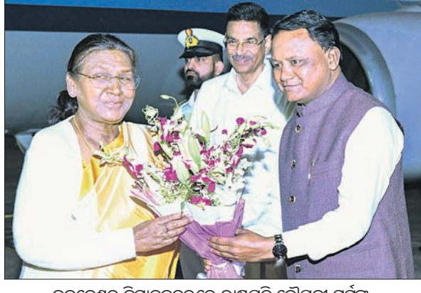
ଭୁବନେଶ୍ୱର ବିମାନବନ୍ଦରରେ ରାଷ୍ଟ୍ରପତି ଡ୍ରୌପଦୀ ମୁର୍ମୁଙ୍କୁ ସ୍ୱାଗତ କରୁଛନ୍ତି ମୁଖ୍ୟମନ୍ତ୍ରୀ ମୋହନ ଚରଣ ମାଝୀ।

ଭୁବନେଶ୍ୱର, ୯୧ (ସୁନିର୍ଦ୍ଦିଷ୍ଟ) ୧୮ତମ ପ୍ରବାସୀ ଭାରତୀୟ ଦିବସ ସମାରୋହରେ ଯୋଗଦେବାକୁ ରାଷ୍ଟ୍ରପତି ଡ୍ରୌପଦୀ ମୁର୍ମୁ ଗୁରୁବାର ସନ୍ଧ୍ୟାରେ ସ୍ୱତନ୍ତ୍ର ବିମାନ ଯୋଗେ ଭୁବନେଶ୍ୱର ବିମାନବନ୍ଦର ଠାରେ ପହଞ୍ଚିଛନ୍ତି। ବାୟୁସେନାର ଏକ ସ୍ୱତନ୍ତ୍ର ବିମାନରେ ଭୁବନେଶ୍ୱର ବିମାନ ବନ୍ଦରରେ ପହଞ୍ଚିବା ପରେ ସେ ସ୍ତ୍ରୀସମାଜ ସେଠାରୁ ରାଜଭବନ ଅଭିମୁଖେ ଯାଇଛନ୍ତି। ରାଷ୍ଟ୍ରପତି ମୁର୍ମୁଙ୍କୁ ବିମାନବନ୍ଦର ଠାରେ ରାଜ୍ୟପାଳ ହରିବନ୍ଧୁ କମ୍ବରପତି ଏବଂ ମୁଖ୍ୟମନ୍ତ୍ରୀ ମୋହନ ଚରଣ ମାଝୀ ସ୍ୱାଗତ କରିଛନ୍ତି। ରାଷ୍ଟ୍ରପତି ରାଜଭବନରେ ରାଷ୍ଟ୍ରପାଦନ କରିବେ।