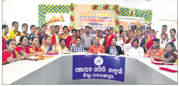
ତାଲିମ ଶିବିରରେ ଅଧିକାରୀ ଓ ଅନ୍ୟମାନେ।

ଡାକୁଗାଁ, ୯।୧ (ପ୍ରଞ୍ଜନରଞ୍ଜନ ପରିଡ଼ା) ନବରଙ୍ଗପୁର ଜିଲ୍ଲା ଡାକୁଗାଁ ବ୍ଲକ୍ ସମ୍ମିଳନୀ କକ୍ଷରେ ମହିଳା ଅନୁକୂଳ ପଞ୍ଚାୟତ ଗଠନ ନେଇ ଏକ ତାଲିମ କାର୍ଯ୍ୟକ୍ରମ ଗୁରୁବାର ଅନୁଷ୍ଠିତ ହୋଇଯାଇଛି। ଏଥିରେ ମହିଳାମାନେ ଆର୍ଥିକ, ସାମାଜିକ, ରାଜନୈତିକ, ଶିକ୍ଷା ସହ ପ୍ରତ୍ୟେକ କ୍ଷେତ୍ରରେ ଅଂଶ ଗ୍ରହଣ କରି ସମଗ୍ର ହେବା ନେଇ ଆଲୋଚନା କରାଯାଇଛି। ମହିଳା ଅନୁକୂଳ ପଞ୍ଚାୟତ ଗଠନ ନେଇ ତାଲିମ ଦିଆଯାଇଥିଲା। ପ୍ରଶିକ୍ଷକଭାବେ ଏବିଡିଓ ପଦ୍ମନାଭ ତ୍ରିପାଠୀ, ସିପି