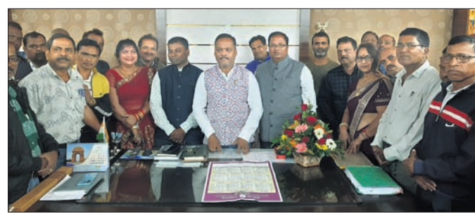
ଡିଭିଓଙ୍କ ସହ ବୃକ୍ଷା ମାଧ୍ୟମିକ ଶିକ୍ଷକ ଓ କର୍ମଚାରୀ ସଂଘ ସଦସ୍ୟମାନେ।

ନବରଙ୍ଗପୁର, ୯।୧ (ସଦାଶିବ ପ୍ରହରାଜ) ବୃକ୍ଷାମୂଳକ ଶିକ୍ଷା, ତ୍ରୁପ୍ତାଉର୍ ରୋକିବା ଦିଗରେ ଗୁରୁତ୍ୱ ଦେବାକୁ ପରାମର୍ଶ ଦେଇଥିଲେ। ଶିକ୍ଷକମାନଙ୍କ ନାୟକ ଅଧିକାରୀ ଯେପରି କ୍ଷୁଦ୍ର ନ ହେବ ସେ ଦିଗରେ ବିଭାଗ ସଚେତନ ରହିବ। ଦରମା, ବାର୍ଷିକ ଦରମା ବୃଦ୍ଧି ଉପରେ କୌଣସି ପ୍ରକାର ଭେଦ କରାଯିବ ନାହିଁ। କିନ୍ତୁ ଶିକ୍ଷକମାନେ ନିୟମିତ ବିଦ୍ୟାଳୟକୁ ଯିବା ଓ ଛାତ୍ରାଛାତ୍ରୀଙ୍କ ଭବିଷ୍ୟତ ପ୍ରତି ଦୃଷ୍ଟି ଦିଅନ୍ତୁ ବୋଲି ଡିଭିଓ କହିଥିଲେ। ବିଭିନ୍ନ ଉଚ୍ଚ ବିଦ୍ୟାଳୟରୁ ଶତଧିକ ଶିକ୍ଷୟିତ୍ରୀ ଓ ଶିକ୍ଷକ ଉପସ୍ଥିତ ଥିଲେ।