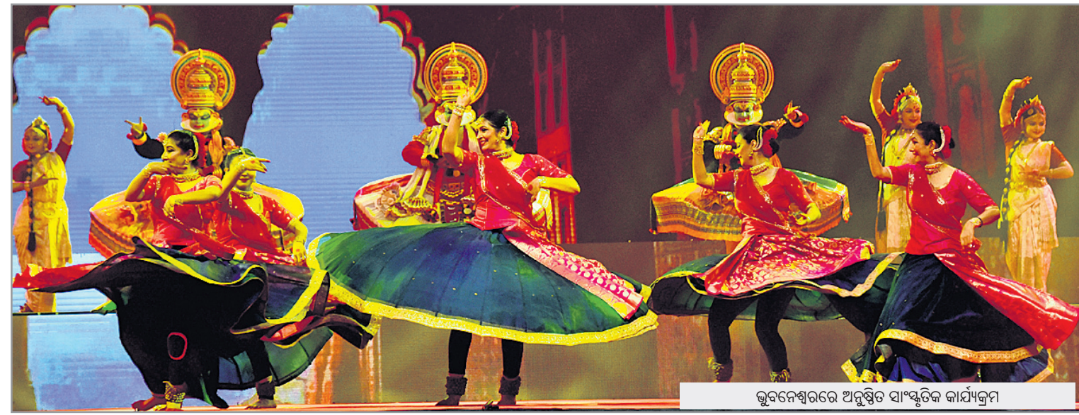
ଭୁବନେଶ୍ୱରରେ ଅନୁଷ୍ଠିତ ସାଂସ୍କୃତିକ କାର୍ଯ୍ୟକ୍ରମ