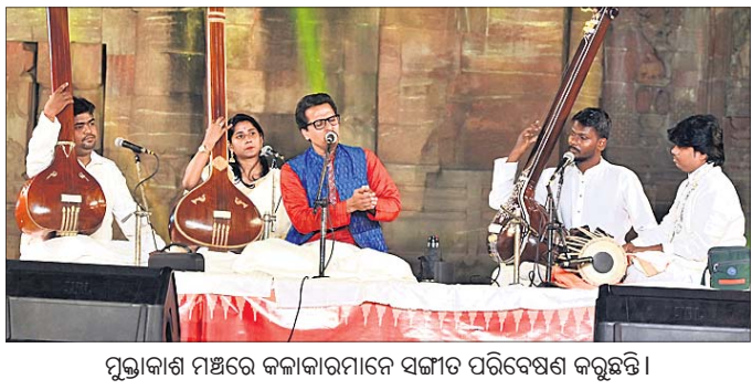
ପୁରୀକାଶ ମଞ୍ଚରେ କଳାକାରମାନେ ସଙ୍ଗୀତ ପରିବେଷଣ କରୁଛନ୍ତି।

ଭୁବନେଶ୍ୱର, ୯।୧ (ସୌମ୍ୟରଞ୍ଜନ ରାଉତ) ପ୍ରବାସୀ ଭାରତୀୟ ସମ୍ମେଳନ ଆୟୋଜନ ସରକାରଙ୍କ ପ୍ରଶଂସନୀୟ ଓ ସ୍ୱାଗତଯୋଗ୍ୟ ପଦକ୍ଷେପ। ବିଦେଶୀୟ ବ୍ୟାପାର ମନ୍ତ୍ରଣାଳୟର ଏହି କାର୍ଯ୍ୟକ୍ରମକୁ ସଫଳ କରିବା ପାଇଁ ଓଡ଼ିଶା ସରକାର ସମସ୍ତ ସହଯୋଗ ଯୋଗାଇଦେଇଛନ୍ତି।