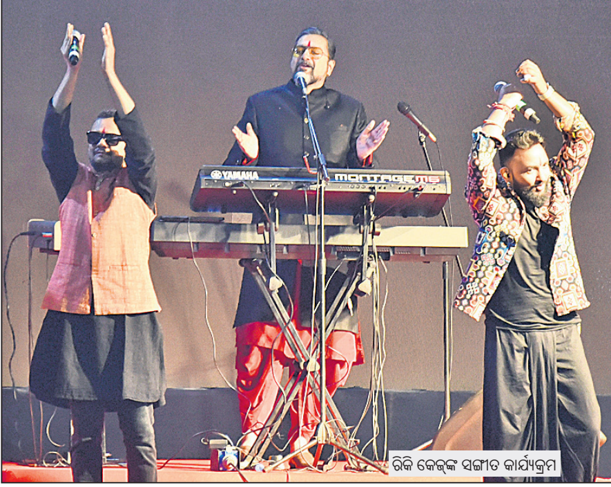
ରିକି କେକ୍ସ ସଙ୍ଗୀତ କାର୍ଯ୍ୟକ୍ରମ

ଭୁବନେଶ୍ୱର ଜନତା ମଇଦାନଠାରେ ଆରମ୍ଭ ହୋଇଛି ଅଷ୍ଟାଦଶ ପ୍ରବାସୀ ଭାରତୀୟ ଦିବସ । ଗୁରୁବାର ସମାରୋହର ହିତୀୟ ଦିବସକୁ ଆନୁଷ୍ଠାନିକ ଭାବେ ଉଦ୍ଘାଟନ କରିଛନ୍ତି ପ୍ରଧାନମନ୍ତ୍ରୀ ନରେନ୍ଦ୍ର ମୋଦି । ଏହି ଅବସରରେ ଭୁବନେଶ୍ୱର ସମେତ ରାଜ୍ୟର ବିଭିନ୍ନ ସ୍ଥାନରେ ଅନେକ ଆକର୍ଷଣୀୟ କାର୍ଯ୍ୟକ୍ରମର ଆୟୋଜନ କରାଯାଇଛି । ଏଥିସହ ପ୍ରବାସୀମାନେ ଓଡ଼ିଶାର ଐତିହ୍ୟ, କଳା ସଂସ୍କୃତିର ଝଲକ ଦେଖିବାକୁ ପାଇଛନ୍ତି ।