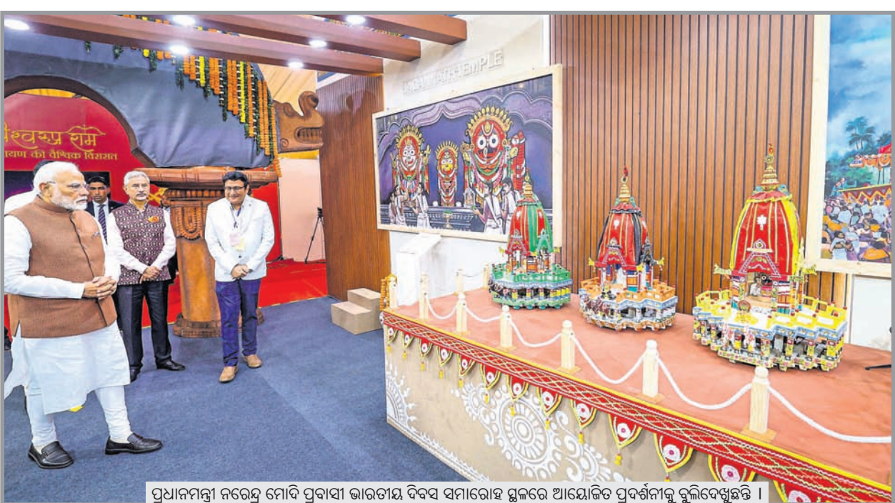
ପ୍ରଧାନମନ୍ତ୍ରୀ ନରେନ୍ଦ୍ର ମୋଦି ପ୍ରବାସୀ ଭାରତୀୟ ଦିବସ ସମାରୋହ ସ୍ଥଳରେ ଆୟୋଜିତ ପ୍ରଦର୍ଶନୀକୁ ବୁଲିବେଶୁଛନ୍ତି ।