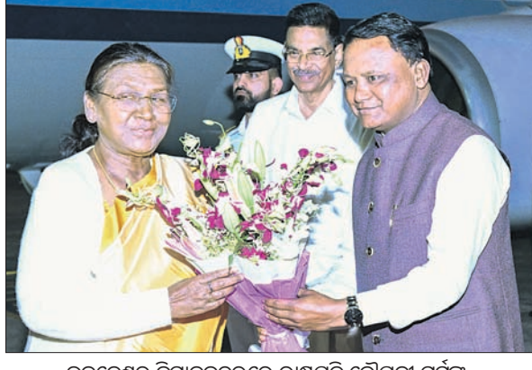
ଭୁବନେଶ୍ୱର ବିମାନବନ୍ଦରରେ ରାଷ୍ଟ୍ରପତି ଡ୍ରୌପଦୀ ମୁର୍ମୁଙ୍କୁ ସ୍ୱାଗତ କରୁଛନ୍ତି ପୁଖ୍ୟମନ୍ତ୍ରୀ ମୋହନ ଚରଣ ମାଝୀ।

ଭୁବନେଶ୍ୱର, ୯୧ (ସୁନିର୍ଦ୍ଦିଷ୍ଟ) ୧୮ତମ ପ୍ରବାସୀ ଭାରତୀୟ ଦିବସ ସମାରୋହରେ ଯୋଗଦେବାକୁ ରାଷ୍ଟ୍ରପତି ଡ୍ରୌପଦୀ ମୁର୍ମୁ ଗୁରୁବାର ସନ୍ଧ୍ୟାରେ ସ୍ୱତନ୍ତ୍ର ବିମାନ ଯୋଗେ ଭୁବନେଶ୍ୱର ବିମାନବନ୍ଦର ଠାରେ ପହଞ୍ଚିଛନ୍ତି। ବାୟୁସେନାର ଏକ ସ୍ୱତନ୍ତ୍ର ବିମାନରେ ଭୁବନେଶ୍ୱର ବିମାନ ବନ୍ଦରରେ ପହଞ୍ଚିବା ପରେ ସେ ସ୍ତ୍ରୀସମାଜ ସେଠାରୁ ରାଜଭବନ ଅଭିମୁଖେ ଯାଇଛନ୍ତି। ରାଷ୍ଟ୍ରପତି ମୁର୍ମୁଙ୍କୁ ବିମାନବନ୍ଦର ଠାରେ ରାଜ୍ୟପାଳ ହରିବନ୍ଧୁ କମ୍ବମ୍ପତି ଏବଂ ପୁଖ୍ୟମନ୍ତ୍ରୀ ମୋହନ ଚରଣ ମାଝୀ ସ୍ୱାଗତ କରିଛନ୍ତି। ରାଷ୍ଟ୍ରପତି ରାଜଭବନରେ ରାଷ୍ଟ୍ରପାଠନ କରିବେ।