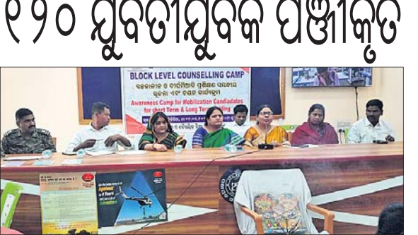
ବ୍ଲକ୍ ଲେଭେଲ କାଉନ୍ସେଲିଂ କ୍ୟାମ୍ପରେ ଉପସ୍ଥିତ ଅଧିକାରୀମାନେ।

ଚିରିଆ, ୯୧ (କାମର ଶା): ଚିରିଆ ରୁକ୍ମିଣୀଙ୍କୁ ଉନ୍ନତ ସାମାଜିକ ସ୍ଥିତିରେ ଆରମ୍ଭ କରି ହାତରେ ଧରି ପତ୍ରକୁ ଉଦ୍ଧାରଣରେ ପରିଣତ କରିବା ପାଇଁ ଭିତ୍ତି ପରିଚାଳିତ ହୋଇଥିଲା।