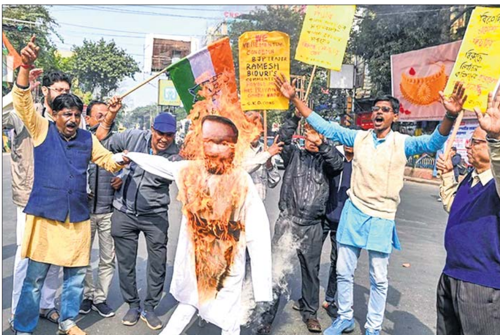
କଂଗ୍ରେସ ଏମ୍ପି ପ୍ରିୟଙ୍କା ଗାନ୍ଧୀ ଉତ୍ସାହୀ ଭାବରେ ଭାଜପା ନେତା ରମେଶ ବିଧୁରି ଦେଇଥିବା ବିବାଦୀୟ ମନ୍ତବ୍ୟ ପ୍ରତିବାଦରେ କୋଲକାତାରେ କଂଗ୍ରେସ କର୍ମକର୍ମୀମାନେ ଗୁରୁବାର ପ୍ରତିବାଦ କରୁଛନ୍ତି ।