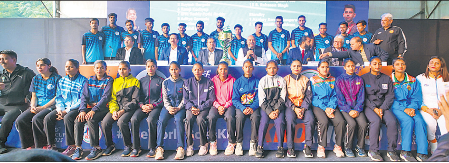
ଖୋ ଖୋ ବିଶ୍ୱକପ୍ ପାଇଁ ମନୋନୀତ ଭାରତୀୟ ମହିଳା ଓ ପୁରୁଷ ଦଳ କର୍ମକର୍ତ୍ତାଙ୍କ ଗହଣରେ ।