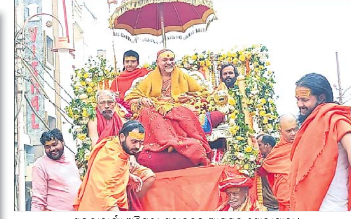
ଶଙ୍କରାଚାର୍ଯ୍ୟ ଅବିମୁକ୍ତଶ୍ୱରାନନ୍ଦଙ୍କ ଆଗମନ ଶୋଭାଯାତ୍ରା।

ଭୁବନେଶ୍ୱର, ୯।୧ (ସୌମ୍ୟରଞ୍ଜନ ରାଉତ) ପ୍ରବାସୀ ଭାରତୀୟ ସମ୍ମେଳନ ଆୟୋଜନ ସରକାରଙ୍କ ପ୍ରଶଂସନୀୟ ଓ ସ୍ୱାଗତଯୋଗ୍ୟ ପଦକ୍ଷେପ। ବିଦେଶୀୟ ବ୍ୟାପାର ମନ୍ତ୍ରଣାଳୟର ଏହି କାର୍ଯ୍ୟକ୍ରମକୁ ସଫଳ କରିବା ପାଇଁ ଓଡ଼ିଶା ସରକାର ସମସ୍ତ ସହଯୋଗ ଯୋଗାଇଦେଇଛନ୍ତି।