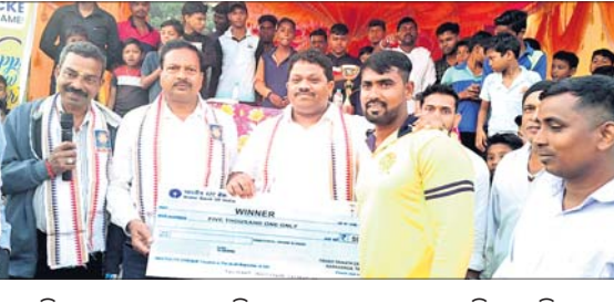
କ୍ରିକେଟ ଚୁର୍ଣ୍ଣାମେଣ୍ଟରେ ଚମତ୍କାର ଅନ୍ତର୍ଗତ ନରଗାଙ୍ଗ ପଞ୍ଚାୟତର ବାର୍ଷିକ କ୍ରିକେଟ ଚୁର୍ଣ୍ଣାମେଣ୍ଟ ଅନୁଷ୍ଠିତ ହୋଇଯାଇଛି। ପ୍ରାୟ ୧୫୦ ଖେଳାଳିଙ୍କୁ ଉପସ୍ଥିତ କରିବାକୁ ସମର୍ଥନ ଦେଇଥିଲେ।

ବାଙ୍କୀ, ୯ (ଶୁଭେନ୍ଦୁ ମହାପାତ୍ର): ଚମତ୍କାର ଅନ୍ତର୍ଗତ ନରଗାଙ୍ଗ ପଞ୍ଚାୟତରେ ବାର୍ଷିକ କ୍ରିକେଟ ଚୁର୍ଣ୍ଣାମେଣ୍ଟ ଅନୁଷ୍ଠିତ ହୋଇଯାଇଛି। ପ୍ରାୟ ୧୫୦ ଖେଳାଳିଙ୍କୁ ଉପସ୍ଥିତ କରିବାକୁ ସମର୍ଥନ ଦେଇଥିଲେ।