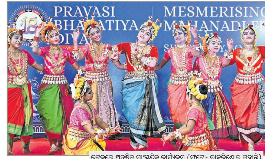
କଟକରେ ଅନୁଷ୍ଠିତ ସାଂସ୍କୃତିକ କାର୍ଯ୍ୟକ୍ରମ

ପରିବେଶ ପାଇଁ ଟେକ୍ନୋଲୋଜି ବ୍ୟବହାର ଜରୁରୀ ସମଗ୍ର ବିଶ୍ୱ ପାଇଁ ପରିବେଶ ଚିନ୍ତାର କାରଣ ହୋଇଛି । ଏହାକୁ ନେଇ ବିଭିନ୍ନ ଦେଶରେ କାର୍ଯ୍ୟ ଚାଲିଛି । ଜଣେ କମ୍ପ୍ୟୁଟର ଇଞ୍ଜିନିୟର ଭାବେ ଦୀର୍ଘ ୨୫ ବର୍ଷ ହେବ ବୋହାରେ କାର୍ଯ୍ୟରତ ଅଛି । ନିର୍ଦ୍ଦିଶ ସମୟରେ ପରିବେଶକୁ କପରି ପୁସ୍ତ ରଖିବା ଲାଗି ବୈଷୟିକ ଜ୍ଞାନକୌଶଳକୁ ଉପଯୋଗ କରାଯାଇ ପାରିବ, ସୁଯୋଗ ମିଳିଲେ ଓଡ଼ିଶାରେ ମଧ୍ୟ ଟେକ୍ନୋଲୋଜିର ବ୍ୟବହାର କରାଯାଇପାରିବ । ସେହିପରି ଆମେ ବୈଷୟିକ ସହାୟତା ଯୋଗାଇ ଦେଇପାରିବୁ ।