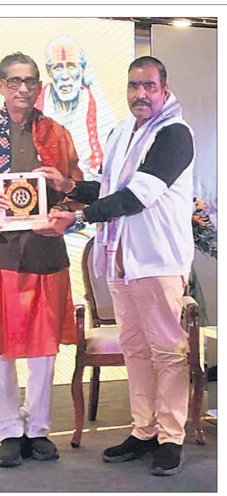
ସୋ ଆମ୍ ଭାସ୍କର ପାଠକେଶ୍ୱର ପକ୍ଷରୁ ଭୁବନେଶ୍ୱରର ବକ୍ସି ହୋଇଥିବା ମାନବି ପାଠକେଶ୍ୱରଙ୍କୁ ସମ୍ମାନିତ କରାଯାଇଛି। ଏହି ଅବସରରେ ପୁରୀ ମାଳତୀ ପାଠକେଶ୍ୱର ଅଣ୍ଡର ଖର୍ଚ୍ଚ ଶ୍ରୀ ଶ୍ରୀ ପାର୍ବତୀ ପୁଣ୍ୟ ପ୍ରଣାମନିକ ଅଧିକାରୀ ବିଭିନ୍ନ ଶଙ୍କର ରଥ ସମ୍ମାନ ପ୍ରଦାନ କରୁଛନ୍ତି।