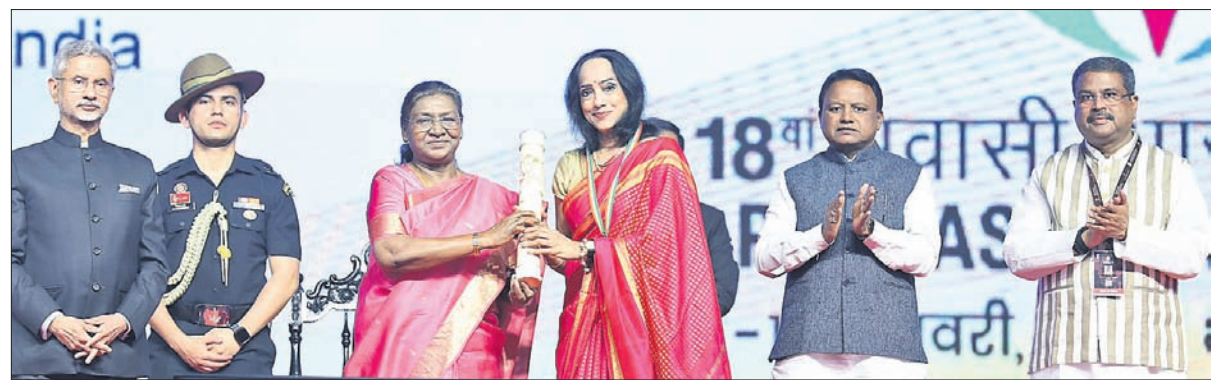
ଜଣେ ପ୍ରବାସୀ ଭାରତୀୟଙ୍କୁ ସମ୍ମାନିତ କରୁଥିବା ରାଷ୍ଟ୍ରପତି ଡ୍ରୌପଦୀ ମୁର୍ମୁ, ନିକଟରେ ଅଛନ୍ତି ମୁଖ୍ୟମନ୍ତ୍ରୀ ମୋହନ ଚରଣ ମାଝୀ, ବହିର୍ବ୍ୟାପାର ମନ୍ତ୍ରୀ ଏସ୍. ଜୟଶଙ୍କର, କେନ୍ଦ୍ର ଶିକ୍ଷାମନ୍ତ୍ରୀ ଧର୍ମେନ୍ଦ୍ର ପ୍ରଧାନ।

ଭୁବନେଶ୍ୱରରେ ୩ ଦିନ ଧରି ଚାଲିଥିବା ପ୍ରବାସୀ ଭାରତୀୟ ସମ୍ମିଳନୀ ଶୁକ୍ରବାର ଉଦ୍‌ଘାଟିତ ହୋଇଛି। ଶେଷ ଦିନରେ ରାଷ୍ଟ୍ରପତି ଡ୍ରୌପଦୀ ମୁର୍ମୁ ପ୍ରବାସୀମାନଙ୍କୁ ସମ୍ବୋଧିତ କରି କହିଛନ୍ତି, ୨୦୪୭ରେ ଭାରତକୁ ବିକଶିତ କରିବା ଲକ୍ଷ୍ୟ ରହିଥିବାରୁ ସେମାନେ ଏହି ବିକାଶଧାରାରେ ସହଯୋଗୀ ପାଲଟନ୍ତୁ। ବହିର୍ବ୍ୟାପାର ମନ୍ତ୍ରୀ ଏସ୍. ଜୟଶଙ୍କର ଓ ରାଜ୍ୟ ସରକାରଙ୍କ ମିଳିତ ଆନୁକୁଲ୍ୟରେ ଅନୁଷ୍ଠିତ ଭବ୍ୟ ସମାରୋହରେ ୨୭ ପ୍ରବାସୀଙ୍କୁ ସମ୍ମାନିତ କରାଯାଇଛି। ଏହି ଅବସରରେ ମୁଖ୍ୟମନ୍ତ୍ରୀ ମୋହନ ଚରଣ ମାଝୀ ୭୦ ଦେଶକୁ ଆସିଥିବା ପ୍ରବାସୀ ଭାରତୀୟଙ୍କୁ ଧନ୍ୟବାଦ ଦେବା ସହ ସମ୍ମିଳନୀ ଆୟୋଜନ ଦ୍ୱାରା ଓଡ଼ିଆ ଅସ୍ପୃତା ଉଚ୍ଚତର ହୋଇପାରିଥିବା କହିଛନ୍ତି।