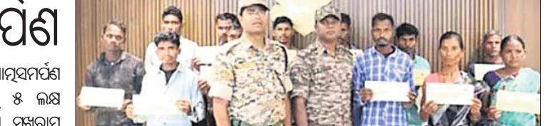
ପୋଲିସ୍ ବିଭାଗରେ କୋର୍ଟ ପ୍ରତିଷ୍ଠା ଓ ଗୁଳିରେ ଆକ୍ରମଣରେ ବନ୍ଦୁ ମାଓବାଦୀଙ୍କ ମୃତ୍ୟୁ ଘଟଣା ସମ୍ବନ୍ଧରେ ମାଓବାଦୀଙ୍କ ଯୋଗୁଁ ଲୋକସେବା କାର୍ଯ୍ୟ ହେଉ ନ ଥିବା ବେଳେ ପୋଲିସ୍ ଓ ପ୍ରଶାସନ ଛତିଶଗଡ଼ରେ ବିଭିନ୍ନ ଉନ୍ନୟନକାରୀ କାର୍ଯ୍ୟ କାରି ରହିଛନ୍ତି।

ମାଲକାନଗିରି, ୧୦୧୧ (ଦୁର୍ଦ୍ଦାୟାଧନ ପାତ୍ର) ଛତିଶଗଡ଼ ବିଜାପୁର ଜିଲ୍ଲା ପୋଲିସ୍ ନିକଟରେ ୧୩ ମାଓବାଦୀ ଶୁକ୍ରବାର ଆତ୍ମସମର୍ପଣ କରିଛନ୍ତି।