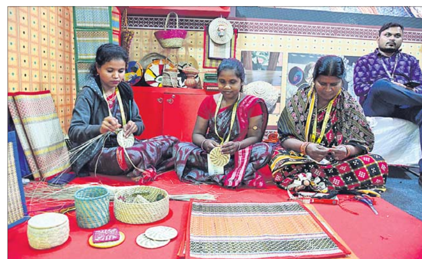
ସବୁର ବାବଦ ଅଭୟ ସପୋରିକ ବିଶେଷ କାର୍ଯ୍ୟକ୍ରମ ।