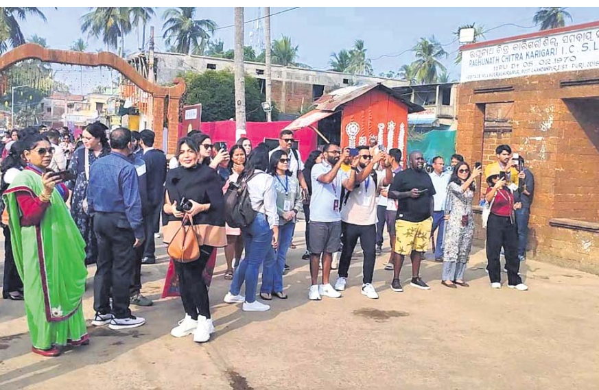
ପ୍ରବାସୀ ଭାରତୀୟମାନେ ଏତହସ୍ୟ କଳାକୃତି ଗ୍ରାମ ରତ୍ନୁରାଜପୁର ବୁଲି ଦେଖୁଛନ୍ତି।

ଭୁବନେଶ୍ୱରରେ ୩ଦିନ ଧରି ଚାଲିଥିବା ୧୮ଟି ପ୍ରବାସୀ ଭାରତୀୟ ସମ୍ମିଳନୀ ଶୁକ୍ରବାର ଶେଷ ହୋଇଛି। ଶେଷଦିନରେ ୮୦ ଜଣ ପ୍ରବାସୀ ଭାରତୀୟ ଓ ସହଯୋଗୀ ସଦସ୍ୟ ବିଭିନ୍ନ ସ୍ଥାନ ବୁଲିବା ସହ କଳା, ସ୍ଥାପତ୍ୟ, ସଂସ୍କୃତି ଦେଖି ବିମୋହିତ ହୋଇଛନ୍ତି।