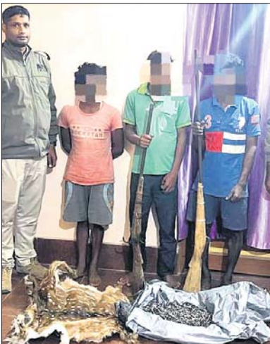
ଜବତ ସାମଗ୍ରୀ ସହ ଗିରଫ ଶିକାରୀ ।

ବାଲେଶ୍ୱର ଜିଲ୍ଲା ନାଳଗିରି ବ୍ଲକ ଅଧୀନ କୁଳଡ଼ିଆ ଅଭୟାରଣ୍ୟକୁ ଶିକାରୀମାନେ କରିବା ଉଦ୍ଦେଶ୍ୟରେ ବନ କର୍ମଚାରୀ ସହକର୍ମକ ଗାଁରେ ଚଢ଼ାଉ କରିବାକୁ ଶିକାରୀଙ୍କୁ ଗିରଫ କରିଛନ୍ତି।